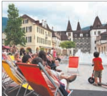
A Sierre, il n'y a pas encore de sable fin au cœur de la ville. Mais l'ambiance est estivale. REMO