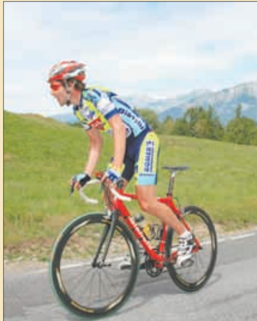
Le parcours réservé aux licenciés s'étendra dimanche sur 70 km. Celui pour les populaires se limitera à une distance de 42 km.