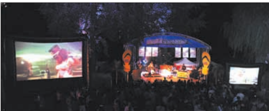
4000 personnes ont assisté, fin juin, au festival du Week-end au bord de l'eau sur les rives du lac de Géronde. Des arts visuels et de la musique groove pour une atmosphère décontractée.