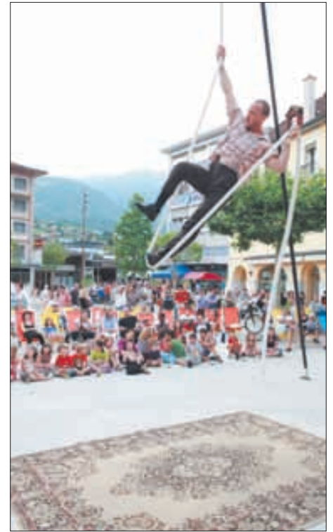
Il n'y avait pas que de la musique à Couleur Pavé. Les funambules de Circopitanga Circopitanga ont assuré un spectacle de haute voltige. REMO