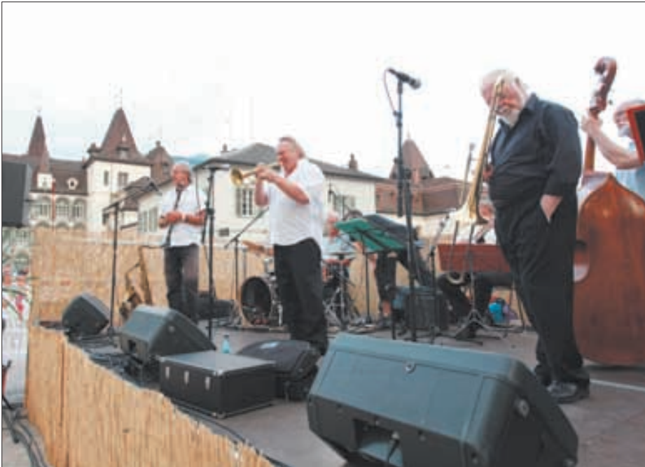
La première édition de Couleur Pavé a contenté le public, nombreux, présent sur la place de l'Hôtel-de-Ville de Sierre. Le festival remplace l'Eté Sierrois, qui se tenait au Château Mercier. Les jazzmen du Rhône River Band ont mis l'ambiance. REMO