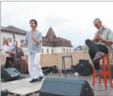
Le duo Improviste et Claquette a eu l'honneur d'ouvrir Couleur Pavé. Le festival se déroulera tout le mois de juillet. REMO