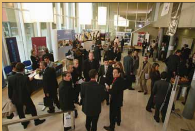
Le Forum des étudiants, qui se tiendra à la HES-SO de Sierre, un bon moyen pour les jeunes de se pencher sur leur avenir professionnel.

L'association Véranda propose un événement «Voyage et découverte de l'élément eau» le samedi