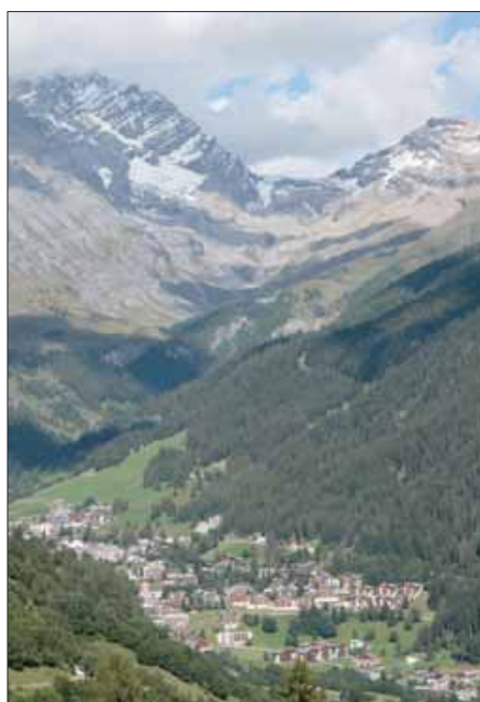
PHOTO DE LOÈCHE-LES-BAINS MISE À DISPOSITION PAR LA COMMUNE DE LOÈCHE-LES-BAINS

Découvrez la commune de Loèche-les-Bains – vous obtiendrez de plus amples renseignements sur cette station thermale sous www.leukerbad.ch , et sur la commune municipale sous www.leukerbad.org .