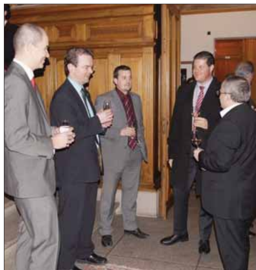
Les membres de l'Association suisse des cadres se sont retrouvés au Château Mercier, à Sierre, pour échanger et réseauter.