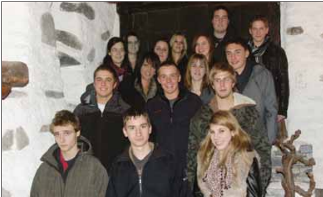
Une partie de la classe 1992 de Chalais pose pour la postérité et «le jds».