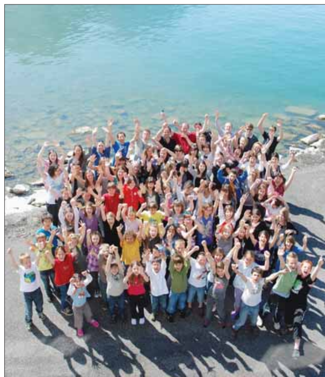
Le chœur GénérationS participera à la première rencontre des Soirées 4 saisons, le 4 novembre à Sierre. Il échangera avec la communauté maghrébine.

Avant de se lancer dans cette aventure originale, le groupe de travail a tâté le terrain auprès des clubs sportifs et des sociétés culturelles sierroises, leur détaillant l'idée générale des soirées. Une quinzaine d'associations ont manifesté leur intérêt à participer au projet, de même que plusieurs communautés étrangères. Banco! Les soirées 4 saisons étaient motivant pour nous. Cela montre