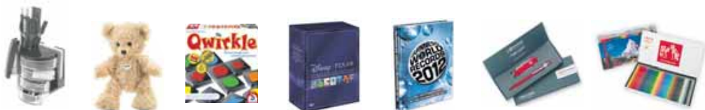
Cartes de collection de points remplies valables dans toutes les filiales dès le 1 er octobre 2011 et jusqu'au 31 janvier 2012 .

Notre offre pour chaque carte de collection de points royaux remplie: 70% de réduction sur des prix de choix.