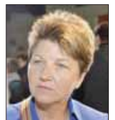
Viola Amherd (CVP0).