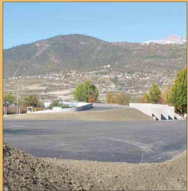
La déchetterie des Etreys, à Grône, sera ouverte le 5 novembre. LE JDS

La crèche-UAPE Croc' Soleil à Chermignon (située dans le bâtiment des Martelles) organise une exposition ce vendredi 28 octobre autour du thème «Youp' là bouge» de 17 h 30 à 20 h. Croc' Soleil a adhéré au projet des crèches en mouvement et en fait profiter les enfants qu'elle accueille dans ses murs. Les buts sont de favoriser et promouvoir la mobilité des enfants entre 2 et 4 ans au sein des crèches et de mener une réflexion en