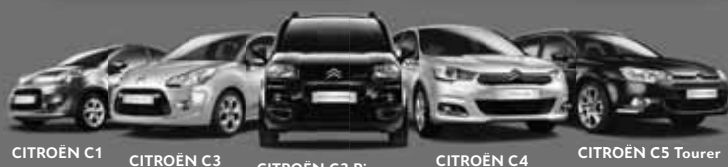
CITROËN C1 CITROËN C3 CITROËN C3 Picasso CITROËN C4 CITROËN C5 Tourer