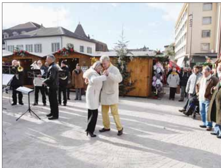
Le marché de Noël aura lieu du 14 au 24 décembre à Sierre. REMO

Dans l'absolu, les organisateurs auraient carrément souhaité quitter la place de l'Hôtel-de-Ville. Ils ont reçu une fin de non-recevoir de la commune, propriétaire des chalets, et dont le désir est d'animer cette fameuse place. «A terme, si les finances le permettent, on désire étendre le marché jusqu'à la