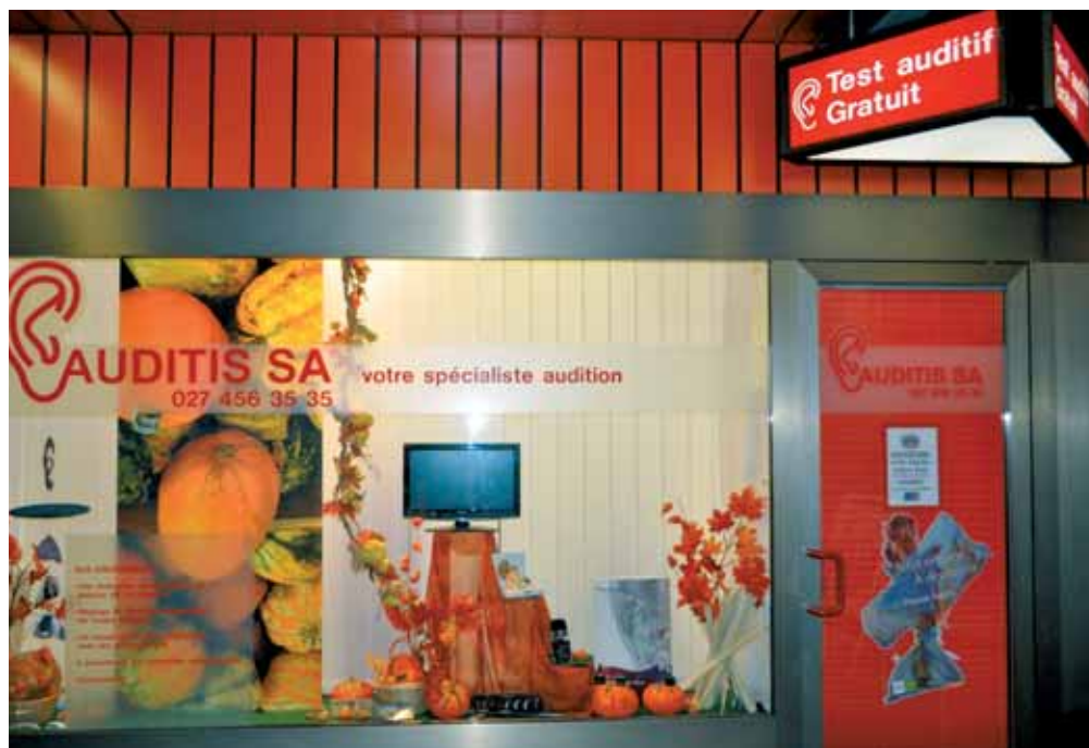
La vitrine Auditis SA à Sierre.

En plus de sa discrétion, Intiga œuvre à répondre point par point à toutes les attentes auditives spécifiques d'un premier appareillage. La technologie qu'il renferme vise à restituer de la manière la plus naturelle possible la voix humaine. Imiter la nature nécessite une technologie très aboutie et Oticon a mis dans Intiga, le meilleur de son savoir-faire technologique. Cette sonorité naturelle contribue d'autre part à fournir à l'utilisateur un bénéfice immédiat. En effet, si dans le passé plusieurs semaines d'utilisation