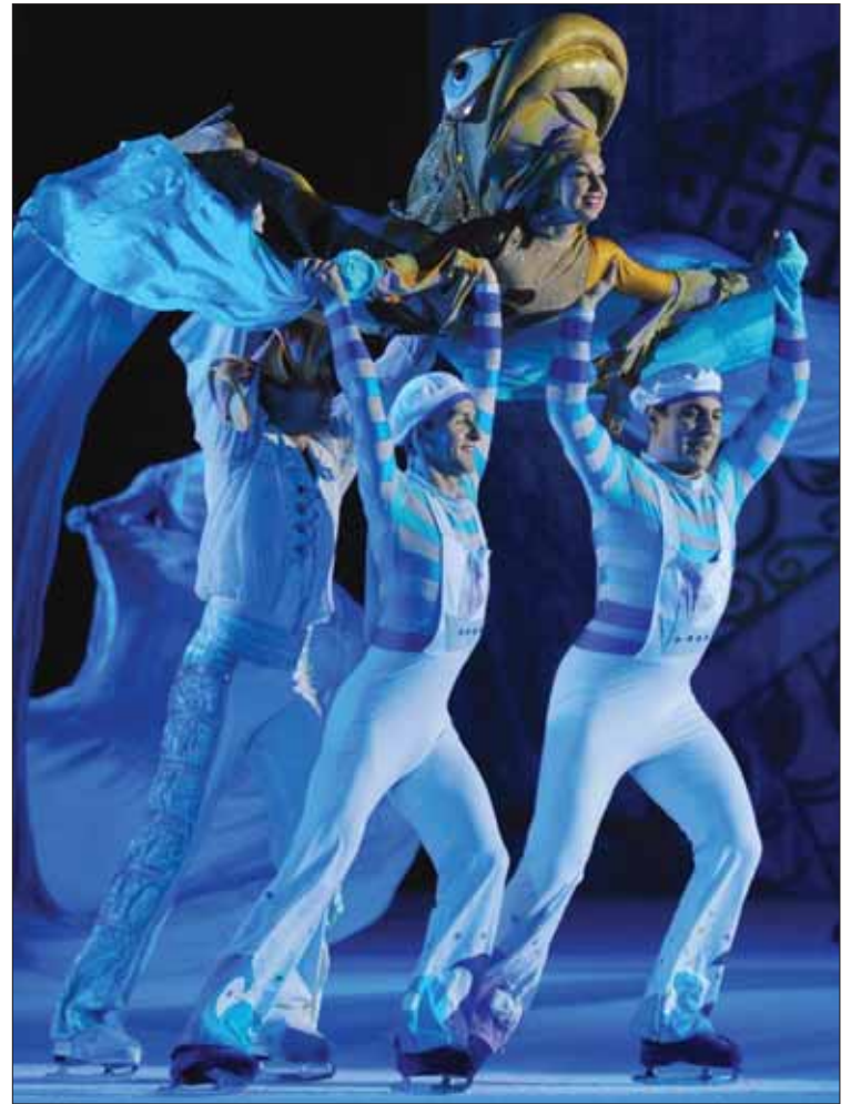
Un des tableaux de «Cendrillon sur glace». A voir absolument dimanche.

Le Théâtre sur glace d'Igor Bobrin se produira donc à la patinoire de Graben, dimanche à 17 h 30. «J'ai tiré les leçons de ma première expérience. Nous avons bien amélioré les choses. Mais paradoxalement, cette deuxième aventure a été plus difficile à mettre sur pied. Étrangement, les entreprises régionales ont moins bien joué le jeu que l'an passé. Peut-être la crise? En tous cas, cela s'est nettement res-