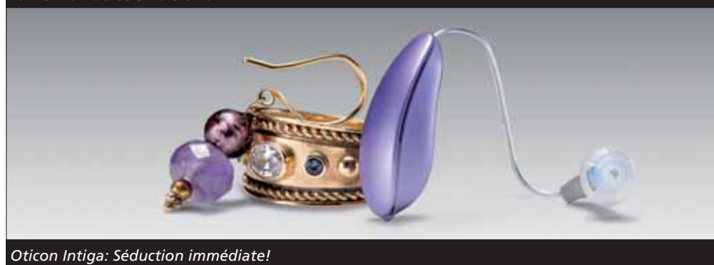
Oticon Intiga: Séduction immédiate!

étaient nécessaires avant d'obtenir un résultat acceptable, il en va tout autrement avec Intiga. Son fonctionnement permet d'obtenir une amélioration instantanée de l'audition et surtout de la compréhension. Le processus d'habituation est donc en conséquence accéléré ! Par ailleurs et malgré sa taille minuscule, Intiga permet de se connecter sans fil à la télévision, à son natel et au téléphone fixe. Pour ce faire, un petit accessoire supplémentaire, le Streamer, fait office de relai sans fil et de télécommande.