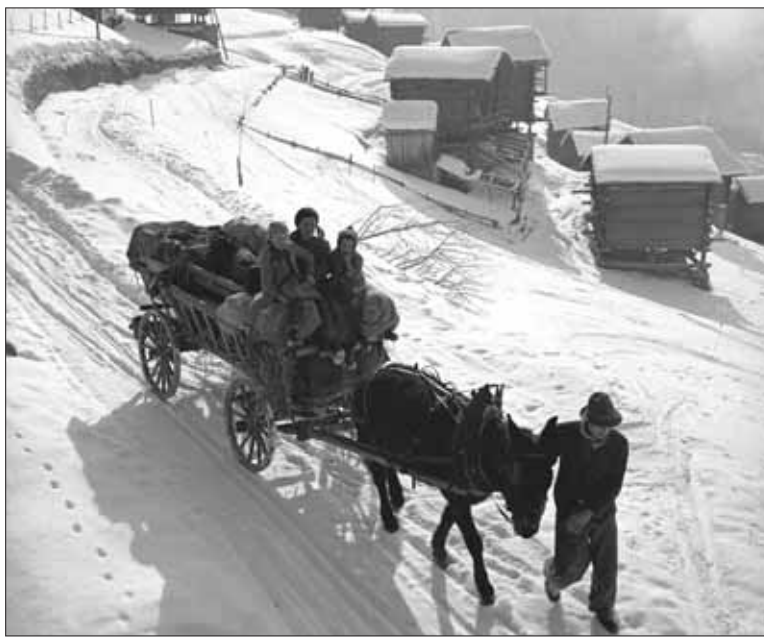
J. M. © MAX KETTEL, MÉDIATHÈQUE VALAIS - MARTIGNY

L'exposition est à voir jusqu'au 20 mai 2012, tous les jours de 13 h à 18 h.