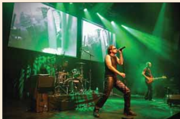
Le groupe U2Two se produira le samedi soir à Ycoor.