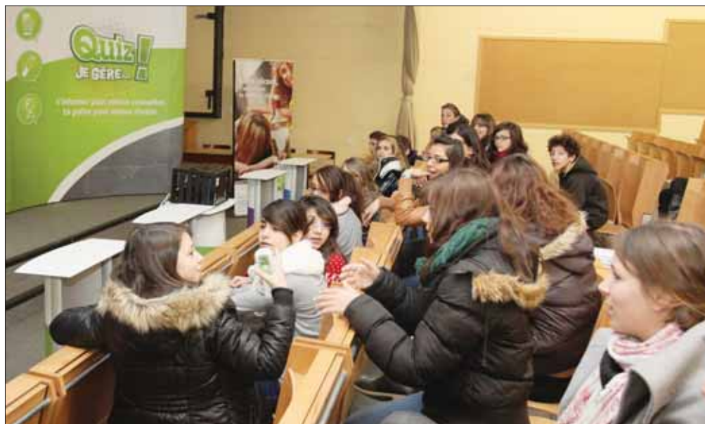
Les élèves des CO de Sierre ont participé au «Quiz! je gère...», qui fait partie d'une campagne de prévention des addictions en milieu scolaire. LE JDS

Ces chiffres interpellent. Pour les contrer, la Fondation Addiction Valais (anciennement LVT) a lancé une nouvelle action de prévention en milieu scolaire, il y a deux ans, intitulée «Je gère...». La campagne touche les cycles d'orientation (CO) du canton. Depuis la rentrée scolaire 2011-2012, les élèves participent au «Quiz! je gère...», une approche ludique et interactive qui favorise l'échange entre les jeunes et les intervenants. Les CO sierrois, Goub-