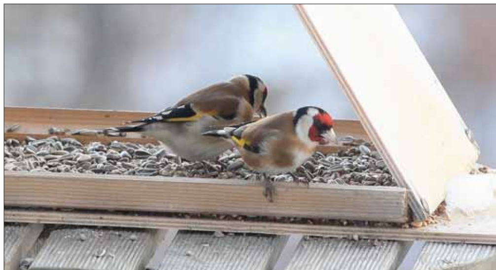
Le photographe du «jds» a immortalisé ces oiseaux à la recherche de nourriture du côté de Niouc courant janvier. Ici un couple de chardonnerets élégants.