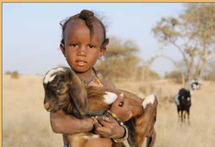
Exploration du Monde nous emmène au Niger, sur les traces des Peuls wodaabe, une tribu nomade.

Les remontées mécaniques (RM) de Saint-Luc/Chandolin et la société de développement de Saint-Luc proposent de vivre une expérience inédite: l'observation du lever du soleil au sommet de la Bella Tola. La montée se fera avec le funiculaire et les installations des RM, puis à pied. La descente s'effectuera