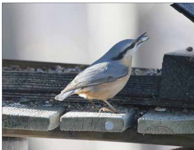
Une graine pour la sitelle, une!