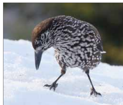
Sur la neige glissante, la stabilité est bien précieuse pour ce casse-noix.