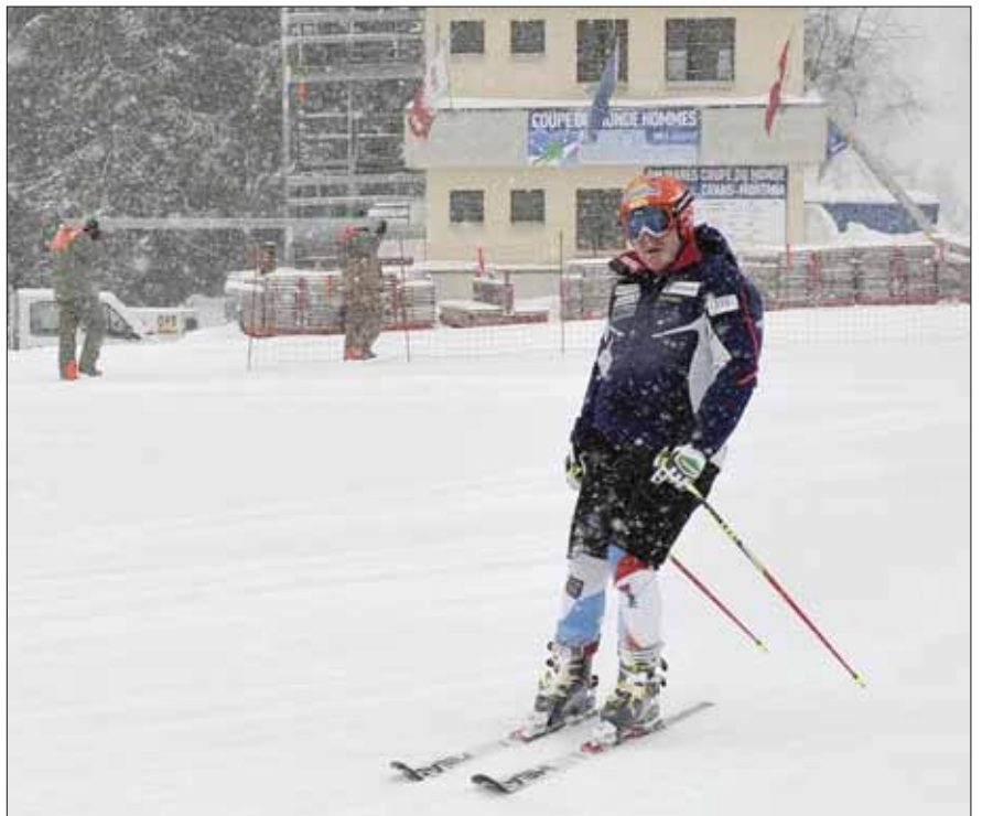
Didier Cuche a effectué un premier entraînement mercredi sur la Nationale. Difficile pour lui de se faire une vraie idée du tracé, tellement les conditions étaient mauvaises.

Sur le terrain, une piste ne se prépare pas de la même manière pour des messieurs que pour des dames. Si les forces engagées (170 militaires, 60 civilistes, 280 bénévoles et 60 lisseurs en provenance des écoles de ski de Suisse romande) sont sensiblement pareilles, leurs efforts se concentrent sur des détails différents. «La ligne pour les hommes est plus