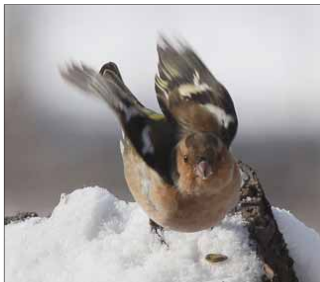
Dérangé durant le repas, le pinson des arbres s'apprête à prendre son envol.