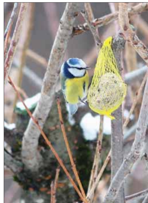
Position acrobatique pour la mésange bleue, dont le garde-manger est bien imposant.