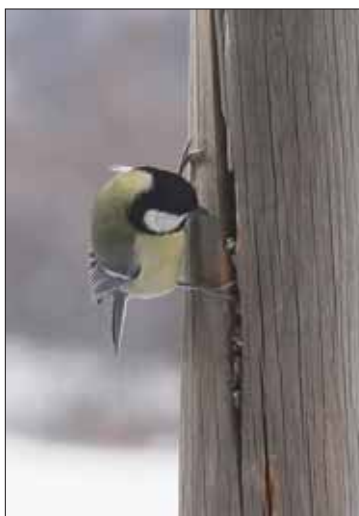
La nourriture se cache partout. La mésange charbonnière a déniché de quoi se régaler.