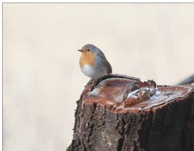
Le rouge-gorge prend un bain de soleil bienvenu.