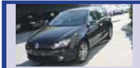
VW GOLF 1.4 Comfort 01.2010, KM 31'900, Vitres teintées, Volant multifonctions, Fr. 22'500.-