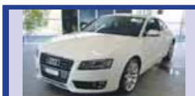
AUDI A5 coupé 2.0 TFSI 12.2010, KM 300, Pack Advance, Pack Sport, S-line tissu-cuir, Fr. 47'000.-