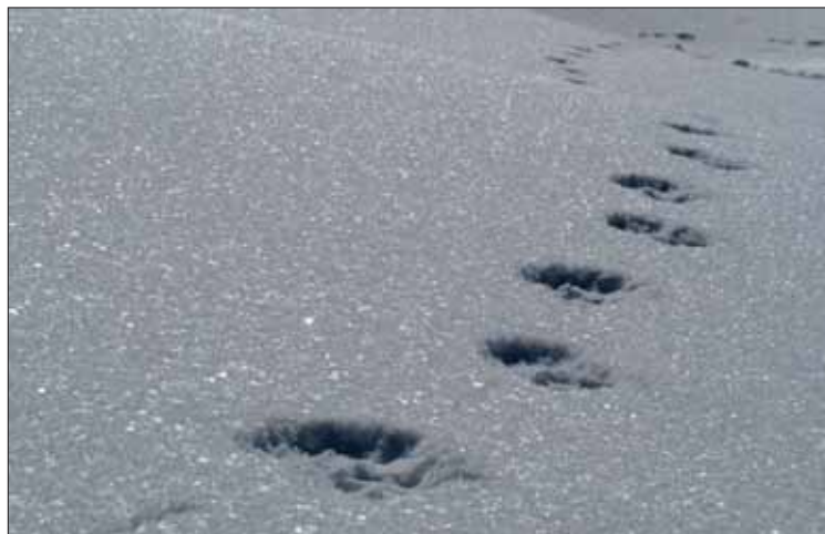
Au long de la randonnée, les membres découvrent des traces d'animaux dans la neige. Ici, celles laissées par une hermine. Instructif!

naient aux écureuils, aux hermines, aux lièvres, aux renards ou aux chamois? Sans doute pas. «Mon métier consiste aussi à sensibiliser les gens au respect de la nature. Il faut éviter de déranger le gibier en période hivernale, afin qu'il ne dépense pas trop d'énergie. Un groupe de raquettes, peu nombreux comme le nôtre et qui emprunte des itinéraires balisés, ne cause pas trop de problèmes. Le ski hors-piste génère plus de conséquences», explique Pascale.