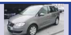
VW TOURAN 1.4 TSI 03.2010, KM 38'470, Pack Family Plus, Boîte aut. DSG, Fr. 26'900.-