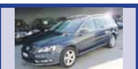
VW PASSAT CC 2.0 BlueTDI 12.2009, KM 30'125, Pack Designe Alcantara, Pack Comfort, Fr. 37'800.-