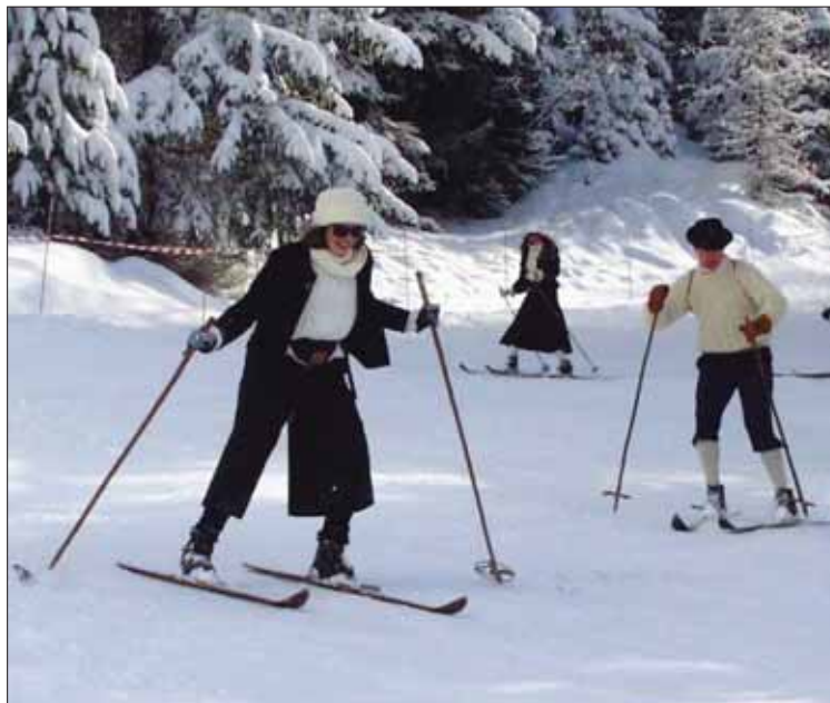
Pour le 60e anniversaire, une catégorie «habits d'antan» a été créée. Plus étonnant: des concurrents s'élanceront sur la piste du Prilet à vélo.

Dans le cadre du 60e anniversaire, les organisateurs proposent quelques nouveautés. La plus importante: ils ont avancé l'épreuve du dimanche au samedi afin de pouvoir la faire suivre d'un souper, puis d'un bal à la salle polyvalente du village. Cette