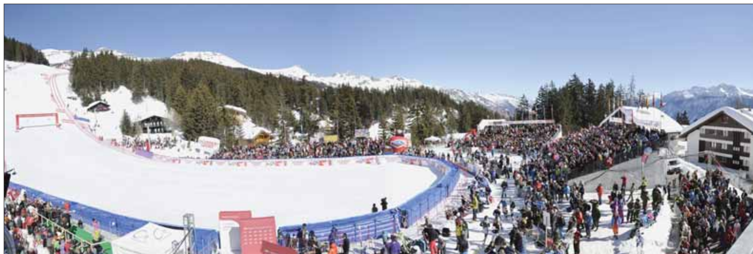
La Nationale fut le théâtre, pendant trois jours, des courses masculines de Coupe du monde de ski. Tous les regards étaient tournés sur Crans-Montana. Les compétitions furent une réussite sur toute la ligne. La station entend bien s'inscrire durablement dans le calendrier de la FIS. Mais le défi est de taille.