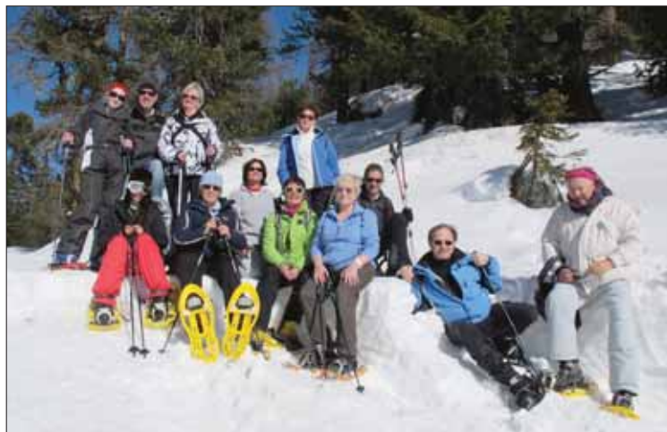
Le groupe de randonneurs au grand complet. Tous ont apprécié à sa juste valeur leur journée. Authentique! LE JDS