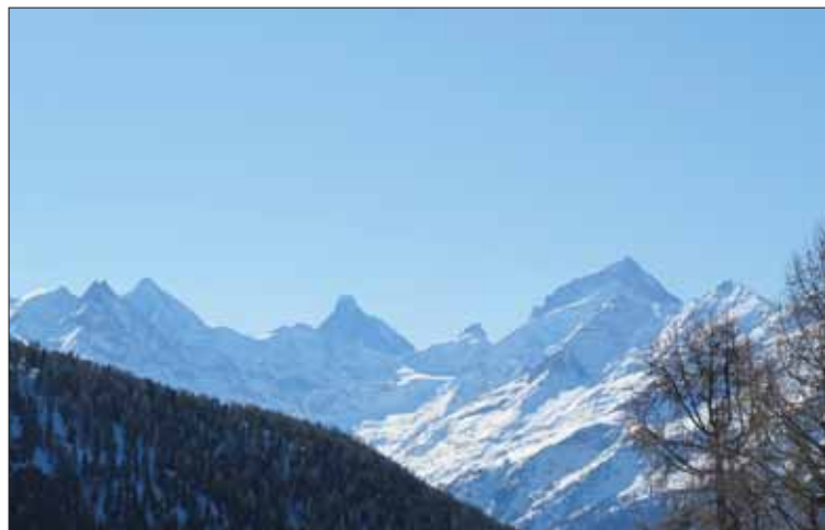
Le Cervin, au centre, s'offre à la vue des randonneurs. A gauche, le Zinalrothorn et l'Obergabelhorn. A droite, le Besso et la Dent-Blanche. Majestueux!