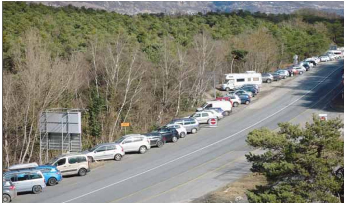
Plus de 500 véhicules ont pu stationner le long de la T9 à Finges. Cette solution novatrice a été mise en place afin de prendre le relais des parkings de Crans-Montana, très vite saturés. LE JDS