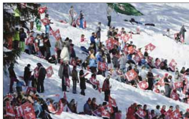
Une foule impressionnante a suivi les compétitions. On a dénombré 49 000 spectateurs.