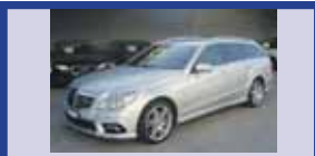
MERCEDES BENZ E 250 CGI BlueEff Avgarde 01.2010, KM 30'165, Pack Sport AMG, Cont. de dist. pour station., Fr. 49'500.-