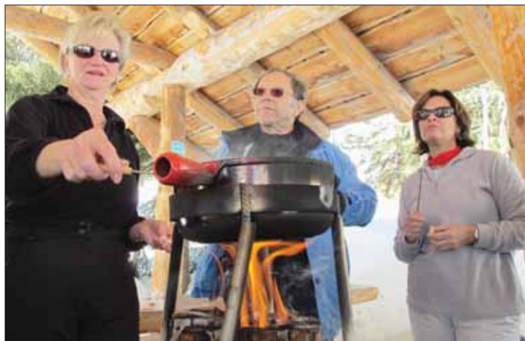
En fin de balade, une fondue au feu de bois rassasie les estomacs. Un instant de convivialité, bien dans l'esprit de la journée. Apprécie! LE JDS