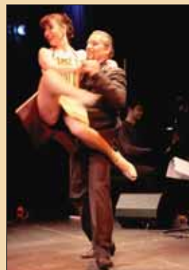
Spectacle de tango à Crans-Montana jeudi 15 mars.