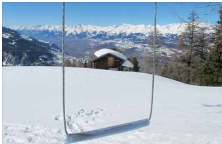
Pramarin est un coin de paradis, perdu, accroché au ciel. La vue est imprenable sur Vercorin et la vallée du Rhône. Splendide! LE JDS