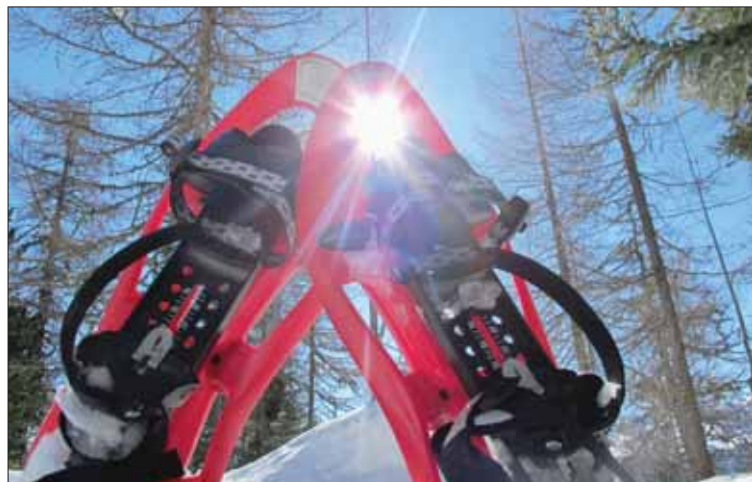
Du soleil, de la neige, une forêt sauvage, tout était réuni pour accomplir une belle balade en raquettes au-dessus de Chandolin. Inoubliable! LE JDS