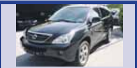
LEXUS RX 400h Edition 01.2007, KM 70'950, Vitres teintées, Sièges AV chauffants, Fr. 34'800.-