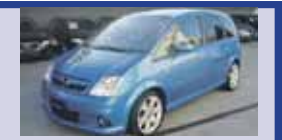
OPEL MERIVA 1.6i 16V Turbo 07.2006, KM 72'000, Pack Ordinateur de bord, Fr. 14'700.-