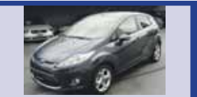
FORD FIESTA 1.4 16V 06.2009, KM 6'950, Contr. de dist. pour stationnement AV et AR, Fr. 16'500.-

... ainsi que plus de 100 autres occasions à découvrir dans nos parcs d'exposition