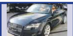
AUDI TT Rds 2.0 TFSI 12.2009, KM 15'600, Equipement cuir Impuls, Radio Concert, Fr. 39'900.-