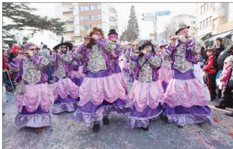
Le carnaval est derrière nous. Clin d'œil au cortège sierrois, coloré et ensoleillé. Les fifres et tambours de Muzot ont participé au défilé, qui a fait le plein de spectateurs. REMO