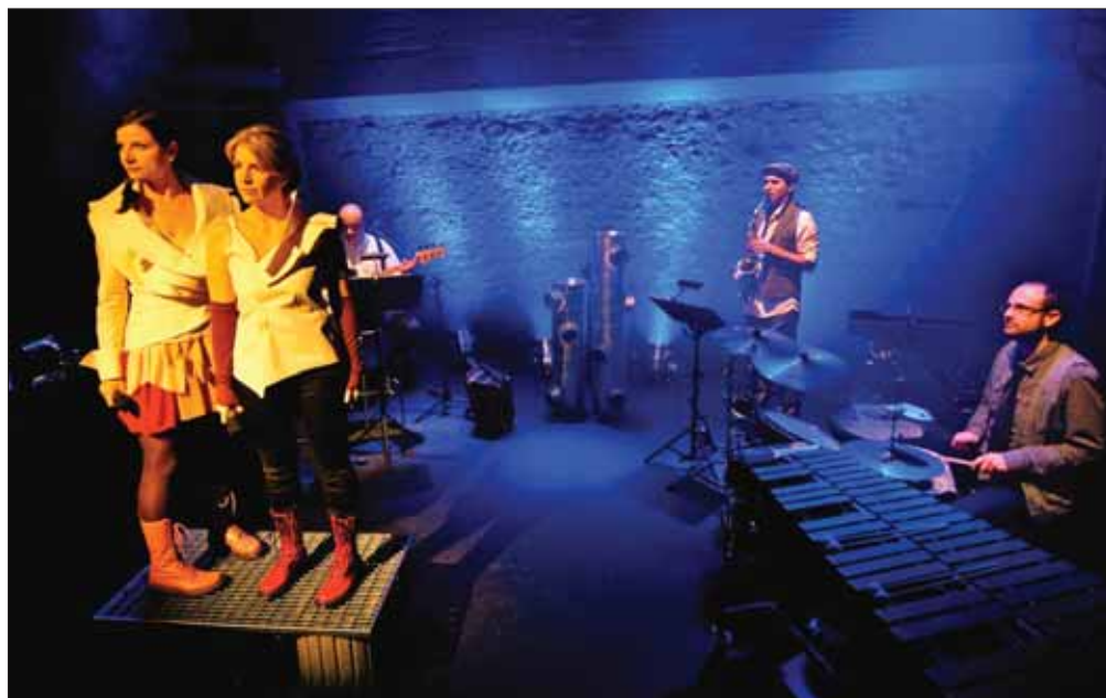
La compagnie L'Heure Orange présente à Sierre sa dernière création: «Et si les valises volaient?» un voyage musical à travers le monde.

La Compagnie L'Heure Orange présente son dernier spectacle, «Et si les valises volaient?» Le groupe, composé de quatre musiciens et deux chanteuses, s'est fait un nom depuis 2002, pour la fraîcheur de ses compositions et son habilité à créer des atmosphères musicales uniques et intimes. Les chanteuses écrivent les paroles et les musiciens, la musique, toujours autour d'un même thème, celui