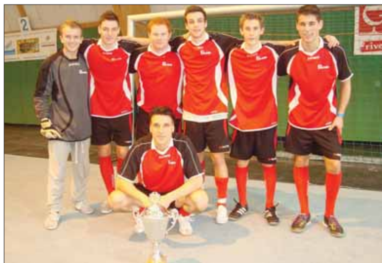
Bravo au FC Chalais, qui a remporté le Trophée Sepp Blatter 2012, tournoi de foot en salle organisé au Sportfit de Salquenen. LDD