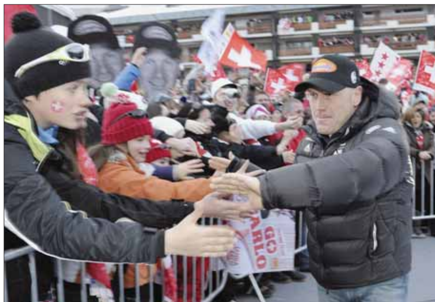
Didier Cuche a été le héros de Crans-Montana et de tout un peuple. Il a remporté le super-G du vendredi, avant d'être fêté avec enthousiasme le samedi soir à Ycoor.