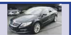
VW PASSAT 2.0 TDI BM High 4M 03.2011, KM 26'900, Parcpiot avec Cam. de recul, Syst. de Navi. par Radio, Fr. 41'500.-