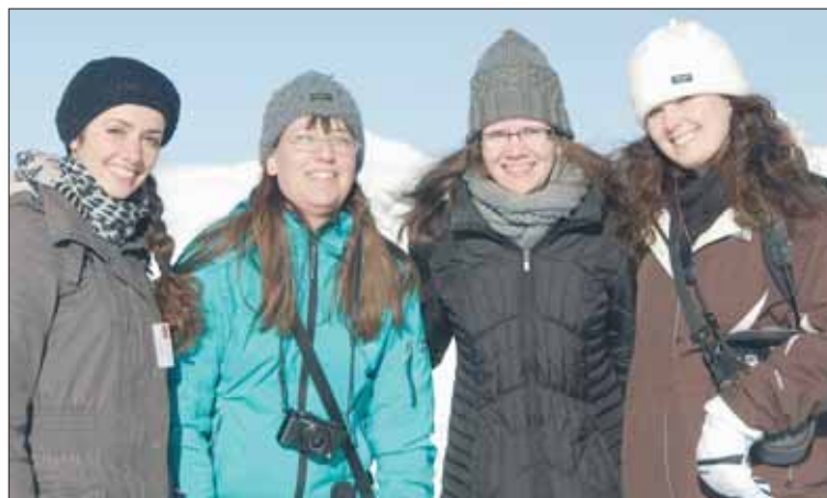
Les chercheurs de PROMISE, spécialisés dans l'information sur l'internet, se sont réunis à Zinal, partageant leur temps entre travail et plaisirs hivernaux.

ZINAL | Des chercheurs internationaux, spécialisés dans l'information, se sont récemment retrouvés à Zinal, sous l'égide de la HES-SO Valais. Réunie autour du projet européen PROMISE, sur l'évaluation de la recherche d'information sur l'internet, la centaine de participants et d'intervenants a partagé son temps entre conférences, ateliers et activités sportives.