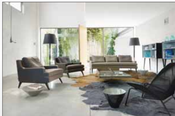
Chez Meubles Emile Moret, du 3 au 24 mars, d'irrésistibles conditions sur la Ligne Roset... à ne pas rater!

La Ligne Roset , disponible en exclusivité valaisanne chez MEUBLES EMILE MORET , est proposée à des conditions exceptionnelles.