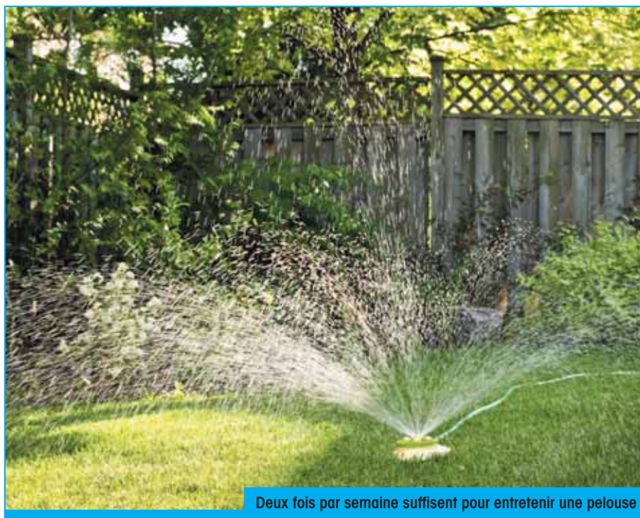
Deux fois par semaine suffisent pour entretenir une pelouse

En mai 2011 un tout-ménage avec le message « Stop à l'arrosage abusif et au gaspillage d'eau potable » était distribué dans toutes les boîtes aux lettres de Sierre. Phénomène exceptionnel, ou est-ce à dire que notre région pourrait aller vers un manque d'eau ?