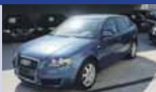
AUDI A3 SB 1.4T FSI Attraction 04.2008, KM 18'000, Pack ProLine, Vitres teintées, Fr. 22'900.-