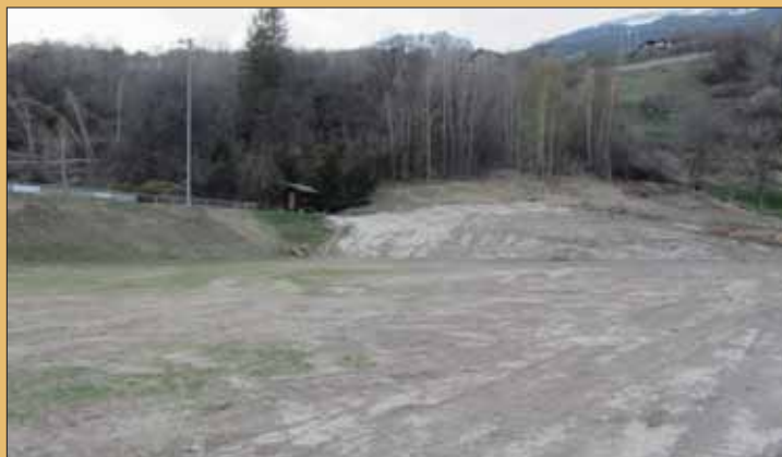
La commune de Mollens a investi 25 000 francs pour assainir la place qui accueillera le combat de reines sur le plateau de Conzor.

Le ring de Conzor disposera de deux gradins naturels et sera complété par des tribunes construites pour l'occasion. «L'arène ne sera pas loin de la qualité de celle d'Aproz», exagère à peine Patrice Clivaz.