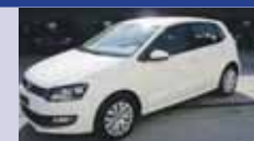
VW POLO 1.4 Comfort 12.2010, KM 28'230, Pack Confort, Pack Confort de conduite, Fr. 17'500.-