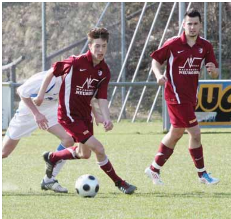
Le FC Salquenen joue la carte de la jeunesse. Néopromu, il se place au milieu du classement de troisième ligue, avec une équipe à la moyenne d'âge de 22 ans et demi.