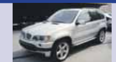
BMW X5 4.6i 03.2002, KM 84'600, Fonction TV, Système de navigation, Fr. 29'500.-