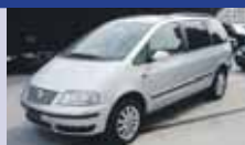
VW SHARAN 1.8T Sportline 06.2007, KM 45'300, Pack Luxe, 5 sièges sport, Fr. 23'800.-