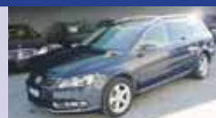
VW PASSAT CC 2.0 BLUE TDI 12.2009, KMm 30'125, Pack Design Alcantara, Pack Komfort, fr. 37'800.-