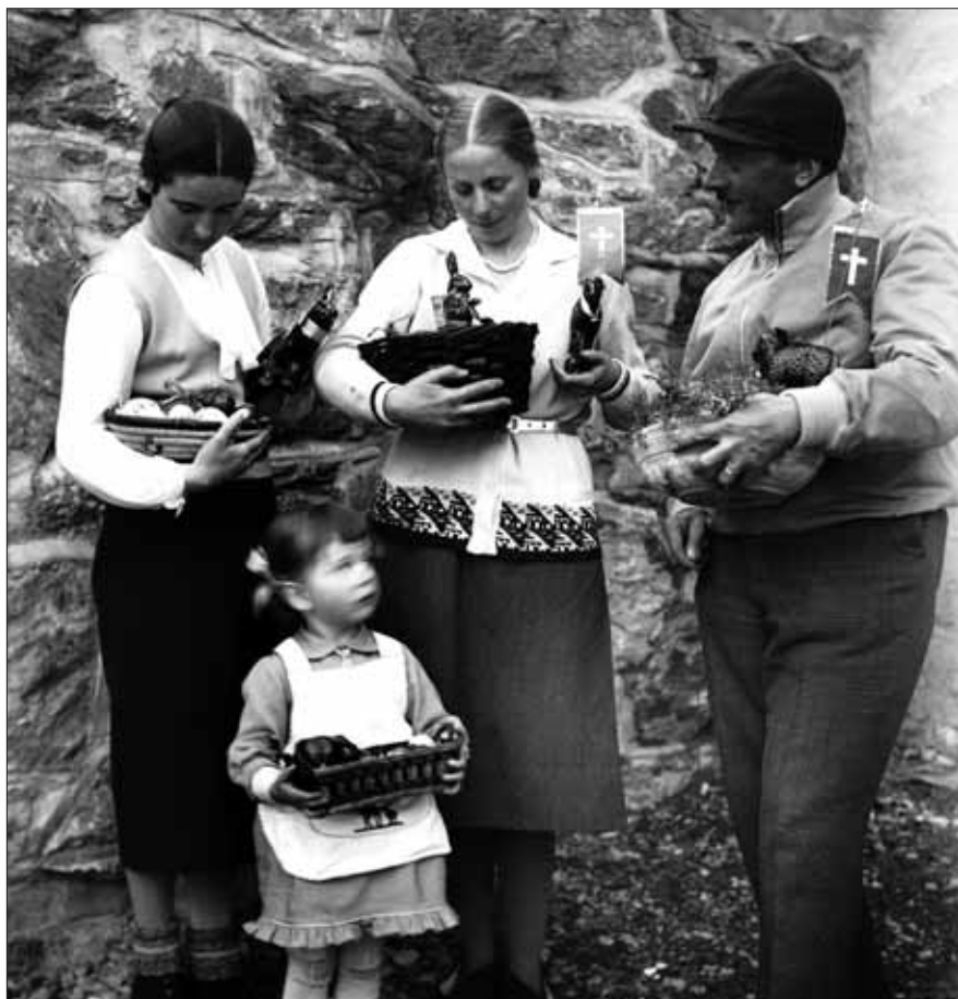
© ALBERT NYFELER, MÉDIATHÈQUE VALAIS - MARTIGNY