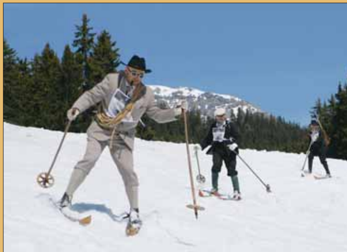
The Oldies in Crans-Montana se déroulera le dimanche 15 avril. Conditions de participation: skier avec du matériel d'antan. DEPPEZ

Pro Senectute Valais propose un séjour accompagné par des infir-