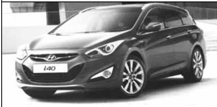
Hyundai i40 Break