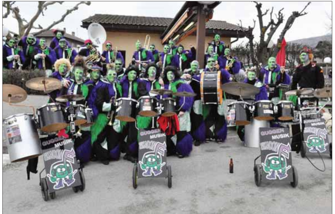
La Zikadonf célèbre ses 10 ans d'existence. Pour l'occasion, la clique inaugure de nouveaux costumes.

SAINT-LÉONARD | La guggenmusik Zikadonf est née voici dix ans. De ses débuts épiques dans un petit garage à la fête organisée pour le jubilé, la société a évolué. Portrait.