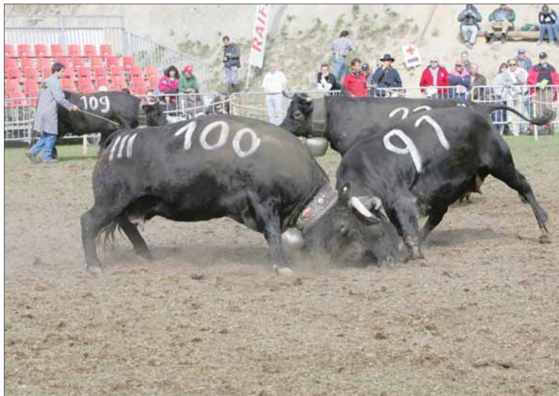
Depuis 1976, Mollens n'avait plus accueilli de combats de reines. Chermignon avait eu cet honneur en 2009.

La manifestation est le fruit de la collaboration des deux syndicats d'élevage de la Noble-Contrée: celui du haut qui regroupe les paysans de Randogne et Mollens, celui du bas qui rassemble les agriculteurs de Venthône, Miège et Veyras. Ils reçoivent