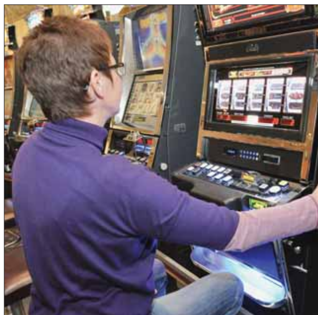
La fréquentation du casino de Crans-Montana a diminué en 2011, mais le bénéfice a, lui, augmenté.

*Promotion Jubilé 35 : validité jusqu'à 30.6.2012. Prix nets CHF incl. 8% TVA et Jubilé 35 CashBonus. Leasing 3.35% avec CashBonus réduit. Consommation normalisée 3-Door: 7.8 L, CO 2 207 g/km, cat. C. Emissions CO 2 : moyenne de tous les véhicules neufs en Suisse: 159 g/km.