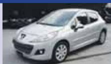
PEUGEOT 207 1.6 Sport 02.2010, KM 22'310, Vitres teintées, Ordinateur de bord, Fr. 14'800.-