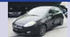
FIAT BRAVO 1.4 T Genius 05.2009, KM 47'120, Blue&Me, Ordinateur de bord, Fr. 12'700.-

... ainsi que plus de 100 autres occasions à découvrir dans nos parcs d'exposition