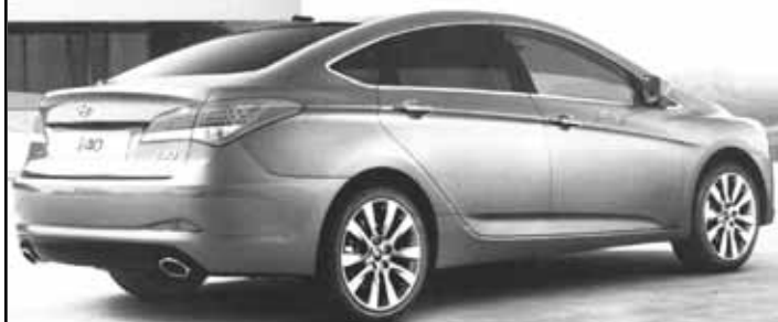
Hyundai i40 Berline