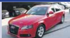
AUDI A4 AV 3.2 FSI quattro 06.2008, KM 65'145, B. aut. Tiptronic, Équipement en cuir, Fr. 41'700.-