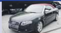
AUDI S4 Cabriolet 4.2 quattro 12.2007, KM 61'650, Boîte aut. Tiptronic, Pack Sunshine, Fr. 38'900.-