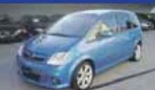
OPEL MERIVA 1.6i Turbo OPC 07.2006, KM 72'000, Pack Ordinateur de bord, Vitres teintées, Fr. 14'700.-