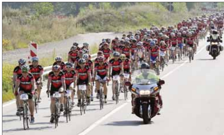
Le nombre de 1000 coureurs devrait être atteint en 2012. Les plus optimistes parlent même de 1200 à 1500 cyclos présents le 1er août.