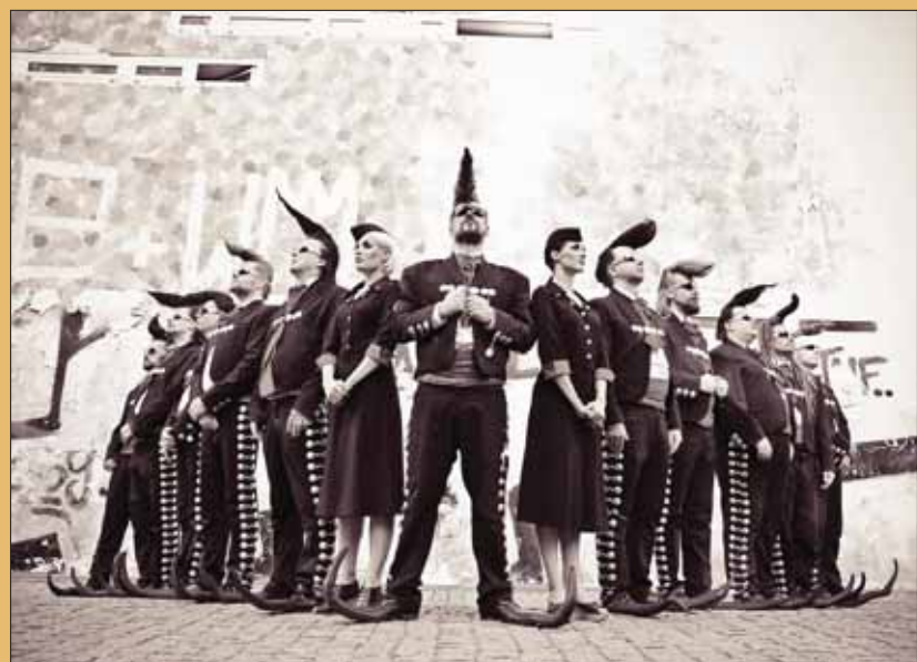
Leningrad Cowboys au Sierre Blues Festival le 23 août prochain.