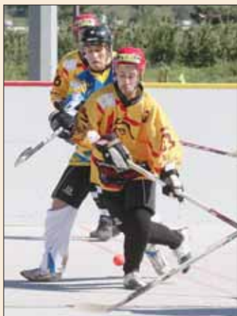
Les Sierre Lions joueront trois fois de suite à l'extérieur. REMO

Les Sierrois ont terminé leur année 2012 par une victoire en Coupe de Suisse face aux Mad Dogs de Dulliken (0-6). Ils poursuivront leur chemin dans cette compétition, toujours à l'extérieur, face au SHC Bettlach (le 9 février à 14 h). Avant cela, les Sierre Lions reprendront le championnat de LNA, dimanche (14 h). Le hasard du calendrier veut qu'ils se rendront déjà à Bettlach. Les Suisses alémaniques pointent actuellement au septième rang du classement (4 victoires pour 7 défaites), avec huit points de retard sur les Lions, sixièmes.