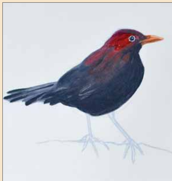
«Merle siffleur», huile et fusain sur toile, 40x40 cm, 2012. Un tableau à découvrir à la Ferme-Asile.