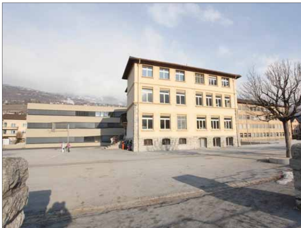
Présent et passé se confondent désormais sur le site du centre scolaire de Borzuat, à Sierre. REMO

La nouvelle structure est l'œuvre du bureau d'architectes Savioz et Fabrizzi à Sion. L'exécution et le suivi des travaux ont été as-