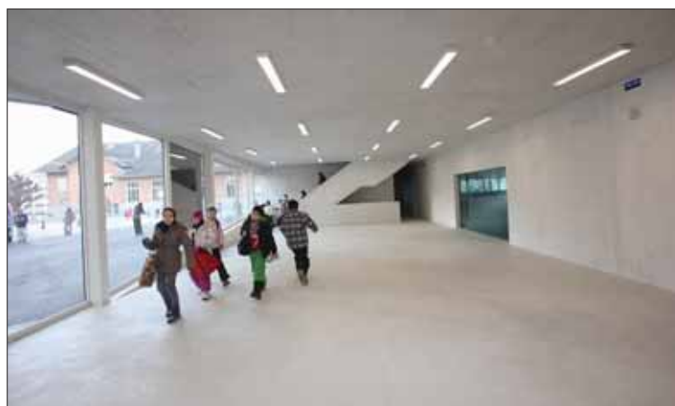
Le bâtiment Rilke, construction contemporaine, lumineuse et dépouillée. REMO