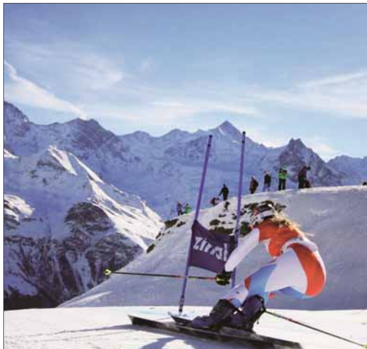
La station de Zinal s'est fait une spécialité de mettre sur pied des épreuves réservées à la relève. Ici une Coupe d'Europe, au début du mois de janvier.