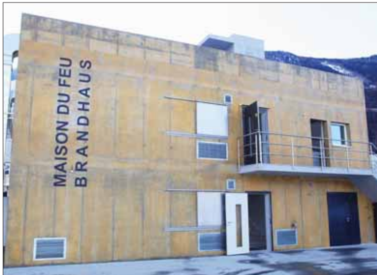
La Maison du feu a été inaugurée le jeudi 31 janvier, au centre d'instruction de la protection civile, à Grône. Elle est destinée à la formation de l'ensemble des pompiers du Valais. REMO