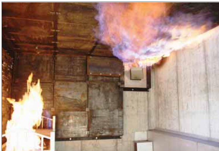
Le bâtiment est parsemé de pièces, dans lesquelles divers types de foyers peuvent être allumés. L'objectif est de recréer des situations qui sont en phase avec la réalité du terrain. REMO