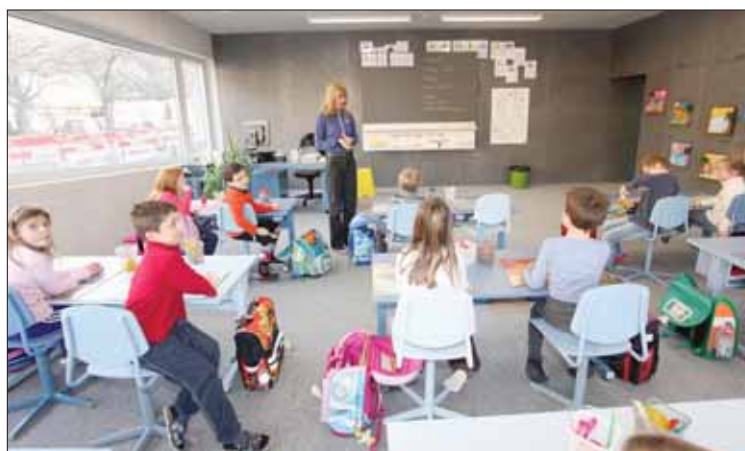
Les salles de classe ont gagné de l'espace, passant de 56 à 72 m 2 . REMO