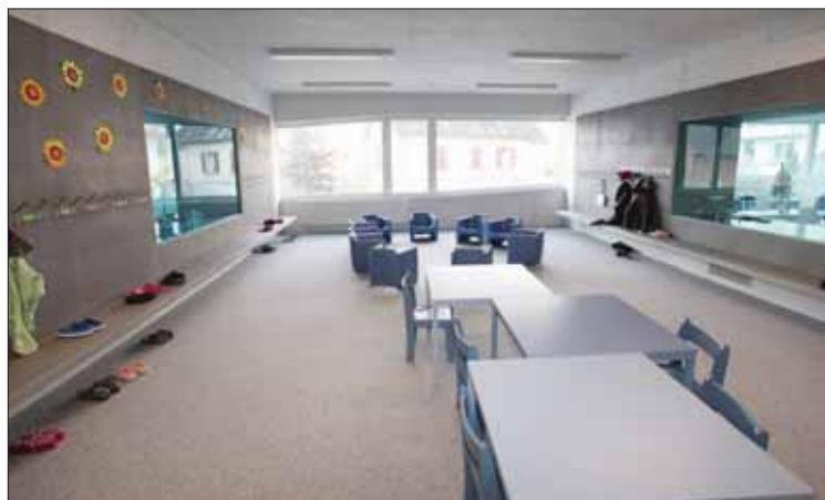
Le vestiaire fait aussi office de salle de rencontres. REMO