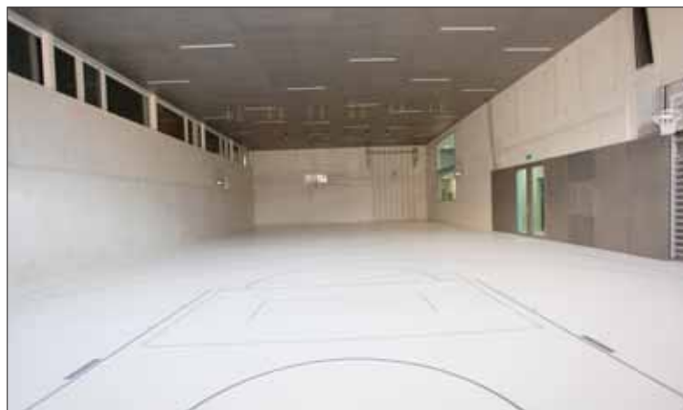
Une salle de gymnastique a été intégrée à la structure scolaire de Borzuat. REMO