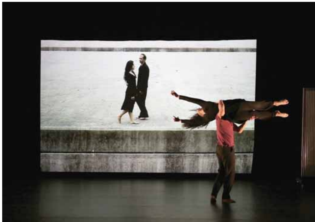
Un extrait du spectacle «De l'instant», présenté une première fois au Théâtre du Crochetan à Monthey et ce week-end encore au TLH de Sierre. MARIO DEL CURTO

des attitudes quotidiennes des gens. Quand nous travaillons ensemble, nous aimons expérimenter, dans l'action.