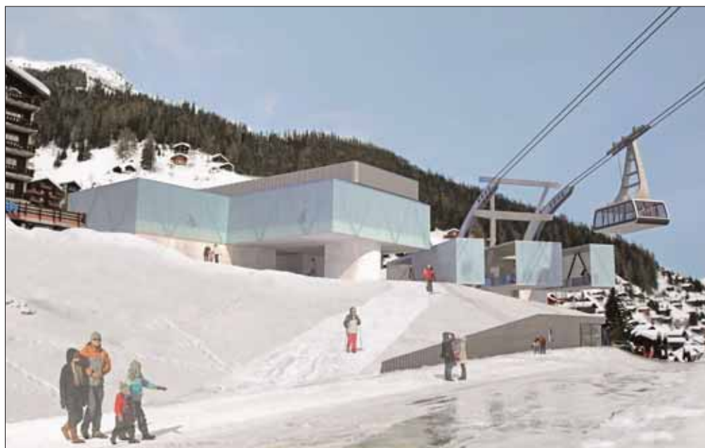
La construction de la gare aval du téléphérique, à Grimentz, reprendra courant février.

Les dirigeants de l'entité fusionnée ambitionnent de faire passer le capital de 11,6 à 17,4 millions de francs, soit une hausse de 5,8 millions. Un objectif qui sera probablement atteint. Au 31 décembre dernier, un montant de 4,3 millions de francs était entré dans les caisses. «Nous avons prioritairement approché les anciens actionnaires, qui bénéficiaient d'un taux préférentiel (ndlr: 200 francs) jusqu'au 31 décembre. Nous espérons lever les deux tiers du capital-actions, nous en sommes aux trois quarts. Les anciens ont réalisé un bel effort», note Yves Salamin, directeur administratif des RM. Parmi ces actionnaires, on retrouve des entités publiques, des sociétés et des acteurs privés: les communes d'Anniviers (1 million) et de Sierre, des bourgeoisies comme Ayer et Grimentz, des consortiums d'alpage, Sierre-Energie, les RM de Saint-Luc/Chandolin et Vercorin, les entreprises participant à la construction du téléphérique... «La majorité du capital sera en mains anniviardes (70-80%) et valaisannes», rassure Yves Salamin. Désormais, les diri-