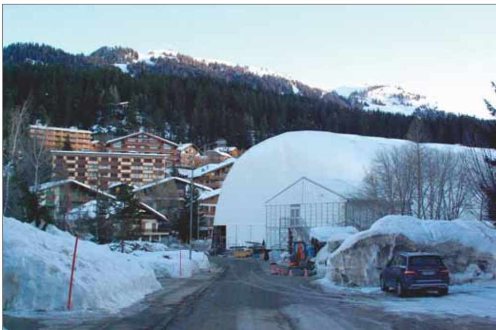
Nouvelles infrastructures pour le Caprices, comme cette tente qui pourra accueillir 5600 personnes.