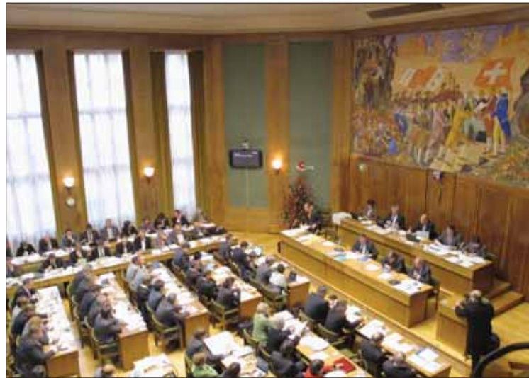
Le Conseil d'Etat et le Grand Conseil valaisans seront renouvelés ce week-end. Les Sierrois éliront dix-sept députés. NF

Pour le district de Sierre, l'élection au Législatif débouchera forcément sur du changement. La répartition 7 PDC, 5 PLR, 4 AdG, 2 UDC ne survivra pas. Notre région perdra un siège pour la législature 2013-2017, qui en comptera dix-sept. Le nombre