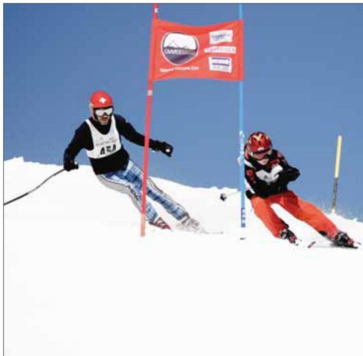
Un parcours de près de 6 km exigeant, mais tout de même accessible à tous.

Renseignements complets et inscriptions sur le site: www.sms04.ch