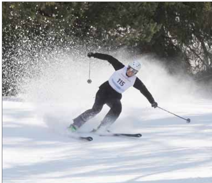
Il faut avoir une bonne condition physique pour venir à bout de la piste du Prilett.