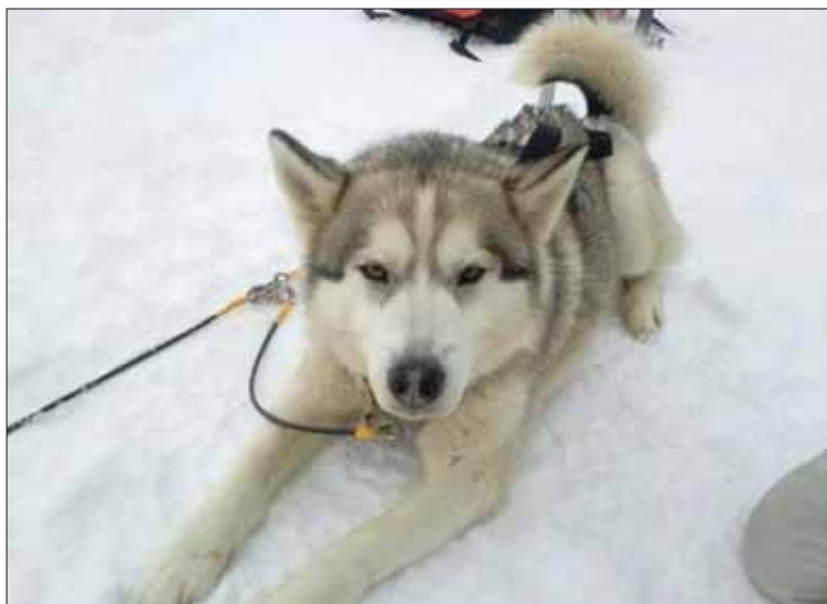
Les chiens polaires étaient les stars du week-end nordique de Vercorin. Qui ne fondrait pas devant un tel minois!