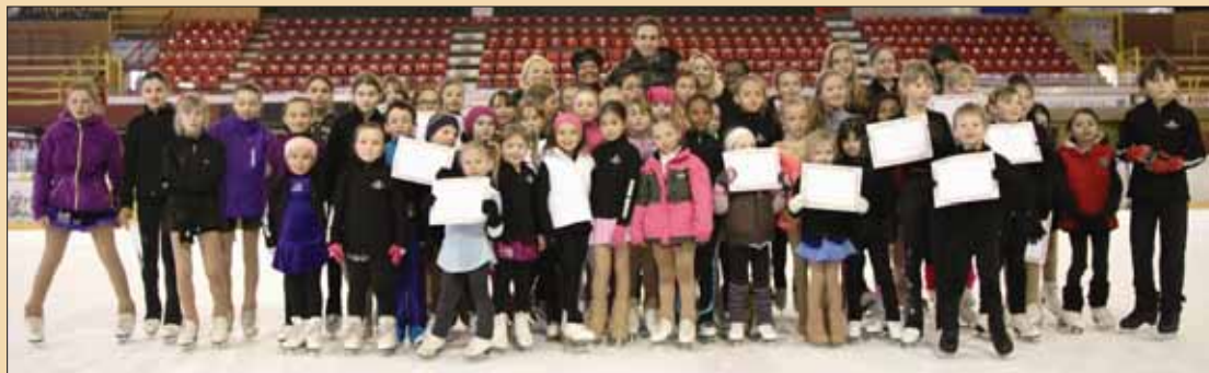
L'ISC Crans-Montana Sierre et région a clôturé sa saison dimanche dernier à Graben. Il a ainsi pu distribuer 68 diplômes à sa relève.