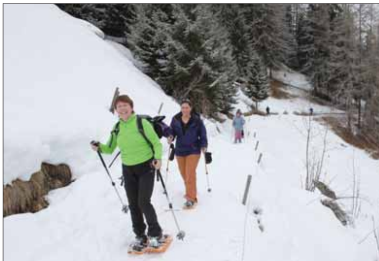
La quatrième édition de Raquettissima, à Saint-Jean, a connu le succès avec 240 participants. La balade des saveurs attire toujours plus de familles et de groupes de copains. LE JDS