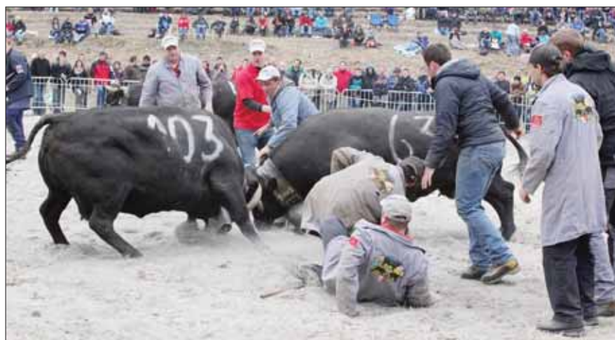
Le travail de rabatteurs n'est pas de tout repos! REMO