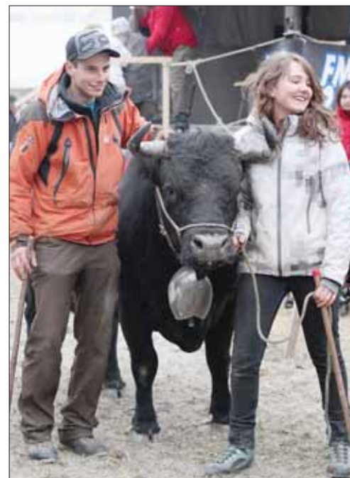
«Attila» a été sacrée reine de 1re catégorie. Elle est la propriété de l'étable du Mihi, à Sornard. REMO