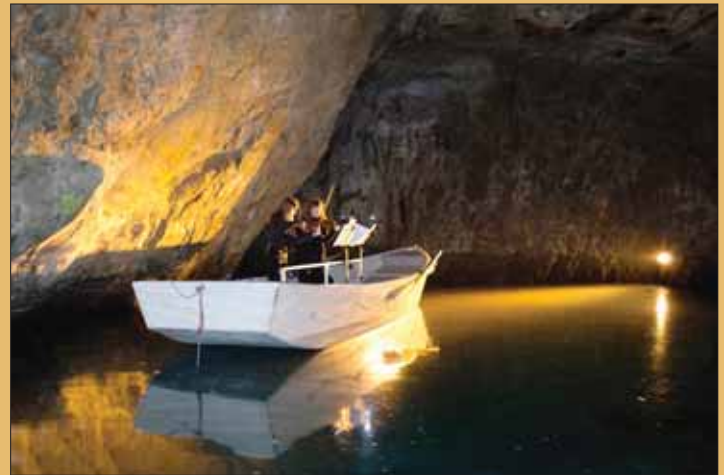
Des concerts seront organisés au lac souterrain de Saint-Léonard dès le 20 avril.

Dès lundi 1er avril, les horaires du bureau postal de Venthône seront réduits. Les horaires seront regroupés en matinée: du lundi au vendredi de 7 h 30 à 11 h 30 et le samedi de 8 h à 10 h. Une demande