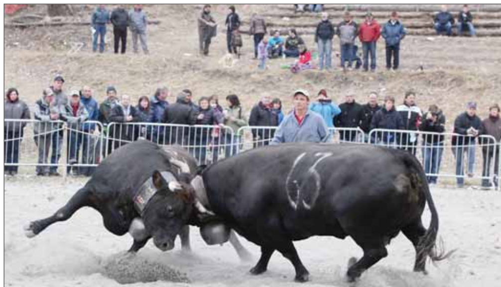
Le syndicat d'élevage de Grône a organisé le premier combat régional de la saison, dimanche passé à Aproz. Environ 2500 personnes ont assisté aux luttes. Le froid a retenu des spectateurs chez eux. REMO