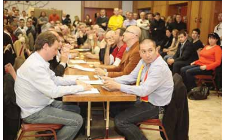
Lors de l'AG extraordinaire de mars 2012, le nouveau conseil d'administration ne savait pas dans quelle galère il allait s'embarquer. REMO

Stupéfaction, le mot est lâché. La surprise provient juste du fait que la juge de district soit intervenue avant le délai qu'elle avait fixé. Elle a argumenté en disant que la situation s'était encore détériorée en janvier et que les différentes mesures présentées lors de la séance du 20 mars n'avaient que peu de chances d'aboutir. Et c'est bien là la seule