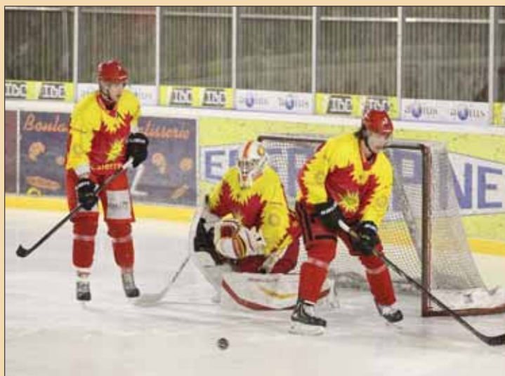
Les juniors Top ont manqué leur promotion pour un point.