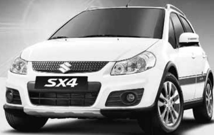
Série limitée. Jusqu'à épuisement du stock.

* Votre bénéfice Sergio Cellano: pneus d'hiver premium sur jantes alu 15", système de navigation Bosch de qualité, rétroviseurs extérieurs rabattables électriquement, dispositif mains libres, rails de toit couleur métal et pack Sergio Cellano avec bandes décoratives, porte-clés et tapis, d'une valeur totale de Fr. 4 800.-, baisse de prix Fr. 6 000.-, bénéfice client de Fr. 10 800.-