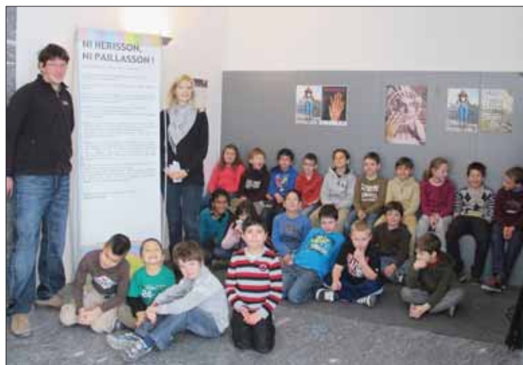
Les 3e primaires sierroises ont abordé le thème de la violence à l'école, notamment avec une exposition aux Caves de Courten.

Etes-vous plutôt hérisson, toujours en boule? Ou paillason, qui se laisse trop facilement piétiner? Ou alors mouton, sympa et conformiste? Ou carrement autruche? L'exposition illustre de façon amusante les stratégies de protection face au conflit ou au danger. Elle expli-