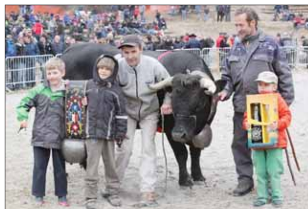
«Nevada», de Gabriel Melly à Ayer, est reine des primipares. REMO