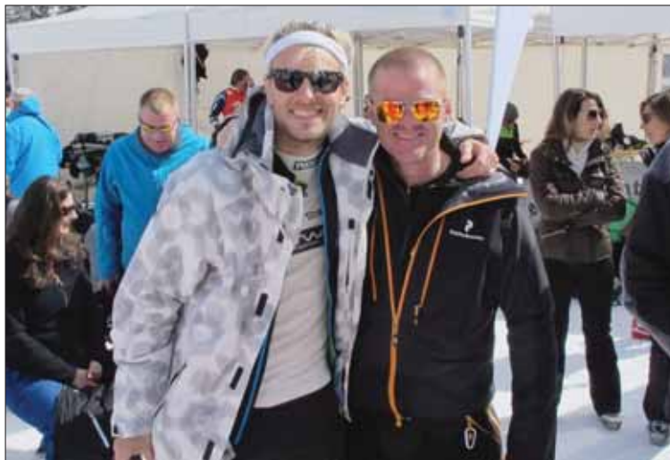
Les City Ski Championships ont réuni à Crans-Montana people et financiers européens dans une ambiance décontractée. A l'arrivée de la Nationale, le chanteur Rick Parfitt et le cuisinier étoilé Heston Blumenthal.