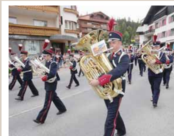
Le Cor des Alpes de Montana-Village défile au pas, et concentré, dans les rues de la station. REMO