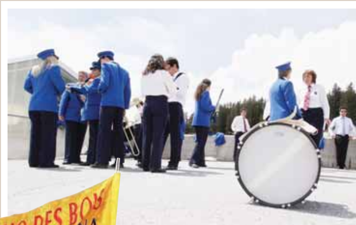
L'Echo des Bois de Crans-Montana a organisé la 61 e Amicale de la Noble et Louable Contrée les 7 et 8 juin. Derniers préparatifs avant le défilé. REMO