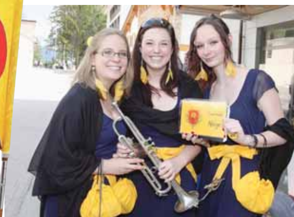
Ces sourires vous sont offerts par les demoiselles d'honneur de la Concordia de Miège. Charme et musique ne sont de loin pas incompatibles. REMO