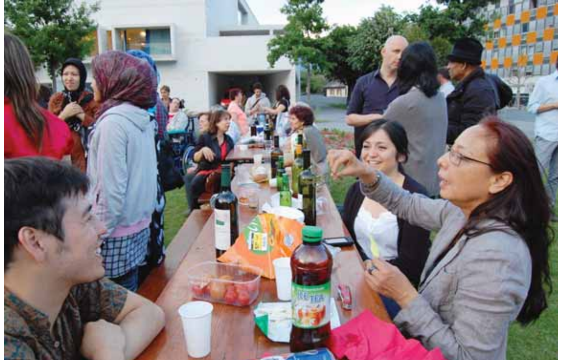
A l'invitation de l'artiste colombien Ramon Pino Hernandez, des citoyens du monde se sont retrouvés sur la place de l'Europe à Sierre. L'important était de se rencontrer, de partager. L'expérience pourrait être reconduite chaque année.

Ramon a donc imaginé pour ce master une «sculpture humaine» sur cette même place, moment de rencontres entre professeurs, étudiants de l'ECAV et les personnes de l'Espace. Les «Donne» bien sûr, mais aussi d'autres nationalités se sont retrouvées, sur l'invitation de Ramon Pino Hernandez le 6 juin dernier, pour dresser ensemble des tables sur la place de l'Europe. «Comment fait-on de l'art sans pinceau, ni papier?» questionne l'artiste. «Nos propres corps suffisent pour se rencontrer. C'est la rencontre qui m'intéresse surtout, l'interaction.» Enthousiaste, le jeune Colombien croit à l'esthétique relationnelle: «Un tableau est une excuse pour parler à l'autre, pour partager ce qu'on a dans la tête».