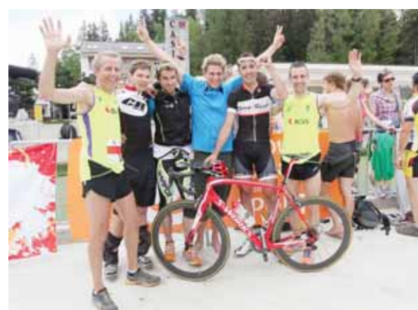
Les grands vainqueurs du Terrific messieurs 2013: Radys New Concept Sport. Cette équipe a bouclé l'épreuve en 3 h 08'27", soit avec 17'03" d'avance sur ses poursuivants. REMO