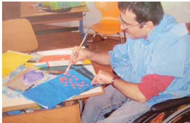
Des résidents du Foyer Valais de Cœur ont appris aux élèves des Glariers à confectionner des bricolages.

SIERRE Seuls quelques mètres séparent le centre scolaire des Glariers et le Foyer Valais de Cœur, qui accueille des personnes handicapées. Tout naturellement, des liens se sont créés entre les deux établissements. Depuis quelques années, les élèves donnent un petit concert de Noël aux résidents de l'institution. Dernièrement, ces liens se sont considérablement renforcés, à travers la réalisation commune d'un projet créatif. Les écoliers de 1re et 2e année primaire et quelques résidents ont confectionné des bricolages en forme de cœur. Originalité de la démarche, les seconds