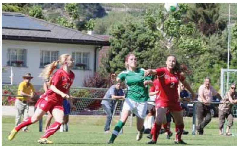
Le match féminin Yverdon-Team Vaud - Suisse M17 s'est soldé par un sec et sonnant 7-0 en faveur des Suissesses. REMO