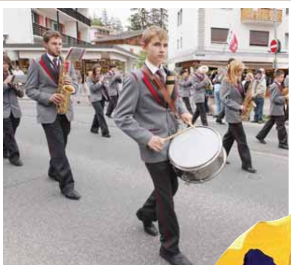
Tout en jouant, ce musicien de l'Union de Venthône jette un coup d'œil au photographe. Talentueux. REMO