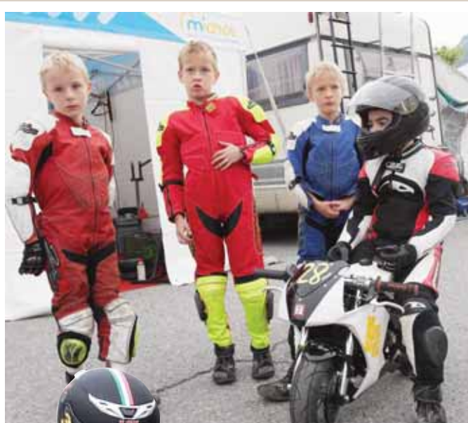
Discussion entre pilotes au moment du débriefing de la course. La poket bike est un bon tremplin pour apprendre et peut-être plus tard se lancer dans le grand bain de la moto sur circuit. REMO