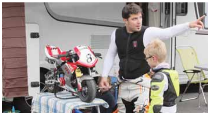
Derniers conseils et derniers réglages avant de s'élancer. Cette discipline permet de réunir les générations. REMO