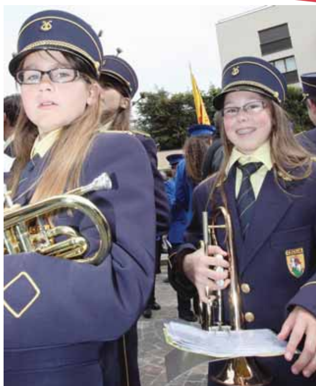
La Cécilia de Chermignon regorge de jeunes musiciens de talent, demoiselles y compris. La relève s'affirme. REMO