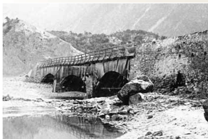
L'image de ce pont de bois enjambant le Rhône date de 1852. Toutes les personnes le traversant devaient passer à la caisse.

La toile a été acquise en 1996 par le Musée d'art du Valais.