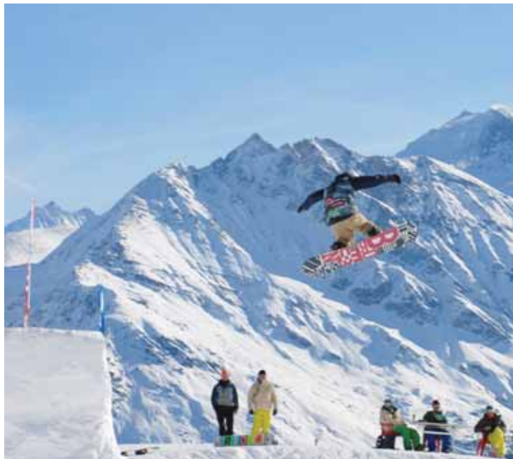
Le big air et le boardercross seront à l'affiche de ces compétitions de Grimentz, tant en snowboard qu'en ski. GIANTXTOUR

Depuis dix-sept ans, cette manifestation sportive interscolaire a comme objectif premier l'aspect pédagogique, en sensibilisant les jeunes au respect de l'environnement, à la sécurité, à la gestion du risque et à la maîtrise de soi. Et par les temps qui courent, ce sont des notions – surtout la sécurité – à ne