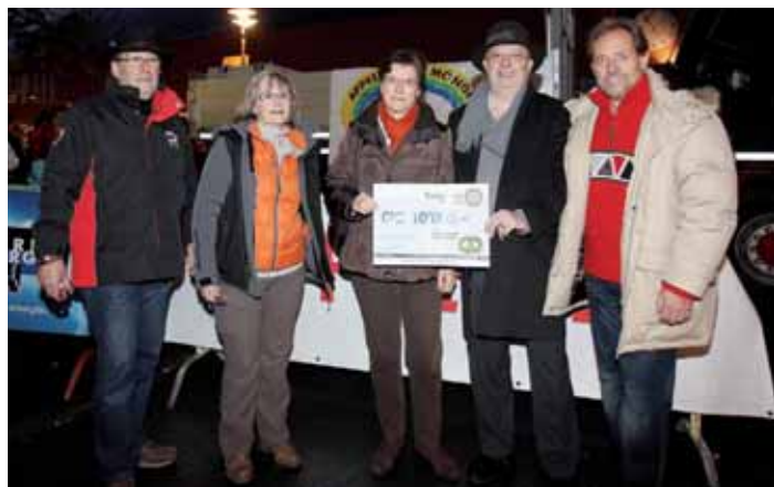
Remise du chèque par le Rotary Sion-Rhône à Apprentis Du Monde le 20.12.2013.

Jusqu'à présent les véhicules utilisés par le père ont été des utilitaires achetés d'occasion sur place où amenés depuis la Suisse par les membres d'Apprentis Du Monde/Suisse (1992). Mais avec la conjoncture actuelle il est de plus en plus difficile de trouver un véhicule utilitaire qui soit fiable. L'état du véhicule actuel en possession de l'association arrive en fin de course malgré les nombreuses réparations pour le maintenir en état de fonctionnement.