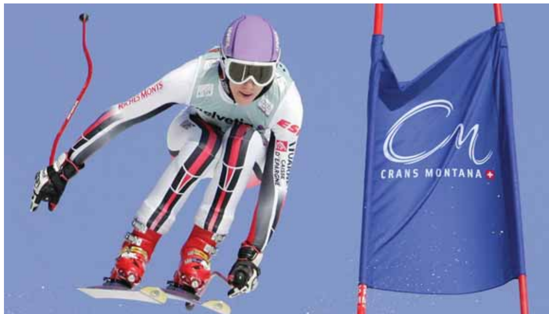
Avant le grand rendez-vous du mois de mars, c'est la Coupe d'Europe qui fera halte sur le Haut-Plateau du 28 au 30 janvier.