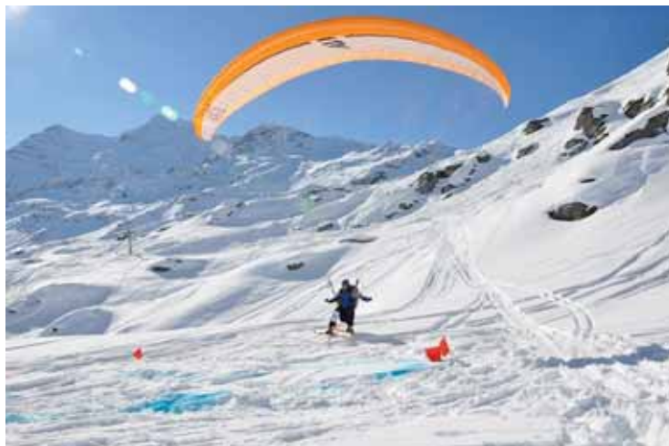
Demain et dimanche, place à la 28 e Mauler Cup à Zinal.

core et toujours la Manche Mauler du dimanche, avec un départ de la Corne-de-Sorebois. Quant aux adeptes de speedflying et de delta, ils auront également leur manche. Pour ces deux disciplines, la compétition s'organise en «speedrun», manche de vitesse durant laquelle les pilotes doivent passer un maximum de portes à ras le sol.