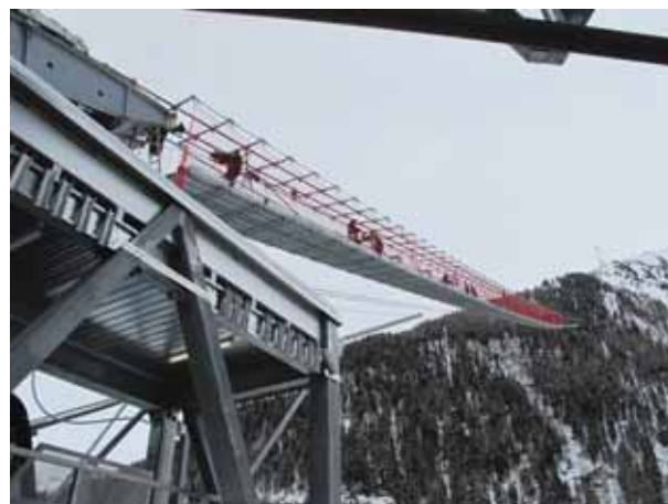
Le 3 janvier, les hommes fixent le câble-tracteur, perchés sur une passerelle de 60 mètres.