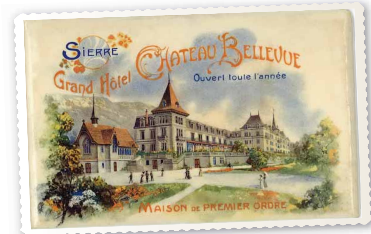
Ce dessin représente l'Hôtel de Ville de Sierre vers 1911. On reconnaît tout à gauche la chapelle qui était destinée au culte anglican. DR

C'est une toile du peintre Charles Louis Guigon (1807-1882) réalisée vers 1860. On y voit le lac de Géronde et un gros rocher qui se trouve toujours devant le Restaurant de la Grotte. Au centre de l'image, on distingue une tour polygonale coiffée