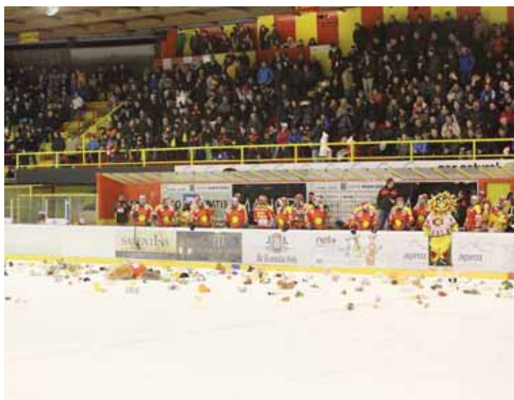
Sierre - Anniviers: des dizaines de peluches ont été envoyées sur la glace. Elles ont été données à SOS Enfants de chez nous.