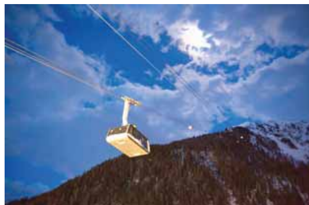
Le 9 janvier, la cabine fait son premier trajet entre Grimentz et Zinal. ALBAN MATHIEU