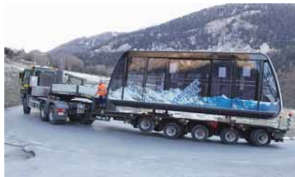
Le 16 décembre 2013, les cabines prennent le chemin du val d'Anniviers. REMO