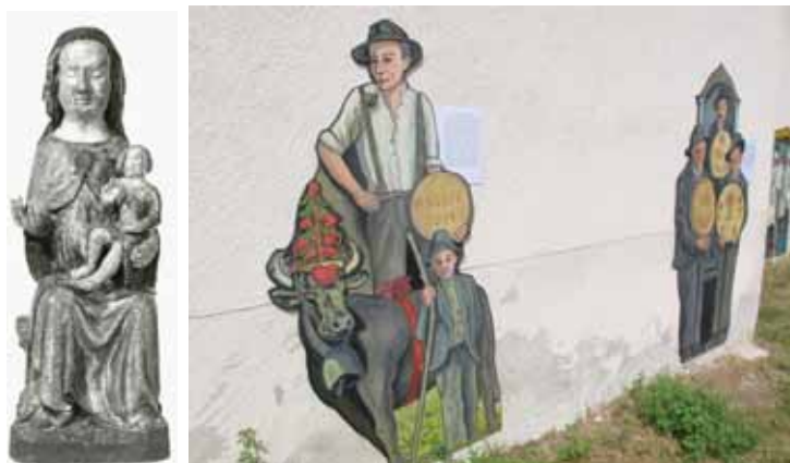
«La Vierge à l'Enfant» et deux des 28 panneaux de Roger Theytaz.

Du mercredi au dimanche de 14 h à 17 h 30.