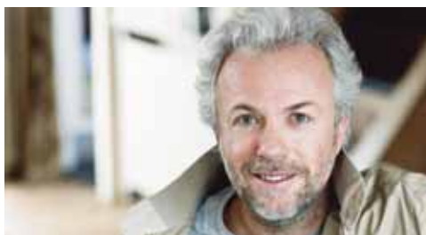
Frédéric Lenoir donne une conférence au Régent samedi 12 juillet à 17 h 30.