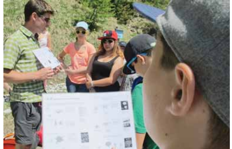
La balade avait aussi un objectif pédagogique. LE JDS

la nature. On veut leur montrer que c'est fun de vivre avec elle», souligne le résident de Saint-Luc. Certes, la nuit est fraîche et le lever de soleil un peu précoce au mois de juin, mais le calme et la beauté simple de cet alpage compense largement ces petits inconvénients.