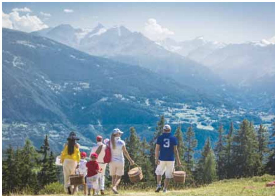
Crans-Montana offre un panorama exceptionnel et veut favoriser les activités estivales: 40% de ses nuitées proviennent du tourisme d'été. GREGORY BATARDON

Outre les grands classiques de l'été – open de golf ou randonnées pédestres – CMTC a étoffé son offre et propose plusieurs nouveautés. Un accent particulier est mis sur la culture. L'ouverture du Centre d'art de la Fondation Arnaud à Lens, en décembre 2013, a attiré 21 500 visiteurs. L'exposition estivale, qui