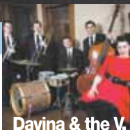
Davina & the V.