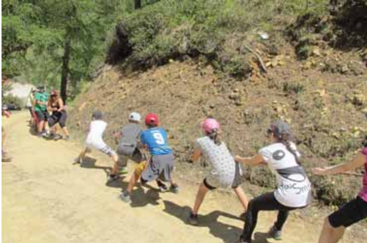
Des activités et des concours ont animé la sortie. LE JDS