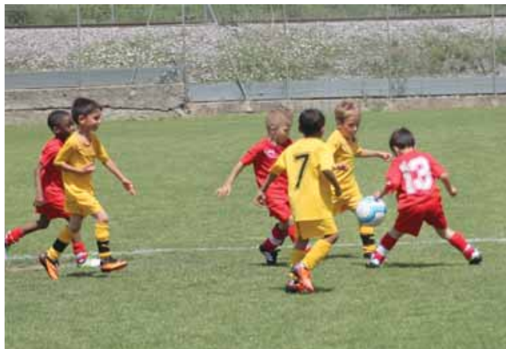
Plus de 80 enfants composent l'école de foot du FC Sierre.

De cette école de foot sortent chaque saison assez de joueurs pour alimenter deux équipes de juniors E. Mais le FC Sierre ne travaille pas seul. Le groupement juniors articulé autour des Sierrois se compose de Chippis, Miège, Noble-Contrée et Crans-Montana. «C'est désormais une