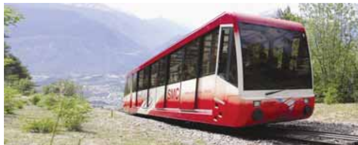
Le funiculaire a transporté 347 000 voyageurs en 2013, une hausse de 1,4%. Ce sont les lignes de bus qui ont connu une diminution de leur fréquentation.

Les lignes de bus et le funiculaire ont emmené un total de 1,32 million de voyageurs en 2013. Plusieurs facteurs expliquent une légère progression négative: des considérations économiques, l'année scolaire 2013 a compté une semaine en moins en juin, et l'ab-