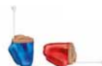
Phonak Virto Q

Places de parc et ascenseur à disposition.