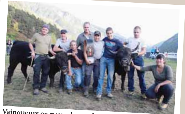
Vainqueurs ex æquo du combat de Niouc, «Nuage» et «Bellatola» avec les propriétaires. REMO