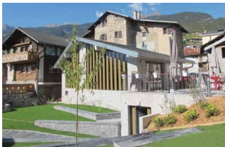
Les caveaux proches de l'Espace terroirs (photo), tenus par les sociétés villageoises, ouvrent leurs portes pour l'inauguration du 25 octobre.

MIÈGE Les dernières pierres sont posées, les arbres sont plantés, le tapis de verdure est déroulé, tout est prêt pour l'inauguration officielle de l'Espace terroirs miégeois qui se tiendra le 25 octobre. Le visiteur pourra découvrir un espace dédié aux terroirs viticoles valaisans mais pas seulement. Il pourra y trouver également un concept «Terre et Vins» accueillant, qui permettra à des groupes d'entreprises ou d'amis d'allier travail, découvertes, plaisir et gastronomie dans un cadre convivial. Pour marquer cette inauguration d'une pierre blanche, le rendez-vous du 25 octobre ouvre ses portes et ses caveaux et invite le visiteur à venir découvrir un village tout entier et à faire plus ample connaissance avec ses sociétés, ses mets et vins de la région et ses ambiances musicales. Cinq caveaux tenus par les sociétés villageoises (fanfare, gym et uni-hockey, football, tir et ski-club) présenteront chacun un cépage spécifique et le visiteur pourra déguster et comparer le cépage de plusieurs encaveurs dans chaque caveau. Munis d'un verre et d'un passeport de dégustation, vous partirez à la découverte du cornalin, de l'hermitage, de la petite arvine, de la syrah et du païen. Il y aura également un bar de carnaval et un bar des jeunes «Nomad», sans oublier les ambiances musicales au centre du village. Le programme: 17 h 30, inauguration de l'Espace terroirs; 18 h 30, bal avec le duo Alain-Clé-