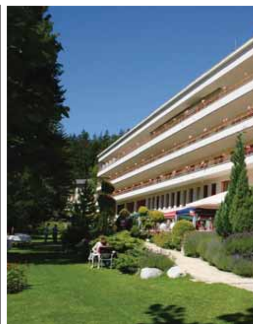
Le Centre valaisan de pneumologie aujourd'hui. LE JDS

Son coût atteint 2 351 148 francs, dont plus d'un million offert