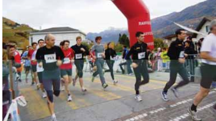
Ils viennent de partout pour courir afin d'aider les enfants atteints de mucoviscidose.

Donnez-leur le souffle de vie! C'est le beau slogan du Marchethon, marche et course populaires basées sur le principe du parrainage. Vous choisissez vous-même votre parcours – 2, 5, ou 10 kilomètres – et demandez à des parrains de verser un montant par kilomètres que vous parcourez (minimum 1 fr. par km). Des récompenses seront attribuées à ceux qui amèneront le plus grand nombre de parrains de même qu'aux trois premiers de chaque catégorie, alors tous les participants recevront un prix souvenir. La possibilité est, bien entendu, également donnée de se parrainer soi-même.