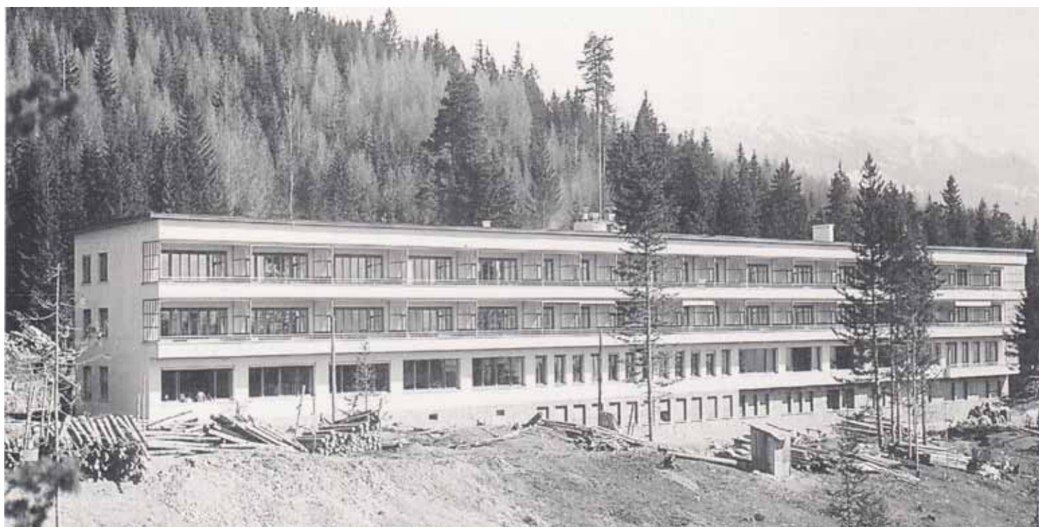
Le sanatorium valaisan en construction en 1940 après des années d'avatars successifs, relégué dans une forêt pour ne pas effrayer les touristes.