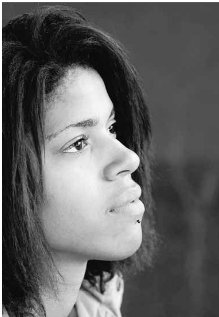
Daisy est revenue aux autres et au monde aussi grâce à l'écriture. THIERRY GASPARDI

Suite à la disparition d'une personne de son entourage, Daisy se met à écrire. A 14 ans, c'est une première bouffée d'air: «Au moment