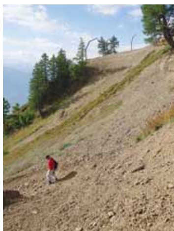
La piste du Mont-Lachaux sera toujours aussi difficile en 2016.