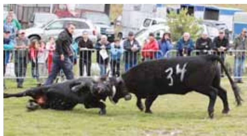
«Blairon» ne lâche rien face à «Bellatola». REMO