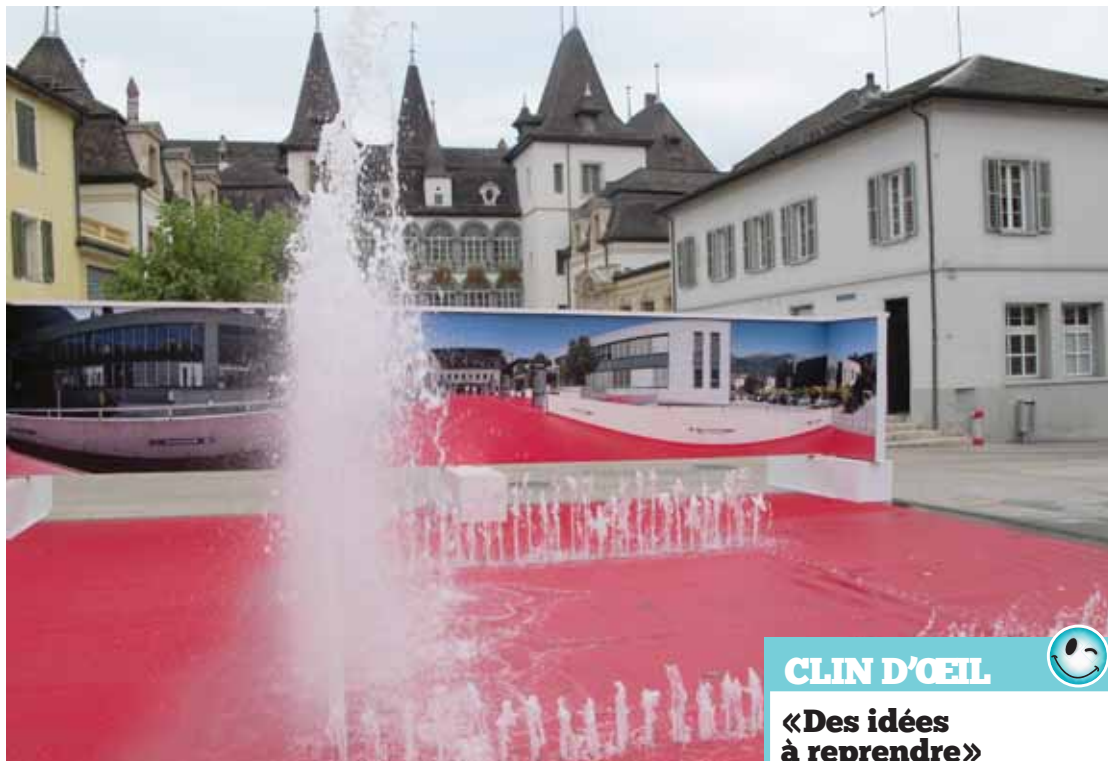
Le Sentier des 25 ans démarre à l'Hôtel de Ville sierrois où est présenté le parc technologique Techno-Pôle. LEJDS

SIERRE Pour fêter son quart de siècle, le parc technologique de Sierre s'approprie le centre-ville pour une exposition et une balade jusqu'aux portes du Techno-Pôle. Jusqu'au 26 octobre, l'anniversaire se décline en trois tableaux. Sur la place de l'Hôtel-de-Ville, il y a d'abord la présentation des entreprises de Techno-Pôle sur d'immenses tableaux; le visiteur y découvre le destin de chaque entreprise implantée au parc technologique, l'évolution des emplois, l'extension des bâtiments et les témoignages des acteurs. Puis quittant le cœur de la cité, ce même visiteur emprunte le «Sentier des 25 ans» qui sillonne la ville à travers vignes, lacs et collines. Jalonné de 20 panneaux explicatifs, il vous fait découvrir quelques joyaux des patrimoines architectural, culturel et industriel de Sierre avant d'arriver dans le cœur de Techno-Pôle. Le long du parcours, le promeneur est appelé à répondre à des questions en lien avec les lieux qu'ils visitent et l'histoire du Techno-Pôle. Un vélo électrique viendra récompenser le gagnant du concours du Sentier des 25 ans.