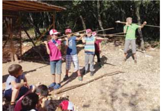
Sur le site préhistorique d'Orgnac, on s'essaie à lancer des sagies.