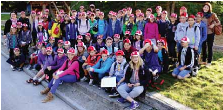
Avant de partir pour la France, les écoliers de Veyras posent pour la photo-souvenir.

foot Suisse-France; la Suisse a gagné et les Français se sont énervés.» «Quand nous sommes partis d'Ardèche, on se retenait de pleurer.» «Quand nous sommes rentrés à Veyras-Suisse, les parents pleuraient... presque.»