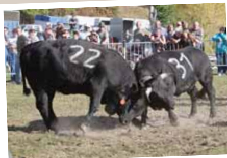
«Rodo» et «Melodi» font comme les «grandes». REMO