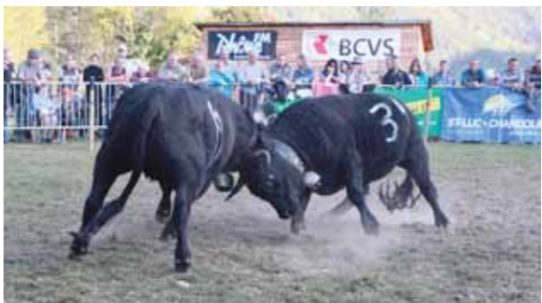
Lutte acharnée entre «Nuage» et «Bellatola». REMO