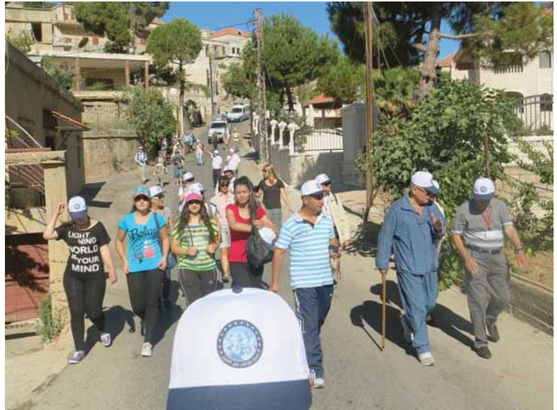
La marche vers Rachaya, proche de la Syrie. Le groupe est précédé d'un général, un maire chrétien et un maire druze, précédé encore d'un père maronite et escorté par l'armée et la police locale.