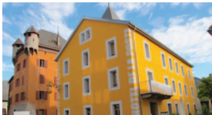
L'hôtel mythique situé au centre-ville de Sierre est le deuxième restaurant «Boas Swiss Hotels» qui est primé dans le guide. LEJDS

SIERRE En 1766, la bâtisse s'appelait l'Auberge du Soleil. Lucien Lathion, qui s'intéressait particulièrement aux séjours valaisans de grands noms de la littérature, mentionne dans un de ses ouvrages, le passage de Chateaubriand et de Goethe dans ces lieux.