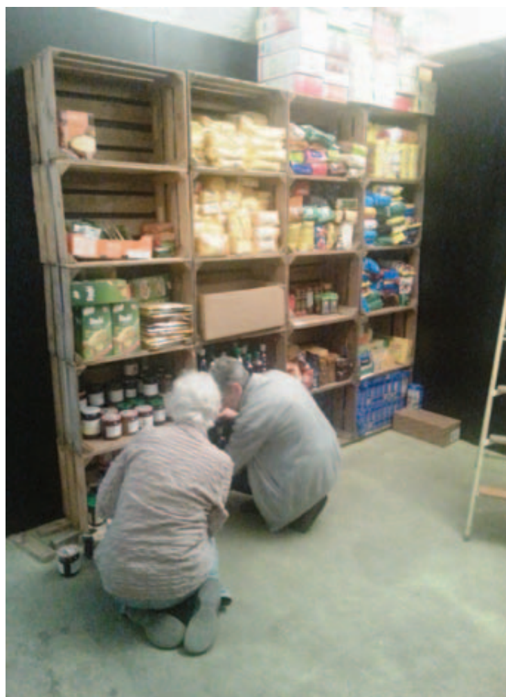
Une fois triées, les victuailles remplissent les étals du magasin et constituent son stock de base.

Les ressources de ce service sont les dons, les produits des ventes de bougies et de lumignons, les Cartons de la solidarité bien sûr, et les