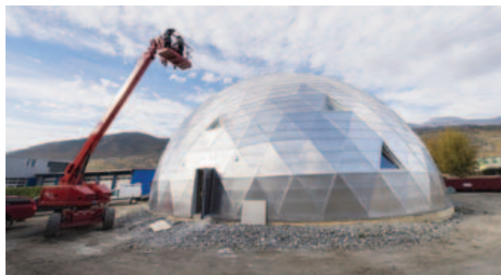
La technique utilisée pour la construction du dôme a demandé des prouesses techniques et de pointus calculs d'ingénieurs. SACHA BITTEL

GRANGES 25 mètres de diamètre, une hauteur centrale de 12 m 50, une surface au sol de 400 m 2 , telles sont les impressionnantes dimensions du dôme construit par l'entreprise Texner à deux pas de ses locaux d'aujourd'hui. «Habituellement, les dômes sont de taille bien plus raisonnable et destinés à une utilisation temporaire lors de manifestations. Mais