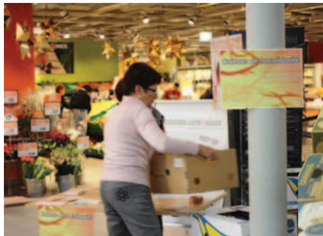
Aujourd'hui et demain, les bénévoles de Sierre Partage vont récolter des denrées alimentaires pour aider ceux qui sont dans le besoin. GREGOIRE FAVRE

sonnes en situation de détresse», souligne la coordinatrice. Les personnes qui se trouvent en urgence sont prises en charge par le service, qui fait le nécessaire immédiatement afin de les soulager par des mesures adéquates: un billet de train jusqu'à la frontière, un plein d'essence, une nuit à l'hôtel avec un petit-déjeuner et un souper simple ou une aide alimentaire. «Il nous arrive aussi d'aider ponctuellement une famille en prenant en charge une facture de chauffage, d'électricité, un loyer, la note du dentiste ou la cotisation de la caisse maladie», raconte Madame Partage. Chaque année, c'est un montant de près de 20 000 francs qui est distribué ainsi à ceux qui sont dans le besoin.