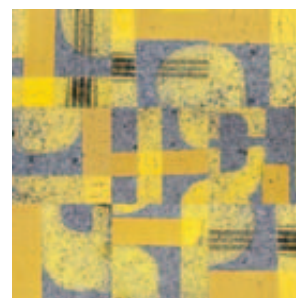
Une composition de Bernhard Lochmatter.