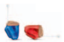
Phonak Virto Q

Places de parc et ascenseur à disposition.