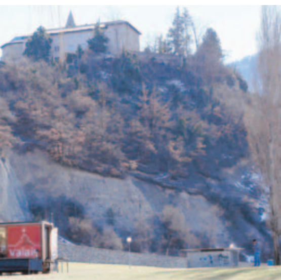
LE DÉCOR. Au pied de la colline de Géronde, le Cube porte fièrement les couleurs du Valais. REMO