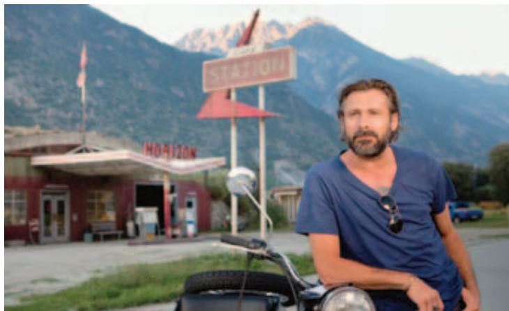
Quelque part dans le Haut-Valais...

Des ranchs aux églises, des bars au chantier de l'autoroute A9, le rêve américain n'est jamais loin. Station Horizon est la rencontre de personnages hors du commun dans cette Suisse qui fantasme un ailleurs mais s'y trouve finalement chez elle. Pour vous mettre l'eau à la bouche, voici un résumé de