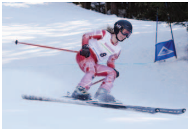
Le Trophée de la Bella-Tola se déroule sur la piste du Prilet, d'une longueur de 5850 mètres. Un effort intense.

viennent de faire une découverte: ils ont retrouvé la coupe attribuée à la catégorie «équipes», qui avait disparu depuis plus de trente ans. Un team genevois avait tout simplement oublié de la rendre après l'avoir gagnée. Elle sera remise en jeu pour cette édition 2015.