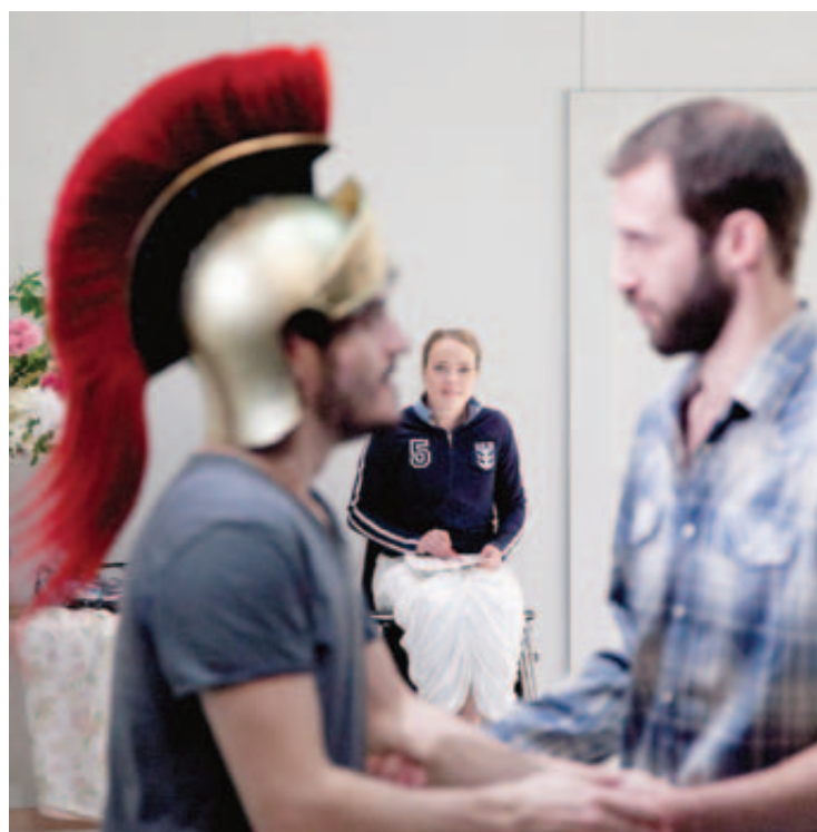
Alexandre Doublet a mis en scène des acteurs en répétition.