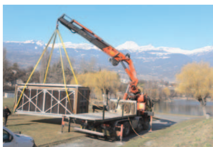
L'ARRIVÉE DU CONVOI 2. La grue se déploie et décharge l'importante cargaison à un emplacement précis. REMO