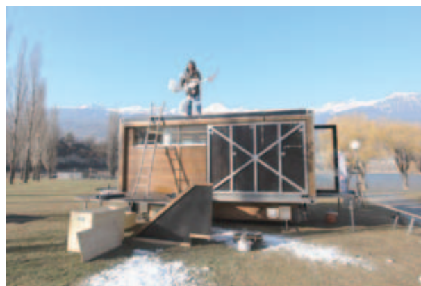
LE NETTOYAGE. Un dernier coup de pelle pour enlever la neige du toit. REMO