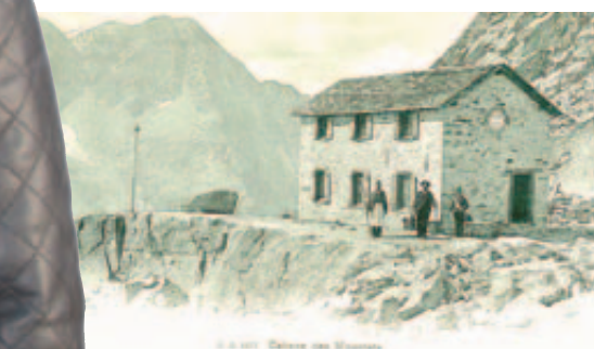
ou une vue de la cabane du Grand Mountet