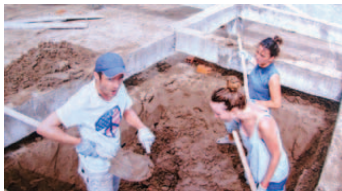
Avec un taux d'humidité record, pas facile de manier la pelle.