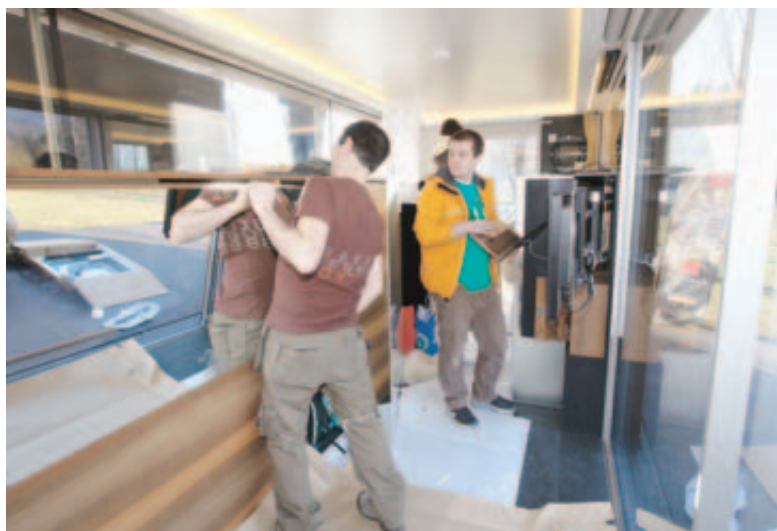
L'INTÉRIEUR DU CUBE. Les derniers réglages avant l'arrivée des convives. REMO