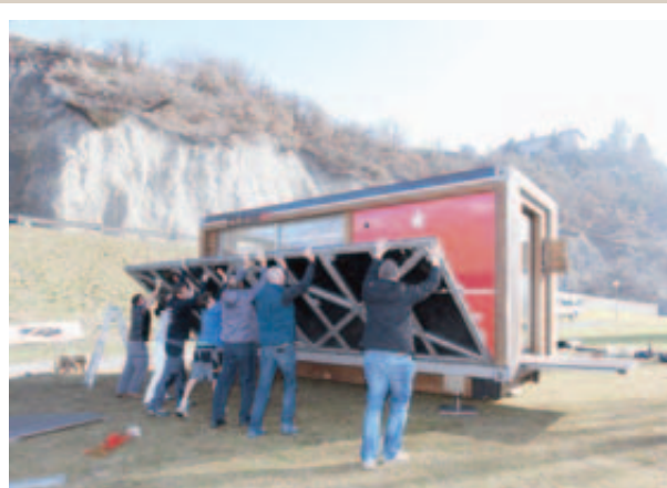
LES PRÉPARATIFS. A plusieurs, on est beaucoup plus fort! REMO