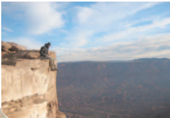
...du Castleton Tower, en Utah car nos alpinistes sont aussi des voyageurs...