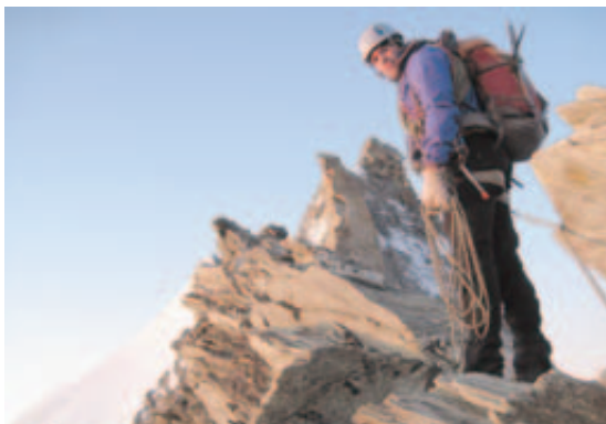
Sur les panneaux: des photos de l'ascension de l'arrête nord du Weisshorn...