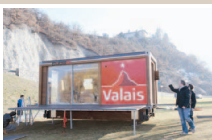
LES PRÉPARATIFS. Il faut penser à tout pour que l'installation se déroule dans les meilleures conditions. REMO