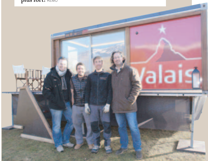
LE COLLECTIF. Une partie de ceux qui mettent tout en place pour que le Cube soit plus beau que jamais. REMO