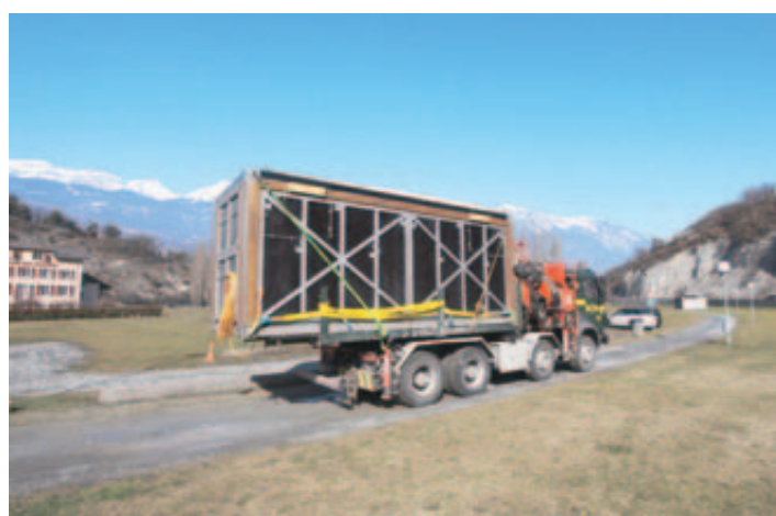
L'ARRIVÉE DU CONVOI 1. Le camion s'approche du lac de Géronde où le Cube prendra racine durant toute une semaine. REMO