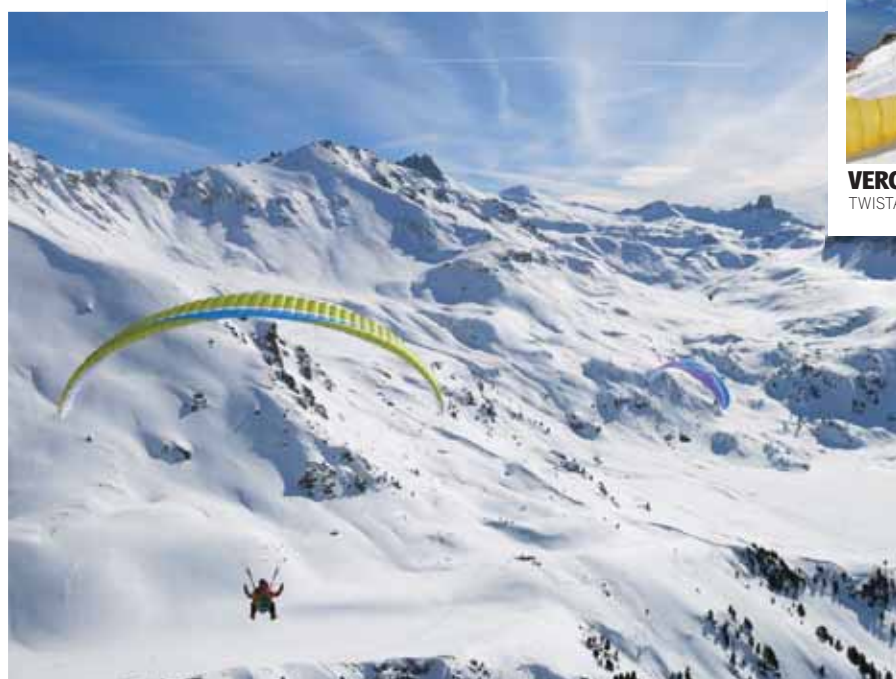
VERCORIN 150 pilotes ont testé les modèles 2015 lors de la traditionnelle Vercotest. TWISTAIR