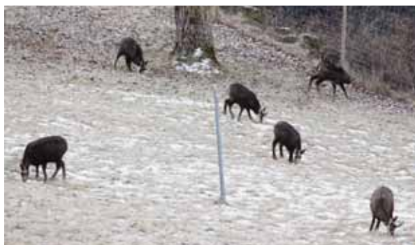
On croit souvent que les chamois se cantonnent à la haute montagne. La preuve que non puisque notre photographe les a croisés à la hauteur des Pontis. REMO