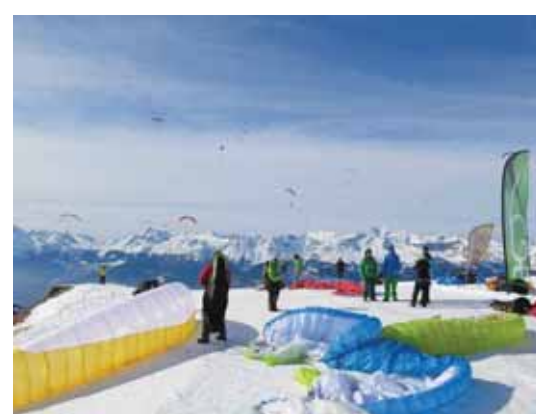
VERCORIN Féerie de couleurs au Crêt-du-Midi. TWISTAIR