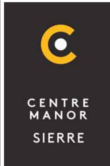
Un nouveau logo pour Manor.DR