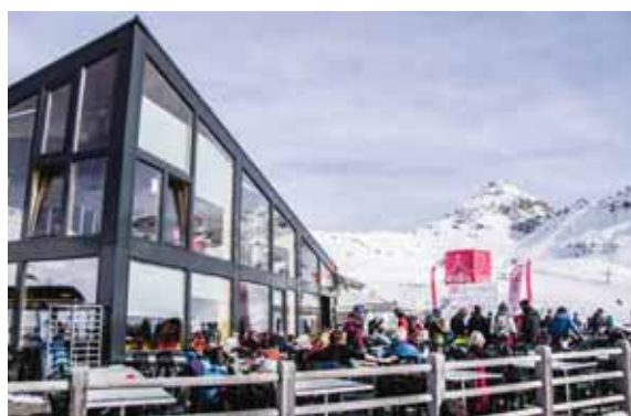
CHANDOLIN La terrasse du restaurant du Tsapé, avec animations et commentaires des courses en direct. ROMAIN DANIEL