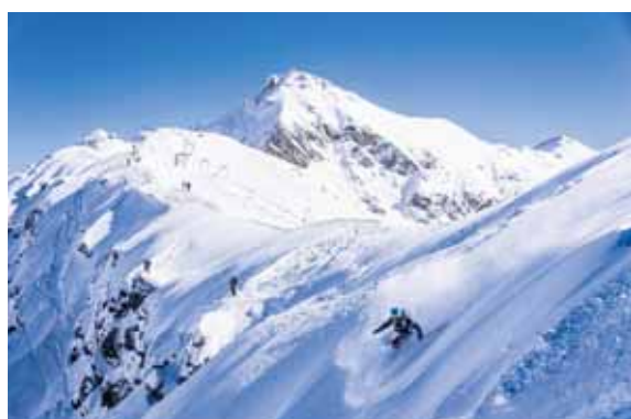
CHANDOLIN Un site de compétition exceptionnel qui offre aux athlètes le choix entre deux départs avec différents degrés d'engagement. ROMAIN DANIEL