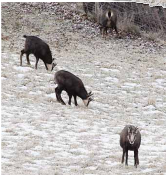
Le premier chamois du trio a, semble-t-il, reconnu le photographe. REMO