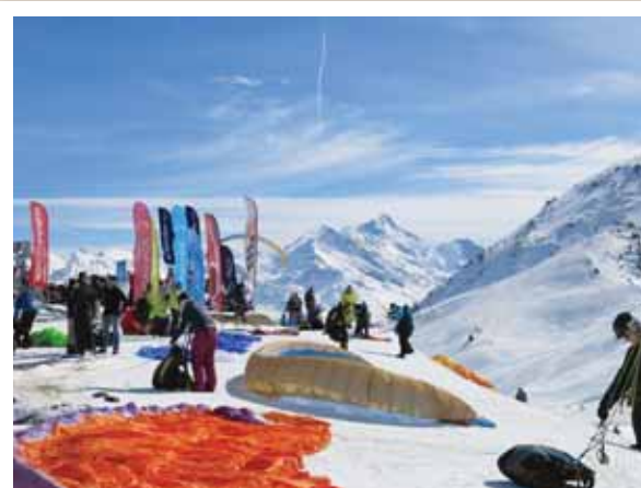
VERCORIN Le salon du parapente, c'est l'occasion pour les constructeurs de mettre en avant leur matériel. TWISTAIR