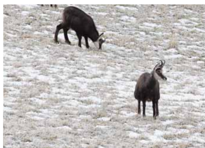
Même pas peur du froid puisqu'une température de -25 degrés les laisse parfaitement indifférents. REMO

Le mammifère n'hésite pas à descendre à la limite des neiges en hiver. REMO