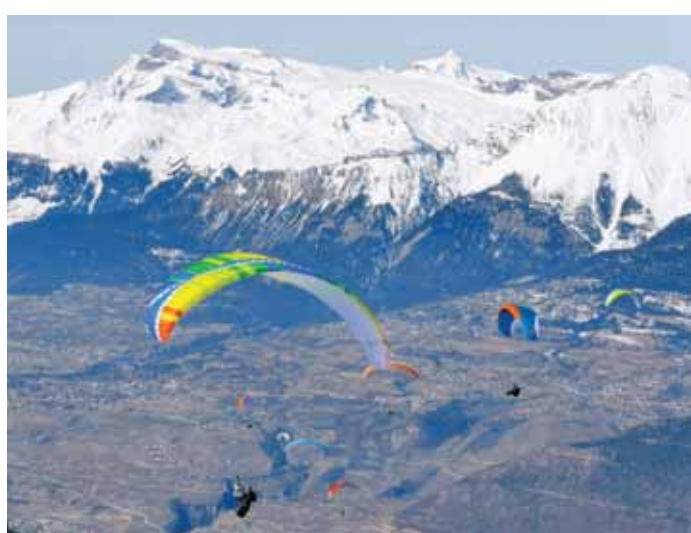
VERCORIN Par dizaines, ils se sont lancés dans le vide en direction de la plaine du Rhône. TWISTAIR