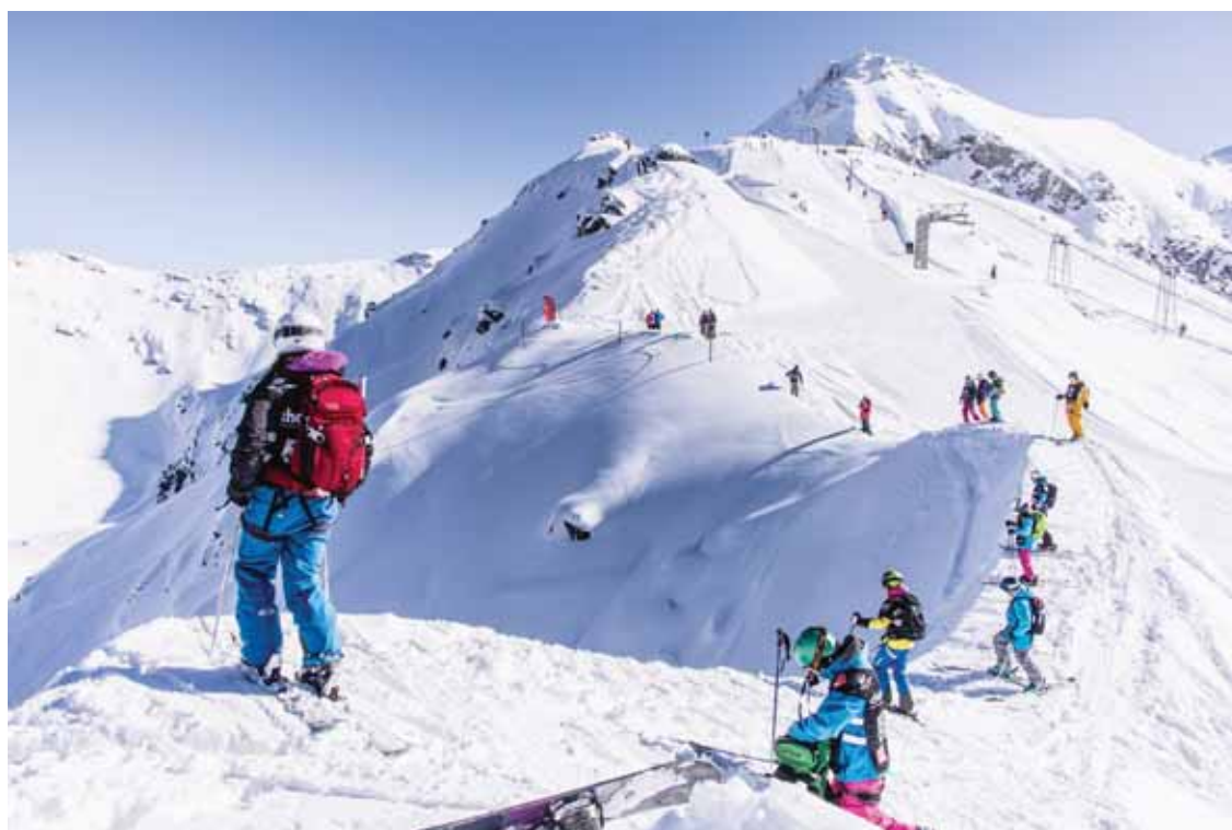
CHANDOLIN Le First-Track Freeride de Chandolin/Saint-Luc est un tremplin pour le fameux Freeride World Tour. ROMAIN DANIEL