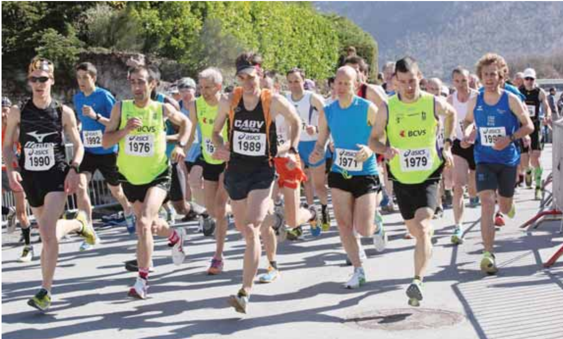
Les élites, tout comme la catégorie entreprises, s'élanceront à 11 h 40 depuis Goubing. REMO