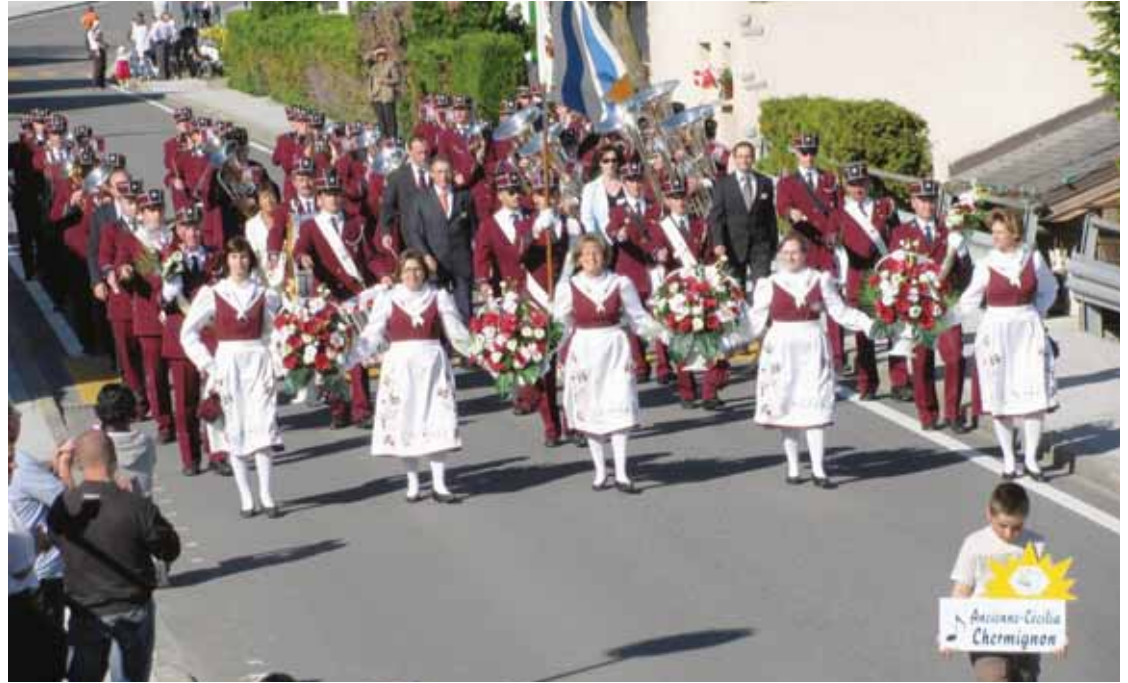
L'Ancienne Cécilia en 2009 lors du dernier grand festival qui s'est déroulé à Chermignon. Cette année-là, c'est la Cécilia qui accueillait la manifestation.

rons. «Cette grande fédération qui se voulait apolitique a vécu son dernier festival en 1947, à Chermignon. A ce moment-là, elle regroupait les sociétés actuelles de la FMSL, mais aussi les fanfares de Bramois, Aproz, Mase, Savièse et Ayent», explique Philibert Duc. La même année, une scission au sein de la fédération conduit à la naissance de deux nouvelles entités: la Fédération des musiques du Valais central d'un côté, la Fédération des musiques des districts de Sierre et Loèche de l'autre. Deux groupements qui, en regard d'autres fédérations du canton, présentent encore à ce jour la particularité d'être politiquement neutres.