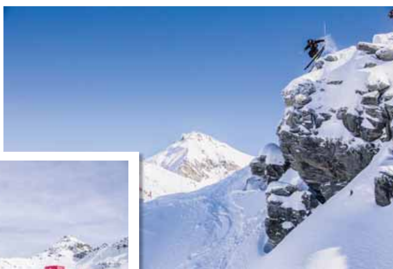
CHANDOLIN Les caractéristiques naturelles, organisationnelles et géographiques du lieu donnent à cette compétition son essence freeride et une excellente renommée dans le milieu des sports de glisse. ROMAIN DANIEL