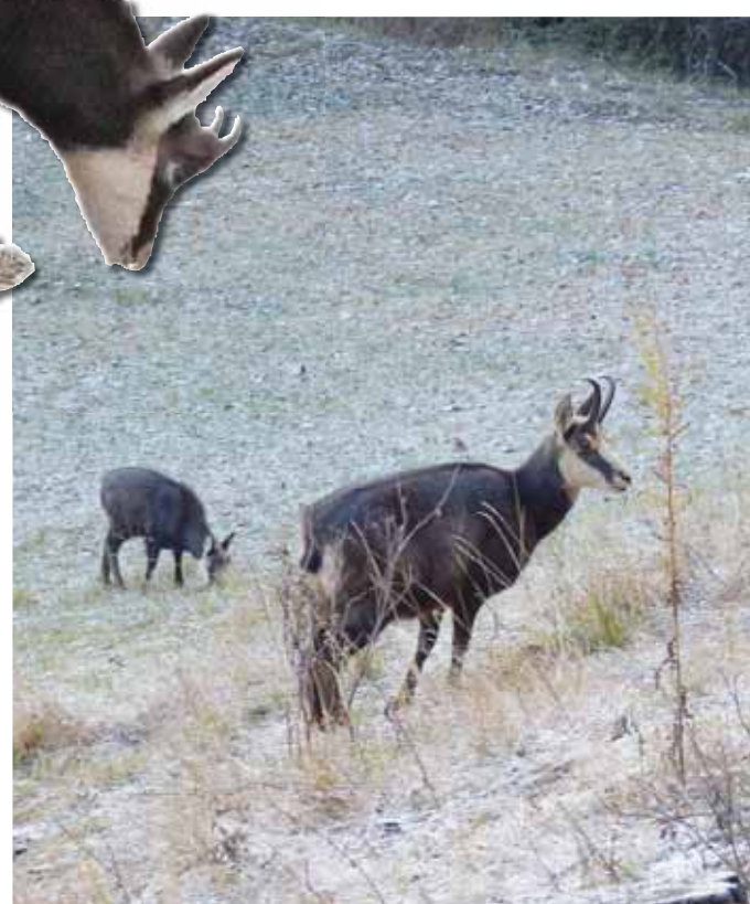
Sa vue lui permet de distinguer un mouvement à près de 500 mètres. REMO