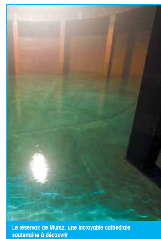
Le réservoir de Muraz, une incroyable cathédrale souterraine à découvrir

Tout d'abord un livre intitulé «En phase avec sa région» a été consacré à l'histoire de Sierre-Energie, au travers des métiers et des personnes qui la font vivre. De plus, un nouveau site internet, www.sierre-energie.ch , a été mis en ligne fin 2014. Rafraîchi de fond en comble, tant au niveau du look que de son contenu, il apporte de nombreuses informations utiles à notre clientèle et permet également d'effectuer plusieurs démarches en ligne.