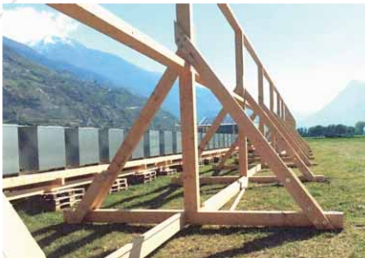
Des dizaines de lignes de tir ont été installées dans le Haut-Valais.

Le comité d'organisation (présidé par Christophe Darbellay), mis sur pied dans le but de préparer la Fête fédérale de tir 2015, est occupé à la planification de cette grande manifestation depuis juin 2011. Il est composé de membres passionnés de tir disposant d'un large réseau relationnel et de grandes compétences dans leurs domaines. Il est complété par des spécialistes externes.