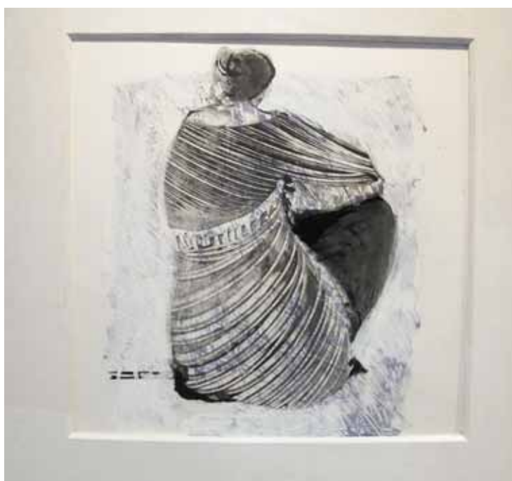
«Jupe noire», le monotype a servi pour l'affiche. Le peintre gratte la peinture sur la plaque, qui réserve des surprises après l'impression.

Jusqu'au 24 mai du jeudi au dimanche de 15h à 18h.