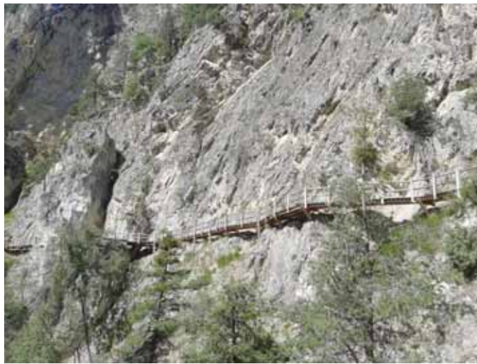
Le bisse est par endroits très spectaculaire. ANDRÉ ABBÉ