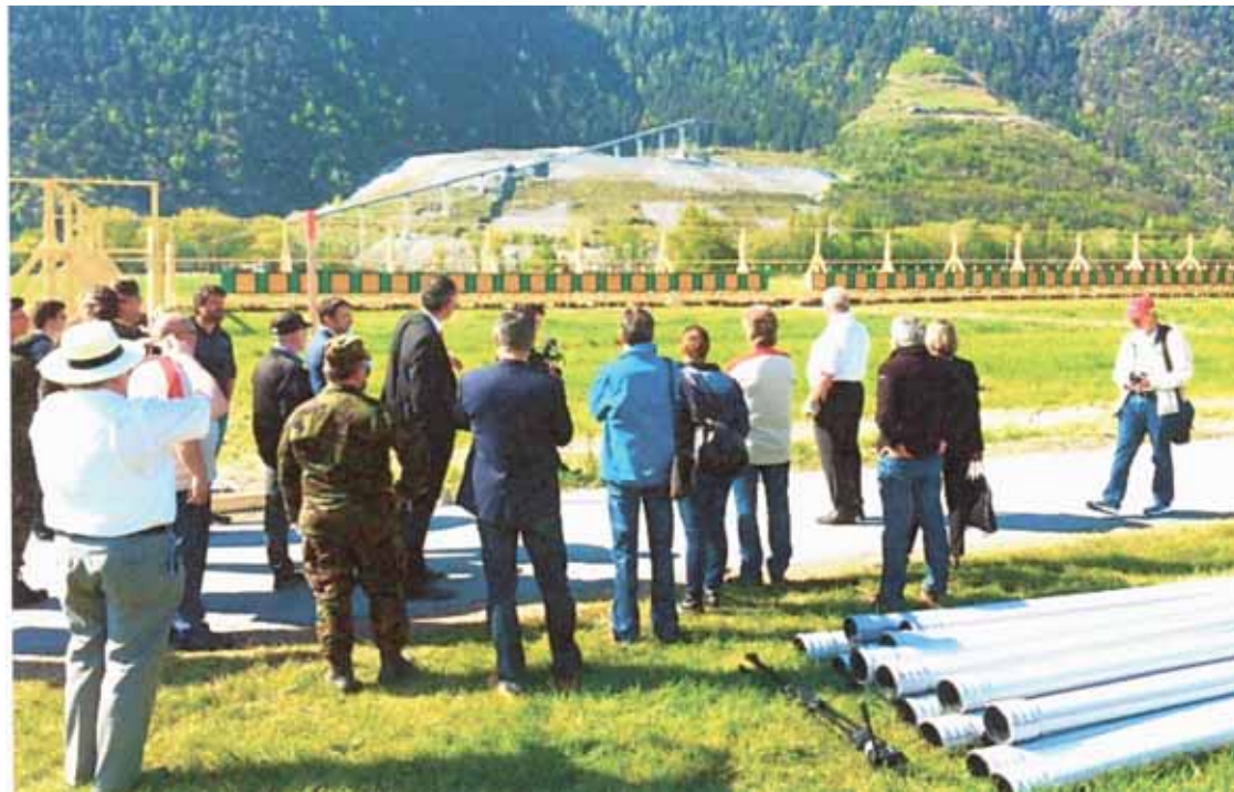
Il y a quelques jours, la presse a visité les installations de Rarogne-Viège.