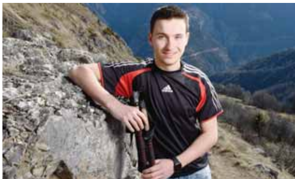
La course inaginée par Florent Zablotz partira des hauts de Réchy pour se terminer au refuge du Bisse à l'entrée du vallon de Réchy.

Renseignements et description du parcours: www.kmverticalrechy.com