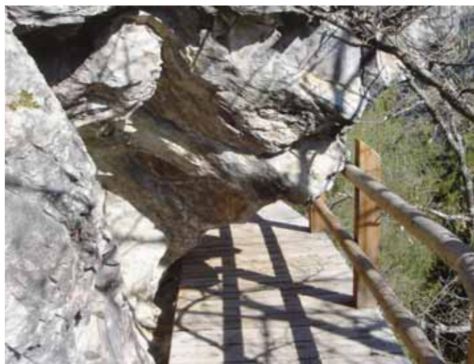
Il faut compter 4 heures de marche pour relier Pinsec à Vercorin par le célèbre bisse.