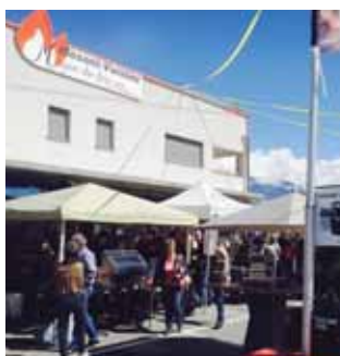
Beaucoup de monde aux portes ouvertes. LE JDS

A travers cette journée, c'est aussi la diversité des commerces de la place qui a été mise en avant.