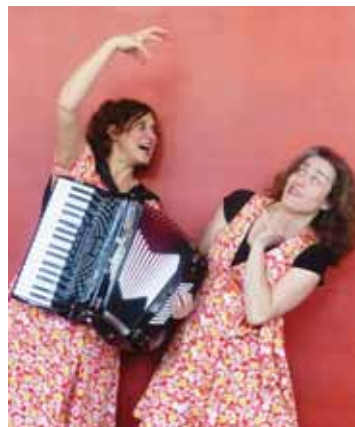
Histoire et chansons.

Réservation 079 403 63 92. ou info@touranniviers.ch