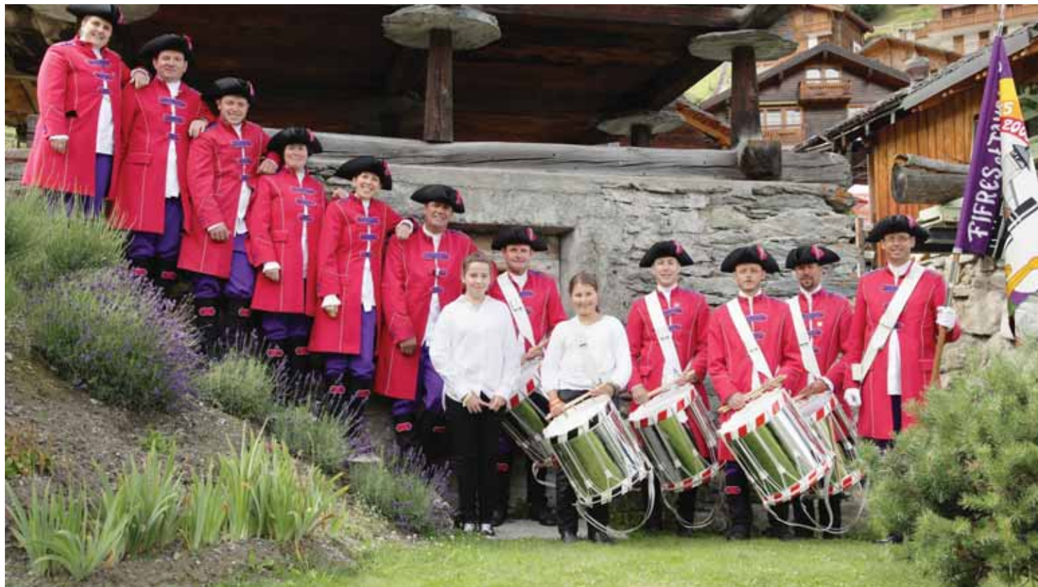
Les Fifres et tambours de Grimentz fêtent leur 50e anniversaire. SYLVIE LIAND-SAVIOZ