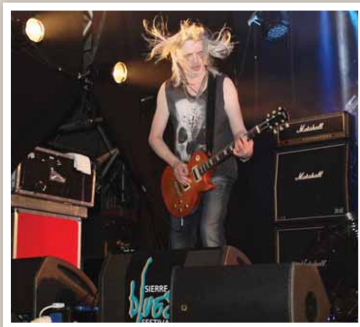
Les dinosaures de Nazareth, une pêche d'enfer pour lancer la manifestation mercredi soir. REMO