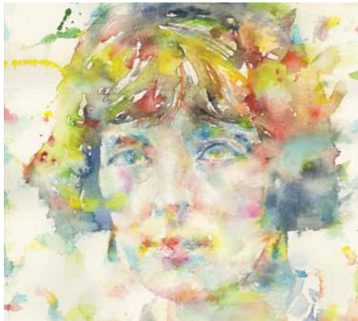
Un portrait de Katherine Mansfield par l'artiste milanais Lautir, reproduit avec son aimable autorisation.