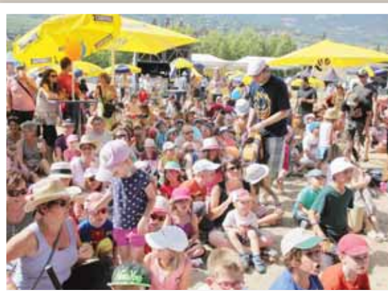
Enfants et familles attendent patiemment l'arrivée d'Henri Dès.