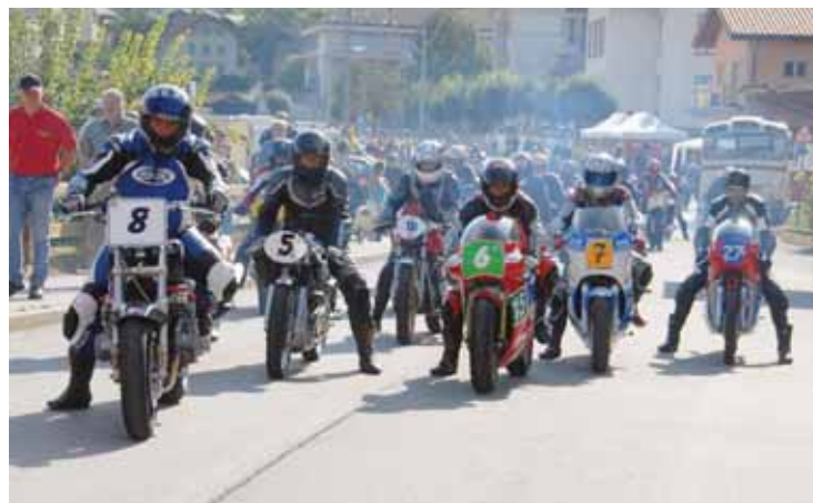
Des motos de l'époque seront également au départ.