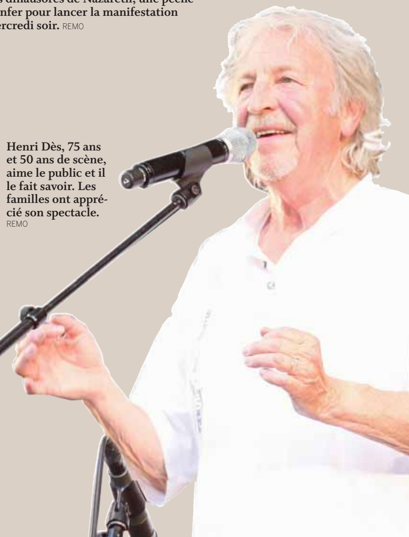
Henri Dès, 75 ans et 50 ans de scène, aime le public et il le fait savoir. Les familles ont apprécié son spectacle.