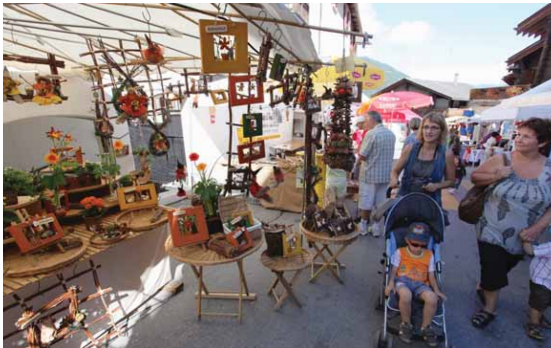
Les artisans invités à Vissoie présentent chaque année de très belles œuvres. REMO

Samedi 18 juillet: ouverture du marché dès 9 heures avec plus de 80 exposants; présence de Rhône FM le samedi matin de 9 h à 12 h 30 pour fêter le 30 e anniversaire; cantines, roulotte à bière et bar ouvert dès 10 heures. Pour les enfants, le clown Turlututu, des grimages, de la musique avec la Bande à Loulou sont annoncés. Pappy Jo et son orgue de Barbarie sont également de la partie. Le samedi soir à la place de la Tour,