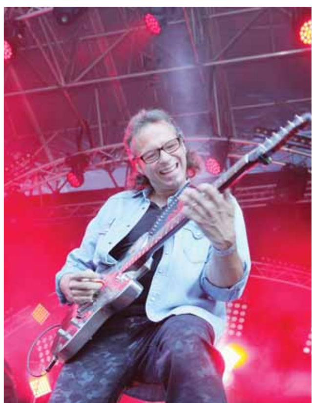
La grande scène en 2015 pour le groupe local The Blues Mystery. REMO

LA QUALITÉ DES GROUPES ENGAGÉS ÉTAIT LÀ. SOUS UN SOLEIL CERTAINS GROUPES DE L'AFFICHE 2015.