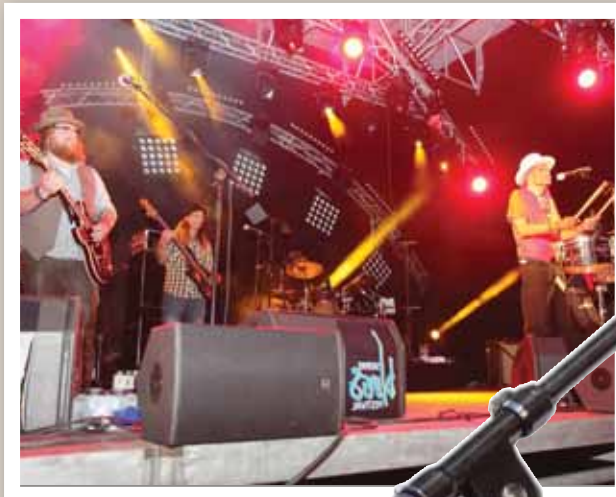
Royal Southern Brotherhood et leur rock sudiste, la tête d'affiche du jeudi soir.