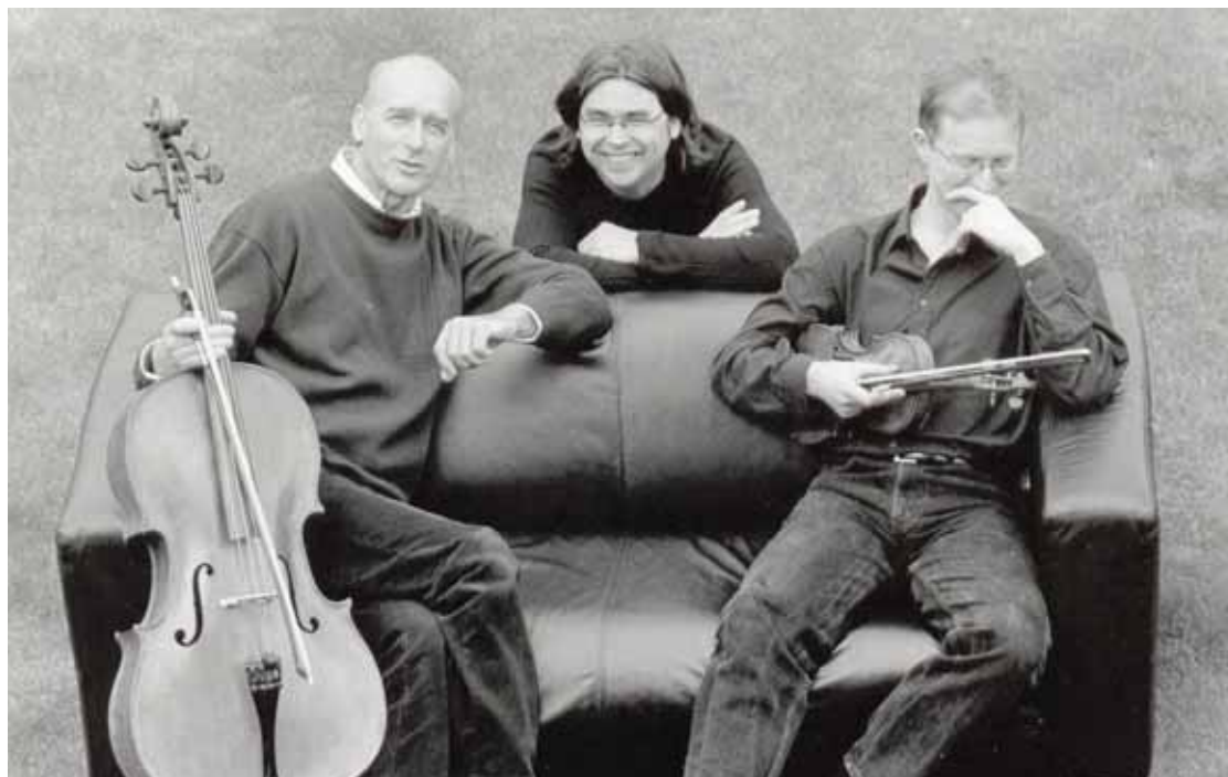
Le Trio Portici est le pilier du festival depuis ses débuts.

GRIMENTZ Du jeudi 30 juillet au dimanche 2 août 2015, la très belle église de Grimentz accueillera la sixième édition du FestiVal d'Annivers, dans une programmation essentiellement consacrée à la musique de chambre, répartie sur cinq concerts. Particulièrement attachés au cadre exceptionnel d'un authentique village valaisan, les organisateurs ont aussi à cœur de favoriser le contact entre le public et les artistes, dans l'atmosphère décontractée et conviviale d'une petite église de montagne. Poursuivant dans la ligne des éditions précédentes, qui ont connu un accueil enthousiaste et un succès croissant de la part du public, le festival, sous la direction artistique du pianiste belge Stéphane de May, Grimentzard de cœur, réunira des musiciens de réputation internationale et des jeunes talents issus de la Haute école de musique de Lausanne, section Sion, qui participeront à chaque concert. C'est un orchestre, les Swiss Classic Players, qui ouvrira les festivités du premier soir. Réunissant des jeunes musiciens internationaux que leur talent exceptionnel désigne comme les grands de demain, cet ensemble dirigé par Jan Dobrzewski ex-