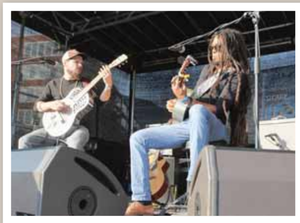
On attendait avec impatience The Two et ils ont été à la hauteur des attentes du public. REMO

SIERRE QUELQUE 11 000 FANS ONT SUIVI LE SIERRE BLUES FESTIVAL. C'EST MOINS QU'EN 2014. POURTANT DE PLOMB, LES BARS ET TERRASSES DU CŒUR DE LA VILLE ÉTAIENT NOIRS DE MONDE POUR ÉCOUTER EN LIVE