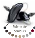
Palette de couleurs

Le nouveau Phonak Audéo V – la vie, sans souci.