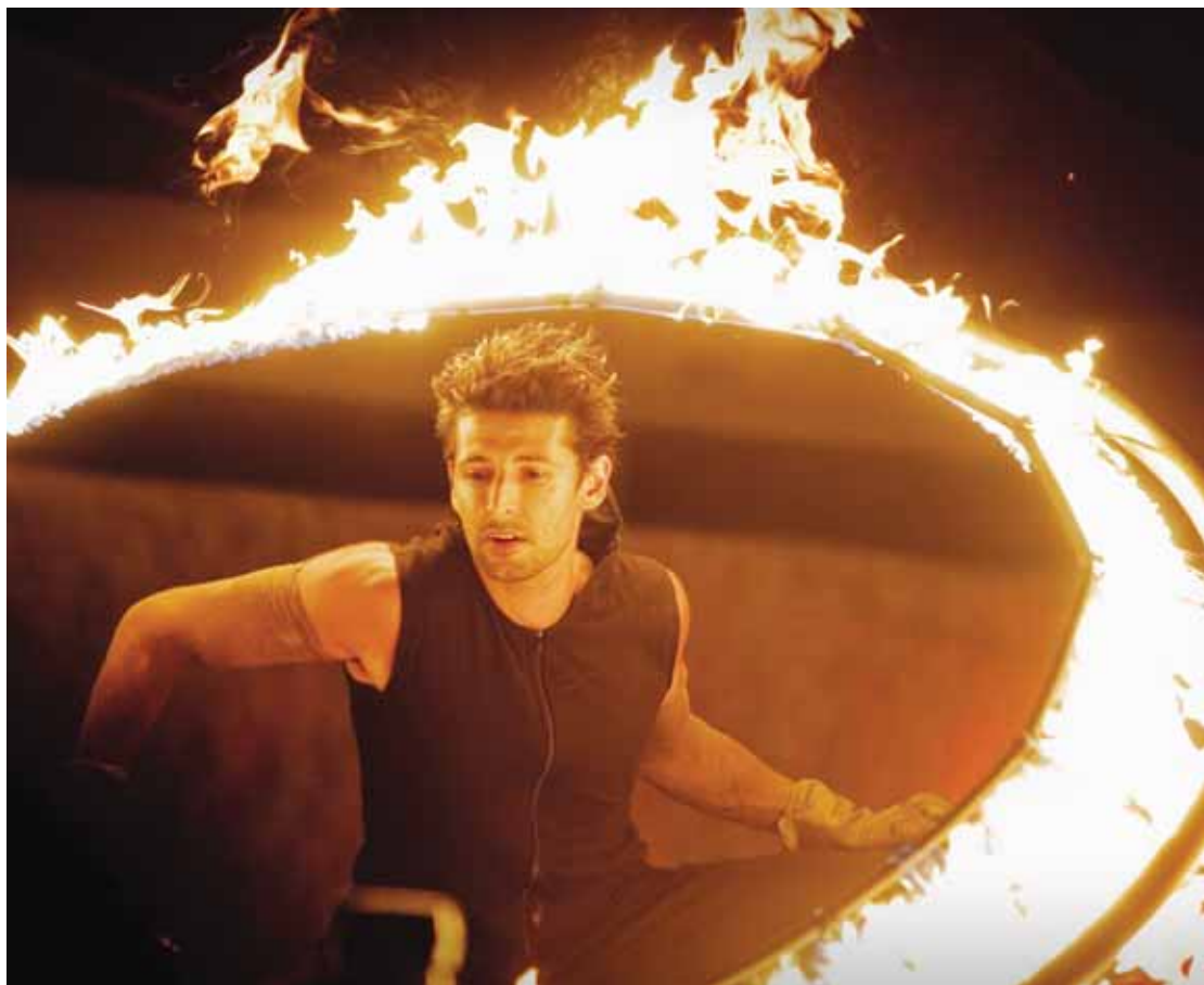
Entre deux concerts au centre-ville de Sierre, un spectacle de feu...