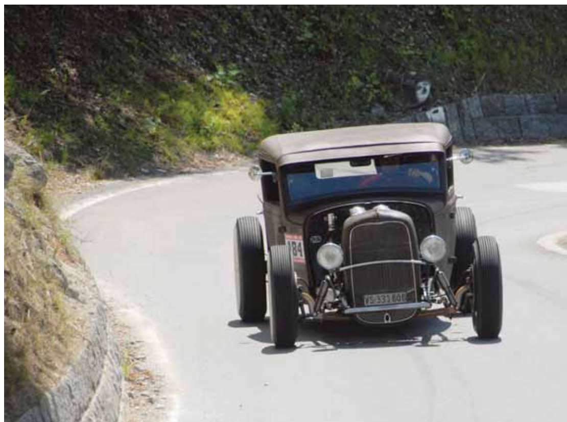
Des voitures légendaires prendront part à la 5e édition du Mémorial, les 8 et 9 août prochain.