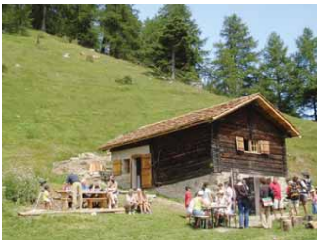
Ponchet, un petit paradis pour les familles et les petits.

Arrivés à Ponchet, les enfants recevront une petite surprise «gustative» en présen-