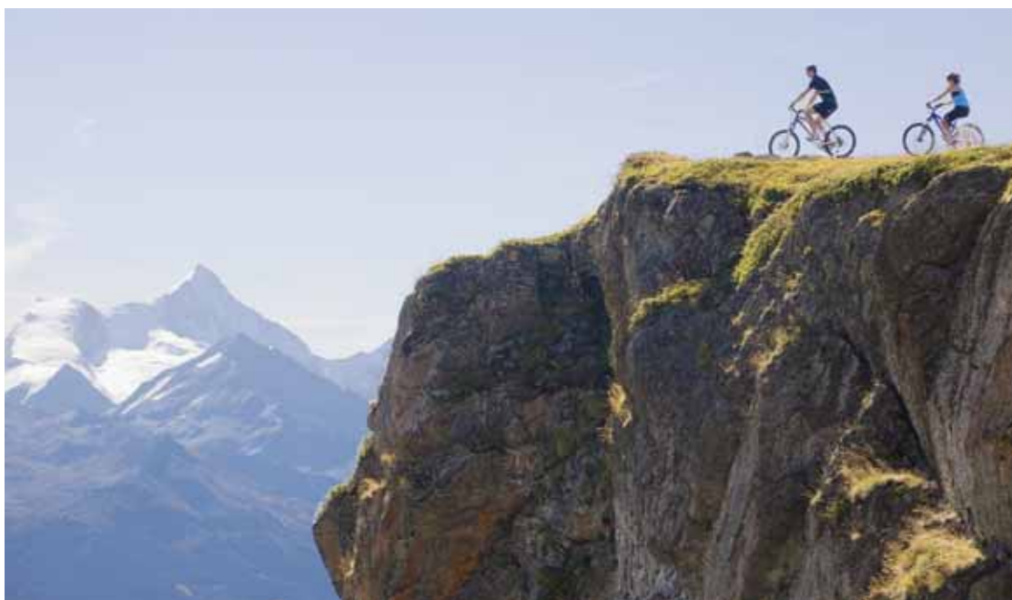
A l'avenir, Crans-Montana va encore plus mettre en avant le VTT pour tous. Le Haut-Plateau mise sur ses superbes paysages accessibles à bicyclette. DENIS EMERY