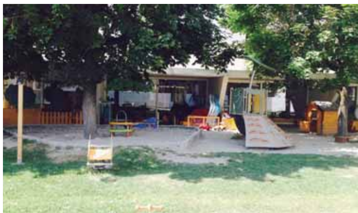
Le parc de la bibliothèque, un endroit propice à la lecture.

De la mi-juillet à la mi-août, la bibliothèque propose et expose des ouvrages sur le Valais et la Suisse