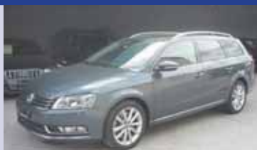
VW Passat 3.6 FSI DSG 4M 2012, KM 55'100, Pack Ambiente, Pack assistance de conduite. Fr. 28'900.- Fr. 27'900.-