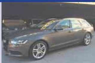
Audi A6 AV 3.0 TDI S-tronic Q 2012, KM 46'490, Toit ouvrant panoramique en verre, Paquet Ambition. Fr. 48'500.- Fr. 47'500.-