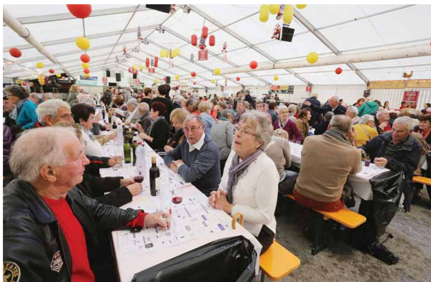
Tout a débuté vendredi passé avec de mémorables rencontres lors de la Journée des aînés. REMO