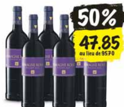
Humagne rouge AOC Spécialités du Valais 2014 Provins, 6 x 75 cl (10 cl = 1.06)

Sous réserve de changement de millésime. Coop ne vend pas d'alcool aux jeunes de moins de 18 ans.