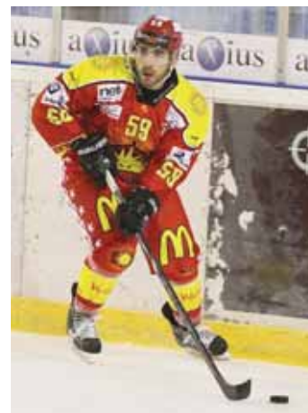
Mathez en mode joueur. REMO

gine fribourgeoise est extrêmement bien placé pour expliquer le passage à vide traversé par sa formation en novembre: «Après l'euphorie du début, une grande fatigue s'est abattue sur nous. Ce genre de trou arrive à toutes les équipes. Mais nous avons bien réagi. Certaines fois, une victoire suffit à relancer la machine. En ce qui nous concerne, nous essayons de nous fixer des objectifs tiers par tiers, de les accomplir et d'avancer de cette manière. C'est un bon moyen pour sortir de la spirale de la défaite.»