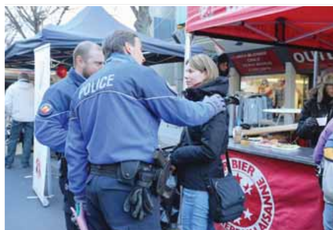
Unique dans les annales des grands rendez-vous: à Sierre, c'est la police municipale qui organise la foire Sainte-Catherine. REMO