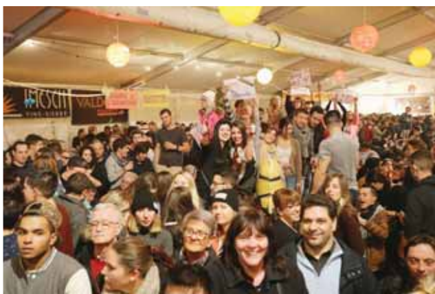
La foule des grands soirs lors de la Braderie. REMO