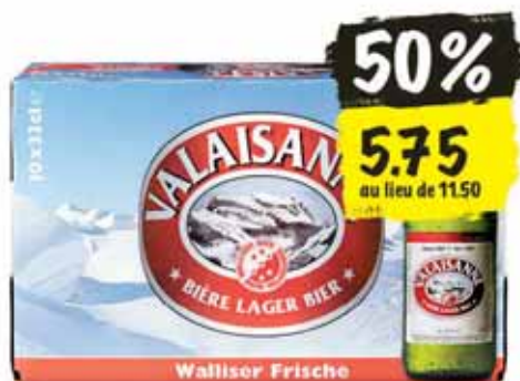
Bière valaisanne Lager 10 x 33 cl (10 cl = 0.17)