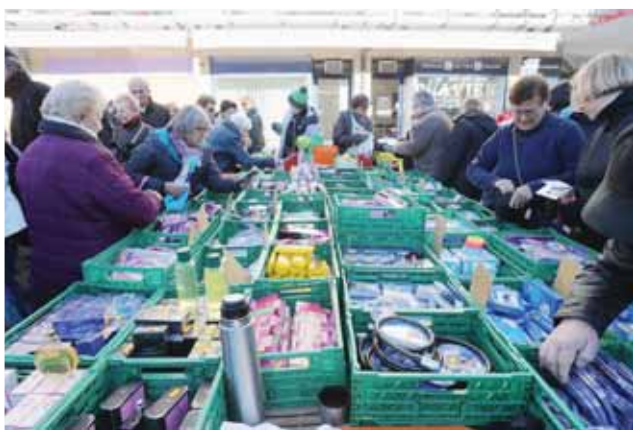
«Messieurs dames, profitez! Ici tout est soldé!». REMO