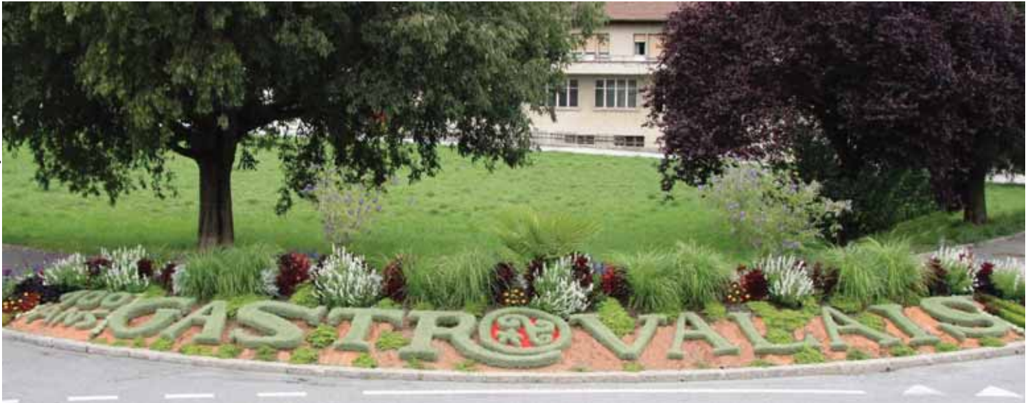
Un massif panoramique qui porte les couleurs de la section sierroise. Il a été réalisé par les jardiniers de la Ville de Sierre avec des santolines, plantes qui se laissent tailler.