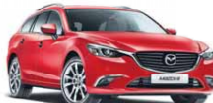
MAZDA 6 SPORT WAGON AWD

+ PRIME DE REPRISE Nous vous renseignons volontiers.