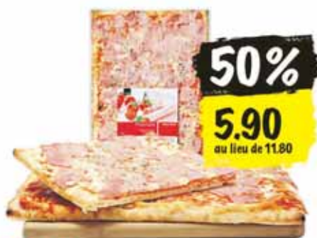
Pizza prosciutto Coop Betty Bossi 1 kg