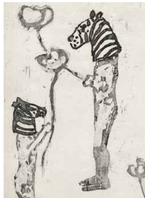
Une gravure de Colomba Amstutz visible au château de Venthône.