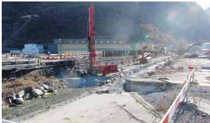
Les travaux d'assainissement sous la digue de la Navizence seront coordonnés avec le projet de protection contre les crues piloté par la commune de Chippis. LE JDS

Aujourd'hui les exigences de la protection de l'environnement spécifiques au chantier sont devenues plus contraignantes et requièrent des moyens considérables et du savoir-faire de la part des entreprises engagées pour cet assainissement.