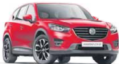
MAZDA CX-5 AWD

NOUVEAU PRIX dès CHF 34 200.- ou 319.-/mois 1