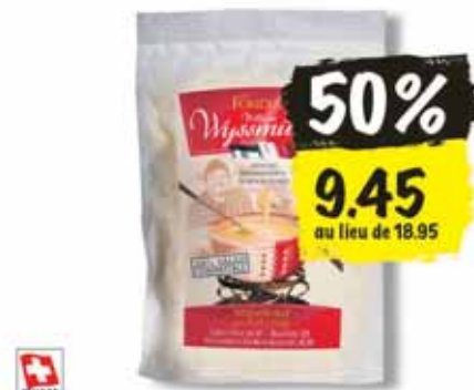
Fondue Wyssmüller Assemblage 600 g (100 g = 1.57)