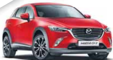
MAZDA CX-3 AWD

NOUVEAU PRIX dès CHF 29 500.- ou 279.-/mois 1