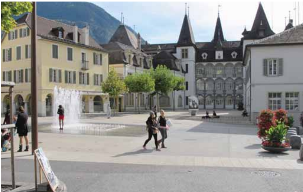
La Place de l'Hôtel de Ville accueille «Noël sans frontières» le 9 décembre.

ment inoubliable avec la visite du Père Noël dès 18 h 15. Diverses animations musicales et la présence des pompiers avec leur camion-grue (de 17 à 18 h) complètent l'affiche de la manifestation. Celle-ci est organisée par les délégués à l'intégration de la ville et du district de Sierre, le service des Parcs et Jardins, du groupe de travail à l'intégration, de la Corem, de l'Aslec, du bureau d'accueil des Arcades, de l'Espace interculturel et des paroisses de Sierre. CD/C