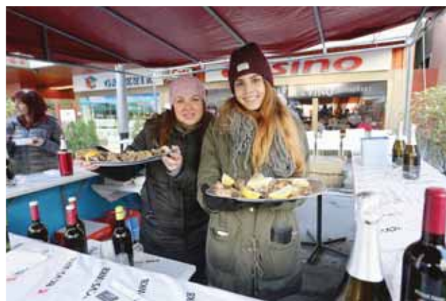
Un service avec le sourire, c'est ce qui fait la différence. REMO