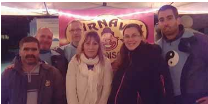
Le comité est prêt pour une édition 2016 endiablée.

CHALAIS-RÉCHY Le 11 du 11, c'était l'ouverture du carnaval de Chalais avec le voile qui s'est levé sur le thème du rendez-vous 2016: les Mangas, avec comme slogan Mangas Délires. Le vin chaud a coulé à flots le 11 novembre sur la