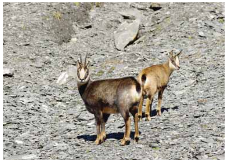
Approcher un chamois, un grand moment... DOLF ROTEN

Informations et inscriptions jusqu'à ce soir 17 heures: au Parc naturel Pfyng-Finges 027 452 60 60 ou admin@pfyn-finges.ch