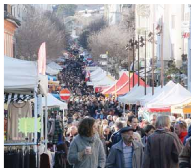
Une météo glaciale n'a pas découragé les milliers de visiteurs qui ont déambulé dans le centre de Sierre lundi et mardi. REMO