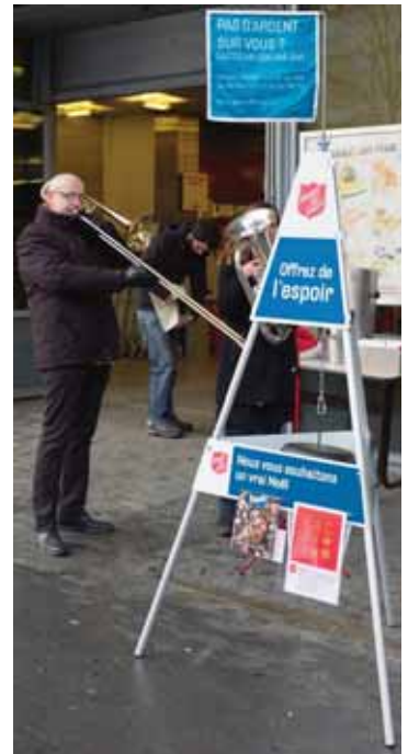
Devant les supermarchés sierrois, la collecte se fera en musique. CLAUDE COEUEVEZ

A chaque endroit il y aura des animations musicales qui rappellent Noël, la naissance du Christ, et les valeurs chrétiennes de solidarité et amour pour le prochain. La collecte sert à alimenter un fonds de soutien pour des familles de la région. Chaque don est reçu avec reconnaissance. Pour remercier la population, l'organisateur, l'Armée du Salut, prévoit un concert gospel de l'avent dimanche 13 décembre 2015 à 17 h 30 à la Sacoche à Sierre. CD