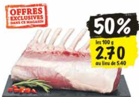
Rack d'agneau, Grande-Bretagne/Irlande/ Australie/Nouvelle-Zélande en libre-service, env. 300 g

Offres valables uniquement à Coop Sierre Rossfeld jusqu'au samedi 28 novembre 2015. Dans la limite des stocks disponibles et en quantité ménagère.