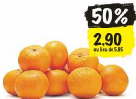
Clémentines, Espagne filet de 2 kg (1 kg = 1.45)