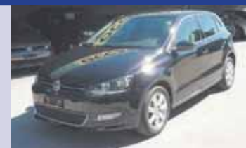
VW Polo HL 1.4 85ch 2011, KM 55'330, Pack de sécurité, Pack hiver, Pack confort de conduite. Fr. 12'900.- Fr. 11'900.-

... ainsi que plus de 100 autres occasions à découvrir dans nos parcs d'exposition