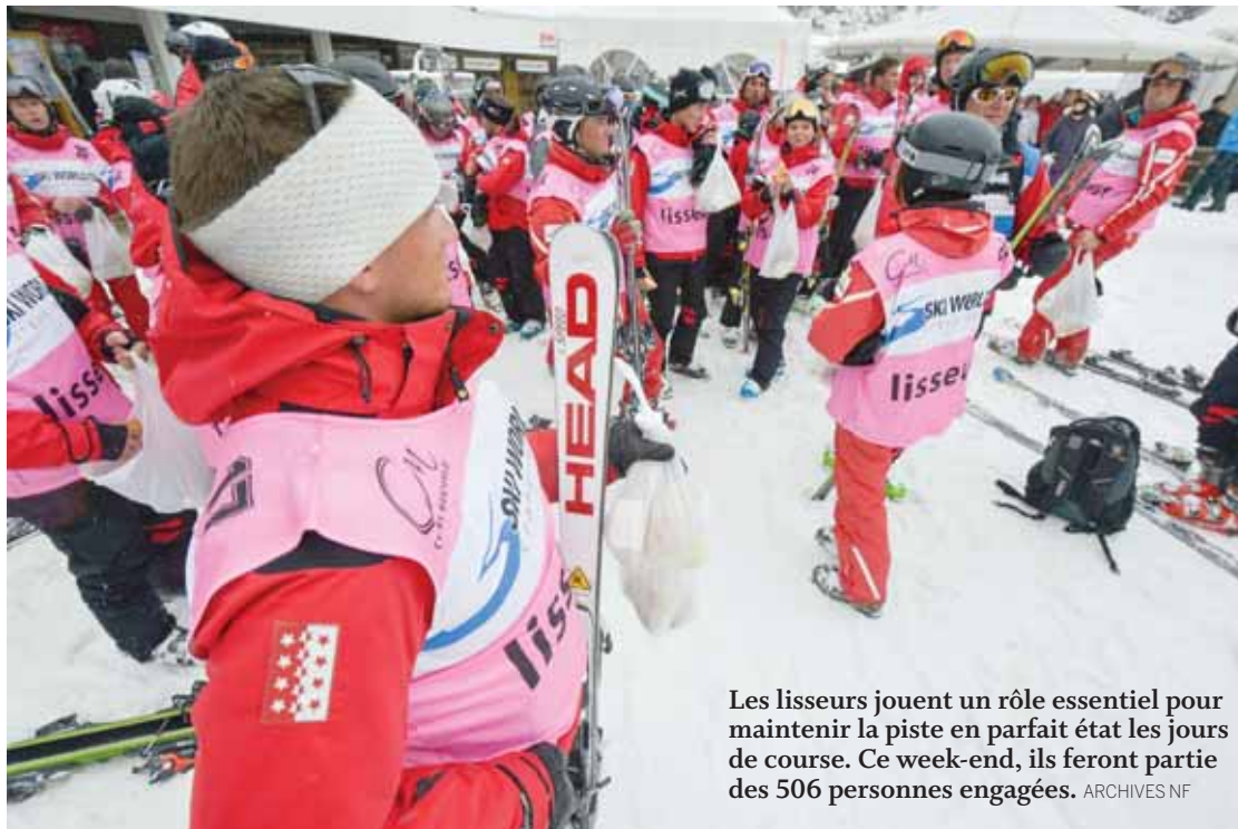
Les lisseurs jouent un rôle essentiel pour maintenir la piste en parfait état les jours de course. Ce week-end, ils feront partie des 506 personnes engagées.

SLALOM DE LUNDI Une épreuve de plus est donc au programme. Crans-Montana se devait de l'accepter et ainsi de montrer à la FIS ses capacités d'adaptation. Le plus gros problème a été de gérer les logements pour les slalomeuses qui n'étaient pas prévues. Un prize money supplémentaire de 120 000 francs a également dû être dégagé.