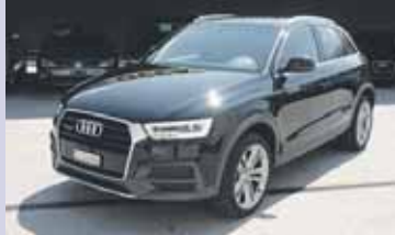
AUDI Q3 2.0 TDI Q S-tronic 184cv , 2015, KM 9'000, Optikpaket Offroad Audi Excl., Paq. Techn. Fr. 47'500.- Fr. 46'500.-