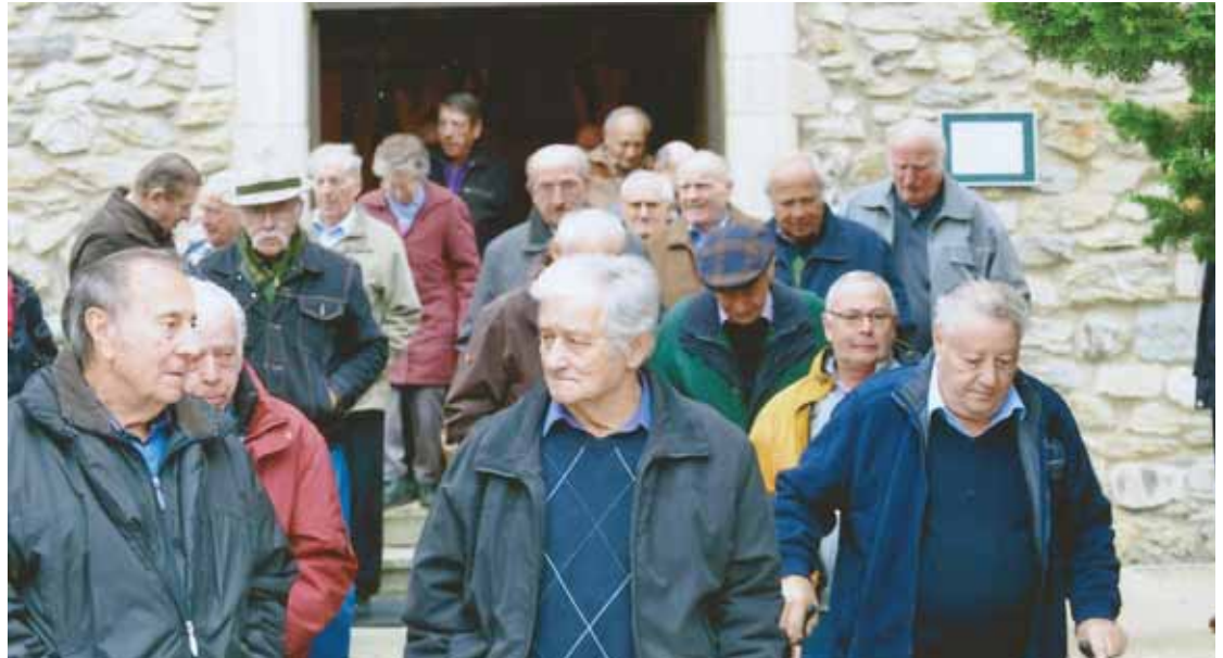
En 2011, ce sont les Anniviards de l'amicale qui ont organisé la rencontre annuelle.