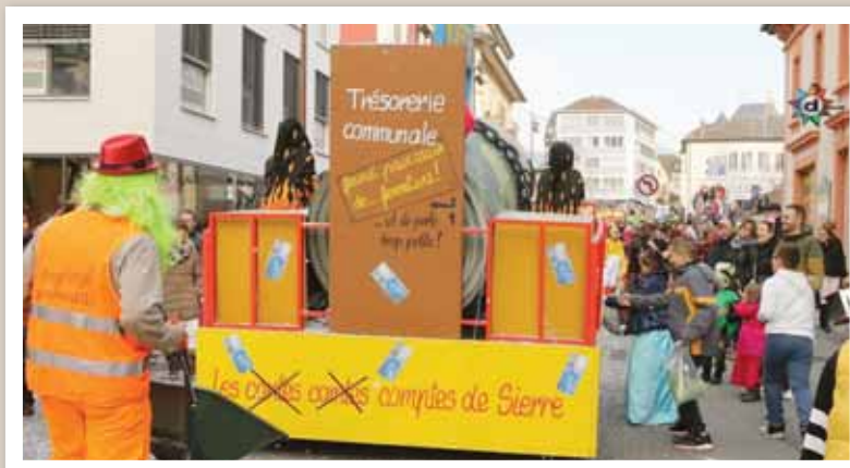
Petites piques sur les comptes de la ville de Sierre pour un char qui n'est pas passé inaperçu... REMO