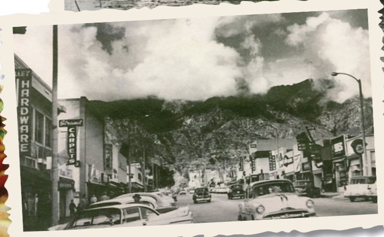
Monrovia, capitale du Liberia en 1950. DR