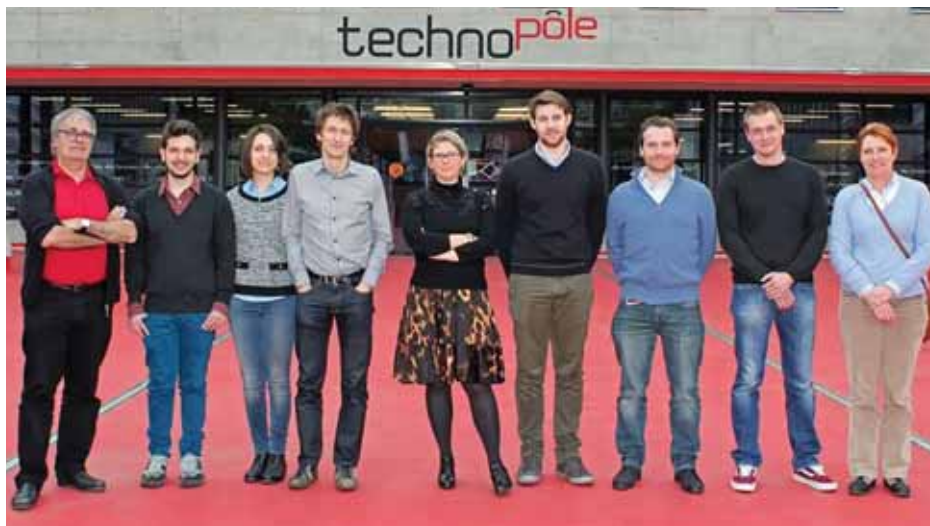
L'équipe du projet MEGANE PRO réunit au Techno-Pôle de Sierre.

«C'est un grand honneur pour notre équipe de diriger un projet de cette envergure. En effet, l'obtention d'un projet soutenu par le FNS est difficile pour une haute école spécialisée