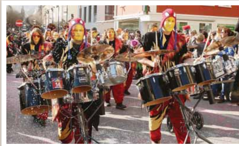
Spectacle haut en couleurs et décibels ont fait bon ménage samedi lors du traditionnel cortège du carnaval de Sierre. REMO