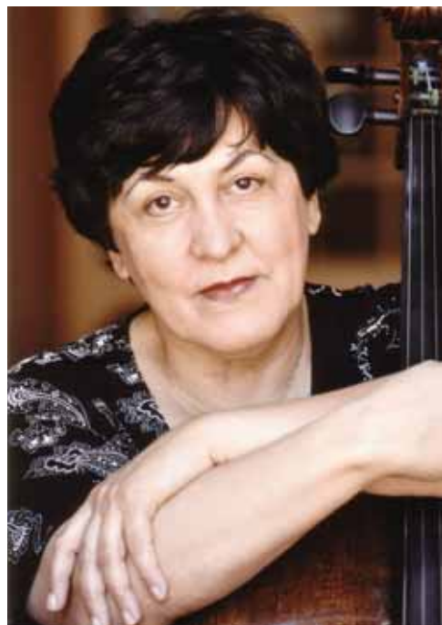
Natalia Gutman, une violoncelliste exceptionnelle, qui a marqué l'histoire de la musique et dont le jeu a inspiré de nombreux compositeurs contemporains.

A Crans-Montana, elle interprétera le «Concerto pour deux violons et cordes en la mineur» de Vivaldi, le «Concerto pour violoncelle» de Haydn et «Souvenir de Florence» de Tchaïkovski. Visiblement très