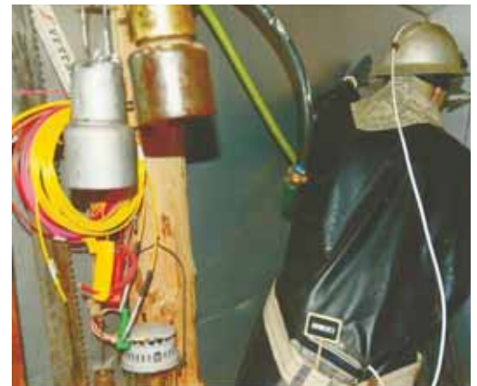
Toute la panoplie du parfait mineur est présentée au musée qui peut être visité sur demande. DR