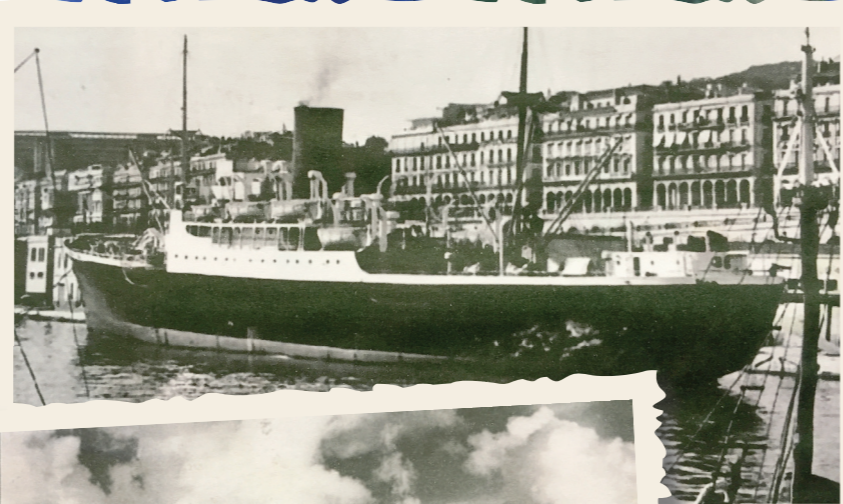
Le bateau «Sidi Mabrouk» qui a convoyé les cinq compères (ci-contre).