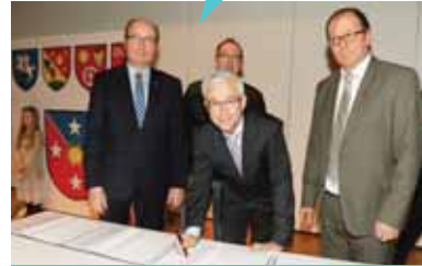
LES QUATRE PRÉSIDENTS LORS DE LA SIGNATURE

L'acte de mariage de Crans-Montana a été signé par les quatre présidents de Randogne, Mollens, Montana et Chermignon. Si l'acte est signé, en coulisses un travail important est en cours. Un pour concrétiser cette fusion, l'autre pour définir le futur visage de l'Association des communes de Crans-Montana. En passant de six à trois communes, l'ACCM ne