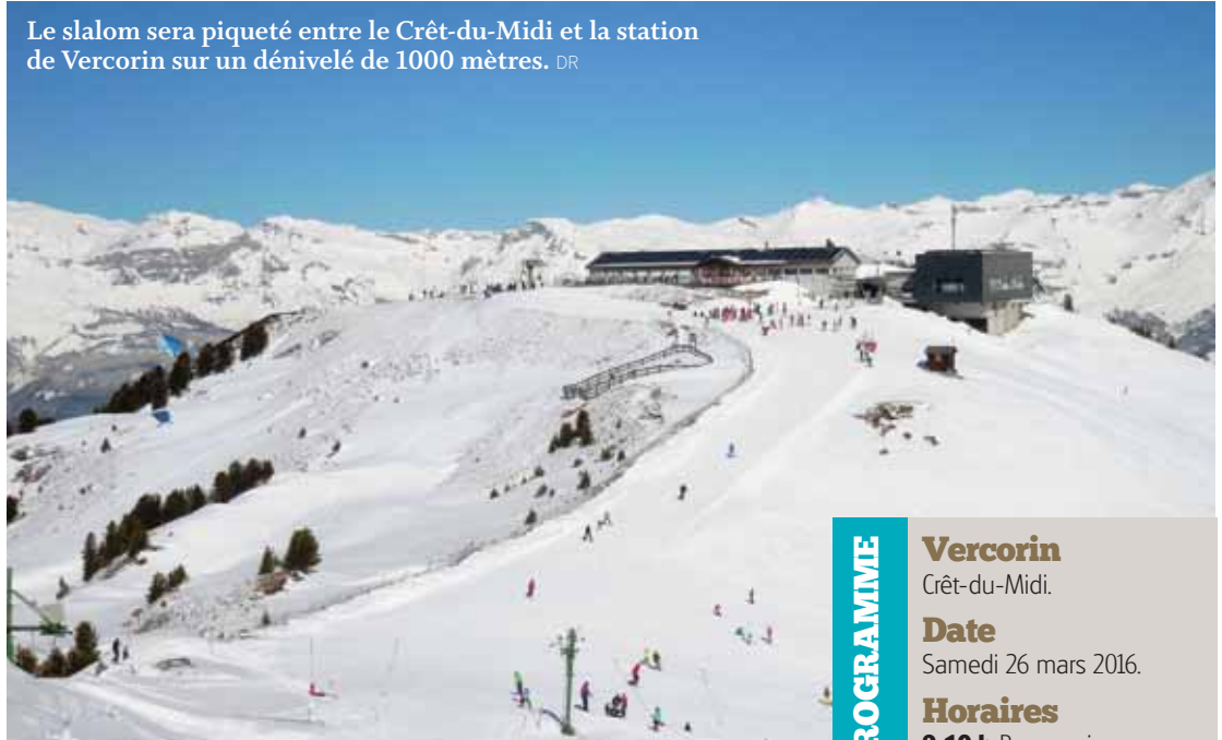
Le slalom sera piqueté entre le Crêt-du-Midi et la station de Vercorin sur un dénivelé de 1000 mètres.

live, démonstration de freestyle et de parapente, slalom pour les enfants et château gonflable. Pour les coureurs qui feront la course uniquement pour le plaisir et pour lesquelles le chronomètre a peu d'importance, un ravitaillement intermédiaire est prévu au milieu de la course. «Le temps moyen pour terminer la course est d'environ