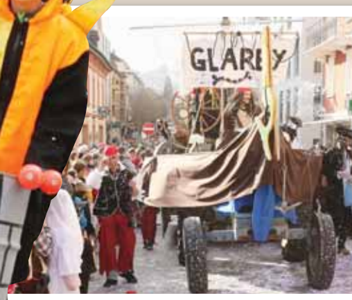
Les quartiers sierrois – ici Glarey – ne sont jamais en reste. REMO