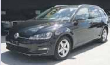
VW Golf VA HL 2.0 TDI 150cv , 2013, KM 24'245, Pack sécurité + hiver, Phares bi-xénon. Fr. 26'900.- Fr. 25'900.-