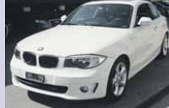
BMW 125i , 2011, KM 96'830, Pack Confort. Toit ouvrant coulissant. Fr. 19'900.- Fr. 18'900.-

... ainsi que plus de 100 autres occasions à découvrir dans nos parcs d'exposition