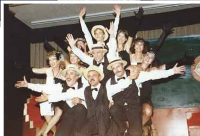
La troupe chippiarde en 1991 lors de la présentation de la revue.