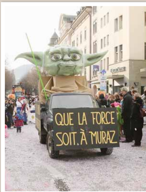
Avant de brûler à Muraz, le bonhomme hiver fait un dernier tour de piste dans les rues de la cité du Soleil.