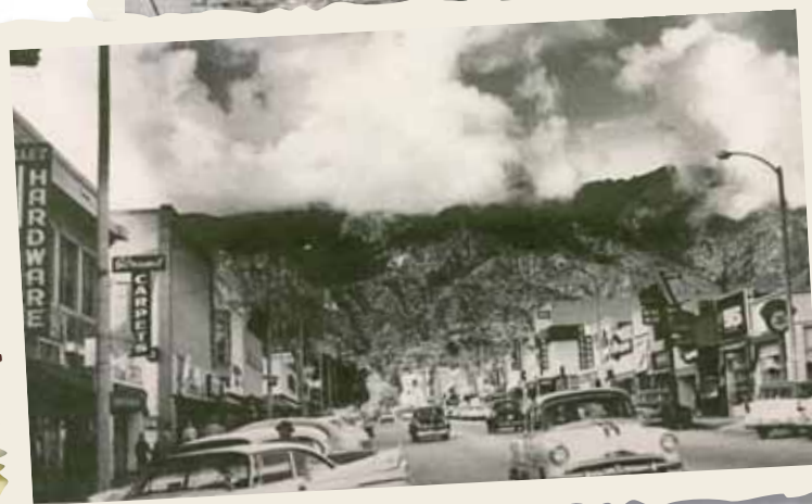
Monrovia, capitale du Liberia en 1950.