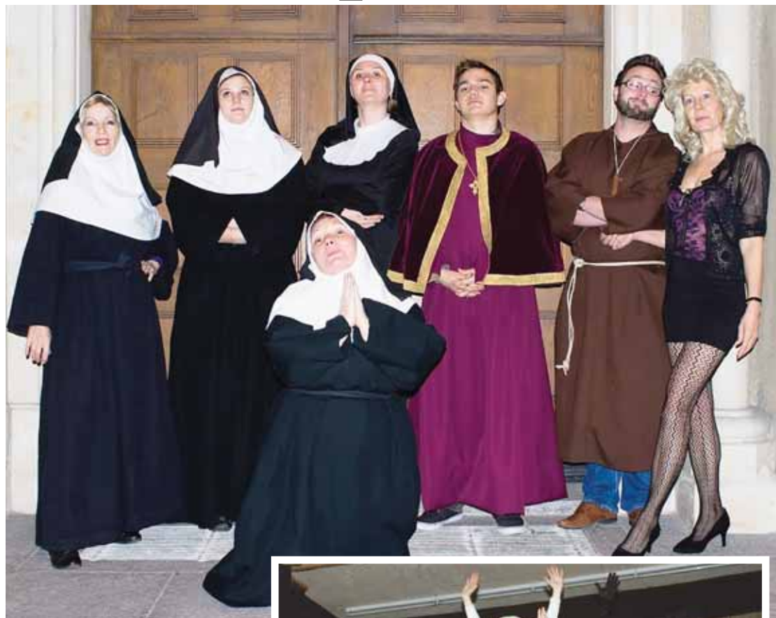
Les acteurs préparent actuellement leur dernière pièce.