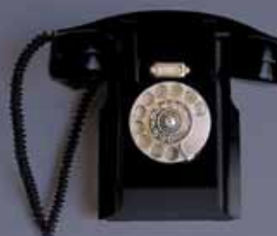
Téléphonie analogique 1876 - 2017

LE TÉLÉPHONE ANALOGIQUE DEVIENT UNE PIÈCE DE MUSÉE !