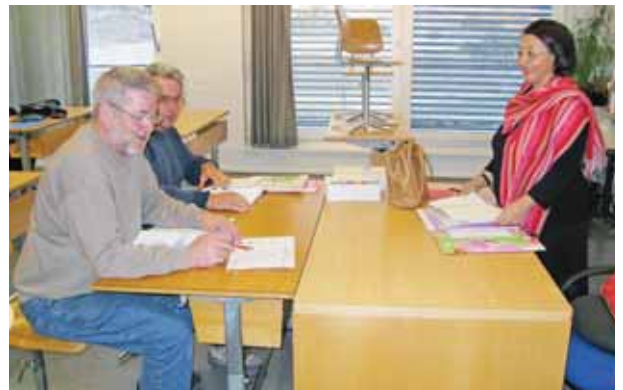
Les cours de langues, qui fonctionnent bien, seront maintenus. D'autres seront supprimés.