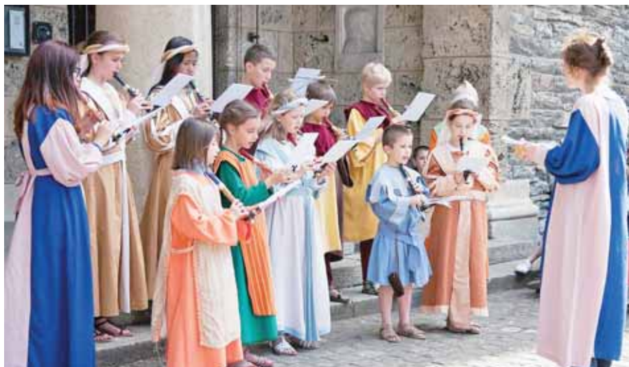
La Fête de la flûte, l'année dernière sur le thème du Moyen-Age.

Deux événements musicaux viennent rappeler que la musique fait des merveilles: la Fête de la flûte le 8 juin à Sierre et la Fête de la musique le 19 juin à Muraz. Avec les chants d'oiseaux qui redoublent d'intensité avec l'été qui arrive, les flûtes reprennent le chemin du parc du château Mercier. La 20e Fête de la flûte se déroule, comme de coutume, dans les jardins du château Mercier, mercredi 8 juin à 17 heures. Le concert champêtre organisé par la Société valaisanne de la flûte et le festival Flatus, tous deux dirigés par Anne Casularo Kirchmeier, propose un parcours sonore à travers les siècles avec une trentaine de jeunes musiciens. «Il y a vingt ans, nous avons préféré, plutôt qu'une audition, réunir nos élèves autour d'une grande fête...», se souvient Anne Casularo Kirchmeier.