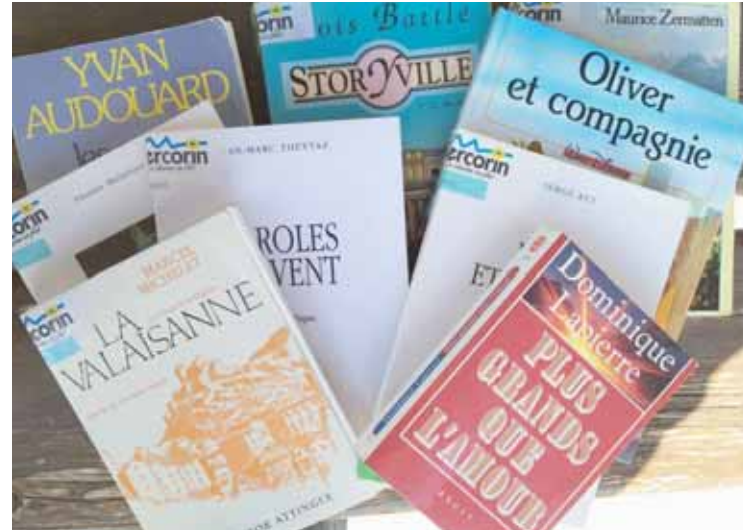
Dans les caisses, des livres pour tous les goûts.