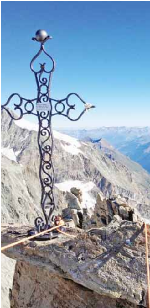
La croix du sommet de la Pointe de Zinal veille sur les alpinistes. DR