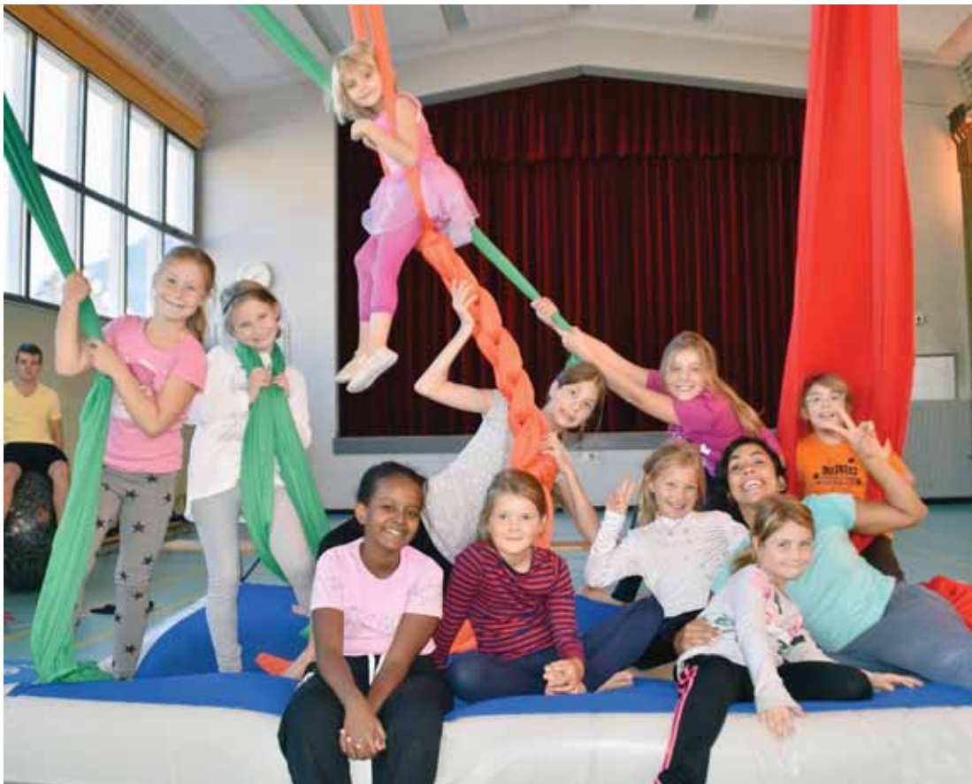
Les élèves (ici le 1er groupe) de Circ'A'Sierre, à voir le 18 juin à 14 h 30 sous le chapiteau du cirque Starlight à Sierre. DR

Circ'A'Sierre compte actuellement quatre-vingts membres. Quarante élèves de tout le district suivent les cours hebdomadaires d'initiation aux arts de la piste et du cirque. Ils sont répartis en trois groupes d'âge. L'enseignement et les exercices sont donnés à la salle de gymnastique de Granges. La structure de notre club est composée d'un comité de cinq membres, alors que l'école de cirque peut compter sur sept animatrices et animateurs et trois consultants. Concernant nos cinq partenaires, Circ'A'Sierre a la chance d'entretenir d'excellentes relations avec la Ville de Sierre, l'Office du tourisme Sierre/Anniviers, le cirque Starlight, le cirque Helvetia et l'Ecole du cirque Anniviers.