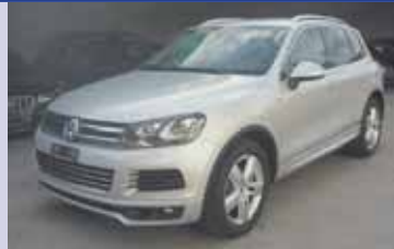
VW TOUAREG 3.0 TDI 245cv 2013, km 81300, Pack hivers, Pack lumière Fr. 41'500.- Fr. 40'500.-