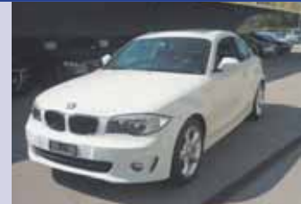
BMW 125i 2011, km 96'900 Pack Confort Fr. 16'900 Fr. 15'900.-

... ainsi que plus de 100 autres occasions à découvrir dans nos parcs d'exposition