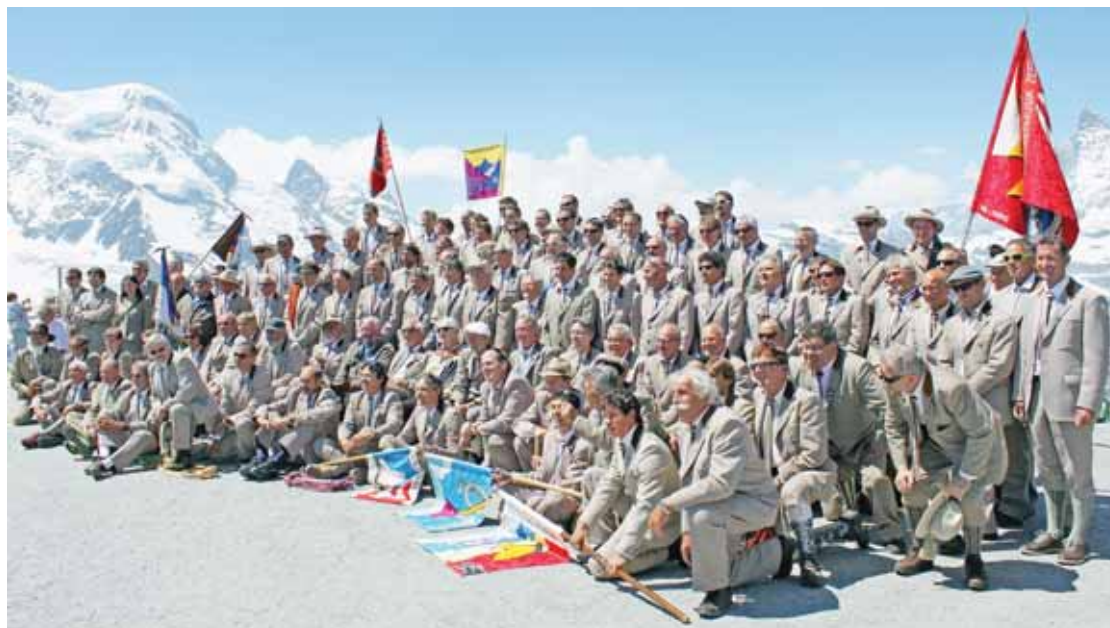
L'an passé, la Fête cantonale des guides avait lieu à Zermatt. Cette année, c'est Zinal qui les reçoit.