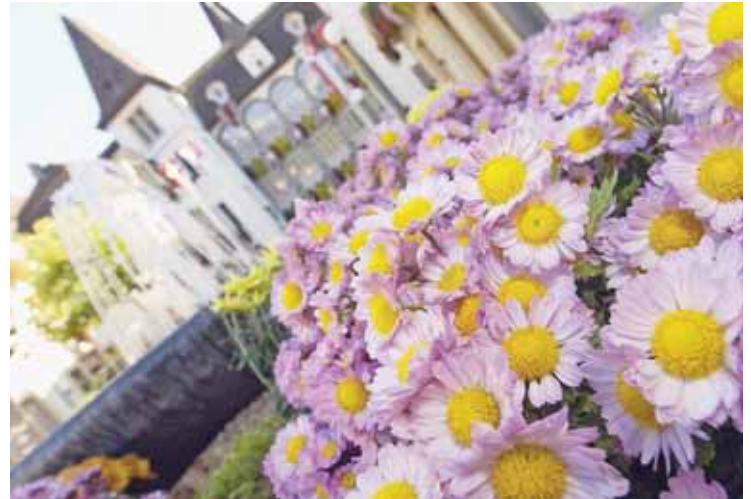
Dix espaces urbains autour de l'Hôtel de Ville seront aménagés pour l'édition 2016 des Floralies.