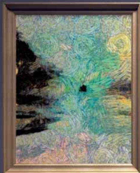
Vincent van Gogh 1853 - 1890