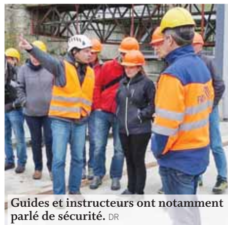
Guides et instructeurs ont notamment parlé de sécurité.

SIERRE La formation continue au parc naturel Pfyng-Finges est placée sous le thème de la sécurité. «Nos guides accompagnent les visiteurs du parc depuis plus de dix ans. Jusqu'à aujourd'hui nous n'avons heureusement pas été confrontés à des accidents majeurs. Il est néanmoins important d'être prêt en cas d'urgence comme la montée des eaux ou