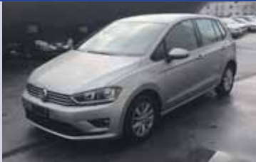
VW Golf SV CL 1.4 TSI 125cv Pack confort 2014, km 11'100 Fr. 22'500 Fr. 21'500