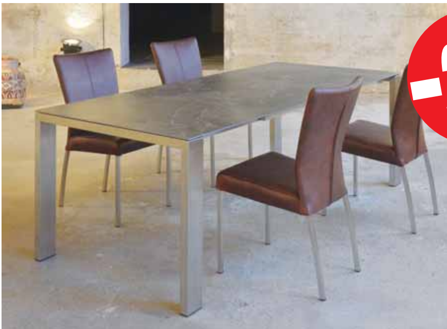
TABLE INTEMPOREL céramique – pieds inox