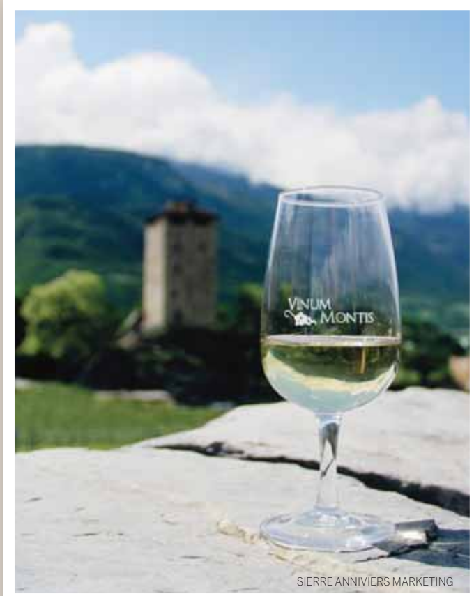
SIERRE ANNIVIERS MARKETING

LES PRIVILEGES VINUM MONTIS L'œnotourisme n'est pas un vain mot dans la région de Sierre! Pour le découvrir, il vous suffit de suivre attentivement le projet Vinum Montis. Deux axes de découvertes vous sont proposés. Premièrement, en rejoignant la communauté via www.facebook.com/Vinumontis , www.vinumontis.ch ou www.sierretourisme.ch et deuxièmement, en profitant directement du prochain événement prévu le 16 juin (voir encadré). Avec la carte de fidélité, vous avez également la chance de gagner 60 bouteilles de la région ainsi qu'un week-end romantique pour 2 personnes au val d'Anniviers.