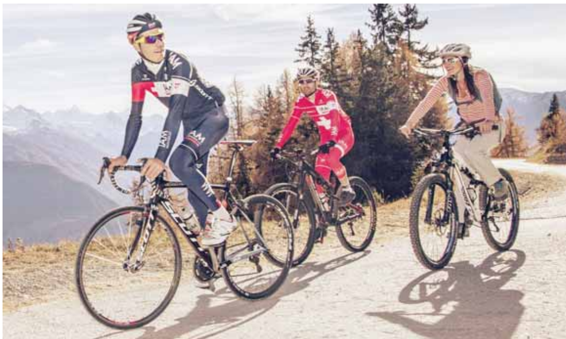
La première édition de Cycling for Children se déroulera à Crans-Montana le samedi 18 juin. Une journée d'effort à vélo afin de soutenir les enfants dans le besoin.