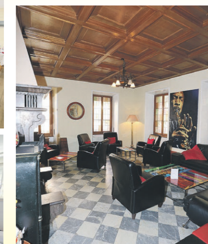
Un coin idéal pour partager l'apéritif