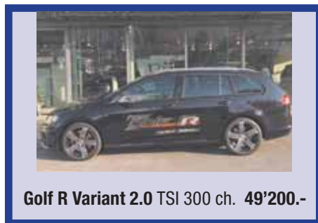
Golf R Variant 2.0 TSI 300 ch. 49'200.-