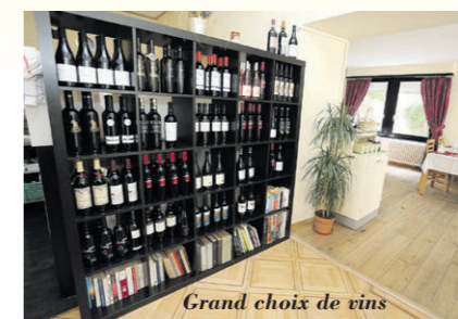
Grand choix de vins