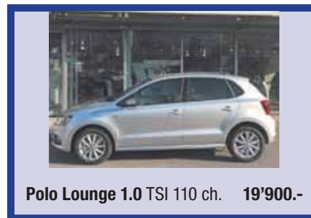
Polo Lounge 1.0 TSI 110 ch. 19'900.-

... ainsi que plus de 100 autres occasions à découvrir dans nos parcs d'exposition