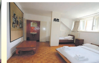
Nos chambres d'hôtes