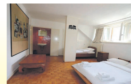
Nos chambres d'hôtes