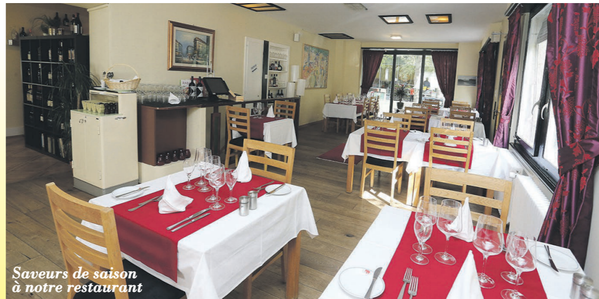
Saveurs de saison à notre restaurant

Saveurs printanières et estivales LE COIN GRILLADES ET SAVEURS SUR LA TERRASSE GRAND CHOIX DE VIANDES - POISSONS et CRUSTACES GRAND CHOIX DE SALADES ESTIVALES GRAND CHOIX DE CRUS AU VERRE