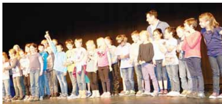
Les 5H reçoivent leur trophée.