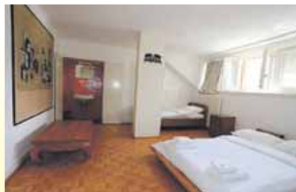
Nos chambres d'hôtes