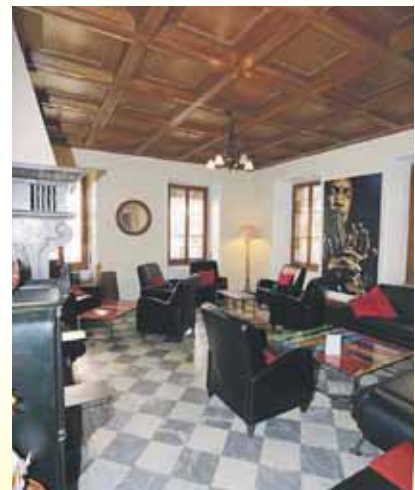
Un coin idéal pour partager l'apéritif