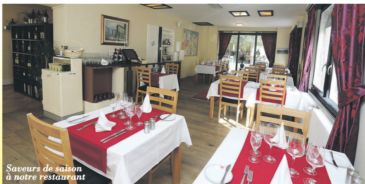
Saveurs de saison à notre restaurant

Saveurs printanières et estivales LE COIN GRILLADES ET SAVEURS SUR LA TERRASSE GRAND CHOIX DE VIANDES - POISSONS et CRUSTACES GRAND CHOIX DE SALADES ESTIVALES GRAND CHOIX DE CRUS AU VERRE