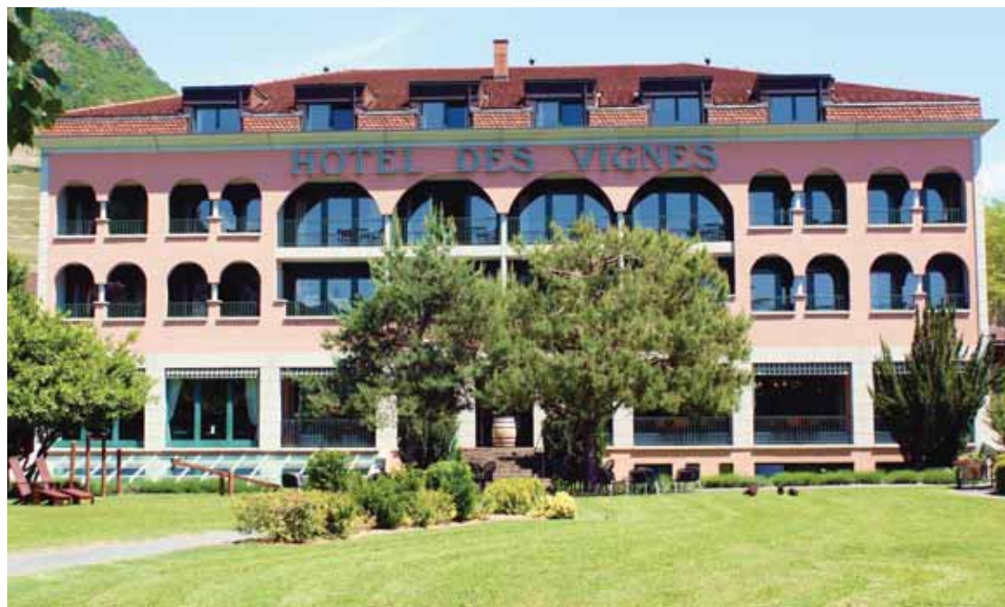
L'Hôtel des Vignes et son joli parc. LE JDS

Les apprentis se rendent simplement sur le site cms-sierre.ch pour remplir un formulaire d'inscription.