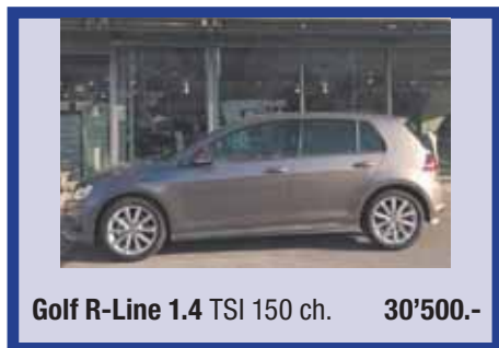
Golf R-Line 1.4 TSI 150 ch. 30'500.-