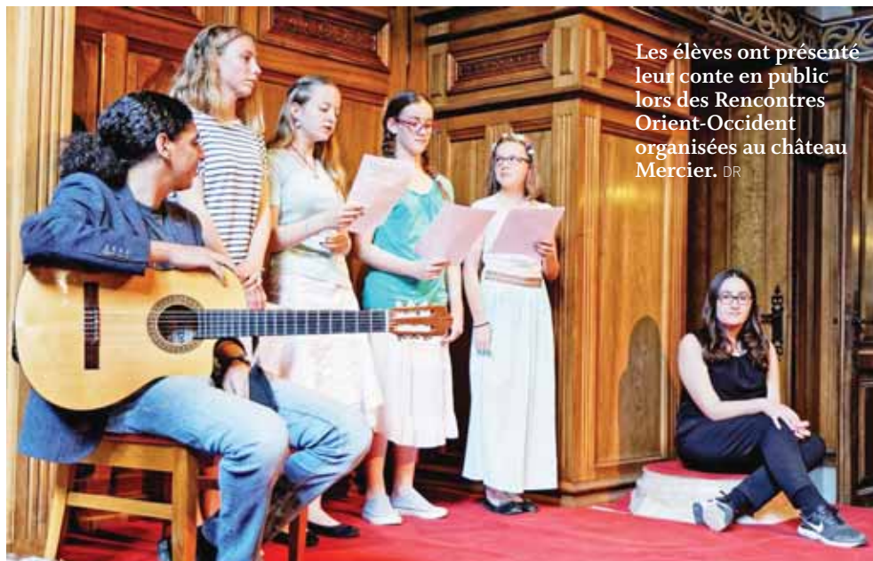
Les élèves ont présenté leur conte en public lors des Rencontres Orient-Occident organisées au château Mercier.

présentés aux Rencontres Orient-Occident organisées au château Mercier. Des textes ont été présentés au public par les élèves auteurs eux-mêmes ainsi que par leurs camarades. Chaque production sélectionnée pour ces Rencontres a été contée par un élève différent afin de donner la parole au plus grand nombre.