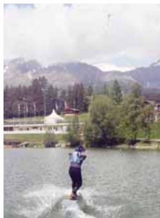
Ce dimanche, une grande fête du ski nautique est organisée.

La saison du ski nautique et du wakeboard bat son plein sur le lac de l'Étang-Long depuis le 10 juin. Le dimanche 3 juillet aura lieu une grande compétition avec des participants de toute la Suisse. Mais dans l'attente de cet événement, une grande fête du ski nautique avec ambiance de mer à la montagne aura lieu le dimanche 19 juin dès 11 heures. Avec live music et essais gratuits des installations.