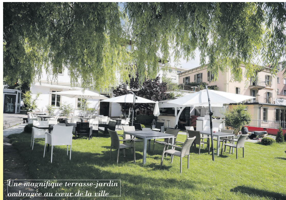
Une magnifique terrasse-jardin ombragée au cœur de la ville