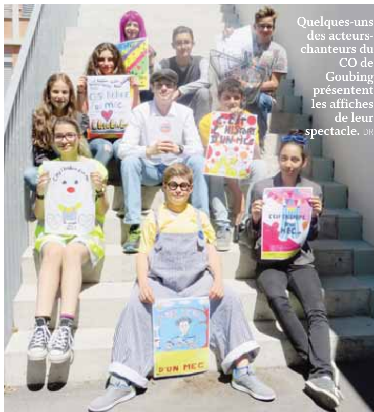
Quelques-uns des acteurs-chanteurs du CO de Goubing présentent les affiches de leur spectacle.