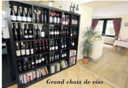
Grand choix de vins