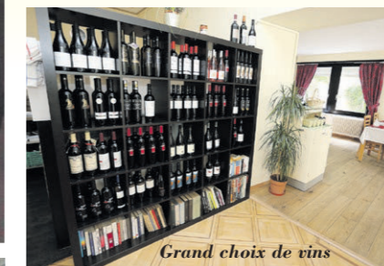
Grand choix de vins