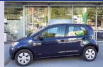
Up! 60 ch. 5M – 10'900.-

... ainsi que plus de 100 autres occasions à découvrir dans nos parcs d'exposition