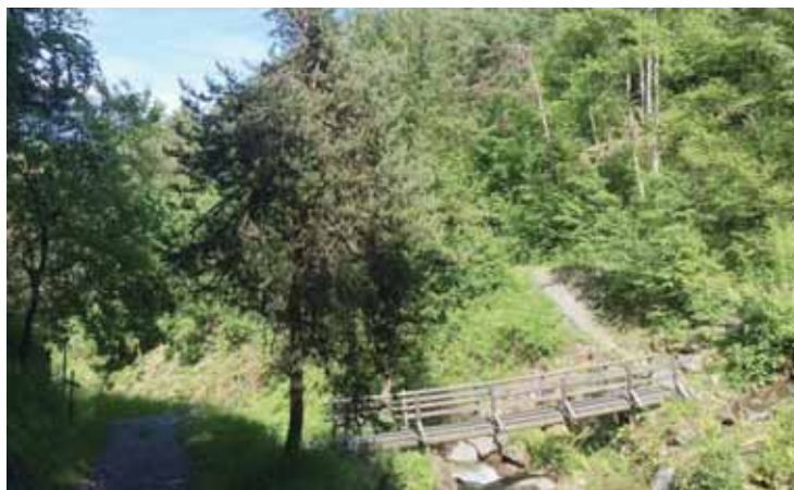
Le sentier met en avant le patrimoine du bisse de Ricard.

Le 6 e sentier présente le patrimoine des bisses et plus parti-