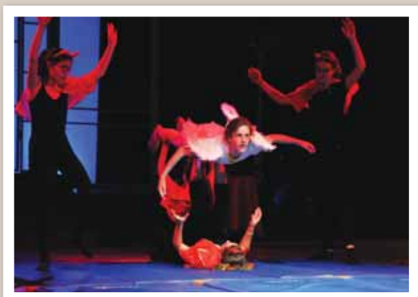
Trente-neuf jeunes âgés de 7 à 19 ans ont participé au spectacle. A. ROMAILLER