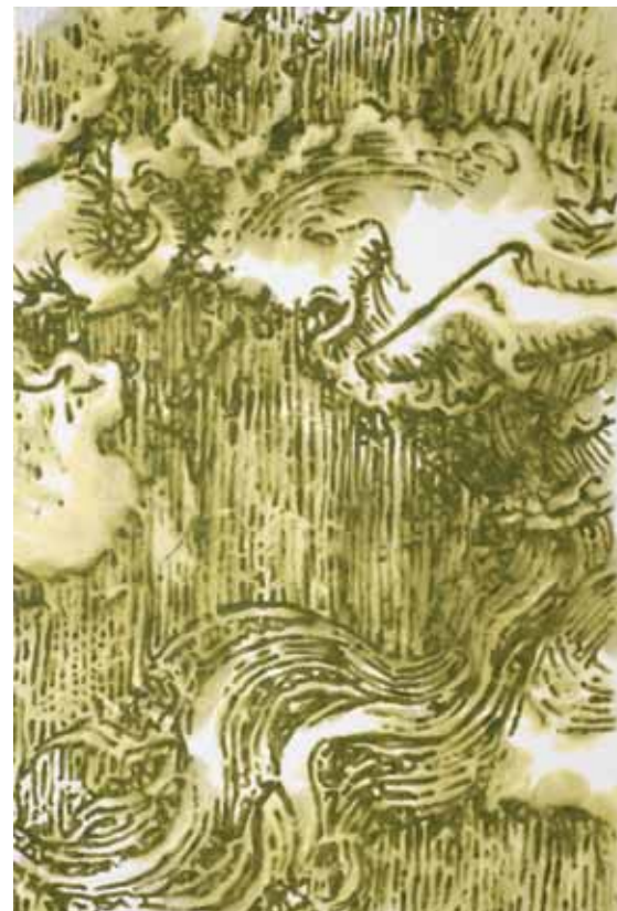
Robert Ireland, «Apocalypse», 2013, peinture, encre d'imprimerie sur toile. DR

Jusqu'au 10 juillet. www.fondationpierrearnaud.ch