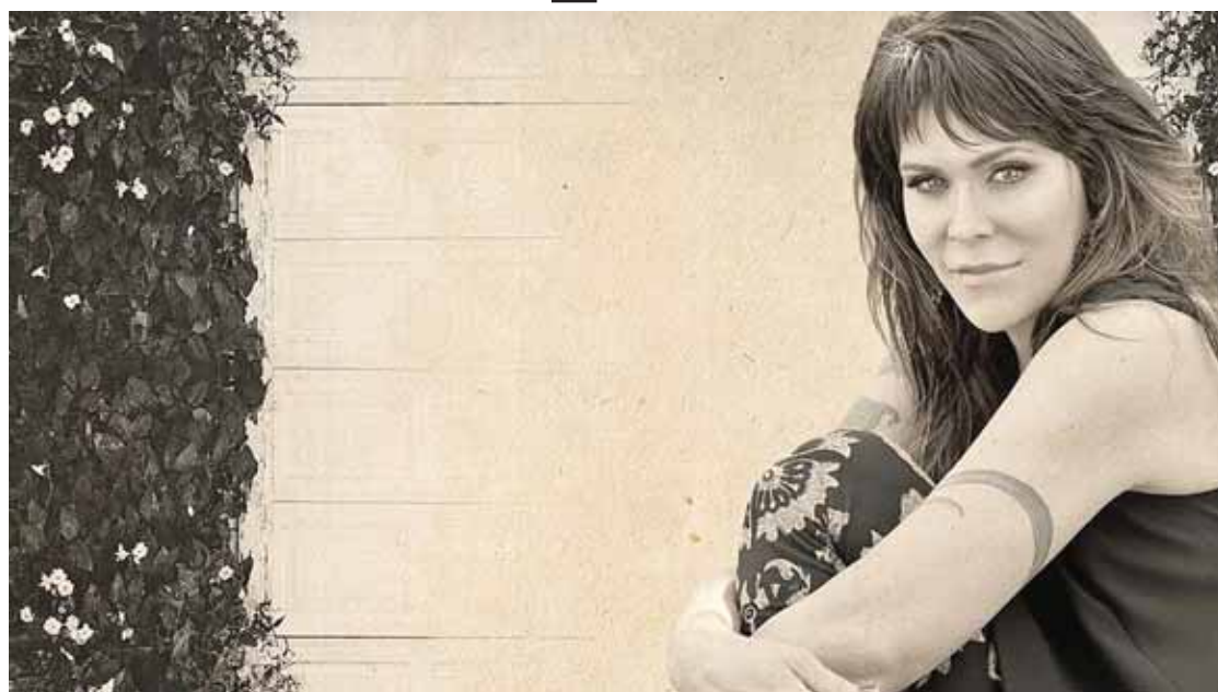
Beth Hart, chanteuse et compositrice américaine aux multiples influences rock, blues et gospel, en concert samedi 9 juillet.

vaillent bénévolement depuis les débuts. Leur salaire ce sont les concerts. Les têtes d'affiche et les autres, des Suisses et des Européens, devenus, au fil des ans et des rencontres dans les festivals et divers challenges suisses et européens de blues, des compagnons de route. Avec désormais, un cer-