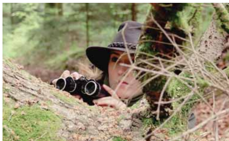
Une image extraite d'une des huit vidéos de Géraldine Bach, visible aux Halles Usego dès ce soir.

Du 1er au 3 juillet et du 8 au 10 juillet, de 14 h à 18 h. Vernissage le 1er juillet à 19 h.