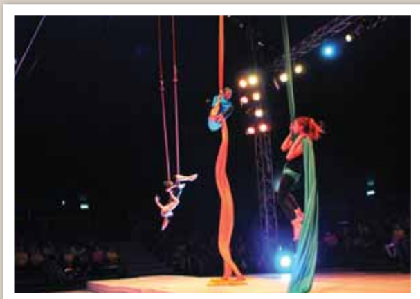
Sous le titre «Sur la terre comme au ciel», les enfants ont présenté 26 numéros (trapèze, tissus, boules d'équilibre, monocycle, acrobaties au sol, acrobaties sur vélo, diabolos, magie, danse, gags, etc.). A. ROMAILLER