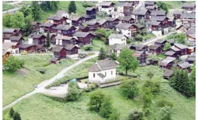
La chapelle en fête, les 9 et 10 juillet.