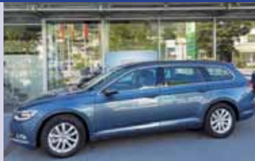
Passat Variant TSI 150 ch. DSG – 41'000.-