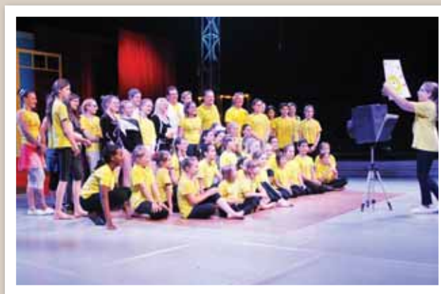
La photo de groupe constituait le dernier tableau tout à la fin du show. Joli souvenir d'une aventure merveilleuse pendant que le public applaudissait chaleureusement. A. ROMAILLER