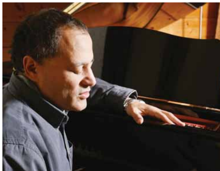
Moncef Genoud, un pianiste éclectique et fascinant qui ne cesse de se réinventer. SABINE PAPILOU

ICOGNE Pour les dix ans de l'IcogneJazz Festival, les 1er et 2 juillet, les organisateurs ont bien fait d'inviter le pianiste Moncef Genoud, il s'était fait plus rare dans la région... Le public appréciera le toucher délicat, la fougue et le personnage bien sûr, attachant, un peu cabotin et toujours généreux pour un jazz qui balance toujours. De multiples albums à son répertoire (il vient de sortir «Live in Cully» et avec son trio Pop songs), une force de composition éclectique, des concerts dans le monde entier depuis 1983 aux côtés des plus grands. Il est l'un des artistes majeurs du jazz suisse et international! Le pianiste non-voyant vient à Icogne avec son trio. Neuf concerts au total sont prévus au