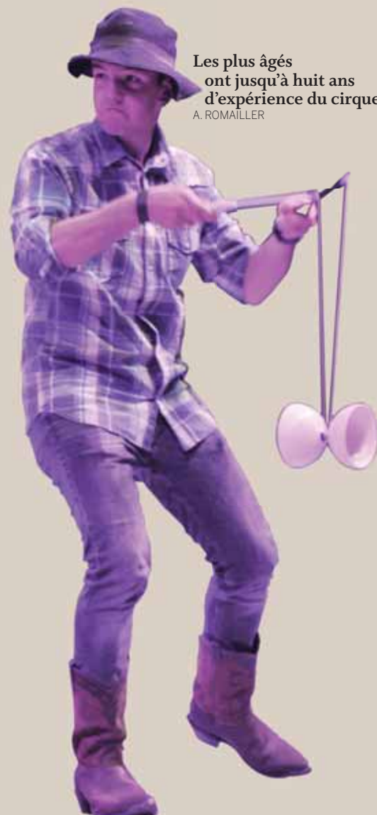
Les plus âgés ont jusqu'à huit ans d'expérience du cirque. A. ROMAILLER