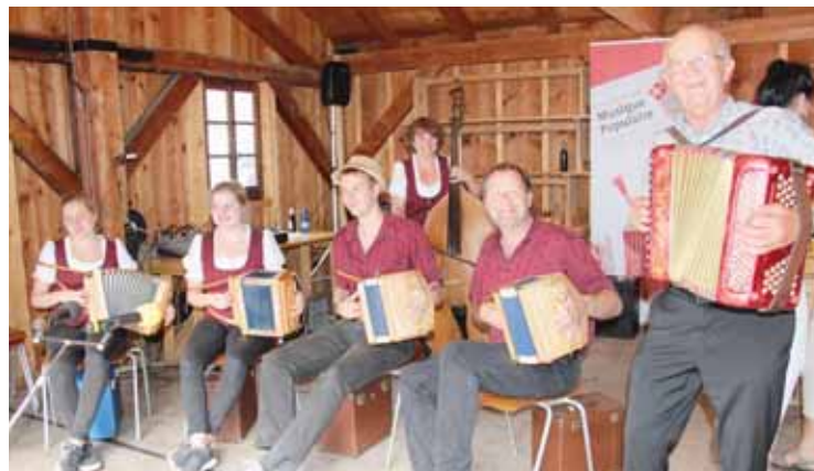
Toute la station va vivre aux sons de l'accordéon.

Pour cette 23 e édition, les prestations musicales seront assurées par LQ La Berra (FR), Turbo Müs (BE), SQ Ämmitau (BE), ST Zebra-Giele u Modi (BE), LF Bäderhorn (BE), Hüsmusik (VS), Ländlermusik Walti (VS) et les deux formations juniors ST Bärlistock (BE) et Harzer-Fäger (BE) qui, en 2014, ont participé au concours national des jeunes talents. CD