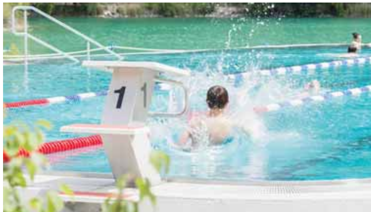
Plusieurs nouveautés cet été aux bains de Géronde.

UNIQUEMENT EN VENTE AUPRÈS DU PROFESSIONNEL- CONSEIL