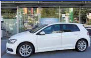
Golf R-Line TSI 122 ch. DSG – 30'100.-