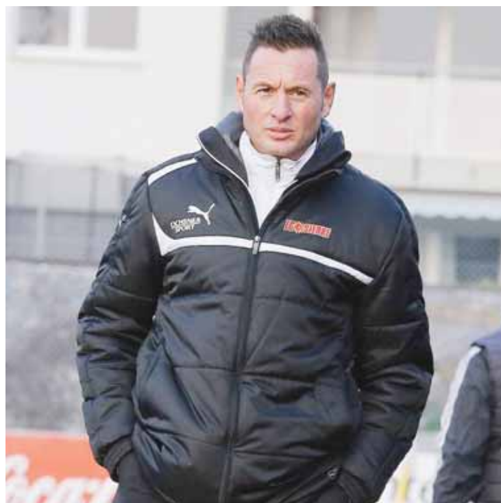
L'entraîneur du FC Sierre aimerait voir tout ses joueurs concernés par la situation que vit son club. REMO

Pas du tout. J'ai des bons joueurs, mais qui s'en foutent. Ils gâchent une partie de leur potentiel en se trouvant continuellement des excuses. Moi, je cherche des joueurs motivés qui donnent un coup de fouet à toute l'équipe. J'ai l'impression que les mecs ne font pas beaucoup d'efforts pour revenir au jeu ou pour tout simplement jouer. Ils doivent plus se faire violence, moins écouter leur corps. Il y a une attente de la part