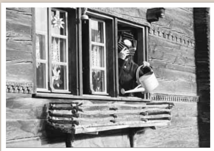
«Géraniums et neige fraîche, la fin d'un mythe», un cliché très parlant, réalisé par Luc Mercier (2e du concours). DR