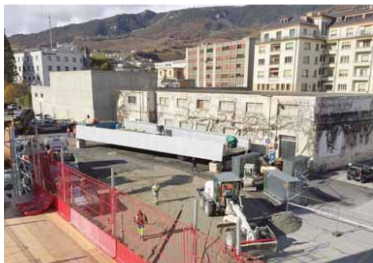
Un des segments (66 tonnes) est posé devant le bâtiment Tavelli avant d'être soulevé par la grue.

routière et d'emprunter la passerelle pour accéder aux quais CFF, aux services du centre-ville et à la gare du funiculaire. La passerelle reliera aussi le nouveau quartier de Condémines au cœur de la ville. Un ascenseur reliera directement parking et gare routière à la future passerelle qui servira également d'accès principal aux élèves de la nouvelle école de commerce. «Le projet du Complexe de la gare est profondément imbriqué. Passerelle, gare