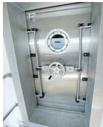
Derrière cette porte: deux immenses réservoirs de 500 m 3 d'eau. REMO

«Il fallait tout d'abord trouver un endroit idéal pour le nouveau