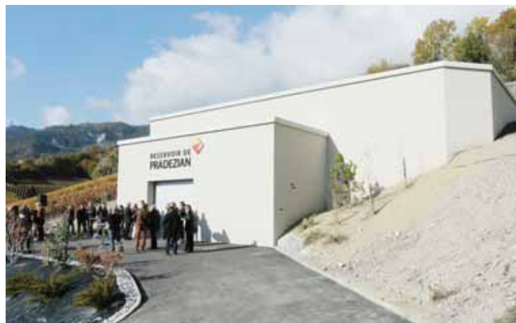
Le réservoir est situé à un emplacement idéal: plus haut et pas trop loin du réservoir de Muraz.