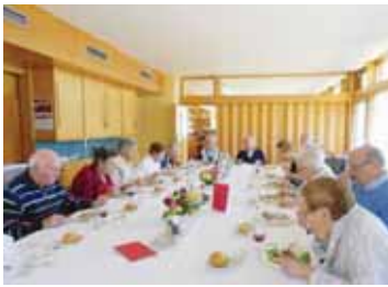
Les contemporains de l'année 1932 ont partagé une bien belle table et beaucoup de souvenirs.

LENS-ICOGNE Les contemporains de la classe 1932 de Lens-Icogne se sont réunis dernièrement pour leur agape annuelle. Une bien belle tablée pour se revoir et se rappeler les souvenirs du temps passé et une bien belle équipe soudée par l'amitié. CD