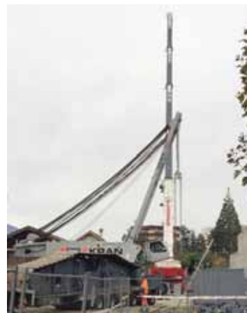
Le gigantisme de la grue dont une des chenilles est bien plus haute qu'un homme...