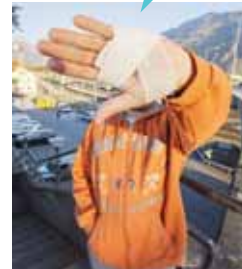
UN DES ADULTES, AGRESSÉ ET BLESSÉ

Le soir d'halloween, huit enfants accompagnés par trois adultes ont été violemment pris à partie dans le quartier de Beaulieu à Sierre par une bande de jeunes armés de battes de baseball. «Tout d'un coup, ces jeunes se sont retrouvés devant nous. Ils étaient masqués avec des capuches et des foulards», raconte une maman. S'ensuivent des bousculades, des menaces et une bagarre. La famille a ensuite pris la fuite