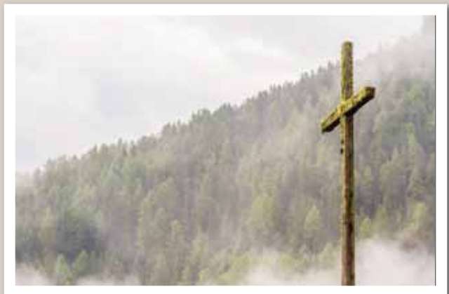
Le coup de cœur du jury est allé à Julien Gaspoz pour sa photo de «La Croix de Grimentz».