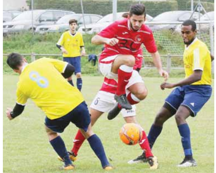
Le FC Grône face au FC Miège. Ou le charme de la quatrième ligue et de ses derbies sierrois. REMO

– Granges (4e ligue) : les Grangeards voulaient remonter le plus