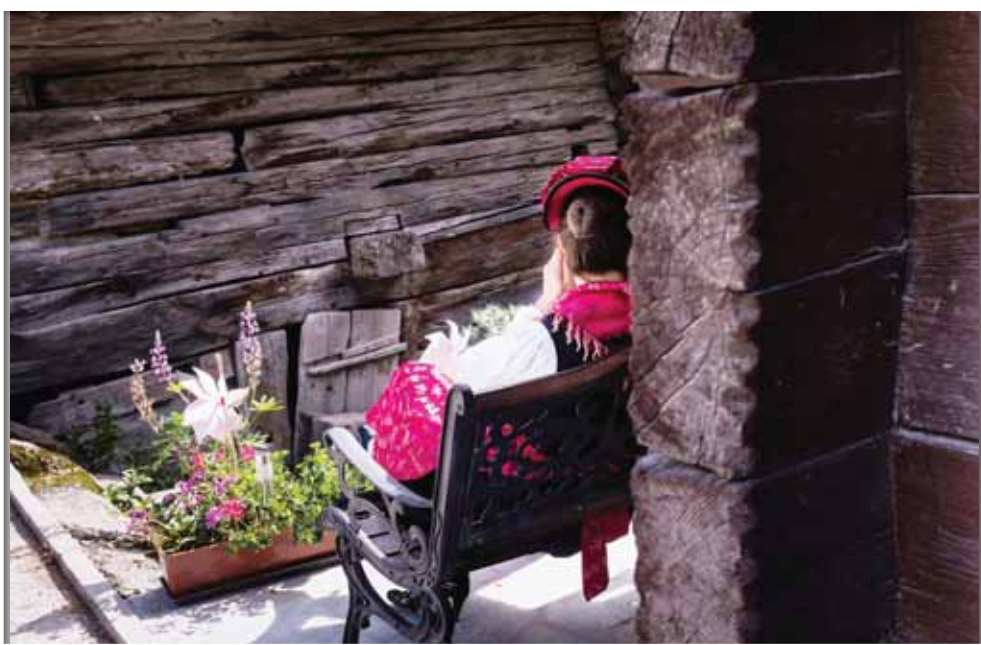
Moment de répit pour cette Anniviarde en costume croquée par Raphaël Pasquini qui l'a baptisée «1er Août» et qui remporte le 1er prix du concours qui a réuni quinze participants.