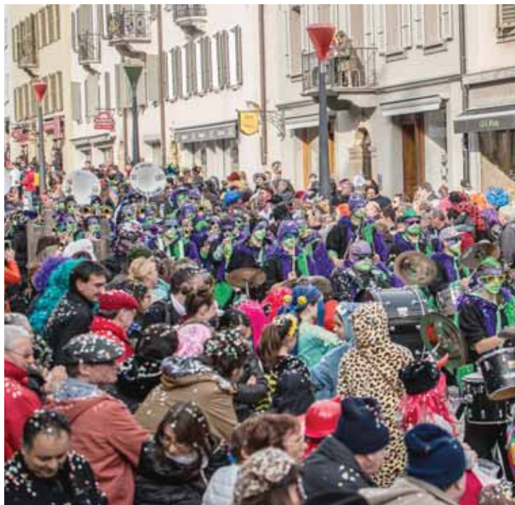
La guggenmusik Zikadonf lors de son défilé à l'occasion du carnaval de Sion. VOEFFRAY

Au fil des années, le niveau musical des formations s'est élevé. En revanche, leur nombre a diminué en