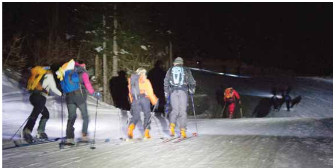
La peau de phoque de nuit a son charme. Mais sur des domaines sécurisés, c'est mieux pour tout le monde.

plus en plus de gens qui font de la peau de phoque le long des remontées mécaniques, à toute heure du jour et de la nuit, les stations ont décidé de faire un pas en direction de ces... aventuriers. Crans-Montana reste ouvert le lundi, Vercorin le mardi, Anzère le mercredi et Nax le jeudi. Et chaque soir, un restaurant d'altitude est à la disposition pour se restaurer et se réchauffer. En général, ils sont pris d'assaut.