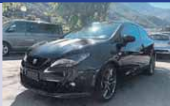
Seat Ibiza SC 1.4 TSI Cupra R210 Boîte manuelle automatisée, essence, 210cv, noir, 2011, km 56'050 CHF 13'300.- CHF 12'300.-