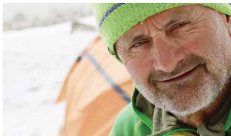
Jean Troillet présente le film qui lui est consacré, «Jean Troillet, une vie à 8000 mètres» et conversera avec le public sierrois.