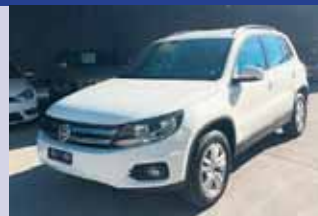
VW Tiguan 2.0 TSI 4Motion Boîte manuelle, essence, SUV/tout terrain, 180cv, blanc, 2015, km 6'112 CHF 25'900.- CHF 24'900.-

... ainsi que plus de 100 autres occasions à découvrir dans nos parcs d'exposition