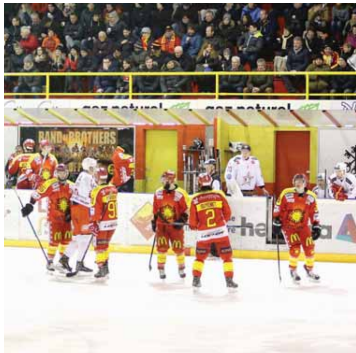
Le public sierrois devra impérativement répondre présent mardi à Graben. La quatrième place est en jeu. REMO

Alors, peut-on raisonnablement croire à un retournement de situation lors des trois derniers matchs