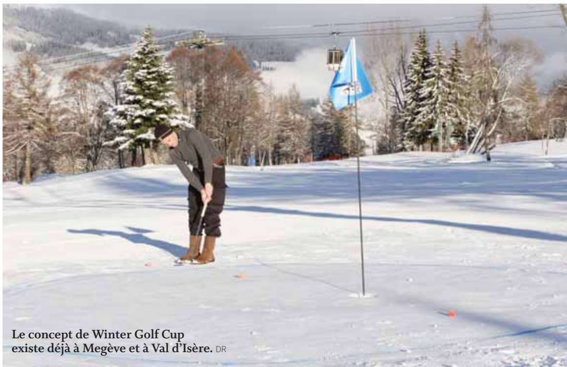
Le concept de Winter Golf Cup existe déjà à Megève et à Val d'Isère.

LOBBYING Crans-Montana occupe le terrain, avant même d'avoir annoncé officiellement sa candidature aux Mondiaux.