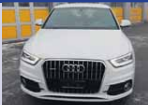
Audi Q3 2.0 TDI Quattro S-Tronic Boîte man. autom., Diesel, SUV/tout terrain, 177cv, blanc mét. 2013, km 35'874 CHF 38'500.- CHF 37'500.-