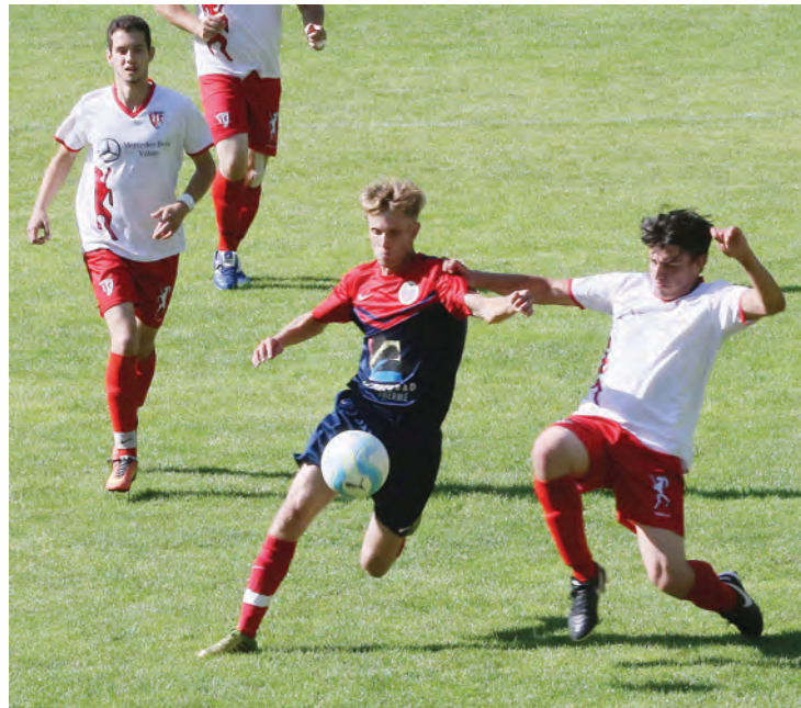
La Coupe valaisanne n'est jamais simple à négocier pour les clubs de 5 e ligue. Le FC Anniviers s'est incliné 7-1 face à Varen (3 e ligue).