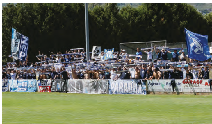
Peu importe le grade de l'adversaire. Pour les fans zurichois, un match reste un match. Ils ont donc effectué le déplacement en Valais avec leurs couleurs. REMO

Les premières bribes de réponses quant à la compétitivité des «vert et blanc» sont déjà tombées, puisqu'ils se sont déplacés à Collex-Bossy (victoire 3-1) et ont reçu Terre Sainte (défaite 3-2). Ce début de saison avec déjà trois points et cinq buts de marqués est très encourageant. Et pourtant, une montée en 2e ligue inter ne se fait jamais sans