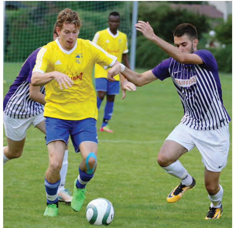
Le FC Granges souhaite une nouvelle fois jouer les premiers rôles en 4 e ligue. Il possède deux chances, puisqu'il a deux équipes dans cette ligue. REMO