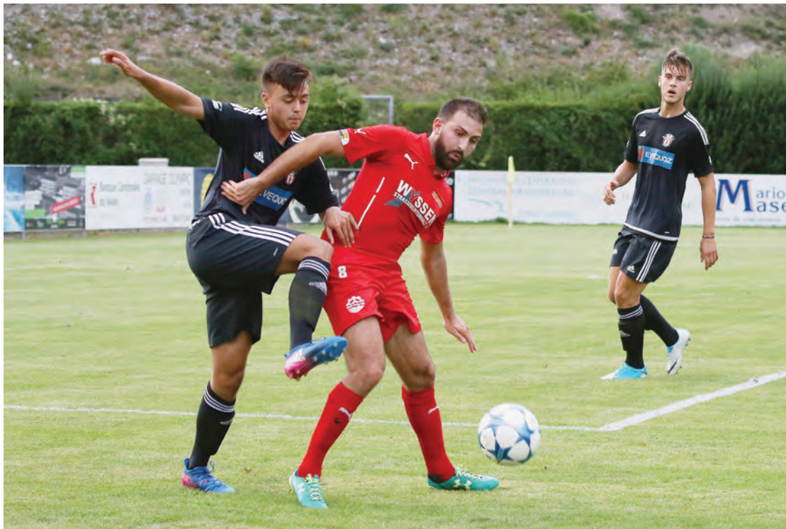
Le FC Sierre se retrouve en 2e ligue. Le club phare du district, avec ses 480 membres, vaut mieux que cette division. REMO

valaisanne plus forte que jamais, ce groupe reformaté part quelque peu dans l'inconnue.