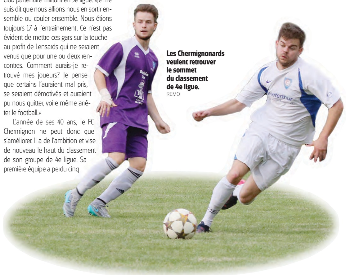
Les Chermignonards veulent retrouver le sommet du classement de 4e ligue.