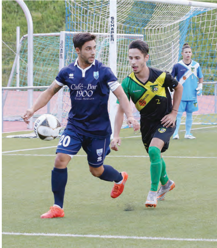
Crans-Montana évolue sur du synthétique. Idéal pour avoir un terrain praticable dès février. Une situation meilleure que dans certains clubs de plaine. REMO

Le club de la Moubra compte dans ses rangs 110 juniors, répartis entre l'école de football, deux équipes de juniors E, une de D, de C et de B. Comme dans la majeure partie des clubs de la région, les juniors A sont passés à la trappe. «Nous espérons pouvoir inscrire une formation de A lors du prochain championnat. Pour l'heure, les jeunes qui ne sont plus en âge de jouer en B sont progressivement intégrés dans la première et la deuxième équipe d'actifs. Ainsi, ils n'arrêtent pas le football», poursuit le président. Autre avantage: ces jeunes, même s'ils n'ont pas un gros temps de jeu, se familiarisent déjà avec le niveau supérieur et son côté plus physique.