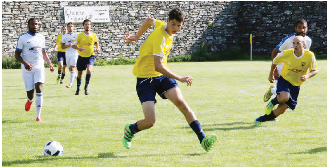
Le FC Miège est reparti dans sa saison avec des ambitions. Il se verrait bien décrocher un podium en 4 e ligue.