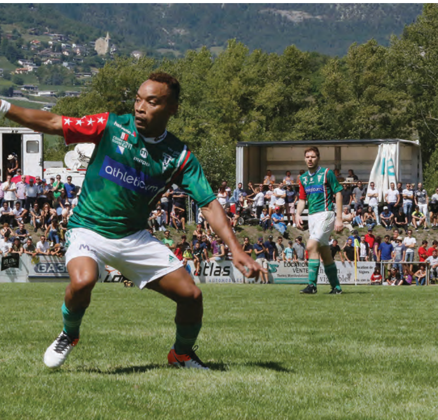
2 e ligue inter, le FC Chippis joue sur une place des Sports aussi bien garnie. REMO

mal. Une saison à ce niveau doit également se gérer en dehors des terrains.