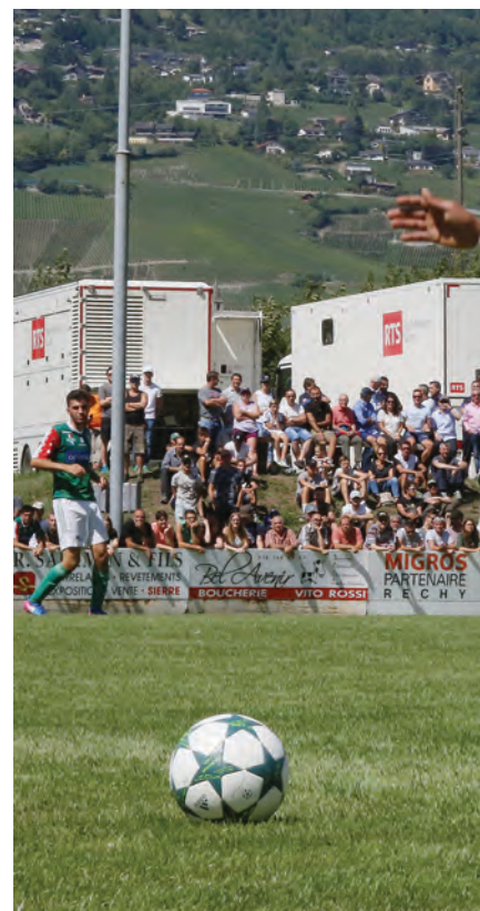
Il n'est pas certain que lors des matchs de 2e ligue inter...

C'est désormais en championnat de 2e ligue inter que le FC Chippis va écrire les prochains chapitres de son histoire. Afin d'effacer de la mémoire