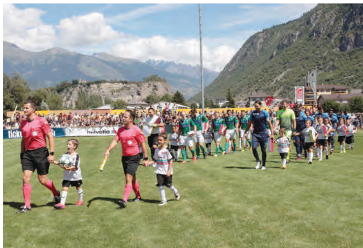
L'entrée des joueurs. Un moment très important: surtout pour les enfants qui ont eu la chance d'accompagner les deux équipes. REMO