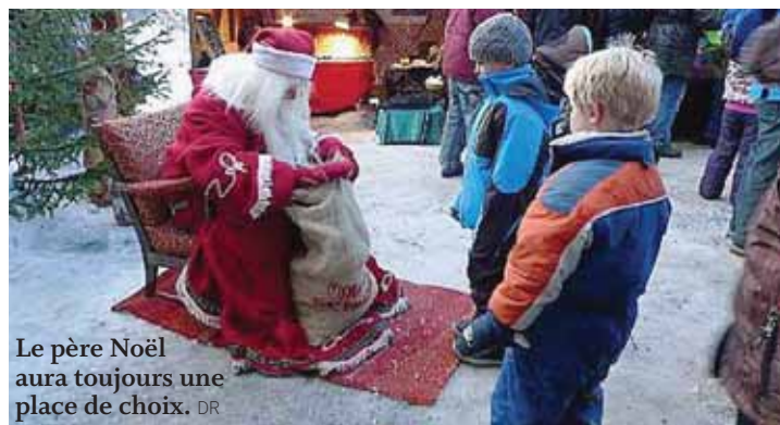
Le père Noël aura toujours une place de choix.

GRIMENTZ Depuis quatorze ans, les Féeries de Noël enchantent Grimentz. Une trentaine d'artisans participeront au marché de Noël les 9 et 10 décembre prochains lors de la quinzième édition. La visite du père Noël et de