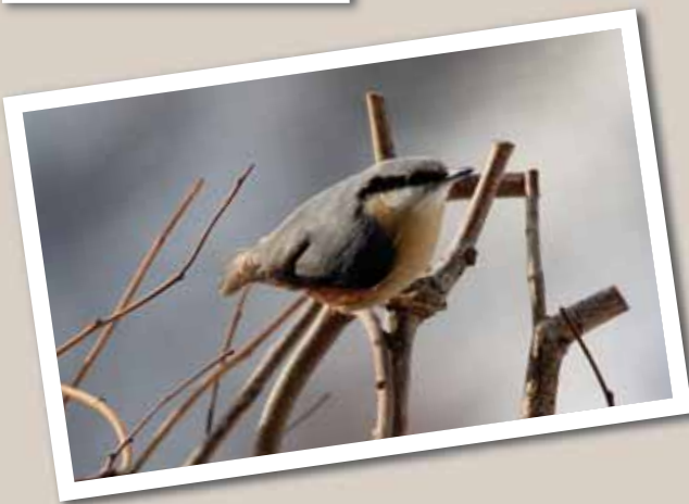
La sittelle, oiseau rapide identifiable grâce à son bec large et à sa queue courte. REMO

Le geai des chênes, un oiseau guetteur au chant varié, passant de cris rauques, brefs, forts et stridents aux gloussements ou à des espèces de miaulements: le geai cacarde.