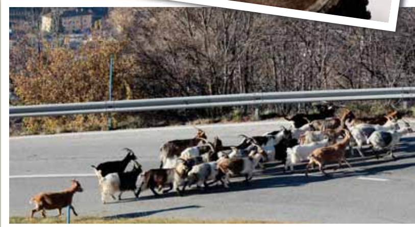
Pas de passage piétons pour les chèvres! REMO