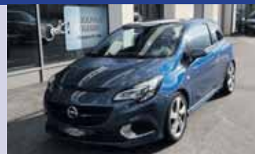
OPEL Corsa 1.6 Turbo OPC

Boîte manuelle, bleu mét. 2015, km 70'300 CHF 14'900.-