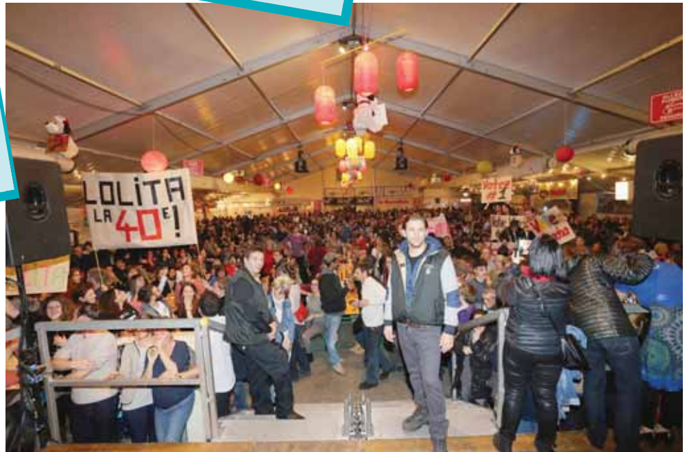
En langue sierroise, la Braderie de la Sainte-Catherine se traduit par: «Aller à la Foire et passer sous la tente.»