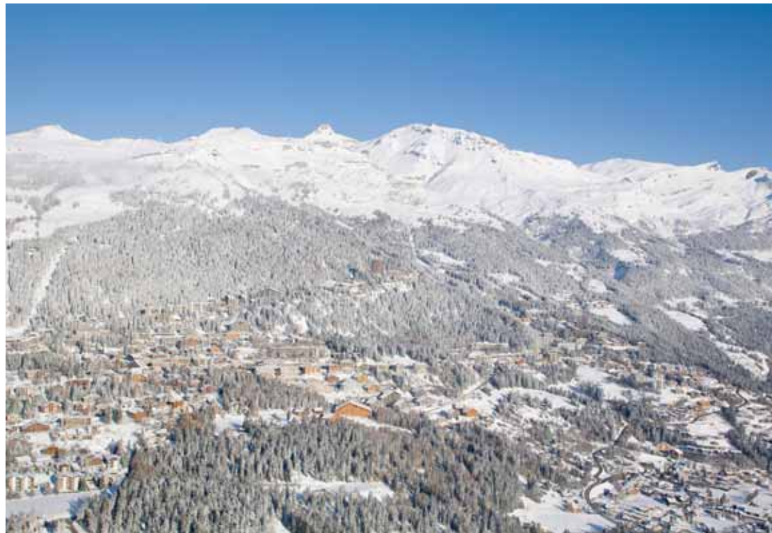
Crans-Montana aura sa nouvelle taxe si les assemblées primaires des trois communes l'acceptent le 18 décembre prochain.