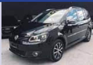
VW Touran 1.4 TSI Highline DSG

Boîte auto, noir 2013, km 33'200 CHF 22'900.-