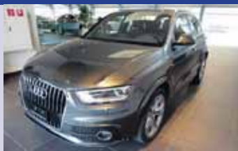
Audi Q3 2.0 TFSI Q S-Tronic

Boîte auto, gris 2013, km 104'000 CHF 24'300.-