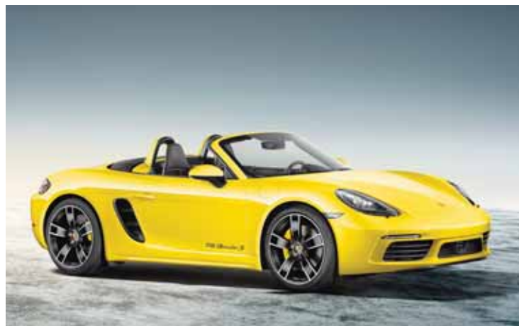
Le premier prix de la tombola: un week-end en Porsche Boxster. Jouez sur le stand du «Journal de Sierre» et gagnez.

velliste, «Le Journal de Sierre» organise un concours tombola gratuit avec de nombreux prix dont un week-end en Porsche Boxster, d'une valeur de 1000 francs, offert par le Centre Porsche de Sierre. Des forfaits de ski à Crans-Montana et en Anniviers sont également