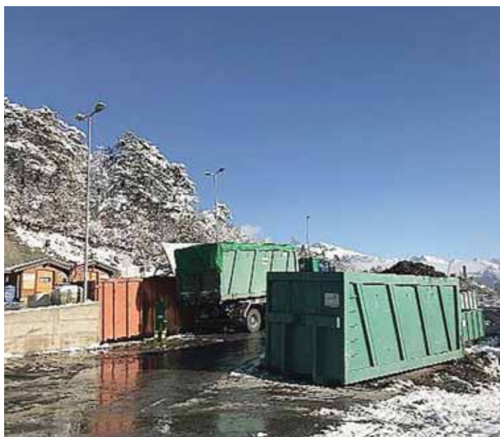
Les particuliers peuvent amener leurs déchets pour le tri, soit dans les écopoints de leur commune, soit à la déchetterie. Comme ici, aux Fougirs à Lens/Crans-Montana.