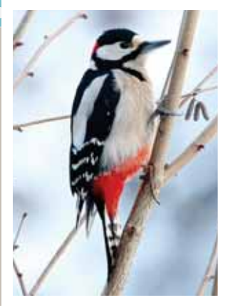
L'étonnant plumage du pic épeiche. REMO

NATURE L'OBJECTIF DE NOTRE PHOTOGRAPHE SE PROMÈNE À NIOUC.