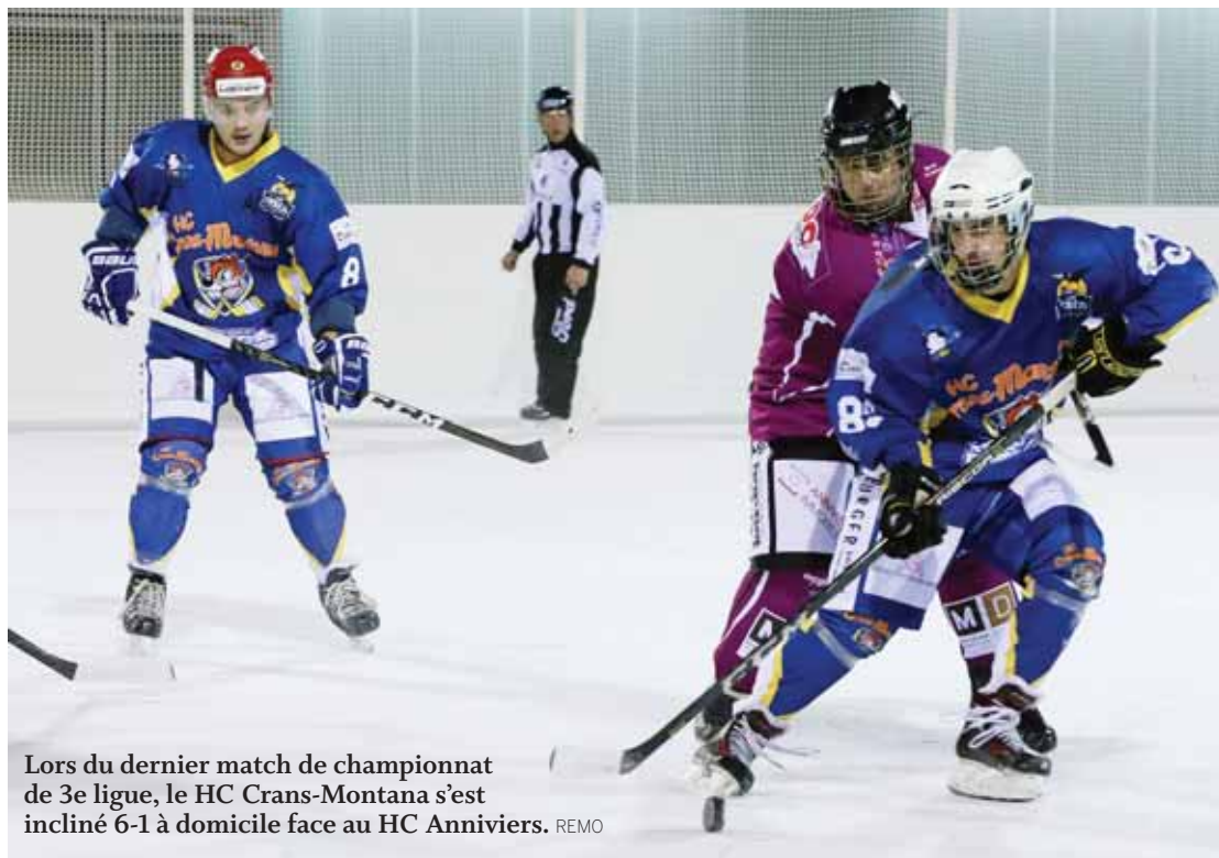
Lors du dernier match de championnat de 3e ligue, le HC Crans-Montana s'est incliné 6-1 à domicile face au HC Anniviers. REMO

Ses équipes d'adultes sont moins actives. Cela n'empêche pas le club de continuer à travailler avec la jeunesse.