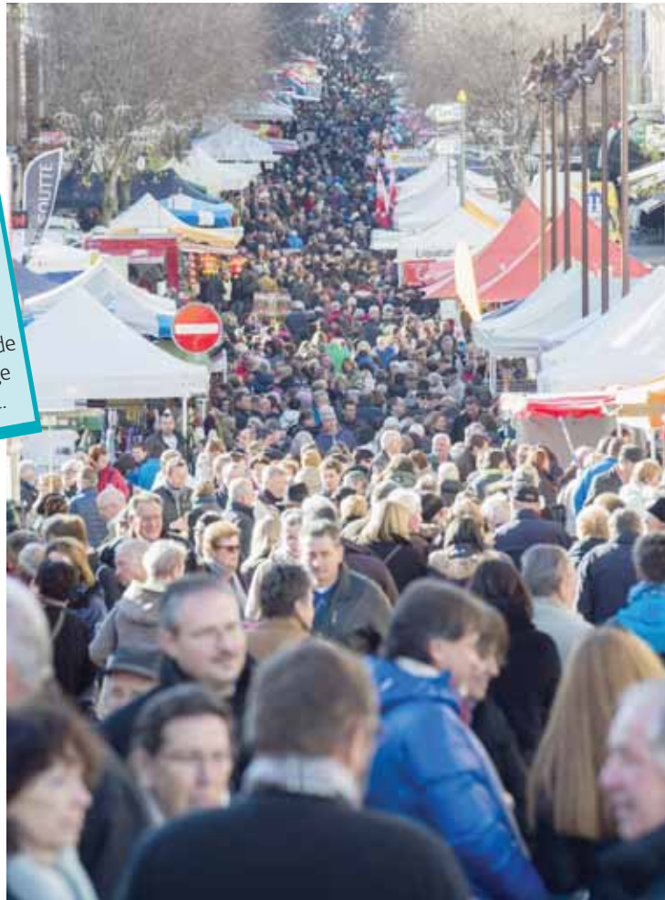
L'Avenue Général-Guisan, la colonne vertébrale de la Foire de la Sainte-Catherine, les lundi et mardi. REMO

Visiteurs: C'est une estimation du nombre de gens qui se déplacent à Sierre le lundi et le mardi de la Foire de la Sainte-Catherine. Il faut ajouter à cela les 5000 à 6000 personnes (chiffres officiels) qui passent sous la tente. Il n'est pas impossible que certains cumulent.