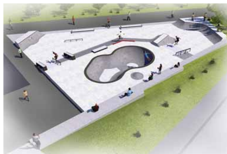
Le plan du nouveau skatepark. Pour que l'espace atteigne 500 m 2 et soit utilisé de manière optimale, l'association a besoin de 80 000 francs supplémentaires.