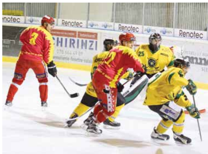
Le HC Sierre jouera son dernier tour de Coupe de Suisse face à Sion. Le vainqueur sera qualifié pour le tableau final.