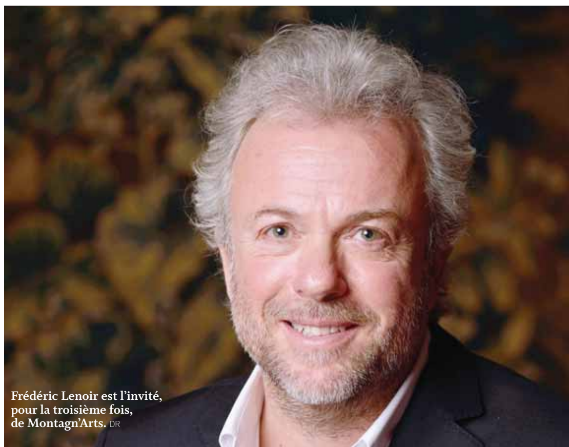
Frédéric Lenoir est l'invité, pour la troisième fois, de Montagn'Arts.