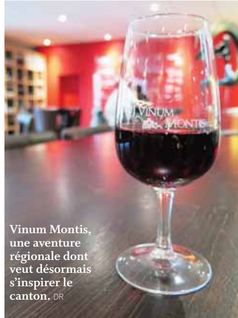
Vinum Montis, une aventure régionale dont veut désormais s'inspirer le canton.

Vinum Montis, rappelez-vous, héberge sur son site 1671 vins, 66 caves, dont 64 avec des forfaits de dégustation, 59 informations concernant le monde du vin, 7 œnothèques, 46 offres œnotouristiques, 30 événements par semaine, 6 hébergements ayant un lien direct