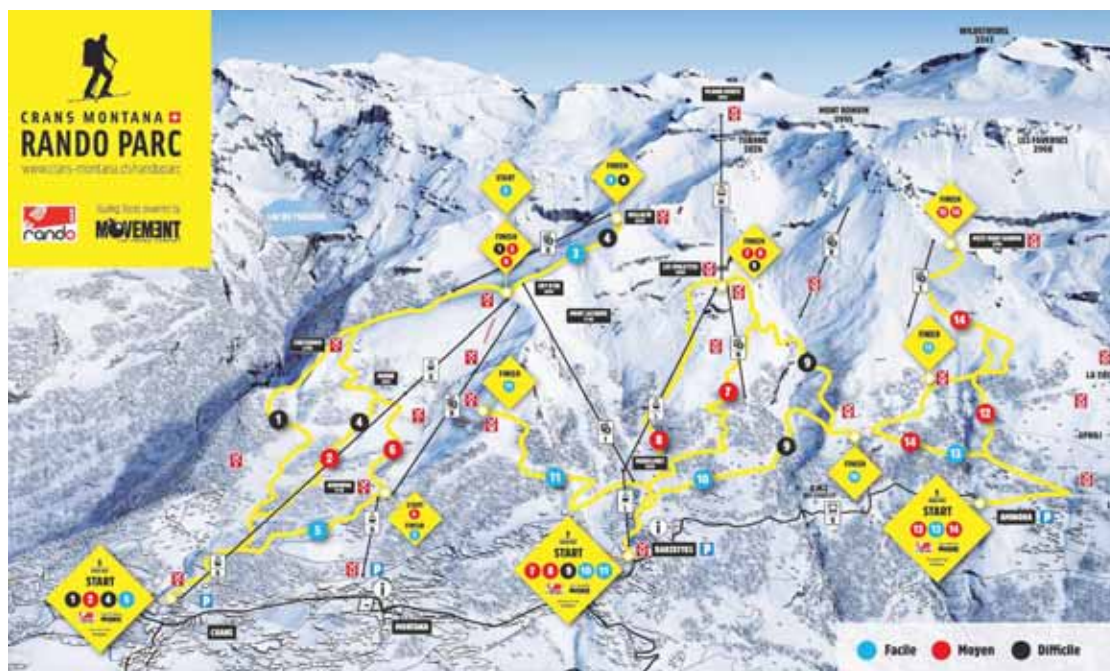
Trois départs en station, quinze parcours. Le domaine skiable est couvert dans son ensemble. DR

Cette saison, ce formidable terrain de jeu va proposer de nombreuses courses. Le triptyque intitulé Vertical Nights a déjà débuté le 27 décembre avec une centaine de participants inscrits, malgré des conditions plutôt hivernales. Il va se poursuivre le 14 février et le 4 avril. Cette offre sera complétée par la 7e Nocturne du Loup le 13 janvier et par le 13e Défi des Faverges le 17 mars. De quoi se préparer de la meilleure des manières pour la Patrouille des glaciers.