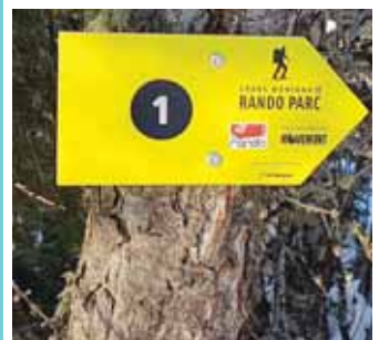
Indicateur de direction. COMBE

Il peut s'équiper dans les magasins de sports de la station, qui louent désormais également du matériel de ski-alpinisme. Si le visiteur n'a pas trouvé la carte des quinze parcours dans son hôtel, il pourra la récupérer à ce moment-là. Elle lui permettra de chercher des tracés adaptés à son niveau. En station, les départs pour les randonnées sont répartis sur trois sites: Crans-Cry d'Er, les Barzettes et Aminona. En chemin, les promeneurs seront aiguillés par une signalisation sur fond jaune. Il y est à chaque fois indiqué le numéro du ou des parcours empruntés. Pour utiliser ce rando parc, il faut avoir une vignette journalière (5 francs) ou un abonnement de saison (50 francs). Ils sont en vente aux caisses des remontées mécaniques, dans les offices du tourisme et certains magasins de sport. Cette taxe permet d'utiliser les chemins pour monter et les installations (y compris les télécabines) de CMA pour la descente. Elle assure également une prise en charge en cas de problèmes majeurs, comme pour un skieur traditionnel. Les titulaires de Magic Pass ou d'abonnement de saison CMA sont dispensés de la vignette.