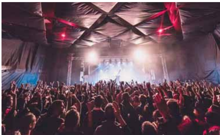
Bourask festival, le premier de l'année.

VENTHÔNE Après la tempête, vous prendrez bien une dernière bourrasque? La huitième édition du Bourask festival se déroule les 27 et 28 janvier à la salle polyvalente. Le petit festival aime les poètes du rap, la pop qui fait danser, le festif qui vous porte devant la scène. Un vendredi hip-hop et pop avec notamment Don Choa issu de la célèbre Fonky Family, mélange de révolte et d'humanité ou Chill Bump, nouvelle tendance électro entre turntablism et samples.