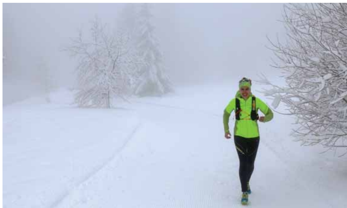
Courir sur la neige. A Crans-Montana, une piste damée tout au long de l'année le permet.

Dimanche 21 janvier 10 h Briefing à Sorebois 10 h 30 Suite de la compétition 13 h Master top 15 16 h Résultats au restaurant La Versache