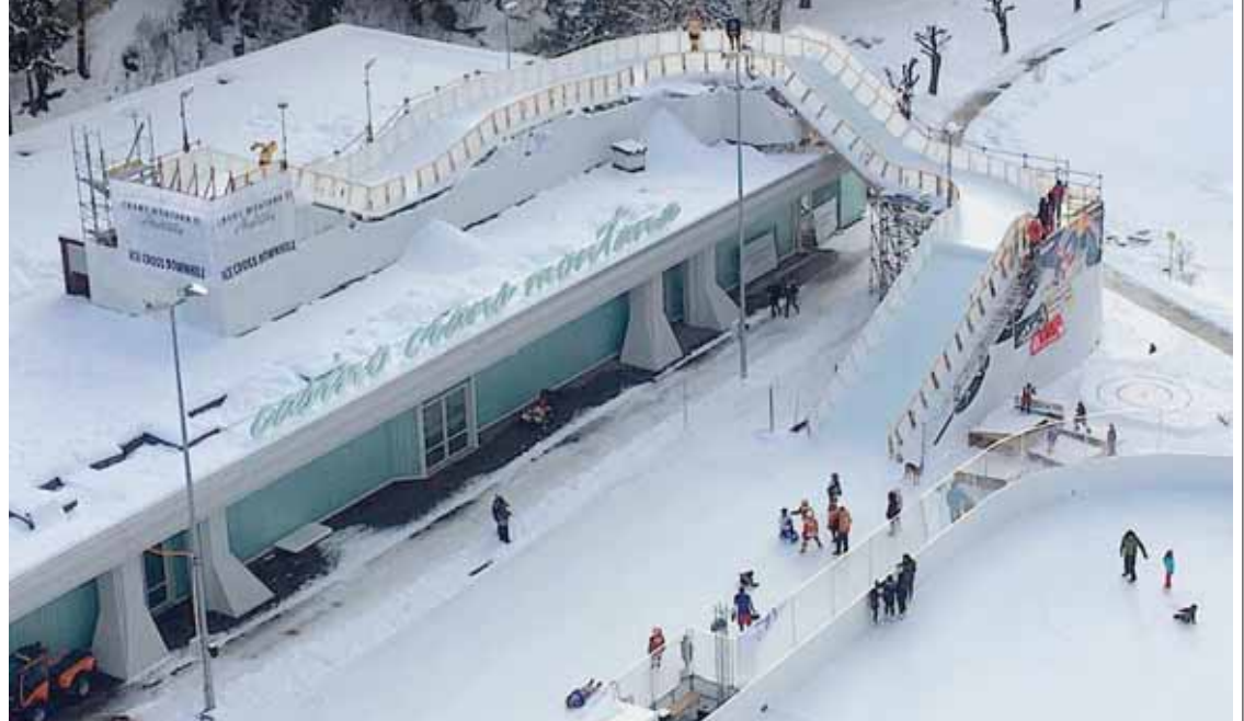
Le départ de la piste se situe sur le toit du Casino, un des principaux partenaires du projet. REMO

CRANS-MONTANA La patinoire d'Ycoor possède une nouvelle structure. Posée sur le toit du Casino, elle se déroule jusque sur la surface de glace. Il s'agit de la première installation artificielle au monde permettant la pratique de l'ice cross downhill durant plus de trois mois. Cette rampe, longue de 80 mètres, permet aux meilleurs patineurs d'atteindre une vitesse de pointe allant jusqu'à 50 km/h.