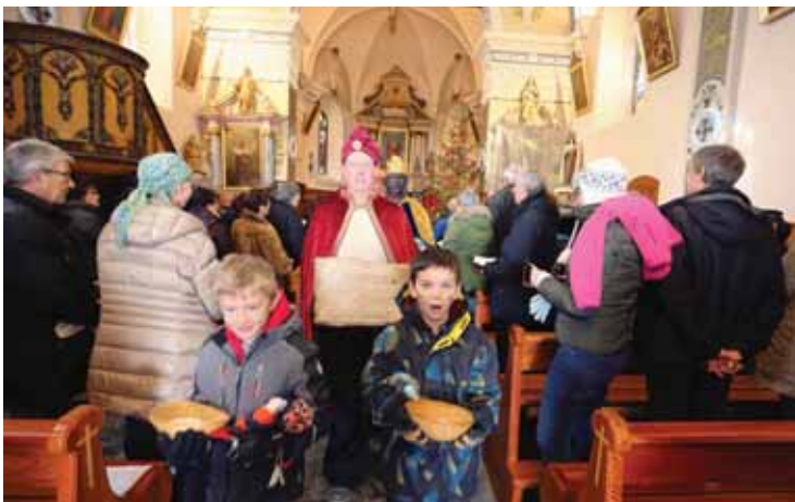
A la sortie de la messe, ferveur et enthousiasme lors de la Fête des Rois. REMO