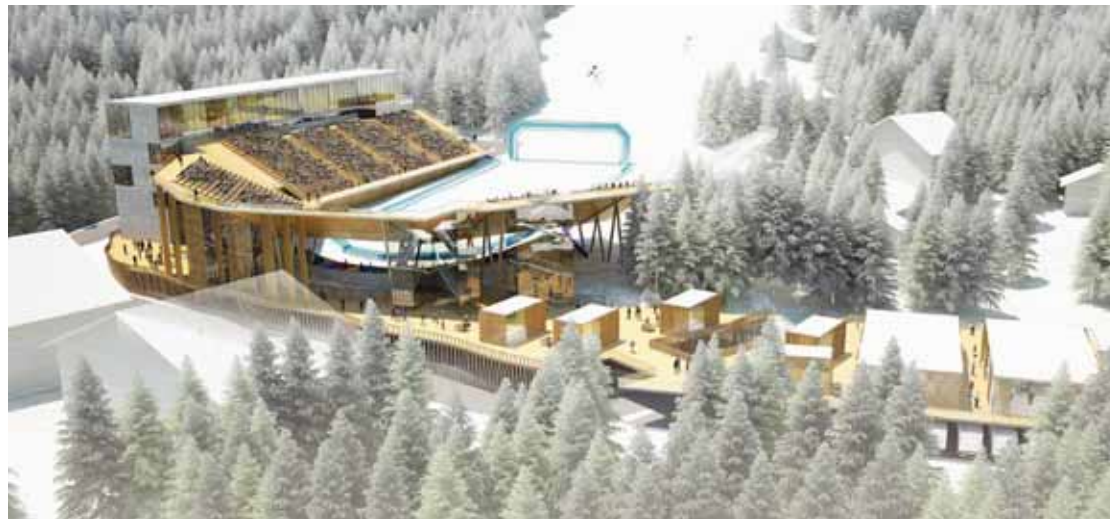
Les plans du stade d'arrivée tiennent compte de toutes les exigences de la FIS. Un de ses spécialistes a aidé le comité d'organisation de Crans-Montana. WWW.SKICM-CRANSMONTANA.CH

Trois aménagements se profilent: l'enneigement artificiel du sommet de la Nationale; le remodelage de la crête de Cry d'Er; et la construction d'un télésiège au niveau du slalom, en vue des futurs slaloms parallèles mis au programme par la FIS.