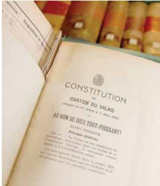
Pour ou contre une révision totale de la Constitution valaisanne qui date de 1907? Et si oui, par qui?

Le Conseil d'Etat et le Grand Conseil soutiennent la révision totale de la Constitution par les citoyens. Le PDC et l'UDC estiment que la révision doit se faire sur quelques points seulement, par étapes et par les députés. Du côté des défenseurs d'une révision totale et citoyenne, la Constitution cantonale n'est plus adaptée à la société actuelle et à ses défis (structure peu cohérente, dispositions désuètes, termes datés). La révision totale est un projet ambitieux mais les révisions entreprises dans d'autres cantons suisses démontrent que la tâche n'est pas insurmontable. Le comité d'initiative dit ne pas croire en une révision partielle, le nombre d'articles de la Constitution à réviser obligerait à trop de débats au sein du Grand Conseil, suivis de votations. La tâche est absorbante et devrait, de ce fait, être effectuée par une nouvelle assemblée. Ils estiment qu'une forte participation de la société civile donnera toute sa légitimité à ce travail de fond. Pour les opposants, s'ils sont favorables à des révisions partielles, ils rejettent l'idée de présenter au peuple de nombreux sujets dans une sorte de fourretout. Constituer une nouvelle assemblée ne serait qu'un Grand Conseil bis avec son même mode d'élection, même nombre d'élus, arrondissements... Les