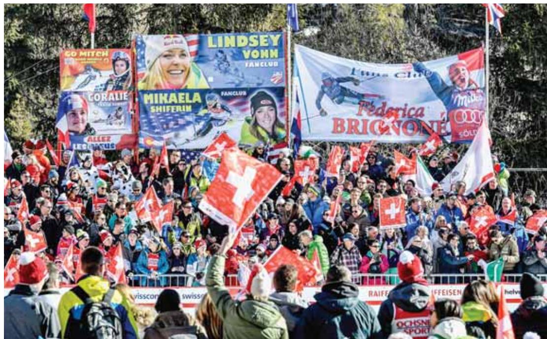
Les gradins remplis de Crans-Montana feront honneur aux skieuses. Ce ne fut pas toujours les cas lors des derniers JO.