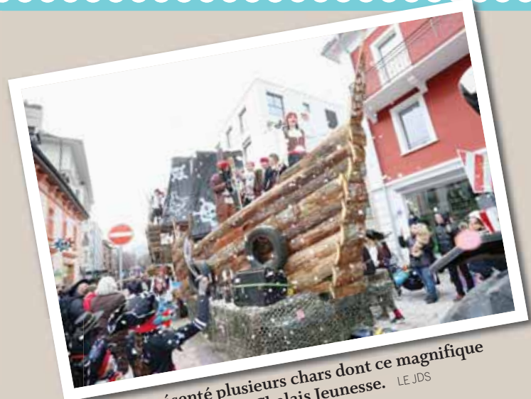
Chalais a présenté plusieurs chars dont ce magnifique bateau pirate signé par Chalais Jeunesse. LE JDS