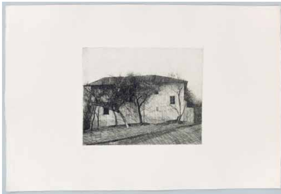
Gérard de Palézieux: Le Moulin de Miège, eau-forte.

Natures mortes et paysages, quelques figures féminines aussi, les motifs classiques et délicats révèlent la pudeur de l'artiste, son attachement à la région aussi où il s'est installé dans les années 40. Le graveur simplifie, grave peu de détails, il excelle dans les gris aussi. Après les eaux-fortes et la pointe sèche, Palézieux est passé au vernis mou, il possède une grande connaissance de toutes les techniques. Le travail sur papier le passionne, il teste de nouveaux effets d'encre, il expérimente: il s'intéresse à la lithographie en 1999. L'artiste ne travaille cependant pas sur la pierre mais sur un papier spécialement préparé qui permet d'y