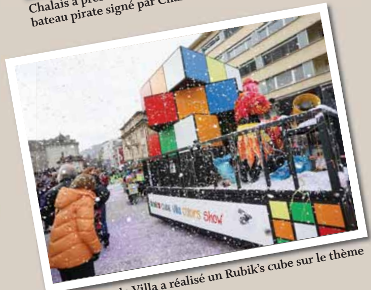
Le quartier de Villa a réalisé un Rubik's cube sur le thème des couleurs. REMO