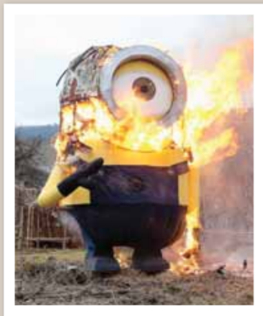
Muraz, comme à son habitude, a brûlé son bonhomme hiver sur le thème de «Muraz, moche et méchant». REMO