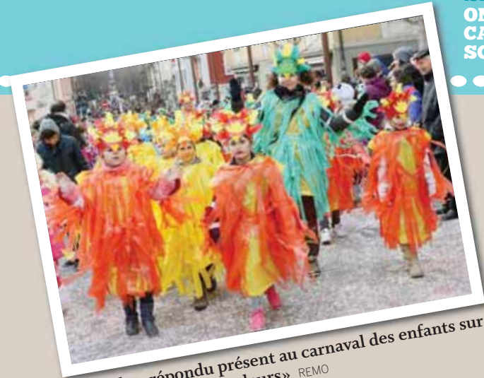
La foule a répondu présent au carnaval des enfants sur le thème «Tout en couleurs» REMO