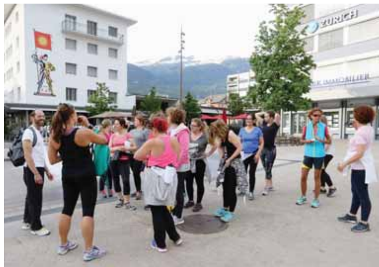
Les séances d'urban training de Sierre débutent à 18 h 30 sur la place de l'Hôtel-de-Ville. REMO