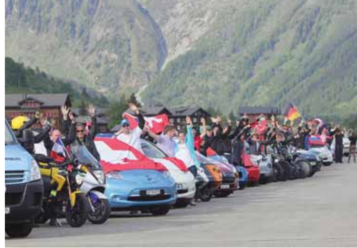
Les Sierrois pourront découvrir des véhicules électriques futuristes, comme ici, en même temps qu'une quinzaine de stands dédiés au développement durable.

Sierre a mis sur pied une plateforme dédiée au développement durable. Le public est donc invité à découvrir des voitures électriques futuristes mais aussi une quinzaine de stands où des spécialistes pourront répondre aux questions très concrètes autour de la mobilité douce et des énergies renouvelables.