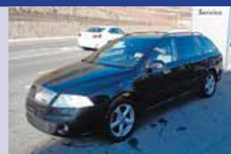
Skoda Octavia 2.0 TDI RS Boîte manuelle, noir mét. 2008, km 107'700