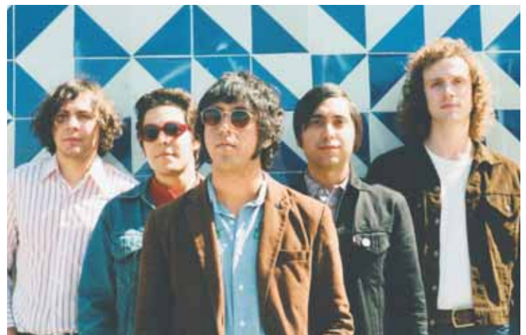
Levitation Room, combo américain de rock psyché se produira ce samedi à 18 heures à l'Espace Raiffeisen.

De midi à minuit. Tout le programme détaillé des événements dans chaque cave sur www.palpfestival.ch