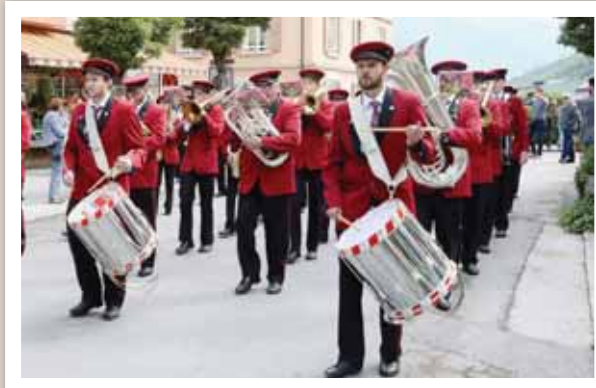
L'Echo de Chippis, organisateur du festival. 3000 spectateurs ont assisté au défilé. REMO