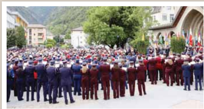
700 musiciens sur la place de l'Eglise le dimanche matin... REMO