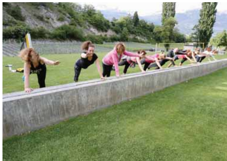
Le lac de Géronde et l'un des sites très souvent choisis pour un arrêt exercices.