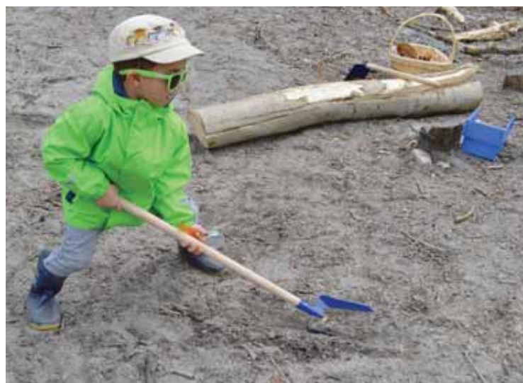
Lors des stages de cirque durant l'été ou à la crèche en forêt, les enfants vivent en nature à Tschüdanga.