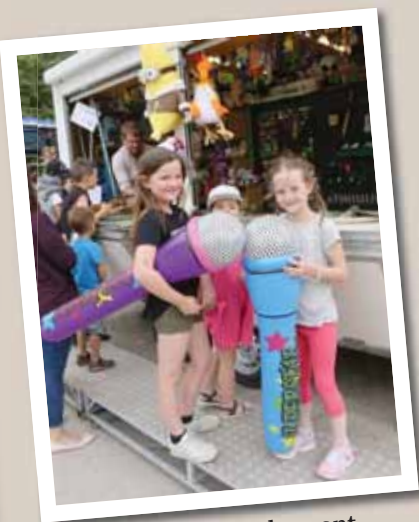
Au village du festival se sont déroulés de nombreux concerts et animations pour les enfants. 300 bénévoles ont participé aux trois jours de fête. REMO