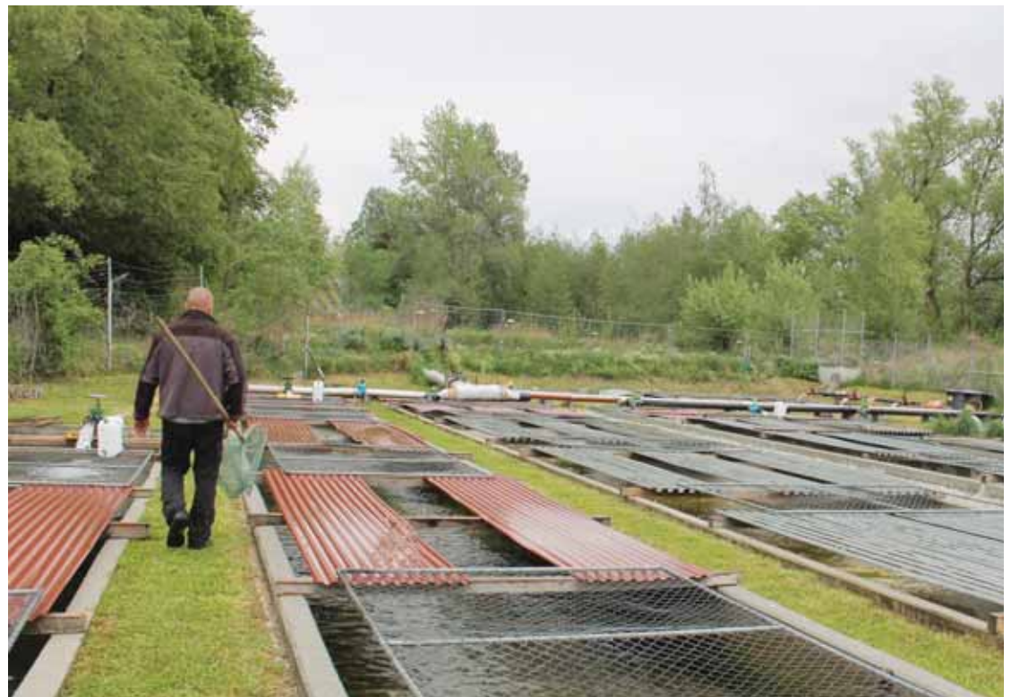
Régulièrement, les truites sont triées en fonction de leur taille.