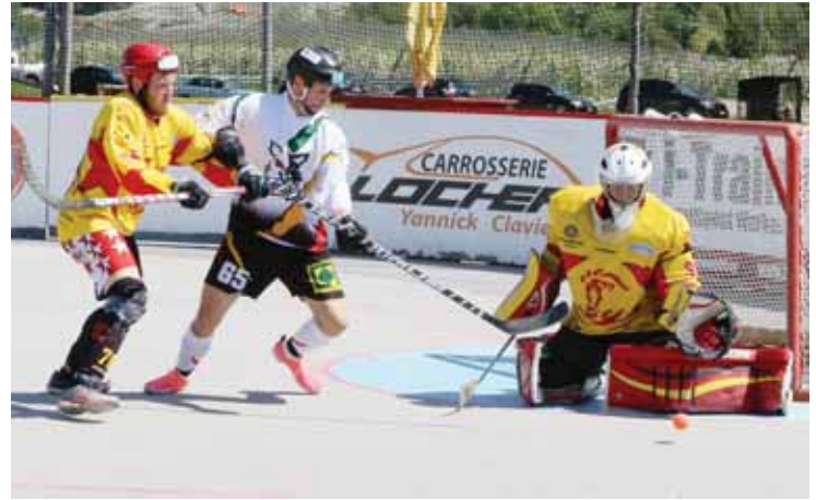
A domicile, en demi-finale, les Sierre Lions étaient tout proches des Oberwil Rebels. REMO

Ce n'est donc pas sur cette demi-finale que les Sierrois auraient pu être plus efficaces, mais tout au long de la saison. Ils ne se