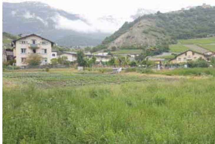
Sierre a gelé 37 hectares de zones à bâtir. Parmi elles, les terrains situés à côté du Château de Glarey.

Sierre est la première ville romande à prendre ces mesures: «Nous avons décidé d'être proac-