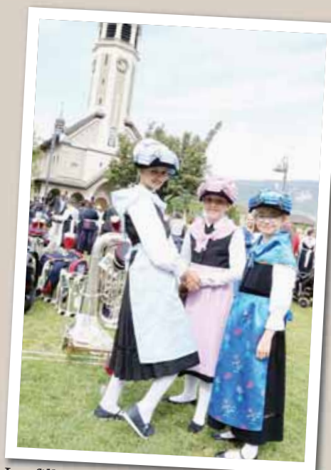
Les filles d'honneur de l'Echo des Alpes de Vissoie. REMO