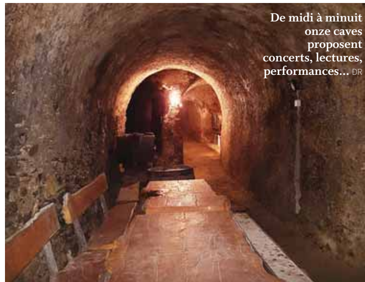
De midi à minuit onze caves proposent concerts, lectures, performances...

Lancé il y a huit ans, le Palp festival est devenu au fil des ans, le chouchou des festivals valaisans réussissant à combiner culture, rock et tradition, à décroquer les genres. Ses célèbres «Electrollette», dégustation de fromage sur fond d'électro s'exportent à Séoul et ailleurs. «Rocklette» à Bagnes promet toujours des artistes internationaux rock au sommet des montagnes. Sa traditionnelle Ex-