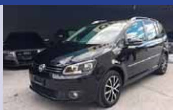
VW Touran 1.4 TSI Highline DSG Boîte auto, noir mét. 2013, km 33'200