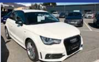
Audi A1 1.4 TFSI S tronic Boîte auto, blanc 2012, km 128'700