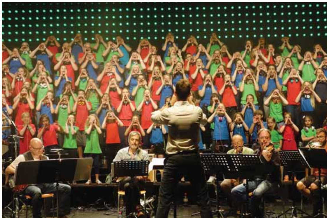
Le chœur GénérationS Arc-en-Ciel en concert au TLH-Sierre.