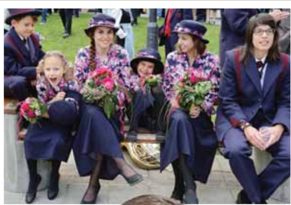
Petite pause après le défilé. Ici des membres de l'Harmonie de Salquenen. REMO