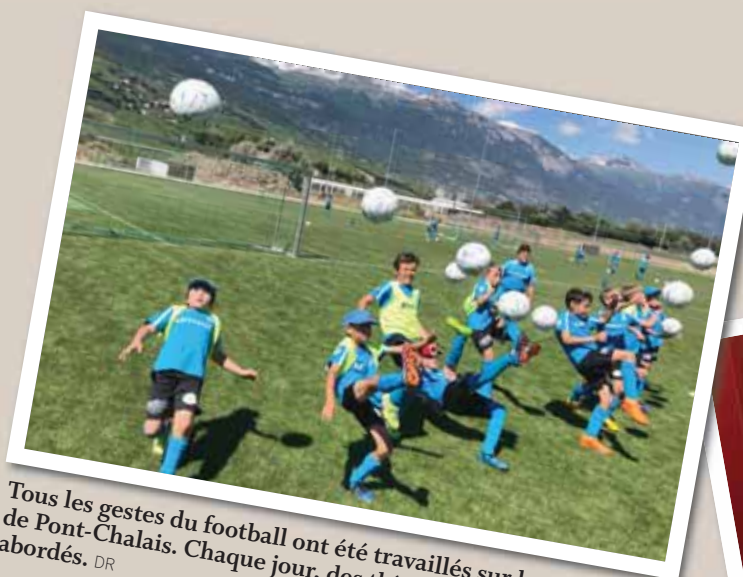
Tous les gestes du football ont été travaillés sur les terrains de Pont-Chalais. Chaque jour, des thèmes différents ont été abordés.