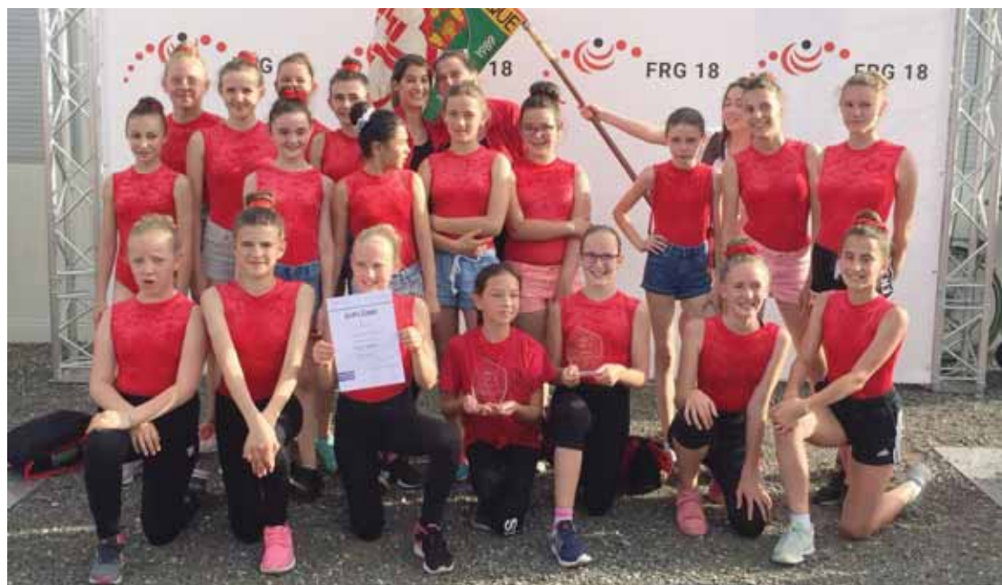
Les Miégeoises ont réussi leur Fête romande 2018. Elles reviennent de Lausanne avec deux podiums et cinq distinctions.