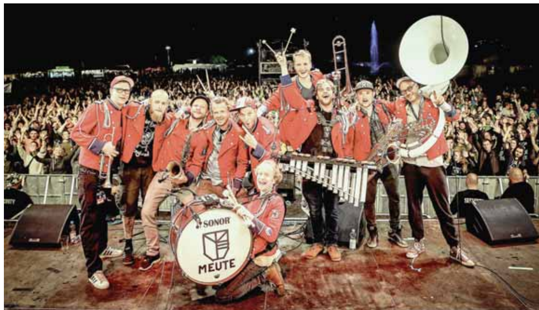
Meute, fanfare allemande originaire de Hambourg devrait mettre le feu aux poudres dimanche en clôture du festival Week-end au bord de l'eau.

SIERRE Dix-neuf concerts vont se succéder sur la scène de Week-end au bord de l'eau dès 14 heures cet après-midi et jusqu'à dimanche 23 heures. Une programmation électrique et bien ficelée. Ça groove, ça danse, la qualité est au rendez-vous. Meute aura le privilège de clore le festival dimanche. La fanfare allemande originaire de Hambourg revisite les standards de la deep house et de la techno comme elle l'avait fait avec talent lors de la reprise de «The man with the red face» de Laurent Garnier. Depuis, les musiciens soulèvent les foules partout où ils passent. Un répertoire pour fanfare qui manquait au Valais et le coup de cœur du programmeur, Christophe Zwissig. On revient pour vendredi 29 juin à 21 h 15, «Moonlight Breakfast», trio qui fusionne nu-jazz, pop et