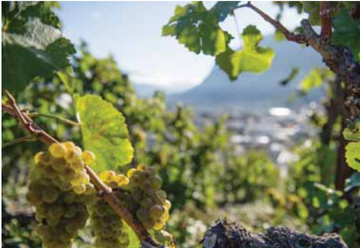
Vinum Montis Valais/Wallis, un annuaire développé qui rassemblera une grande partie de l'offre valaisanne en matière d'œnotourisme.