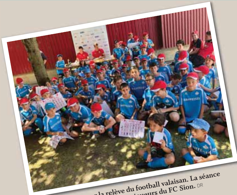
Grand moment pour la relève du football valaisan. La séance de signatures en compagnie des joueurs du FC Sion.