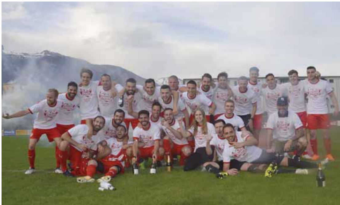
Les joueurs de la première équipe du FC Sierre n'ont pas boudé leur plaisir au soir de la promotion en deuxième ligue inter. Le but a été atteint en seulement une saison.

12 au 13 juillet 18 | Age 9 - 12 ans | Gratuit Info et Inscription www.pfyn-finges.ch ou 027 452 60 60