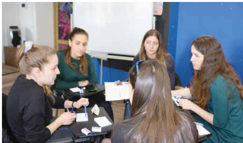
Des groupes de travail composés d'étudiants sierrois, fribourgeois et russes ont imaginé des projets qui seront réalisés par les étudiants russes. DR