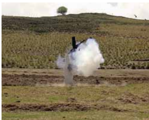
Une installation et photographie de Beatriz Canfield.