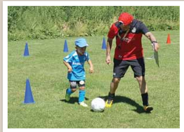
Il n'y a pas d'âge pour jouer au football et surtout prendre du plaisir. C'est une des notions fondamentales mises en avant durant cette semaine de camp. LE JDS