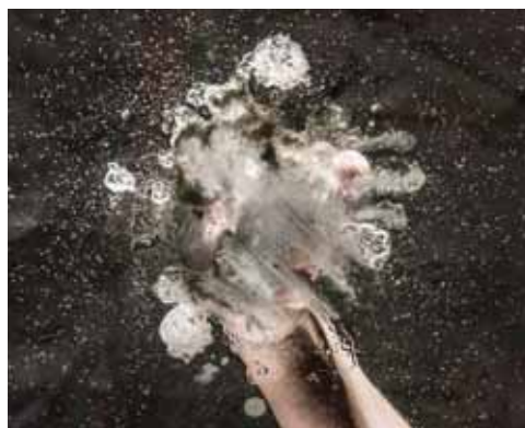
Louis Dasselborne signe la photographie que Pierre Zufferey a imaginée. DR