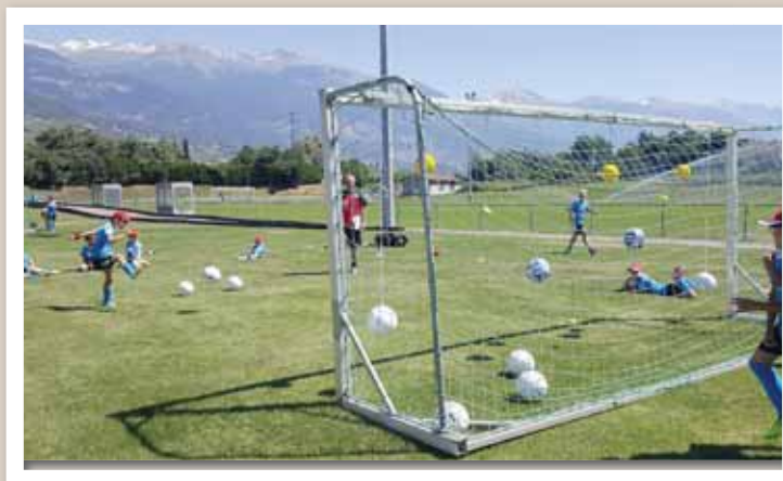
La journée du mercredi a été réservée aux super games. Six postes, six endroits pour tester son habileté: précision, vitesse et contrôle du ballon. LE JDS