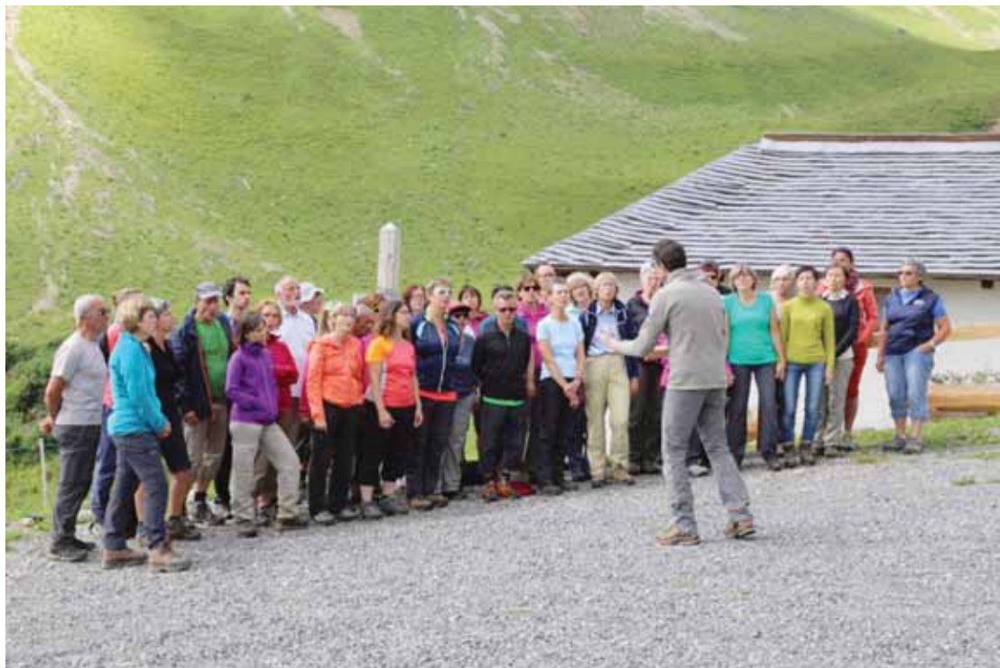
L'année dernière sur les hauts de Torgon, le camp d'été Un air de montagne. Chaussures de marche aux pieds et voix de tête!