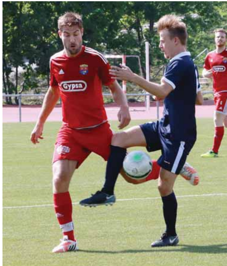
La deuxième équipe du FC Crans-Montana (4 e ligue) s'est inclinée 2-5 face à une formation de 2 e ligue: le FC Fully. REMO

En ce qui concerne la première équipe, la compétition officielle reprendra donc demain (19 h 30) à Ayent. Un test grandeur nature face au relégué de 3 e ligue. Mais cette formation montanarde est ambitieuse. «Le 90% de notre contingent était déjà présent la saison dernière. Nous enregistrons trois départs - des gars d'expérience - pour trois arrivées. Deux de ces trois nouveaux joueurs connaissent déjà la maison pour avoir évolué chez nous en première ou en juniors. Ce