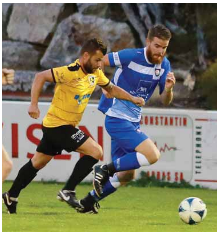
Le FC Chermignon peut encore surfer sur la vague du succès de la saison 2017-2018. Il n'était pas passé loin du barrage pour la promotion.

Le succès sportif du FC Chermignon a également été complété par des festivités réussies pour son 40e anniversaire. «Le temps était de la partie et nous avons passé deux belles journées. Les gens ont joué le jeu, le spectacle était chouette. Marie-Thérèse Porchet