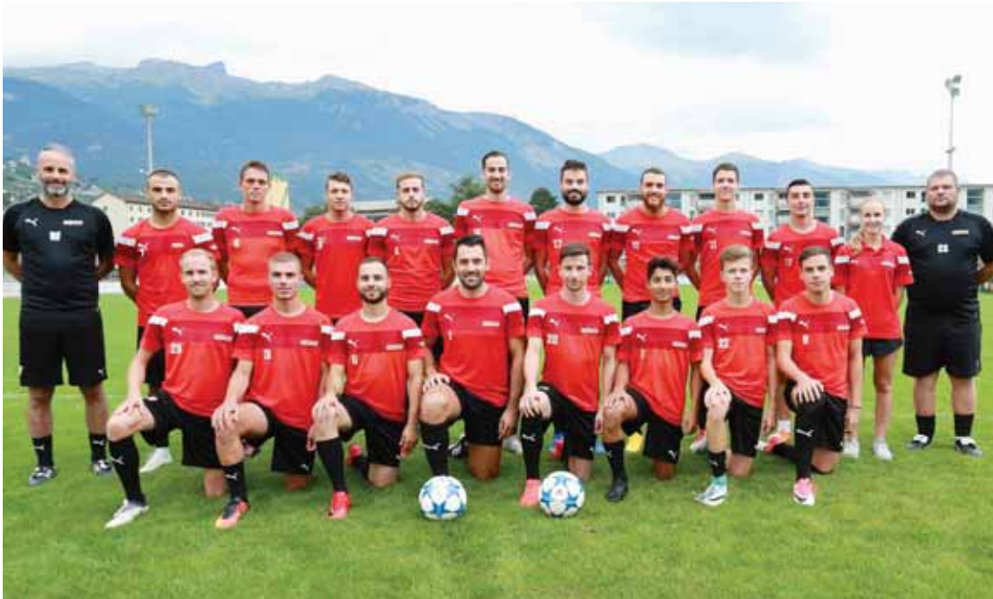
La première équipe du FC Sierre version 2018-2019. La tête de gondole d'un club qui compte 23 teams.