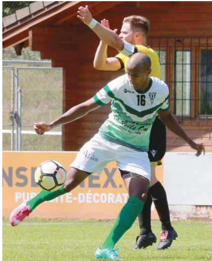
Le FC Chippis a fait 4-4 à domicile face à Collex-Bossy pour son premier match de la saison avant d'aller s'incliner à Monthey (4-0) samedi dernier.