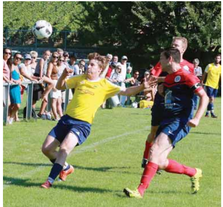
Dimanche, Miège à battu Varen 6-2 en Coupe valaisanne.