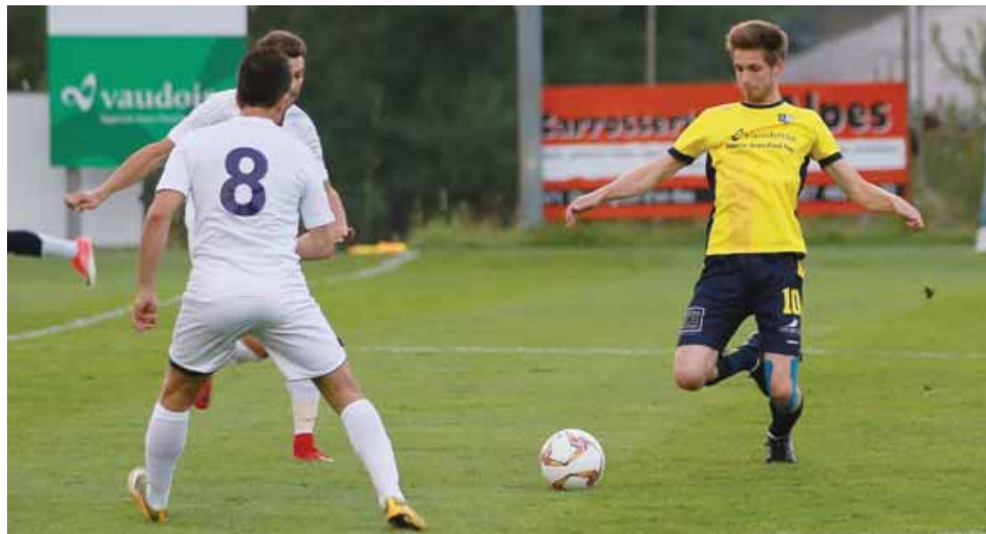
Le FC Lens a réussi à sauver sa place en 3 e ligue. A lui maintenant de confirmer, et pourquoi pas de faire mieux.