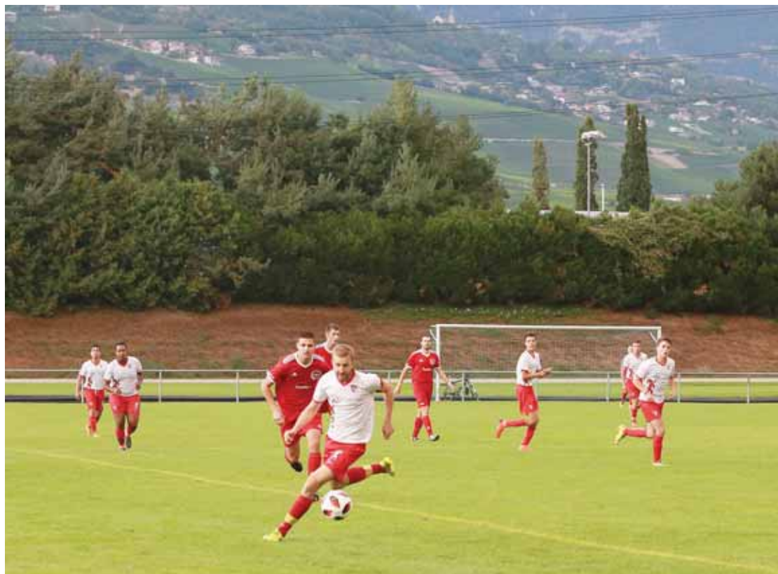
Les actifs du FC Anniviers, messieurs et dames, jouent leurs matches de championnat à Pont-Chalais. REMO

Le plus urgent était de racheter des ballons et du matériel afin que les équipes puissent continuer à s'entraîner. La première équipe et les filles sont à Condémines (voir encadré ci-contre), les juniors B