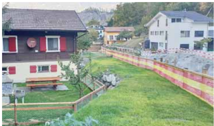
A la suite de la crue, le terrain plat des Schirinzi ne l'est plus. Et surtout une grande parcelle a été emportée par la Navizence.