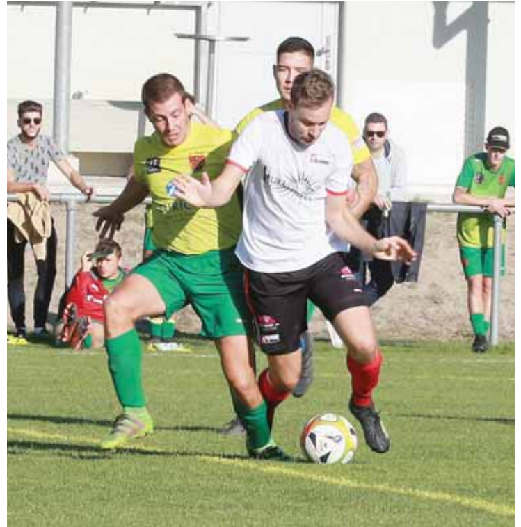
La rencontre entre Chalais et Miège s'est terminée par une victoire miégeoise arrachée à la 84 e minute de jeu. REMO

Tout va donc pour le mieux dans le meilleur des mondes de 4 e ligue pour le FC Miège qui se retrouve en tête de son groupe avec six points d'avance sur le FC Granges. Et même sept points, si l'on tient compte du classement fair-play, qui parle également en faveur des Miégeois. «Nous avons 25 points à deux parties de la fin du premier tour, c'est excellent. Mais attention, nous nous déplaçons demain soir à Grône. Je m'at-