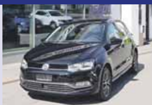
VW Polo 1.0 TSI BMT DSG Boîte auto, noir 2016, km 29'700