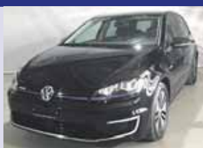
VW e Golf 2015, noir, km 48'000