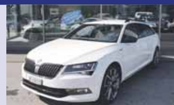
Skoda Superb Combi 2.0 TDI Sport Line 4x4 DSG, boîte auto, blanc mét. 2016, km 22'200