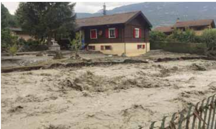
Durant la nuit précédant ce cliché l'eau est montée jusqu'à hauteur des volets du bas. La trace est encore bien visible.

mais... dans le Rhône. Tout comme la cabane à outils paternelle emportée par les flots. «Donc, la parcelle qui nous reste est désormais en pente et sur deux niveaux au lieu d'un seul. La nouvelle digue en pierre est également beaucoup plus haute qu'avant et nous coupe une partie de la vue. Elle va d'ailleurs être encore rehaussée», conclut Frédéric Schirinzi.