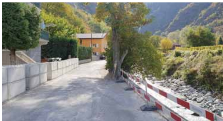
La chaussée a été dégagée, mais les sous-sols des maisons sont toujours interdits d'accès. Et ce jusqu'à la fin du mois. LE JDS