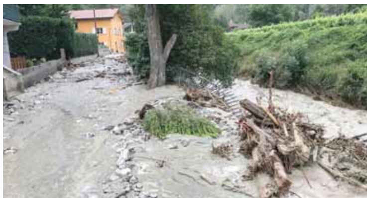
La route a servi de lit à la Navizence pendant la crue. Les débris pris dans les barrières ont empêché l'eau de retrouver son cours.

En amont du pont du cimetière, des digues ont également été créées afin de réorienter l'eau pour faire face en cas de nouvelles crues. Le coût de toutes les mesures d'urgence va s'élever entre un et deux millions de francs. Cette somme est subventionnée à 85% par le Canton du Valais. La Commune de Chippis a pu se rendre compte du bien-fondé des relevés effectués par le bureau d'ingénieur. Les données mises en exergue sont les mêmes, avant et après la crue. La modélisation qui avait été effectuée était donc bien juste. C'est l'amplitude du phénomène qui a surpris tout le monde.