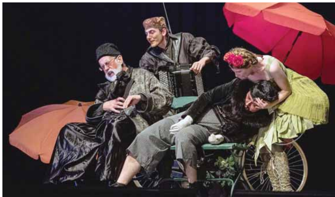
Le Nouveau Théâtre de Fribourg présente «Une demande en mariage» et «La Sérénade» à la salle de gym de Miège où sont installés des gradins de 250 places.

La manifestation a lieu tous les dix-huit mois, au printemps puis à