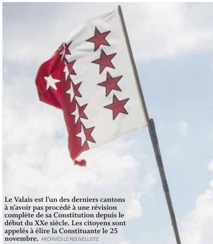
Le Valais est l'un des derniers cantons à n'avoir pas procédé à une révision complète de sa Constitution depuis le début du XXe siècle. Les citoyens sont appelés à élire la Constituante le 25 novembre.

Les femmes ne sont pas oubliées non plus. Elles représentent 42,3% des candidats en lice, ce qui est bien au-dessus de la moyenne à une élection du Grand Conseil. Elles sont majoritaires sur la liste des