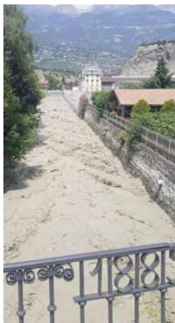
La Navizence le lendemain de l'orage (à g.) et la même rivière en cette fin octobre: deux ambiances très différentes.