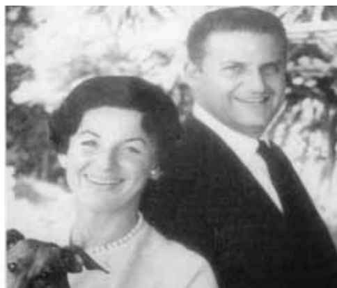
La princesse Antoinette de Monaco et Jean-Charles Rey.