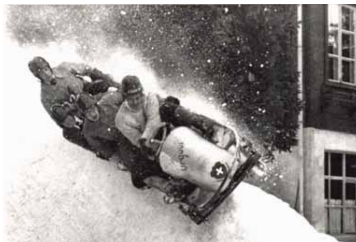
Une descente de 1500 mètres avec virages relevés. DR

Moins une et le bob allait caresser les murs de la menuiserie. RÉD.