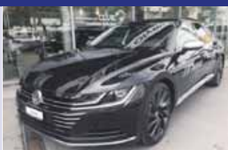
VW Arteon EL 2.0 TSI 280cv DSG 4M Boîte auto, noir mét. 2017, km 1'200