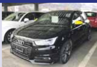
Audi A1 Sportback TFSI Boîte manuelle, noir 2016, km 50'000