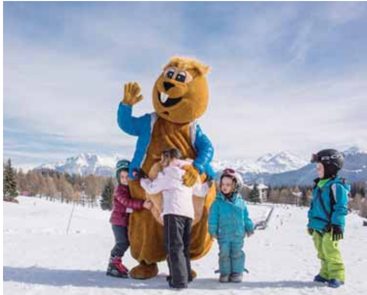
Crans-Montana maintient son label «Family Destination»