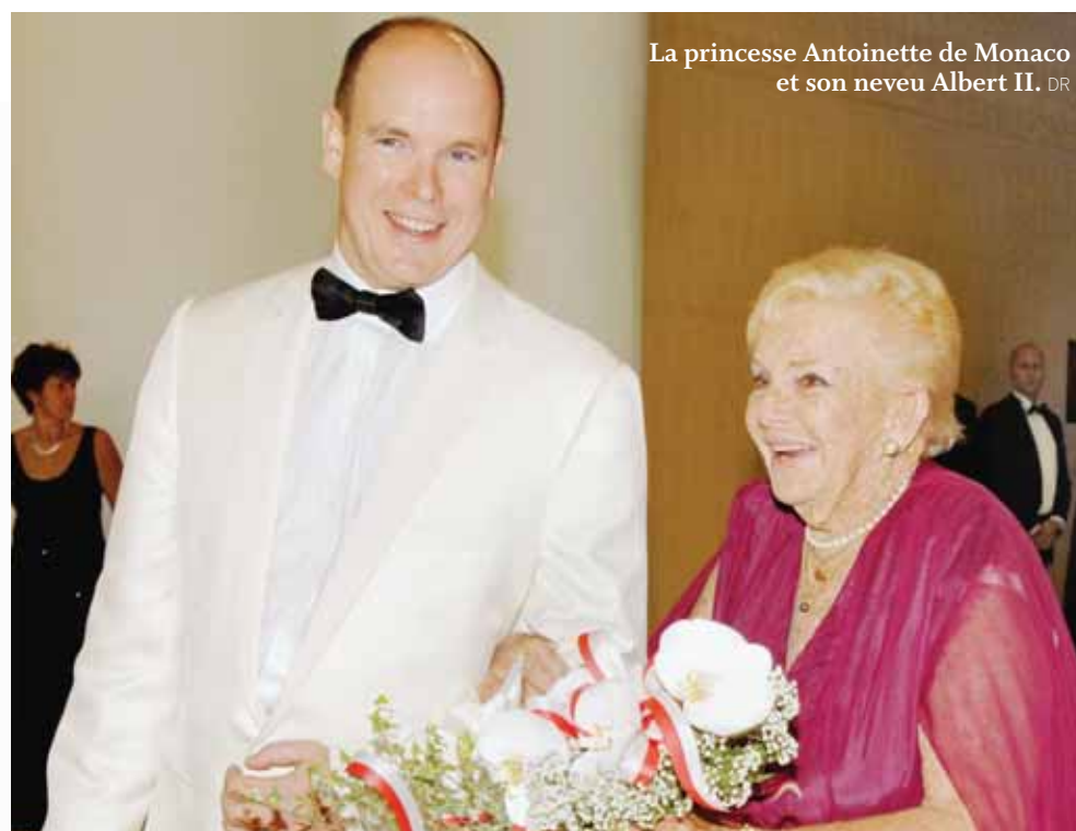
La princesse Antoinette de Monaco et son neveu Albert II.

La présence de la princesse Antoinette Grimaldi a été souvent remarquée à Crans-Montana. Mais déjà en 1923, alors qu'elle n'avait que 3 ans et Rainier III un an, ses parents Pierre et Charlotte de Polignac-Grimaldi passaient leurs vacances à l'hôtel Riffelalp au-dessus de Zermatt, un lieu particulièrement huppé dans lequel se retrouvait la jet-set européenne.