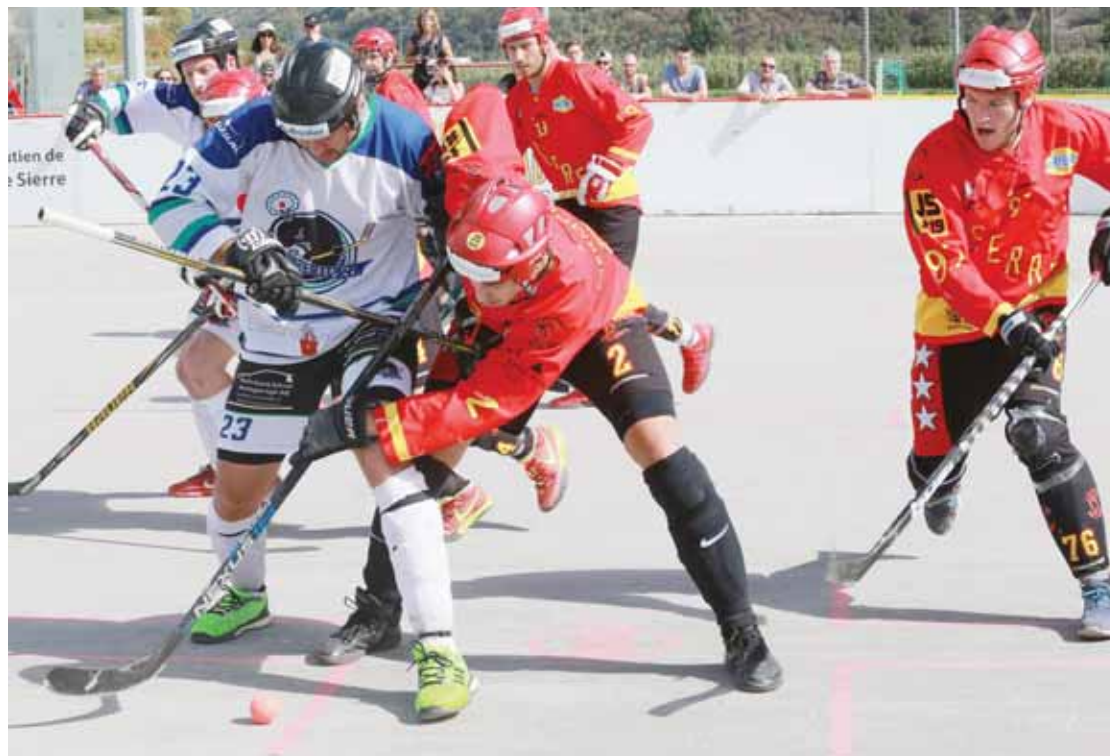
Reprise ce week-end pour les Lions qui se déplaceront à Zoug pour la Coupe de Suisse. REMO

Avant cela, la saison régulière reprendra ses droits le 24 février avec la venue de Bonstetten à Ecosia, une équipe qui n'a jusqu'ici inscrit que cinq points. «Nous n'avons pas fait une préparation hivernale idéale. J'ai un noyau de 8-10 joueurs assidus.