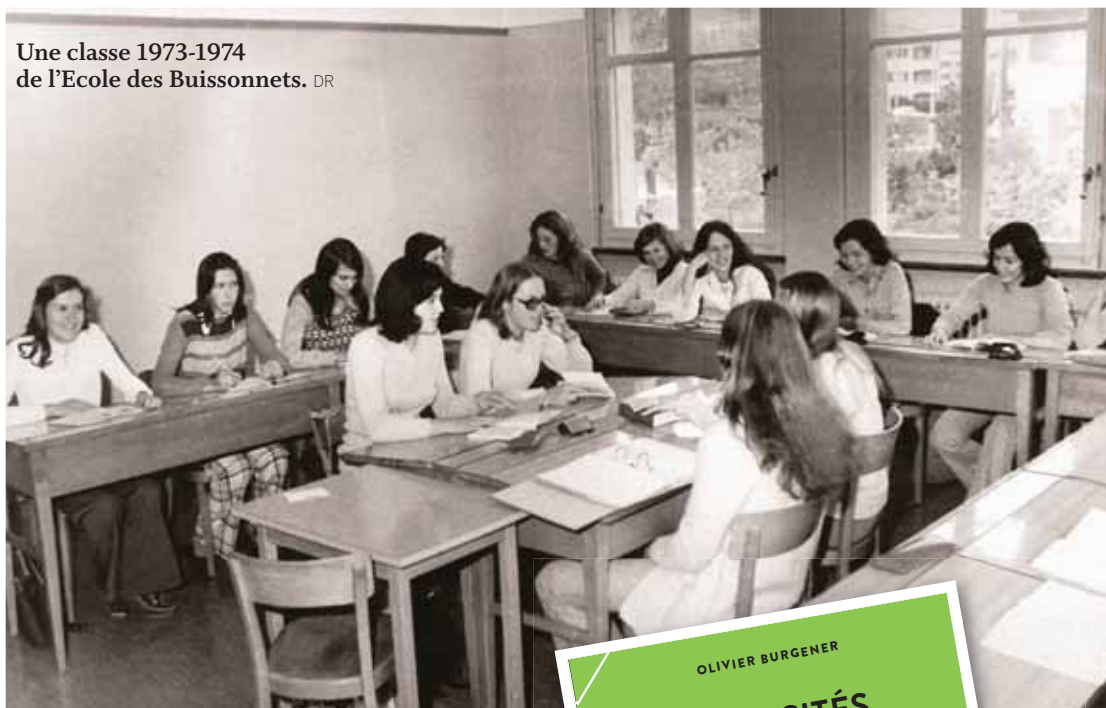
Une classe 1973-1974 de l'Ecole des Buissonnets.