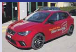
Seat Ibiza 1.0 Eco TSI FR DSG Boîte auto, rouge 2018, 6'600