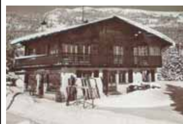
Alex Sport en 1939.