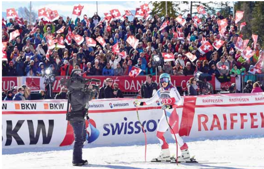
Le public, qui se déplace toujours en nombre à Crans-Montana, fait également partie de la magie de ce rendez-vous de Coupe du monde. ARCHIVES NF

Les meilleures skieuses du cirque blanc vont débarquer sur le Haut-Plateau au sortir des championnats du monde d'Åre. Les médaillées pourront continuer à fêter leurs titres et les battues pourront prendre leur revanche. Ce scénario est connu, puisque l'an dernier les épreuves du Mont Lachaux avaient été agendées juste après les Jeux olympiques. Pour ces dames, le défi sera de dompter cette piste, réputée très difficile. Les années passées, elle avait causé quelques soucis aux meilleures du monde. «Nous avons de très bons rapports avec la FIS