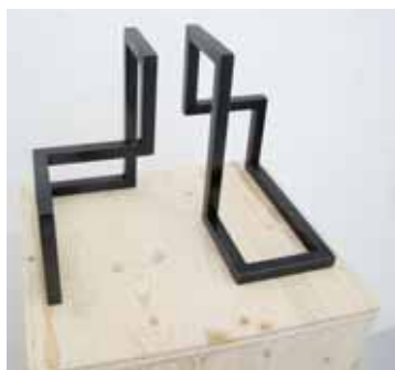
Des sculptures en acier patiné. Constructions à géométrie variable. LE JDS

l'artiste a passé sous la presse, à la manière des estampes mais sans encre. Une autre manière d'appréhender son travail où les blancs cassés, beiges, gris, noirs dessinent les formes géométriques avec la même harmonie. Pour le visiteur, une autre manière de contempler cet art de la simplicité. Il faut dire que l'espace de Pierre Zufferey, spacieux et lumineux se prête parfaitement à l'exercice. A l'extérieur aussi, deux longues tours de plus de