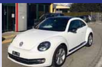
VW Beetle 1.4 TSI BMT Sport Boîte manuelle, blanc 2016, km 60600