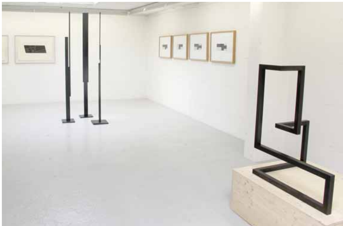
Les œuvres de Carles Valverde se lovent parfaitement dans l'espace Huis Clos de Pierre Zufferey. Géométrie et sobriété des formes en sculpture mais aussi papiers marouflés et fines feuilles de plomb aux murs. LE JDS

Découper, plier, assembler, souder, patiner, le sculpteur façonne la matière, à la manière d'un trombone qu'on s'amuserait à retourner. Des angles droits, de la rigueur et de la sensualité aussi. Avec toujours cette sensation de grande légèreté, comme si les formes qu'il dessinait s'immisciaient avec élégance autour du vide, modulables à l'infini. Trois tours longilignes se dressent aussi dans la pièce. Accrochés aux murs, des papiers marouflés juxtaposés que