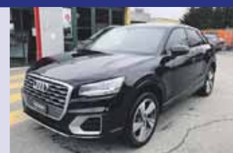
Audi Q2 1.4 TFSI Sport Boîte manuelle, noir mét. 2017, km 21'000