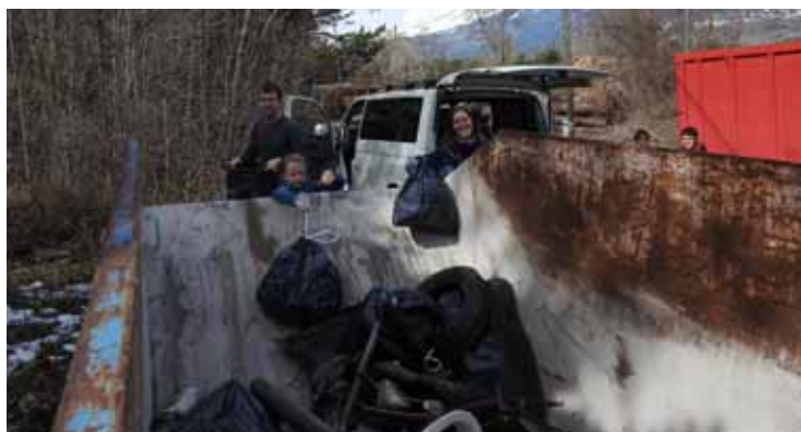
Les bénévoles sont venus nombreux, souvent en famille pour nettoyer le bois de Finges.