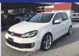
VW Golf 2.0 TSI GTI Boîte manuelle, blanc 2009 km 88'300