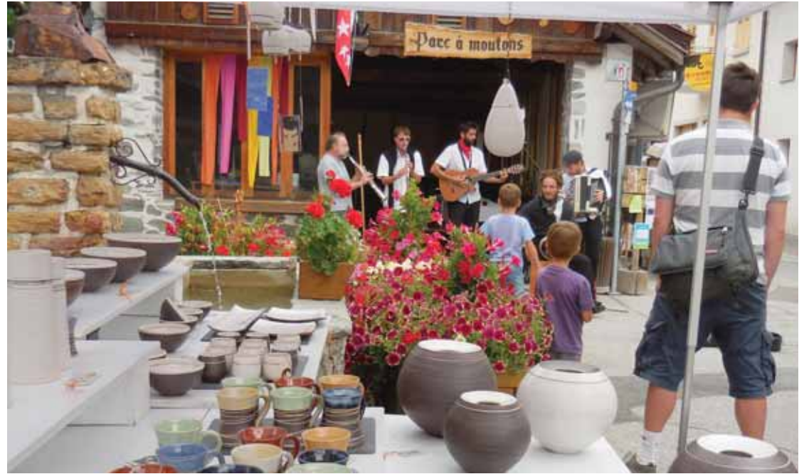
Le Marché des artisans créateurs fait partie de la nouvelle association ASCAVE.

L'ASCAVE tient également beaucoup à la défense des intérêts des artisans locaux, à la promotion des différentes activités mises