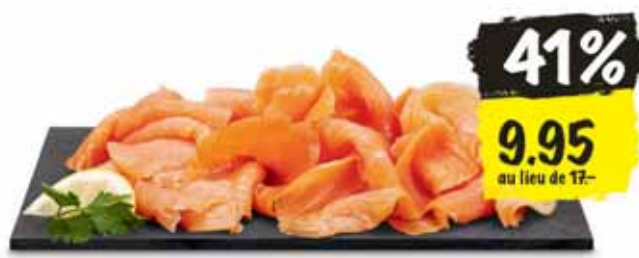
Saumon fumé fort Norske Coop, élevage, Norvège préemballé, 250 g (100 g = 3.98)