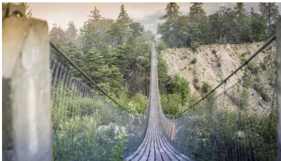
Le pont bhoutanais, tout un symbole entre le Haut et le Bas-Valais. CHRISTIAN PFAMMATTER

«Les deux cultures sont toujours très présentes dans les projets que nous réalisons ou par nos collaborations avec l'Edhea (Haute école d'art du Valais), la HES-SO ou la Fonda-