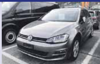
VW Golf 1.4 TSI Lounge Boîte manuelle, gris mét. 2015, km 59'000