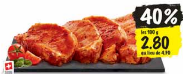
Steaks de filet de porc Coop Naturafarm au poivre, Suisse en libre-service, 4 pièces, env. 700 g

Offres valables à Coop Sierre Rossfeld jusqu'au samedi 4 mai 2019. Dans la limite des stocks disponibles, en quantité ménagère.