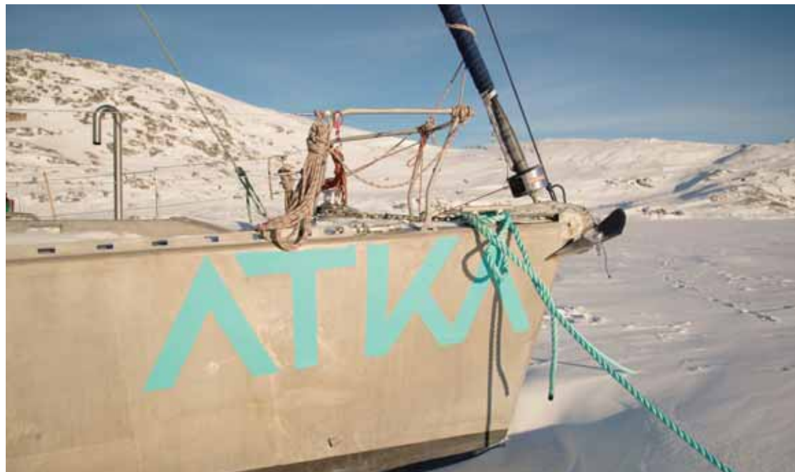
Le projet ATKA est aussi un projet pédagogique qui permet aux enfants de découvrir le Grand Nord.

SIERRE ATKA signifie «brise-glace» en inuit. ATKA c'est aussi un voilier polaire de 15,5 mètres. Depuis 2015, une équipe de jeunes passionnés et amoureux des milieux arctiques s'engagent à travers des programmes scientifiques, artistiques et pédagogiques à transmettre la beauté des milieux polaires et bien sûr ses enjeux climatiques. Des scientifiques, des artistes, des sportifs, des enfants malades aussi sont invités à bord pour travailler, créer (résidences d'artistes), partager ce lien qu'on veut avant tout positif entre le Grand Nord et le reste du monde.