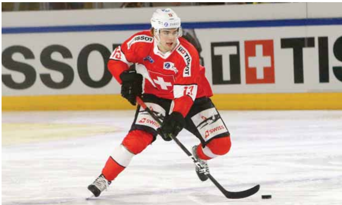
Nico Hischier était la star de ce match de préparation de la Nati à Graben. La soirée a été parfaite avec trois buts du Haut-Valaisan et une victoire Suisse 6-0 sur la France. REMO

SIERRE - ZINAL Que faire face à la folie des inscriptions? Les organisateurs planchent sur ce problème en vue de 2020.