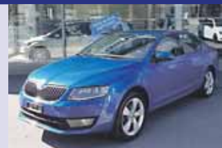
Skoda Octavia 1.4 TSI Elegance Boîte manuelle, bleu mét. 2013, km 64'000