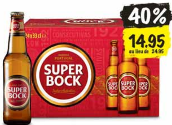
Bière Superbock 24 x 33 cl (100 cl = 1.88)

Coop ne vend pas d'alcool aux jeunes de moins de 18 ans.