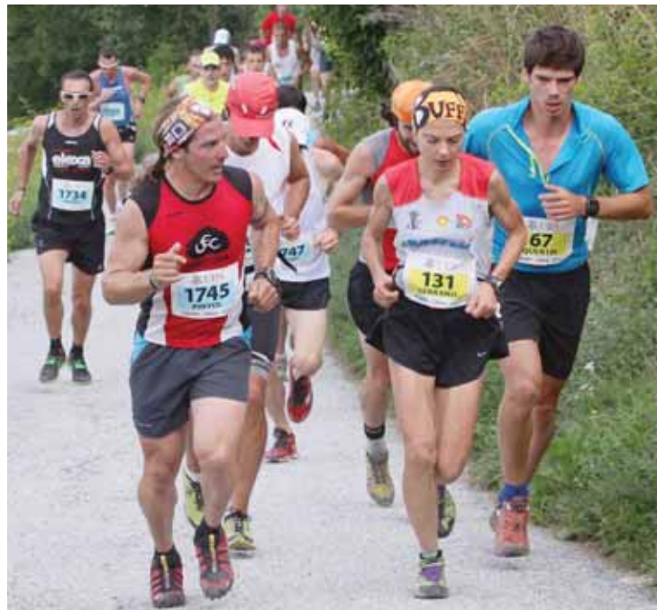
Heureux athlètes qui pourront participer à la 46e édition de Sierre-Zinal. De nombreux athlètes resteront sur le carreau.