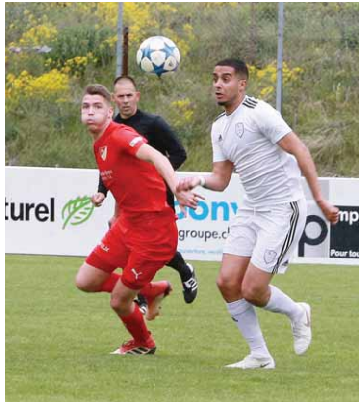
Le FC Sierre est resté sur un bon match avec une victoire 4-3 en recevant un concurrent direct, le CS Interstar. REMO

De manière générale, la mise sur pied de tels événements a aussi pour but d'attirer du monde à