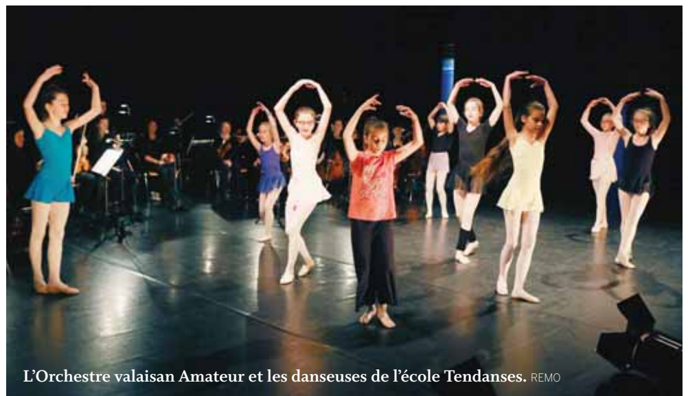
L'Orchestre valaisan Amateur et les danseuses de l'école Tendances. REMO

Ainsi, 110 danseurs de 4 à 12 ans incarneront les animaux phares de la pièce. Savamment coordonnés par les professeurs, les styles de danse et de musique s'harmoniseront avec la faune et les petits interprètes. Ce joyeux zoo vous offrira ainsi des représentations des classes d'éveil, de jazz, classique, contemporain, hip-hop et danse orientale, sous la supervision