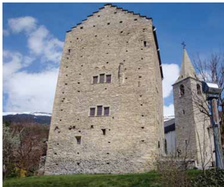
Bal masqué au château de Venthône! Une première.