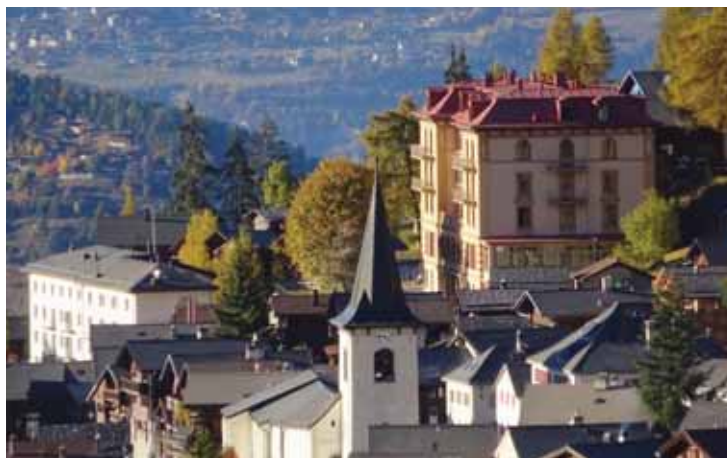
Ce week-end, une dernière visite avant le début des travaux.