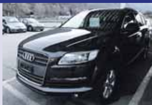
Audi Q7 240 3.0 TDI tiptronic Boîte auto, gris mét. 2008, km 160'900