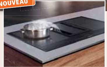
Cuisinière avec hotte intégrée