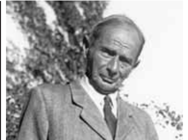
Rudolf Kassner en visite chez son ami Rilke au château de Muzot.

Cet épisode révèle qu'un tourisme des cimetières est bien réel. Nombreux sont les lecteurs, historiens, cinéastes, étudiants, universitaires ou simples citoyens qui se passionnent pour une personnalité qui a marqué l'histoire d'une région, d'un canton, d'un pays. Certaines villes ont édité un plan des