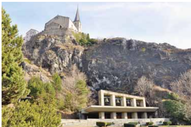
L'église Saint-Romain construite sur l'éperon rocheux surplombant Rarogne et l'église troglodyte Saint-Michael taillée dans le roc.

Après la visite de l'église, suivez le balisage pédestre d'abord par la route en descente direction ouest, puis vers l'école, quittez la route et suivez le balisage à droite... qui passe sur un petit tronçon de bisse, descend vers la gare pour traverser les voies par la route. Le sentier part tout de suite à droite après avoir passé sous les voies et vous conduira par des prairies de moutons, puis des vignes avec une belle place de pause, à la petite chapelle de Chalchofe qui offre aussi des informations sur les cépages. Vous atteindrez finalement le village de St. German. L'église, très ancienne et le village sont un enchantement. Le restaurant aussi! Le chemin continue à plat dans le vignoble et passe vers la chapelle Sainte-Anne et près d'anciens châteaux.