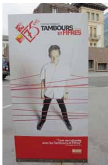
Disposées au centre-ville, des photographies de musiciens.

Les Tambours et Fifres Sierrois fêtent aussi, dans la foulée, les 75 ans de la société. Pour rappeler sa vivacité, elle expose 15 portraits de musiciens sur l'avenue Général-Guisan. Ils montrent la mixité des âges et les motivations.