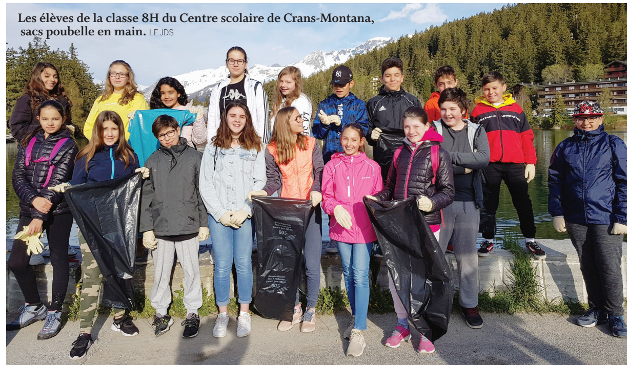
Les élèves de la classe 8H du Centre scolaire de Crans-Montana, sacs poubelle en main.

piers se dispersent dans différentes zones de la forêt de la Moubra, afin de ramasser des débris. La 8H, la classe des plus âgés, commence le parcours le long du lac de Grenon. Avant d'entamer le nettoyage, ces jeunes d'une douzaine d'années se munissent d'un