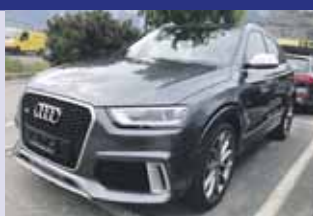
Audi RS Q3 2.5 TFSI Q S Tronic Boîte auto, gris mét. 2014, km 67'500