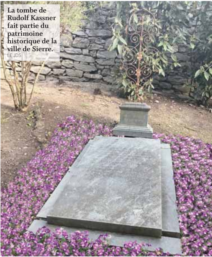
La tombe de Rudolf Kassner fait partie du patrimoine historique de la ville de Sierre.

SIERRE Un minibus, plaque autrichienne, s'arrête: «Entschuldigen Sie uns. Wo befindet sich der Friedhof?» Traduction: «Excusez-nous, où se trouve le cimetière?» Les inscriptions sur le minibus laissent à penser qu'il s'agit d'une équipe de télévision.