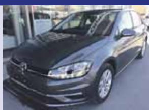
VW Golf 1.0 TSI Comfortline Boîte manuelle, gris. Mét. 2019, km 20