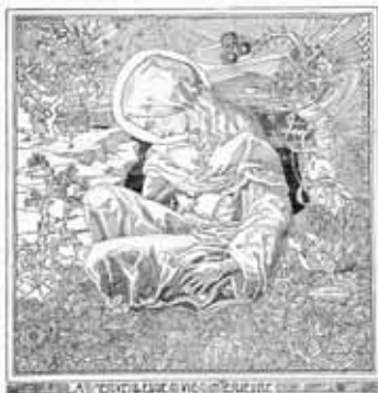
L'une des impressions typographiques exposées (le dessin à l'encre est gravé écaniquement sur une plaque de zinc)