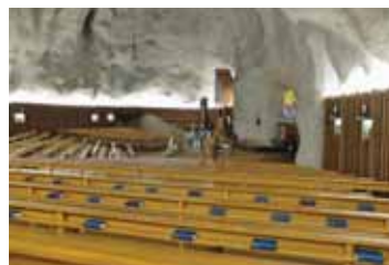
L'intérieur de l'église-grotte.