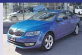
Skoda Octavia 1.4 TSI Elegance Boîte manuelle, bleu mét. 2013, km 64'000