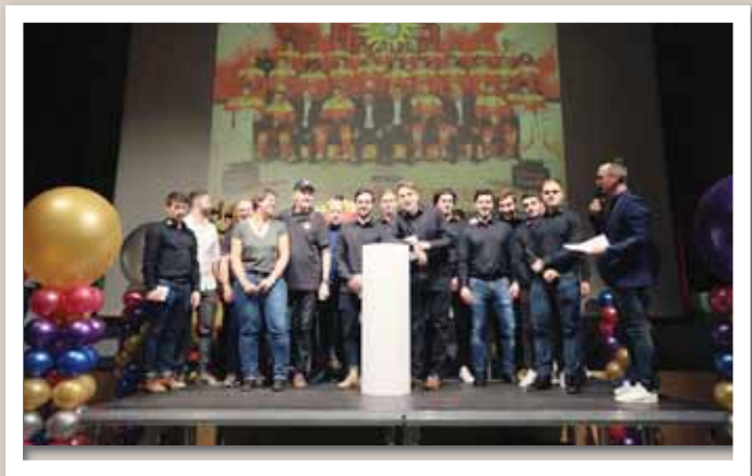
Malgré un match à la Chaux-de-Fonds le lendemain, les membres de la première équipe étaient de la partie. Ils ont eu la permission de 22 h 15. REMO