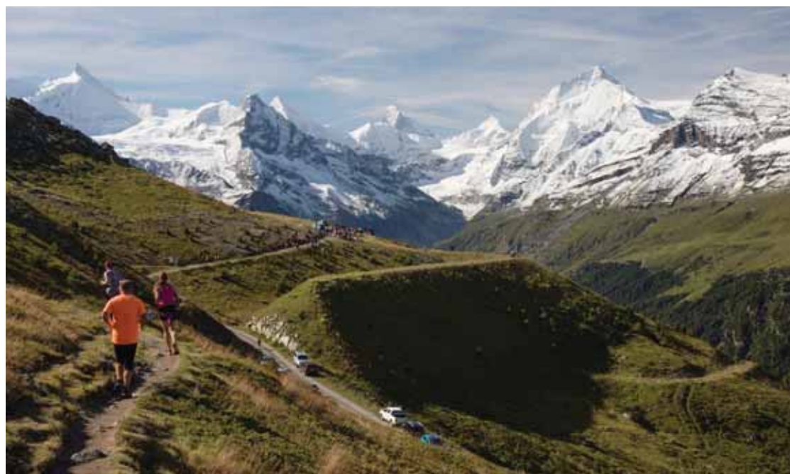
L'accès à Sierre-Zinal va être facilité. Les inscriptions 2020 se feront sur plusieurs jours et à plusieurs créneaux horaires. CHRISTOPHE GOLAY

La 2e équipe sierroise a aussi servi de tremplin pour jouer dans la une. Il en est la preuve.