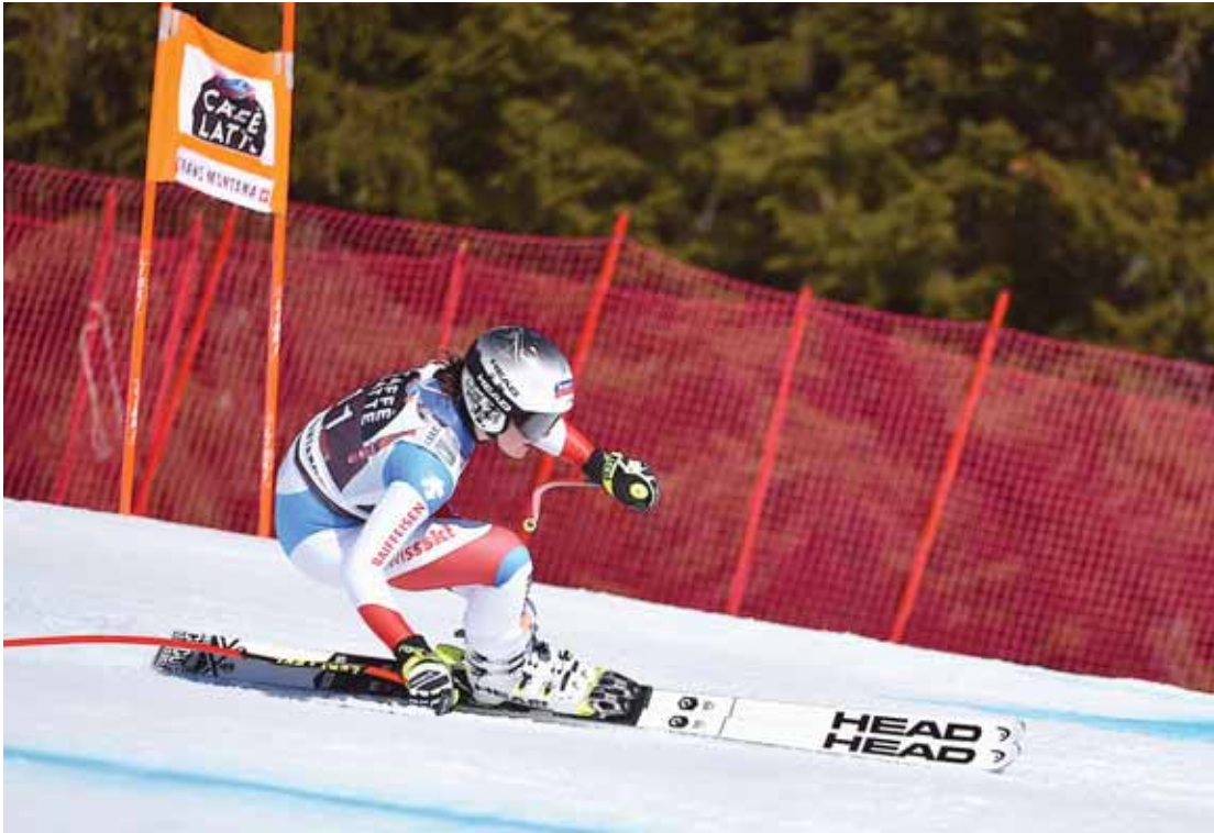
Corinne Suter est actuellement en tête du classement Coupe du monde de descente.

l'étape de Crans-Montana une classique du mois de janvier, en dehors de la haute saison.» Durant une dizaine d'années, le Haut-Plateau a dû faire le poing dans la poche et