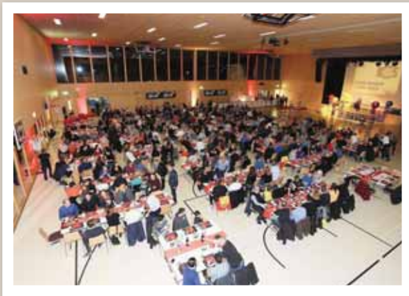
Le HC Sierre n'a utilisé qu'une partie de la salle Recto-Verso. L'autre était réservée pour la soirée ouverte au public. REMO