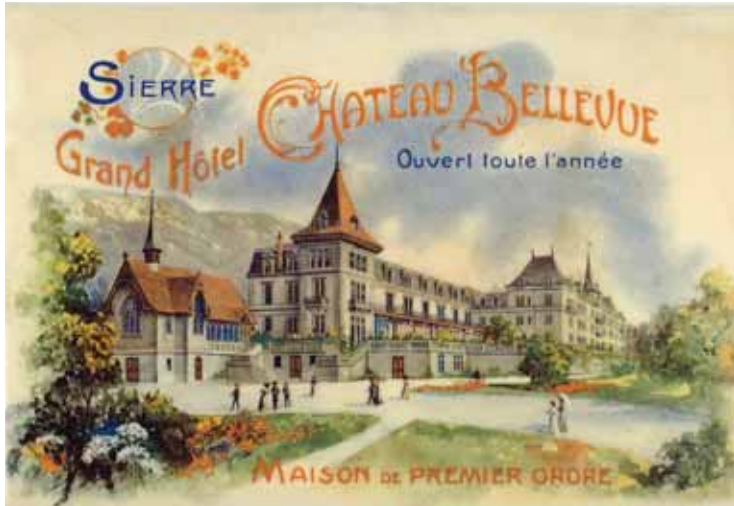
Le Grand Hôtel Château Bellevue après 1905 avec quatre étages et les combles.