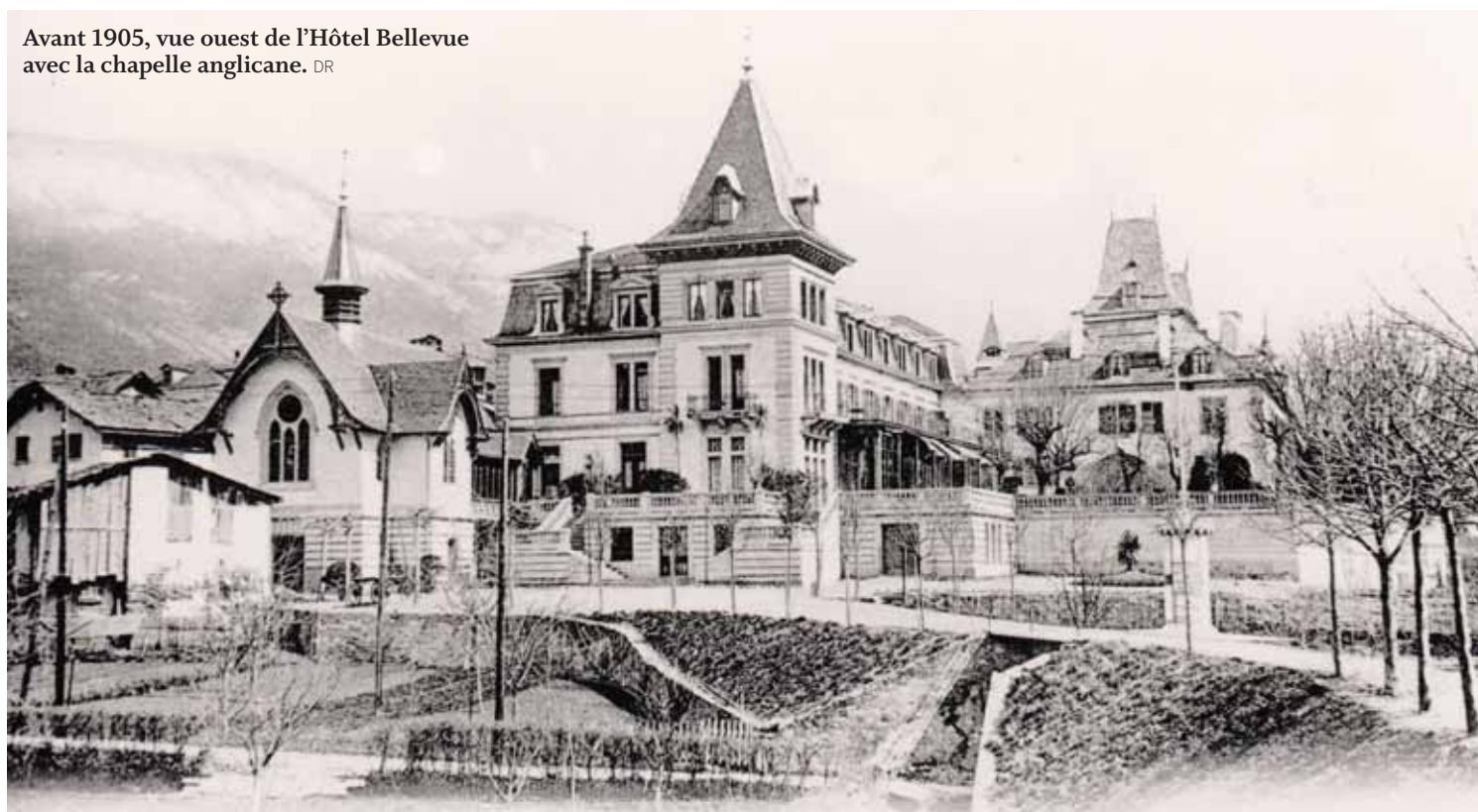
Avant 1905, vue ouest de l'Hôtel Bellevue avec la chapelle anglicane.

Que pouvaient-ils bien comploter ces deux anarchistes?