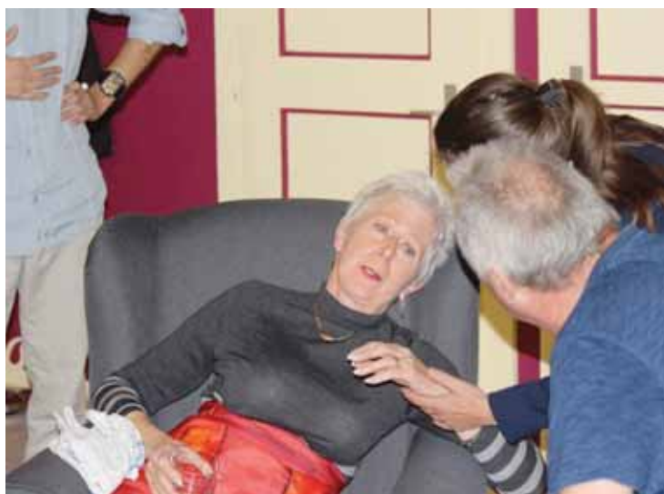
La troupe Toc'Art commence sa tournée à Icogne le 28 février.

D'abord, l'histoire. Tous les avantages de la polygamie, sans aucun de ses inconvénients: Bernard a trouvé la solution. Ses maîtresses fiancées sont trois hôtesses de l'air, de trois pays et de trois compagnies différentes. Le tout est juste d'harmoniser les horaires. Cette belle mécanique se déroule sous la houlette bougonne mi-réprobatrice, mi-admirative de