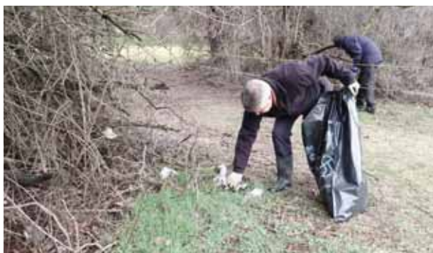
La majeure partie des déchets reste tout de même le papier. DAYER