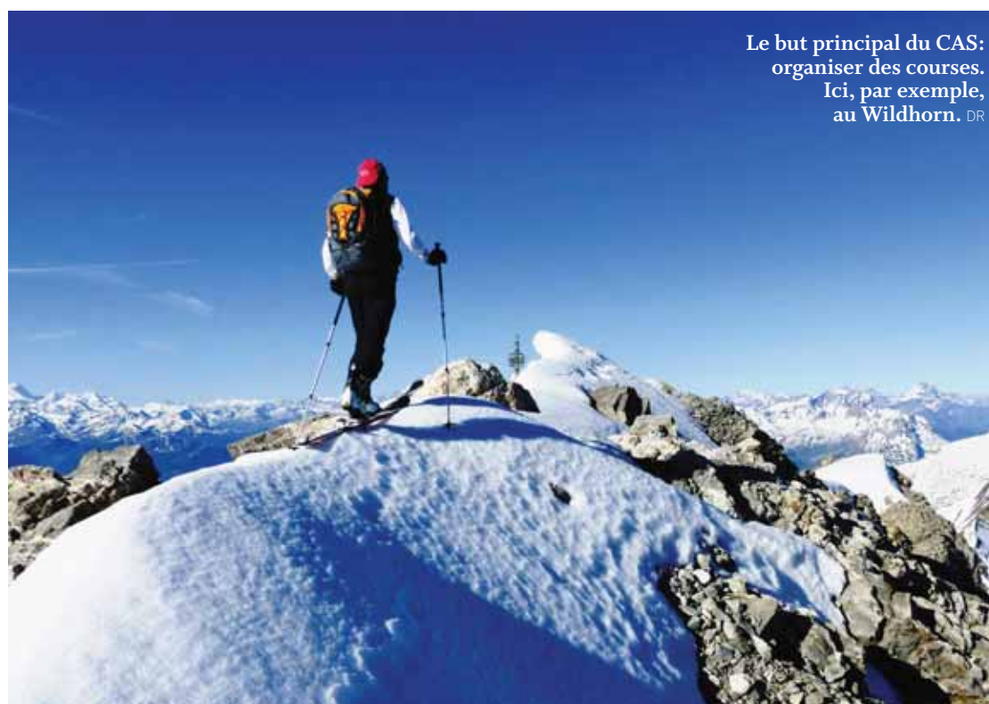
Le but principal du CAS: organiser des courses. Ici, par exemple, au Wildhorn.

Le 22 août, une rencontre sera organisée au sommet du Jegihorn, qu'il est possible d'atteindre par différentes voies. Et le sentier alpin du 100e sera inauguré le 5 septembre. L'idée était de créer un chemin d'accès à la cabane des Violettes plus agréable, que le large tracé emprunté par les camions.