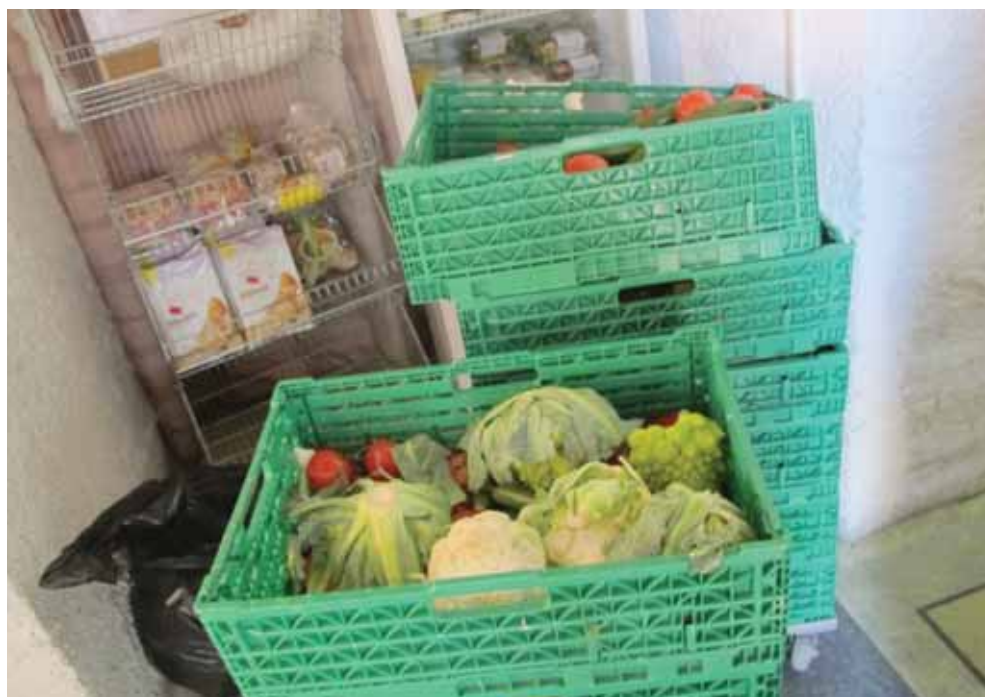
Chalais Jeunesse assurera désormais la récolte des invendus dans les grandes surfaces pour que les bénéficiaires de Sierre-Partage puissent recevoir les denrées de première nécessité.

«Nous aurons suffisamment de denrées cette semaine et nous possédons de grands congélateurs pour stocker la marchandise. De manière générale, il y aura moins de choix, c'est pourquoi nous préparerons pour chaque bénéficiaire deux sacs, l'un avec des denrées