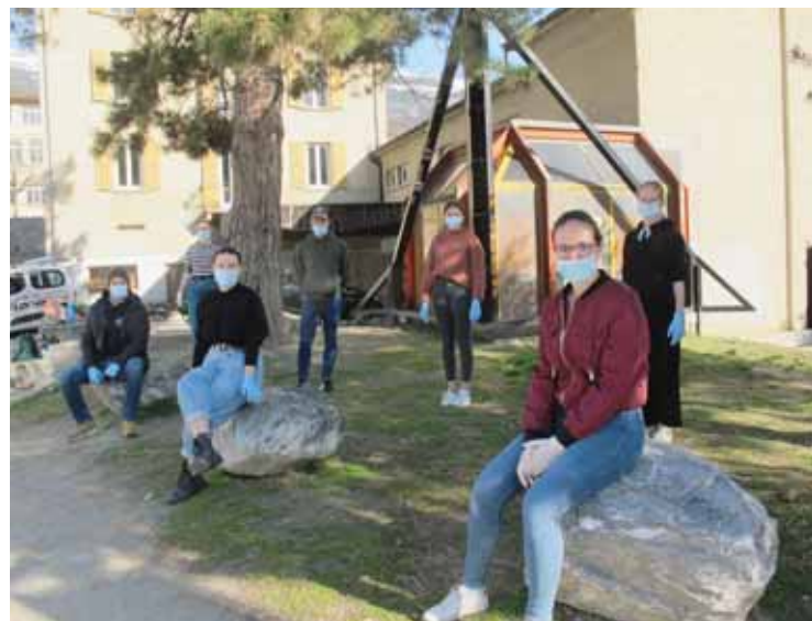
Chalais Jeunesse prend sa tâche au sérieux et se protège pour protéger les plus faibles. LE JDS