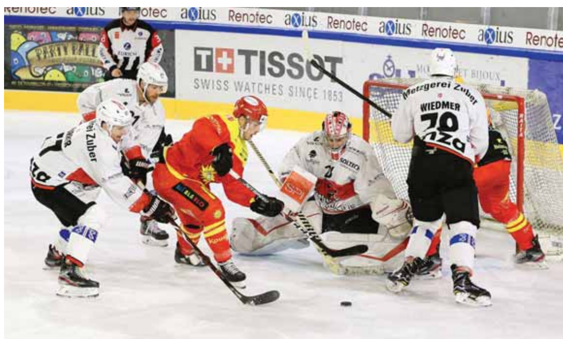
Le HC Sierre a réalisé un bon championnat en tant que néo-promu en Swiss League. Il faudra qu'il réédite une telle performance la saison prochaine... en mieux. Son but est les play-off.