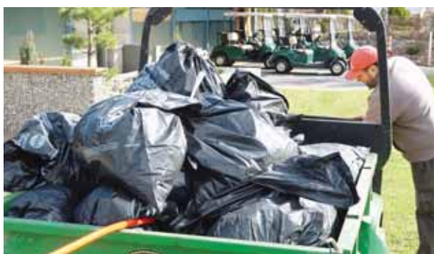
La récolte de la demi-journée. DAYER

SCHWEIZER Sport-Akkreditierungs-Organisation Association SUISSE d'accréditation du sport Associazione SVIZZERA di accreditamento sportive