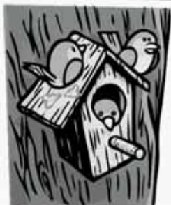
MAISON À OISEAUX