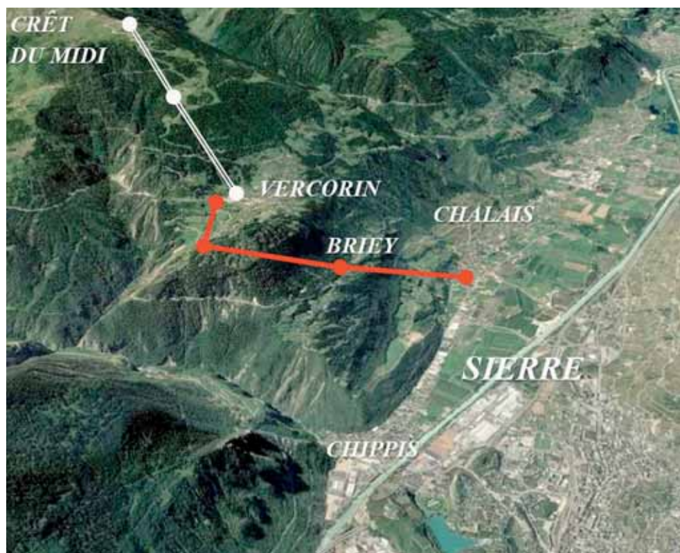
Le nouveau tracé (en rouge) de la télécabine qui, selon les initiants, répond davantage aux besoins du développement d'une région au XXI e siècle.