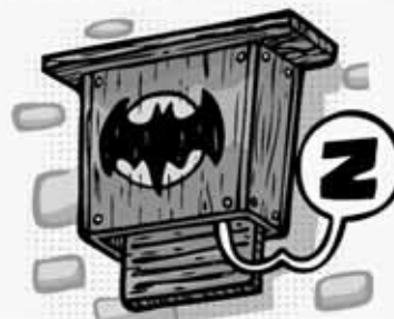
REFUGE À CHAUVE-SOURIS