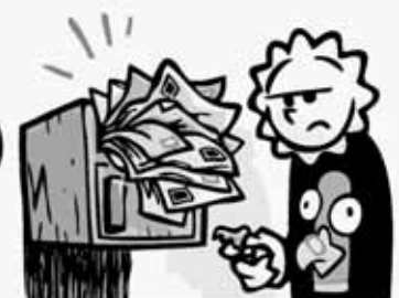
BOÎTE À FACTURES