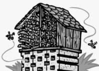
HÔTEL À INSECTES