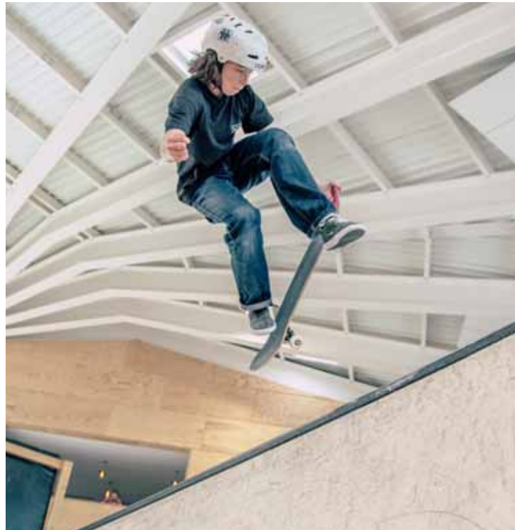
A Lens, les jeunes de moins de 16 ans peuvent s'entraîner. ALAÏA CHALET

LENS L'Alaïa Chalet, ouvert au public en février 2019, surfe sur la vague. Malgré la pandémie, ses activités se poursuivent et les projets du groupe se concrétisent. Du côté de Lens, les locaux sont actuellement ouverts les mercredis, samedis et dimanches. Afin de respecter les mesures prises par le Conseil fédéral, seuls les moins de 16 ans y ont accès. «Nous nous imposons des restrictions avec une personne pour 10 m 2 . La zone trampoline, par exemple, pourrait en accueillir soixante, mais nous n'arrivons pas à ce quota», explique Vincent Riba, responsable de la communication pour l'Alaïa Chalet.