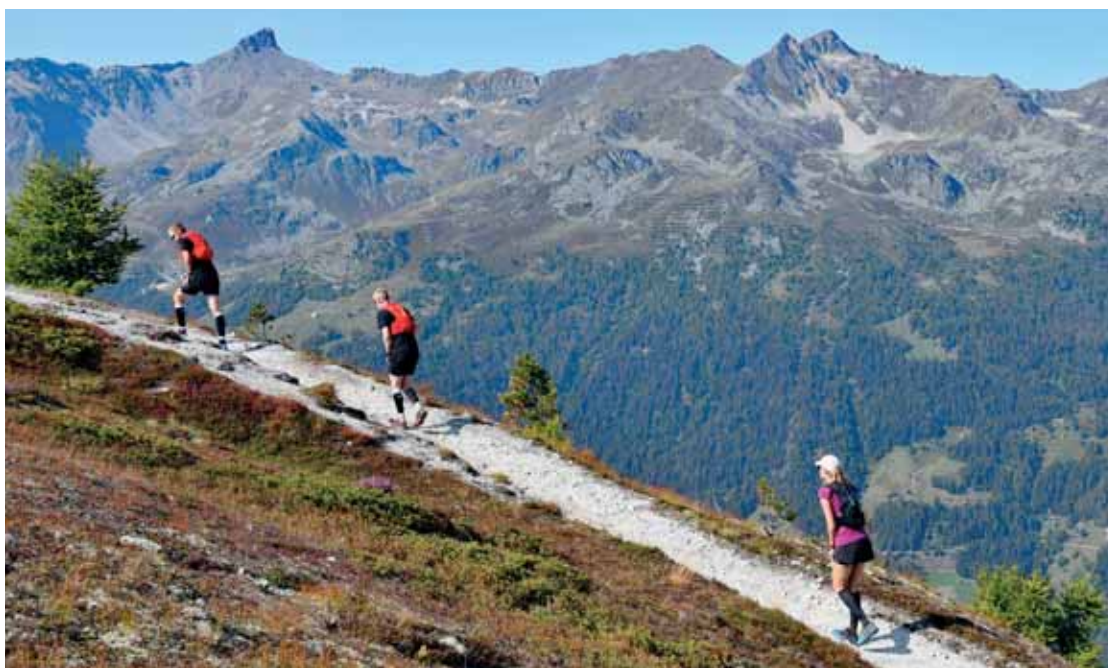
Les résidents de Sierre et Anniviers pourront s'inscrire à leur course dès le 14 février. ROGER EPINEY

FC SIERRE Reprise des entraînements ou pas? La deuxième ligue inter attend de savoir quand reprendra la saison.