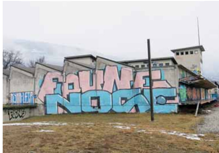
La halle Usego aujourd'hui, un emplacement idéal, proche de la gare, du TLH-Sierre et de la future patinoire. REMO

Notre école de graphisme est l'une des meilleures, sinon la meilleure de Suisse, nous formons des graphistes qui travaillent dans le monde entier. Et cette crise nous a permis de démultiplier notre visibilité. C'est peut-être le positif de cette crise, nous avons dû activer la porte numérique, faire appel à nos réseaux, créer des événements.