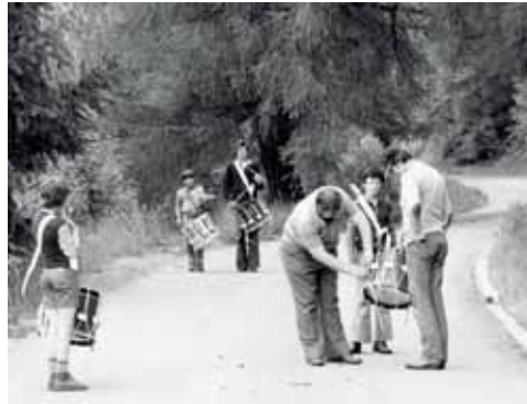
L'Echo des Bois de Crans-Montana en 1977.

parler des messages que nous recevons autour de la culture: un sujet très actuel. Les films sont accessibles durant 10 jours après leur lancement et sont réservés aux membres du cercle des amis de Swiss Made Culture. Pour les non-membres, réservation sur event@swissmadeculture.ch