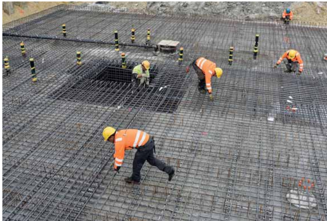
Lors d'incertitudes économiques comme c'est le cas aujourd'hui, les entreprises hésitent à engager du personnel et sont plus nombreuses à se tourner vers les agences temporaires.