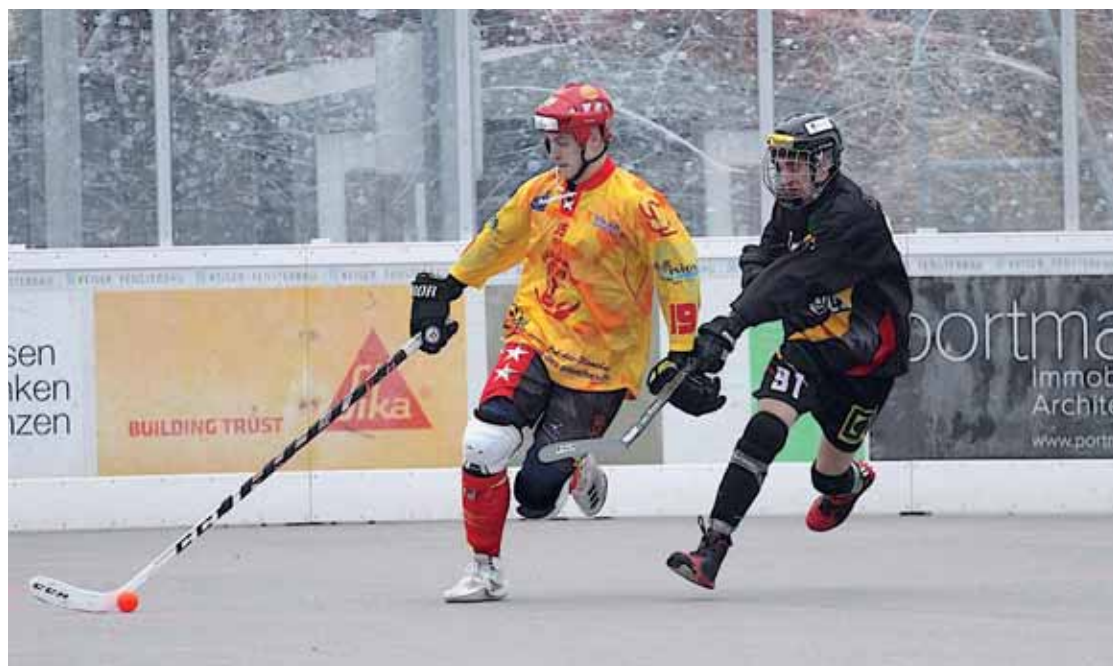
Au printemps 2020, les Sierrois avaient pu aller pratiquement au bout de leur saison régulière. Pour le championnat en cours, leur compteur restera bloqué à quatre rencontres. FACEBOOK SIERRE LIONS

HC SIERRE Le repas de soutien aura lieu demain. Sa version 2021, en streaming, a convaincu: 490 personnes se sont inscrites.