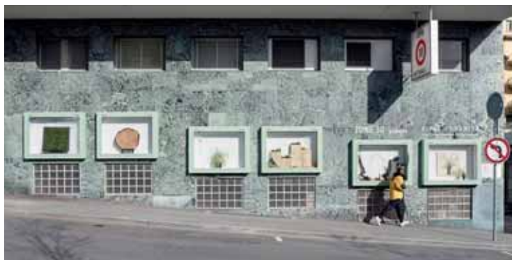
Six vitrines où la nature emprisonnée se transforme. FLORENCE ZUFFEREY