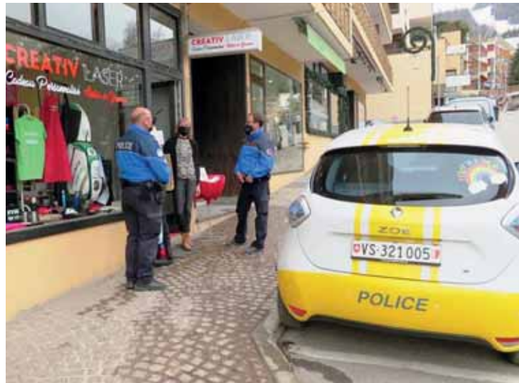
La police de Crans-Montana a pu pleinement tenir son rôle de proximité durant la crise du Covid, en étant constamment sur le terrain.

Les polices municipales sont mises à contribution durant la crise du Covid qui s'éternise. Et face au ras-le-bol généralisé, leur mission de proximité semble d'autant plus nécessaire quand il faut contrôler les espaces publics, assurer les contacts avec les municipalités ou faire comprendre à des contrevenants les risques qu'ils encourent s'ils ne respectent pas les règles. La discussion semble toujours privilégiée. «Nous constatons très peu d'infractions par rapport au nombre de contrôles effectués. Le fait de pouvoir compter sur un effectif stable et important a permis de créer de bonnes conditions pour