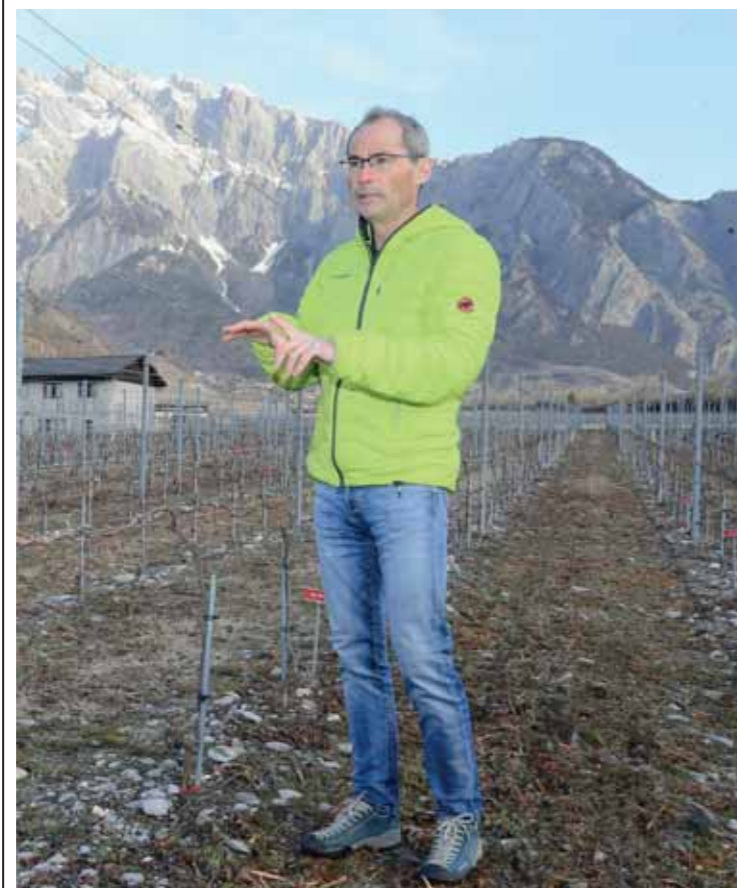
CENTRE D'ESSAI GRAND BRÛLÉ «Nous effectuons ici des essais de nouveaux cépages.» REMO

Ce cépage multirésistant au mildiou et à l'oïdium a une belle progression. Ce n'est plus notre rôle de le promouvoir, nous l'avons proposé mais il semble que ça marche. Ses surfaces sont en forte progression, à l'étranger aussi, en France notamment ou au Canada.