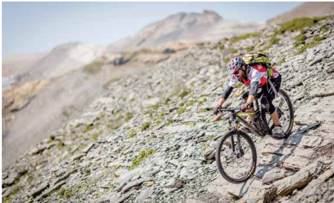
De l'enduro à Crans-Montana dans un paysage exceptionnel.

En tout, cinq courses se dérouleront sur le Haut-Plateau. Dans l'idéal, Crans-Montana Tourisme, organisateur de l'événement avec Bike Media, souhaiterait mettre sur pied un festival de VTT. Mais