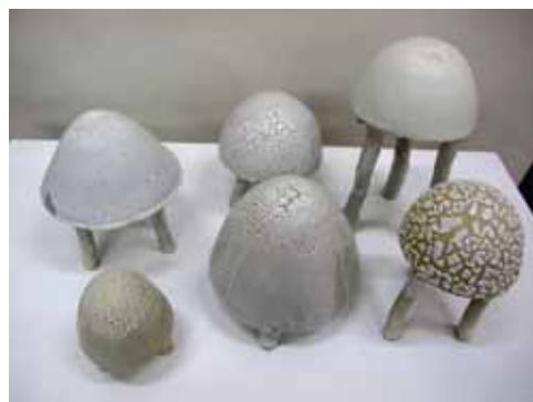
«Polypes», grès, 2017.