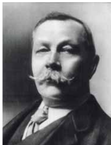
Conan Doyle, venu à Zermatt la même année que celle où il tue son héros dans les chutes de Reichenbach.

Depuis la fin des années soixante du XXe siècle, des zozos en costume victorien réalisent des pèlerinages en terres saintes helvétiques qui passent par notre canton. Il s'agit de membres éminents (comme ils le sont toujours) de la Sherlock Holmes Society. Ils se rendent en des lieux emblématiques liés à leur idole. A commencer par les menaçantes chutes de Reichenbach (Meiringen) où Sherlock trouva prétendument la mort le 4 mai 1891 (la nouvelle qui contient cette tragédie – «The Final Solution» – sortit, elle, en décembre 1893).