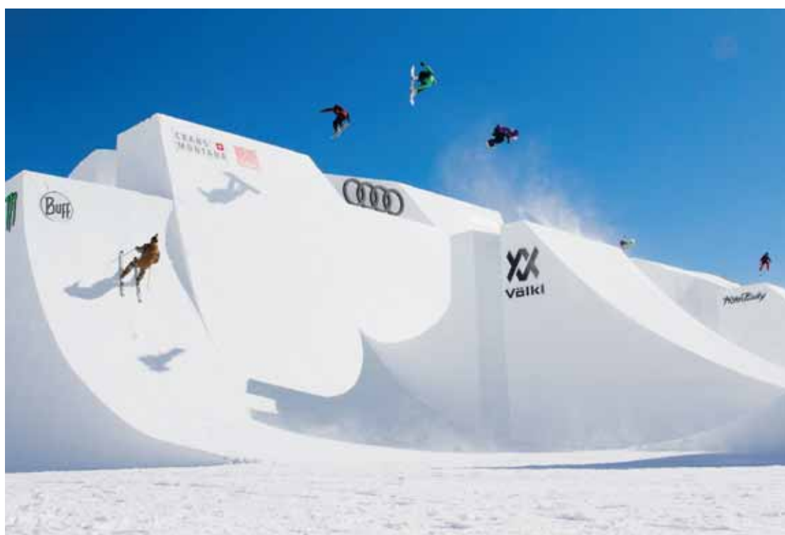
Le module principal des Audi Nines 2021. Les athlètes paraissent tout petits.

Durant ces quatre jours de glisse, les conversations ont donc tourné autour de la fluidité dans les sauts, de tricks proprement posés, mais pas du tout autour de la compétition. Les 44 riders invités, en provenance du monde entier, ont pu s'en donner à cœur joie, juste pour le plaisir, au terme d'une saison difficile. Le symbole de cette bonne ambiance est sans aucun doute le «rapid-fire train» effectué au terme de ces quatre jours. Tous les participants se sont élancés en même temps sur le module principal.