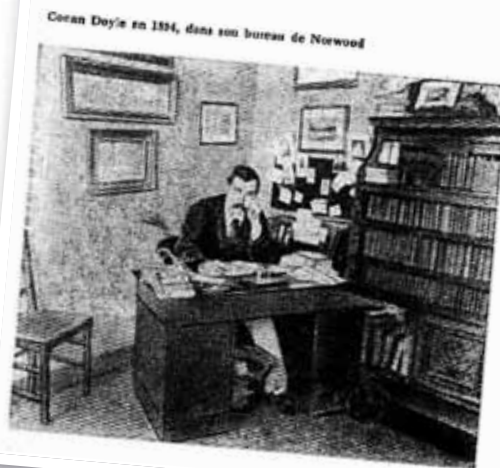
Conan Doyle en 1894, dans son bureau de Newwood