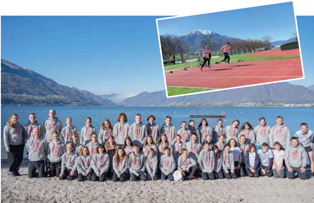
Du lundi 5 au samedi 10 avril, le CA Sierre a passé une semaine à s'entraîner sous le soleil tessinois de Tenero. Le centre sportif national de la jeunesse offre des conditions parfaites. DR