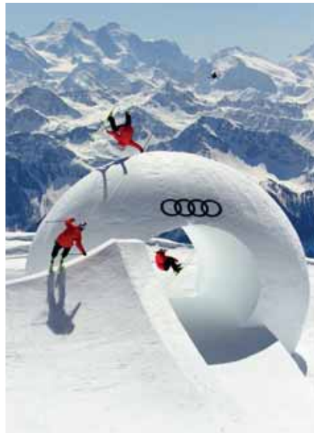
La boule des Audi Nines. Une pièce unique créée pour l'occasion.