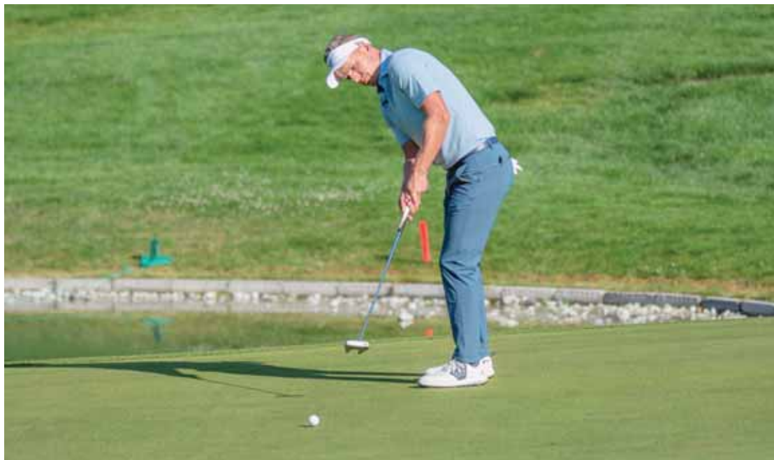
Luke Donald sera présent à Crans-Montana du 26 au 29 août.