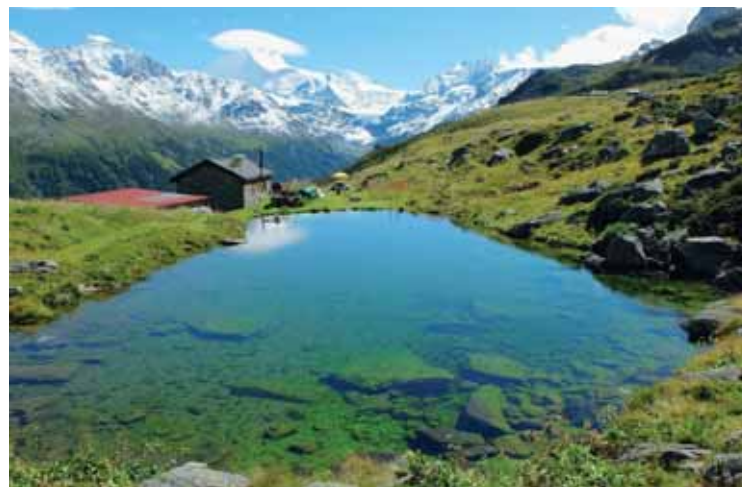
Le petit lac scintille devant les cimes enneigées. JEAN-LOUIS PITTELOUD

A remarquer l'originalité des noms de hameaux (Stafel) de Simmigu, Rotigu, Meiden... et d'autres, qui chacun se décline en trois terminaisons: Unner, Mittel, Ober