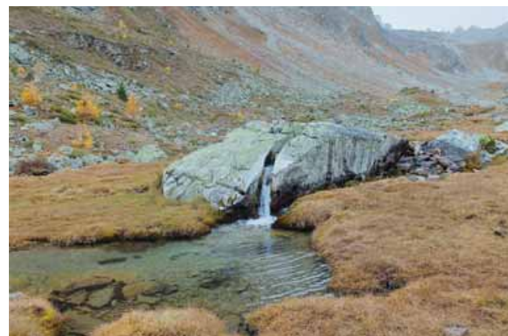
Les méandres du Meidbach. JEAN-LOUIS PITTELOUD

(bas, milieu, bas) pour définir l'altitude des mayens de pâture pour les vaches.