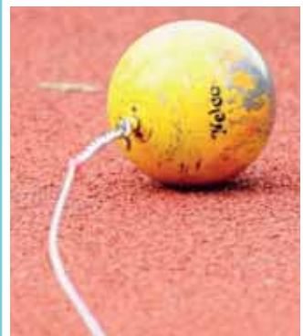
Le marteau, une discipline méconnue de l'athlétisme.