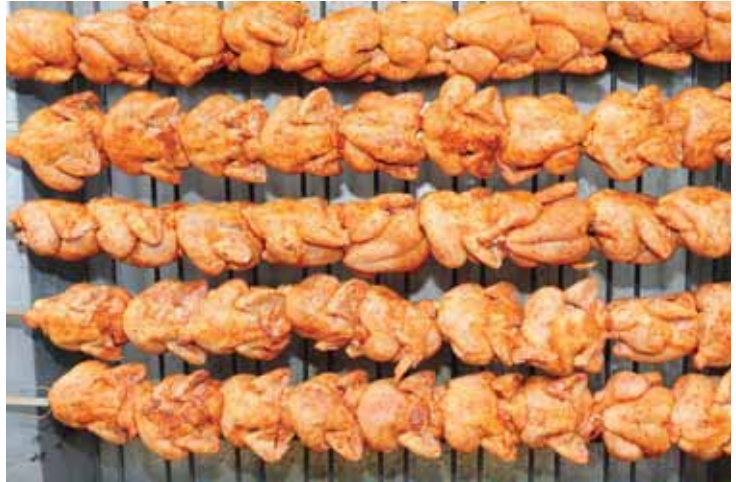
1500 poulets sur le grill du 27 au 29 août!