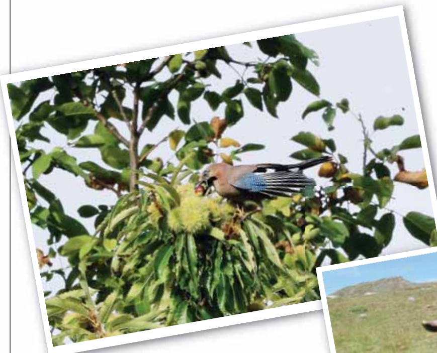
Un geai des chênes pris en flagrant délit de gourmandise. REMO