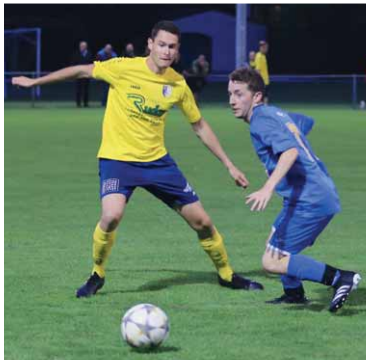
L'un des matchs de référence du FC Lens, le match nul 1-1 face au leader, le FC Granges.