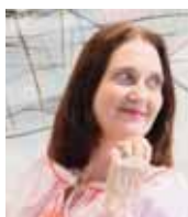
GRAZIOSA GIGER GALERIE GRAZIOSA GIGER

«Une peinture contemporaine pour parler d'hier et d'aujourd'hui.»