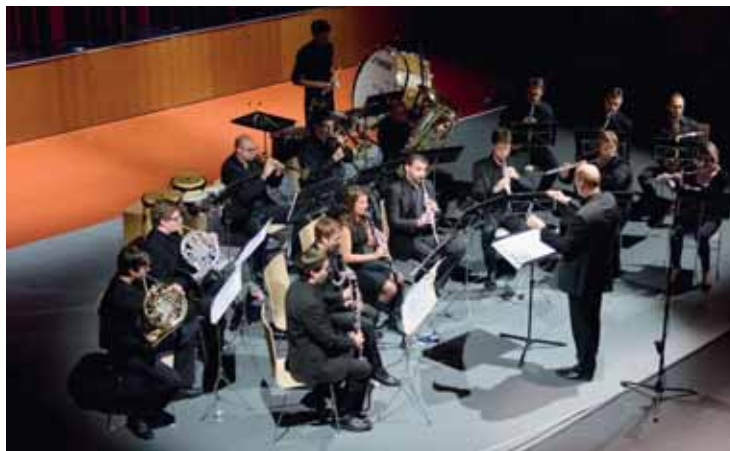
Le Chamber Wind Orchestra: l'émotion de remonter sur scène et de retrouver la lumière!

La particularité du Chamber Wind Orchestra – composé pour beaucoup de musiciens de la région – est de s'adapter à chaque projet. Il a notamment accompagné des danseurs, des chanteurs, monté un programme de jazz. «Nous recherchons toujours diffé-