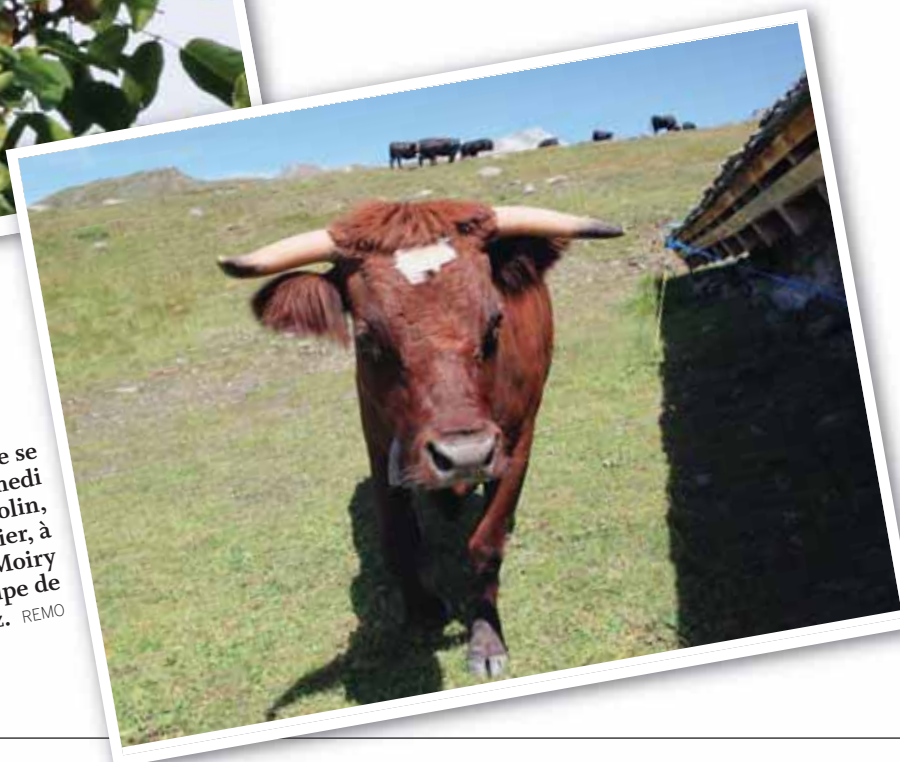
En Anniviers, la désalpe se poursuit ce samedi 25 septembre: à Chandolin, désalpe de Plan Losier, à Grimentz, désalpe de Moiry et à Saint-Luc, désalpe de Rouaz. REMO