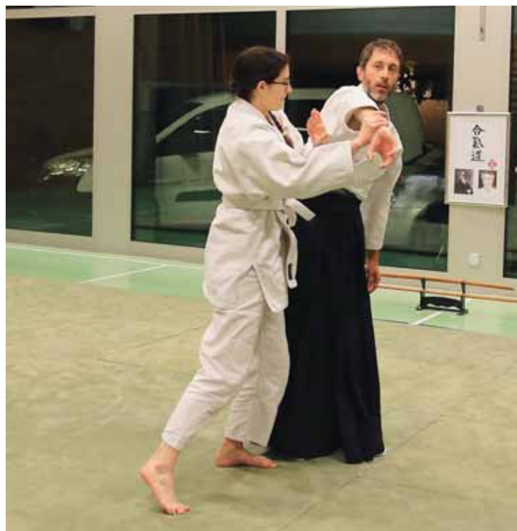
L'aïkido est un art martial qui prône la non-violence. REMO

Informations et horaires: www.aikidoclubvalais.ch