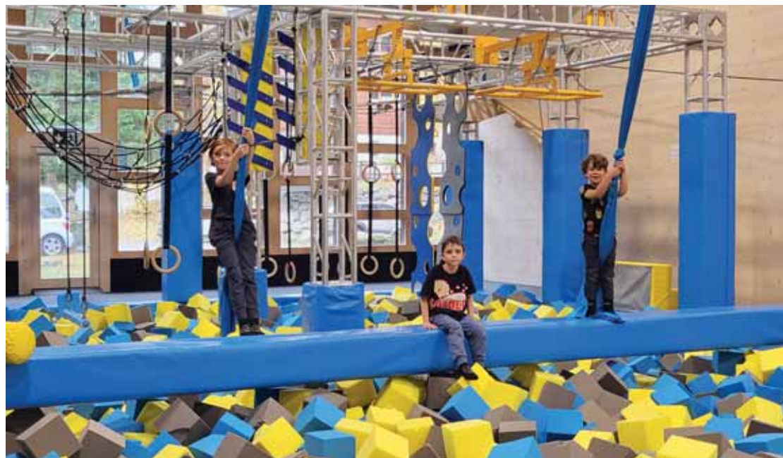
Cet espace, dédié au jeu du sol au plafond, permet aux enfants de s'éclater en toute sécurité. LEJDS

Après une étude de marché, c'est l'idée de créer un parc de loisirs intérieur qui l'a emporté. Une telle infrastructure faisait défaut dans la région. Elle allait ainsi diversifier l'offre touristique en apportant quelque chose de plus, surtout pour les journées de mauvais temps. Les créateurs du centre se sont constitués en société