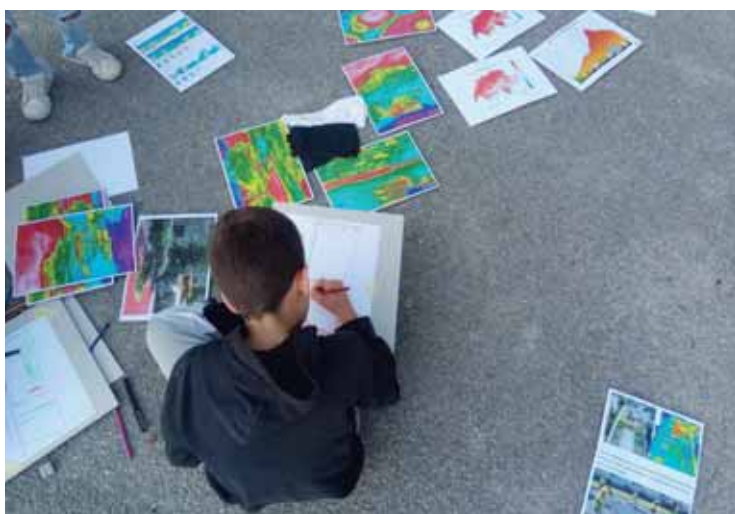
Les enfants ont participé à l'aménagement de la place en analysant d'abord, grâce à une caméra thermique, les températures.