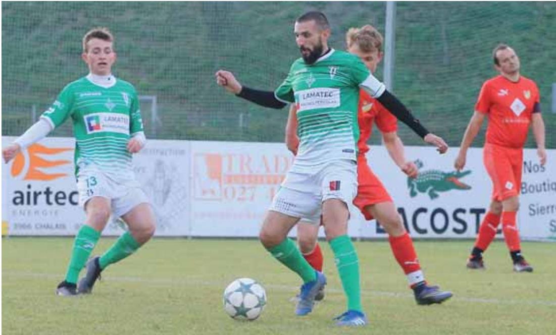
Le FC Chippis est invaincu cette saison en 3e ligue, avec neuf succès pour un match nul. REMO

CLUB DE SIERRE Après sept ans d'activité, il compte de plus en plus de membres. Et la pandémie n'y a rien changé.