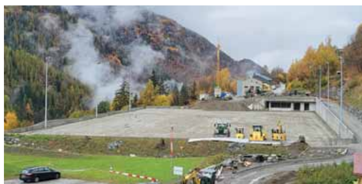
Vue du terrain de football de Vissoie depuis la patinoire.