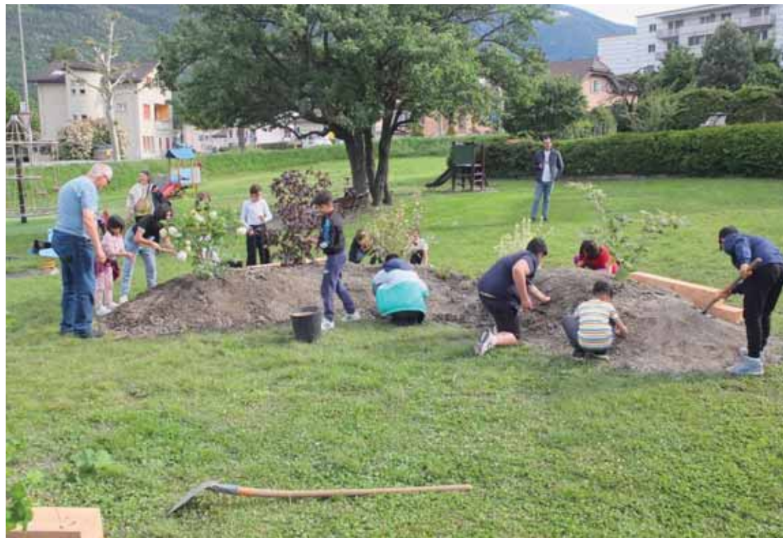
Le terrain Orzival s'est transformé pour devenir un lieu de rencontre et de détente, mais aussi un espace de sensibilisation au réchauffement climatique et à la problématique des îlots de chaleur. DR

L'objectif de cette entreprise est avant tout la sensibilisation des enfants et des adultes dans des espaces végétaux dédiés. «La place d'Orzival présente un intérêt particulier pour la problématique des îlots de chaleur, car il y a ce contraste entre le goudron et l'herbe», assure la cheffe de projet. «La mise en place des différentes structures s'est faite en trois étapes avec trois zones distinctes. En premier, trois îlots de fraîcheur ont été installés avec la collaboration du paysagiste Nicolas Fontaine ainsi que d'une classe de l'école de Borzuat et des résidents du quartier. Plusieurs arbres et arbustes ont été plantés. La deuxième partie consistait en la construction du «nid», un lieu de rencontre creusé dans le sol où l'on peut s'asseoir et partager en groupe. Les enfants du