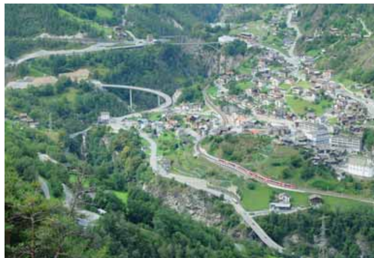
Les cinq ponts routiers de Stalden! JEAN-LOUIS PITTELOU

Le sentier en forêt clairsemée est plein de charme et offre plusieurs bancs et autant de points de vue sur Stalden et ses ponts. Les ponts enjambent élégamment la Vispa et font la fierté du village. Le premier pont, le célèbre Chibrigga,