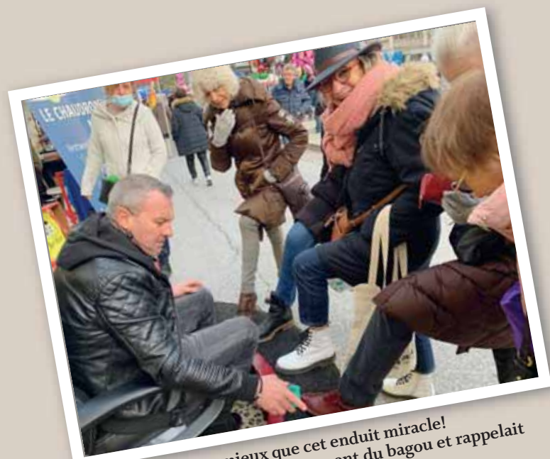
Pour les cuirs, pas mieux que cet enduit miracle! Le marchand avait particulièrement du bagou et rappelait «l'ancien temps». LE JDS