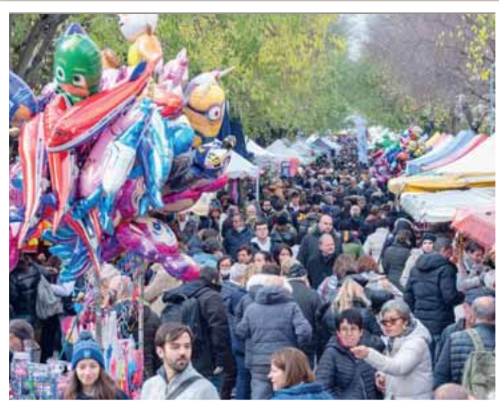
La foule était au rendez-vous avec près de 9000 personnes le lundi à l'avenue Général-Guisan.