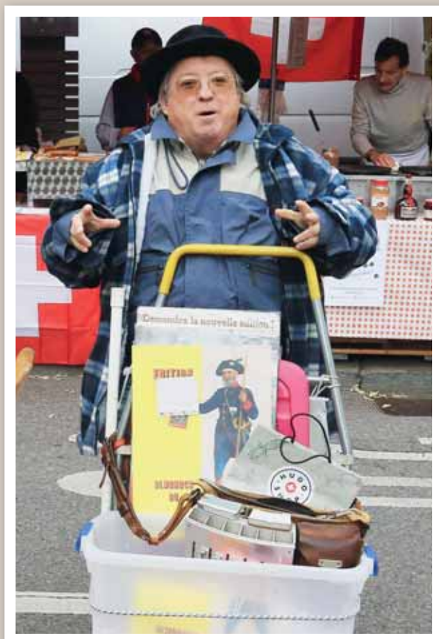
Pas de Foire Sainte-Catherine sans l'almanach du Messenger boîteux! REMO