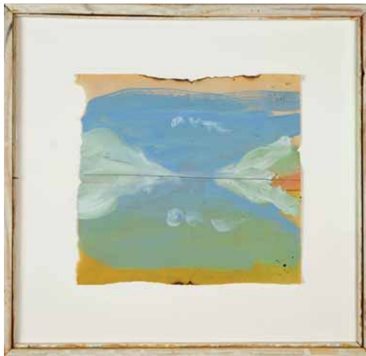
«Paysage intérieur», huile et crayon sur papier, 2021.