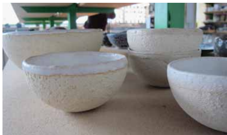
A côté des bols et sculptures d'Anne-Chantal Pitteloud, d'autres sculptures en bois, des dessins et des peintures. LE JDS

Ouvert toutes les après-midi de 14 h à 19 h. Vernissage le 3 décembre dès 17 h, finissage le 12 décembre dès 17 h. Rue des Iles Falcon 27. Ouvert à tous avec masque.