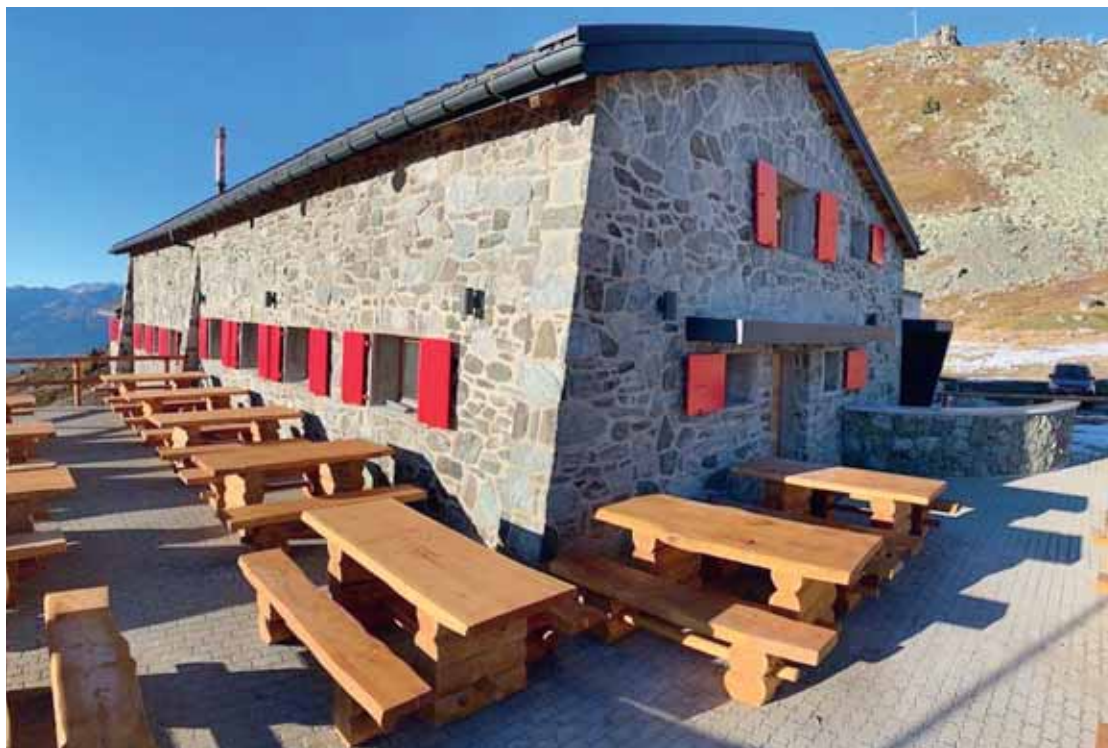
L'espace extérieur de la cabane de la Bella-Tola a également été réaménagé. Un bar permettra aux skieurs de se restaurer plus facilement.

A première vue, cette bâtisse a gardé son aspect original avec ses murs en pierres et ses volets rouges. Mais à y regarder de plus près, de gros travaux ont été réalisés. Le budget du chantier s'élève à 2,1 millions de francs, financés par un emprunt bancaire et un crédit LPR pour 1,2 million de francs. Des aides à fonds perdu ont également été octroyées par l'Aide à la montagne (150 000 francs), la Loterie romande (200 000 francs), le Fonds du sport (40 000 francs), et la Rénovation énergétique (60 000 francs). Une demande de subvention a été adressée au Conseil général de Sierre (150 000 francs) et à la bourgeoisie (10 000 francs). Le reste du financement s'effectuera sous forme de sponsoring et de dons. Lors du démontage, qui a été réalisé à hau-