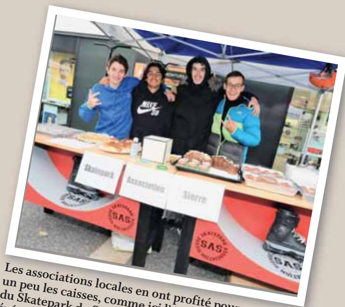
Les associations locales en ont profité pour remplir un peu les caisses, comme ici l'association du Skatepark de Sierre qui aimerait monter quelques événements grâce à sa petite collecte. REMO