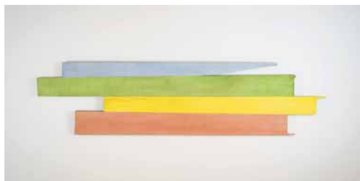
«L'échelle du paradis, Scala Clausalium», tempera sur bois, 2021.

Galerie Grande-Fontaine, jusqu'au 17 décembre. Mercredi-jeudi de 14 h 30 à 18 h 30. Vendredi de 10 h à 12 h et de 14 h 30 à 18 h 30 et samedi de 14 h 30 à 17 h.