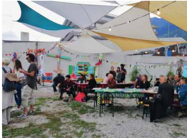
La place du Séquoia inaugurée en septembre dernier sera un parfait écrin pour accueillir ce premier marché gratuit.

On y trouvera certainement toutes sortes d'objets, ce dont les gens veulent se séparer, des vête-