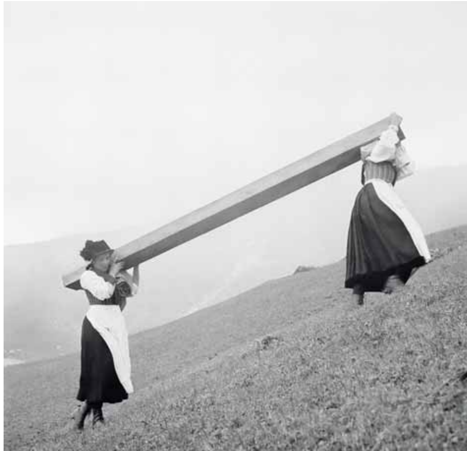
© TRANSPORT DU BOIS POUR LA MAISON DE HANS LEHNER, LAUCHERNALP, LÖTSCHENTAL, 1936, ALBERT NYFELER, MÉDIATHÈQUE VALAIS - MARTIGNY