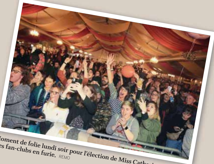
Moment de folie lundi soir pour l'élection de Miss Catherinette. Des fan-clubs en furie. REMO