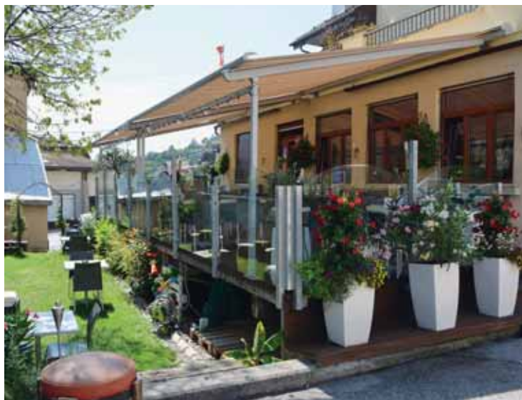
La terrasse du café-restaurant des Voyageurs à Noës a remporté le premier prix catégorie petite terrasse.

La baisse du chiffre d'affaires constatée partout et le manque de clients le soir inquiètent le président. «Certains restaurateurs m'ont dit clairement – et pas des petits – que s'ils devaient fermer, ce serait le coup d'assomoir et qu'ils ne rouvriraient certainement pas!» IBL