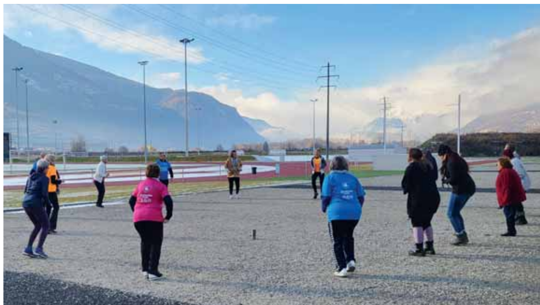
Samedi, le groupe En Forme pour ma Santé a participé à un minicours de zumba. Quant au groupe Je Cours pour ma Forme, il a effectué un parcours de cinq kilomètres. LEJDS

deux fois 30 personnes, pendant une heure hebdomadaire. «Elles avaient comme point commun de ne plus faire de sport. Il a donc fallu partir tranquillement afin de ne