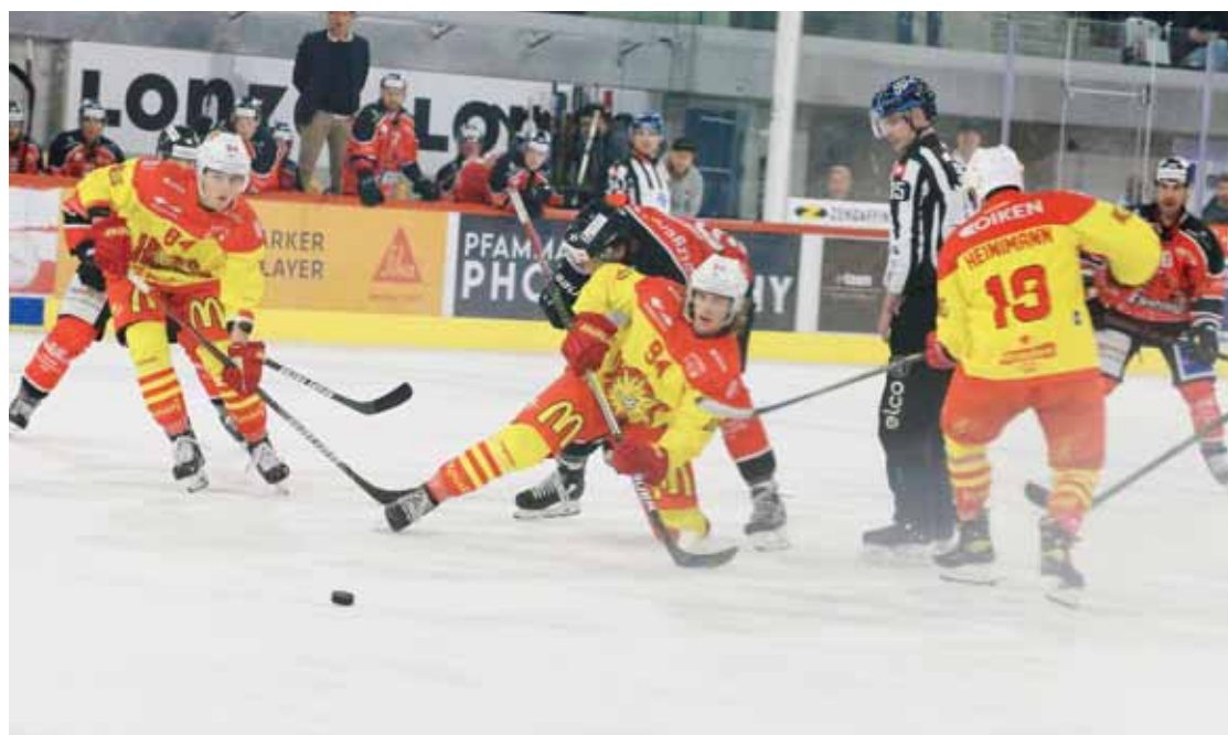
Le HC Sierre et le HC Viège se retrouveront ce soir à Graben pour y disputer le troisième derby valaisan de la saison. REMO

BILAN Les ligues inférieures sont en pause. Il est temps de revenir sur une demi-saison qui a pu se dérouler presque normalement.