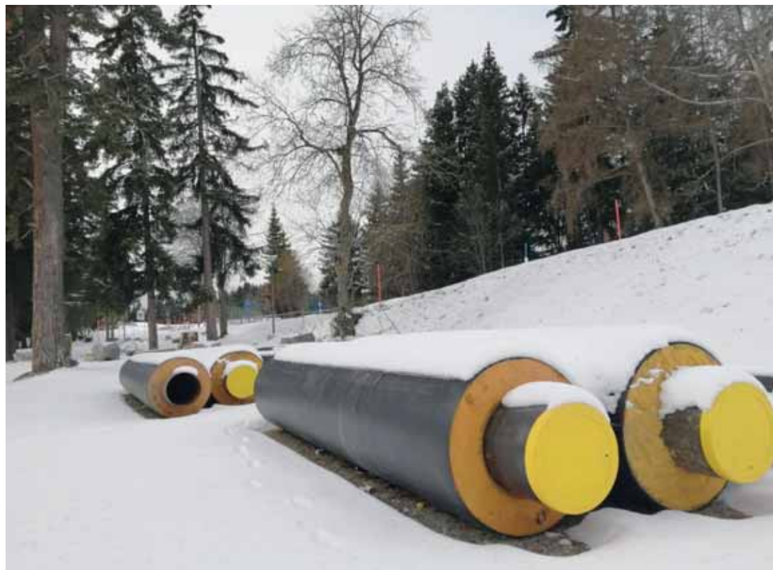
Des conduites de la colonne principale attendent d'être posées. Le réseau de distribution d'énergie est construit à 90% sur la commune de Crans-Montana.

Entre-temps, les travaux sur les routes d'accès se sont poursuivis. Le réseau principal de distri-