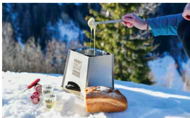
En Anniviers, le kit fondue s'adapte à toutes les situations sanitaires! ANNIVIERS TOURISME

www.etoilebellalui.ch - www.anniviers.ch